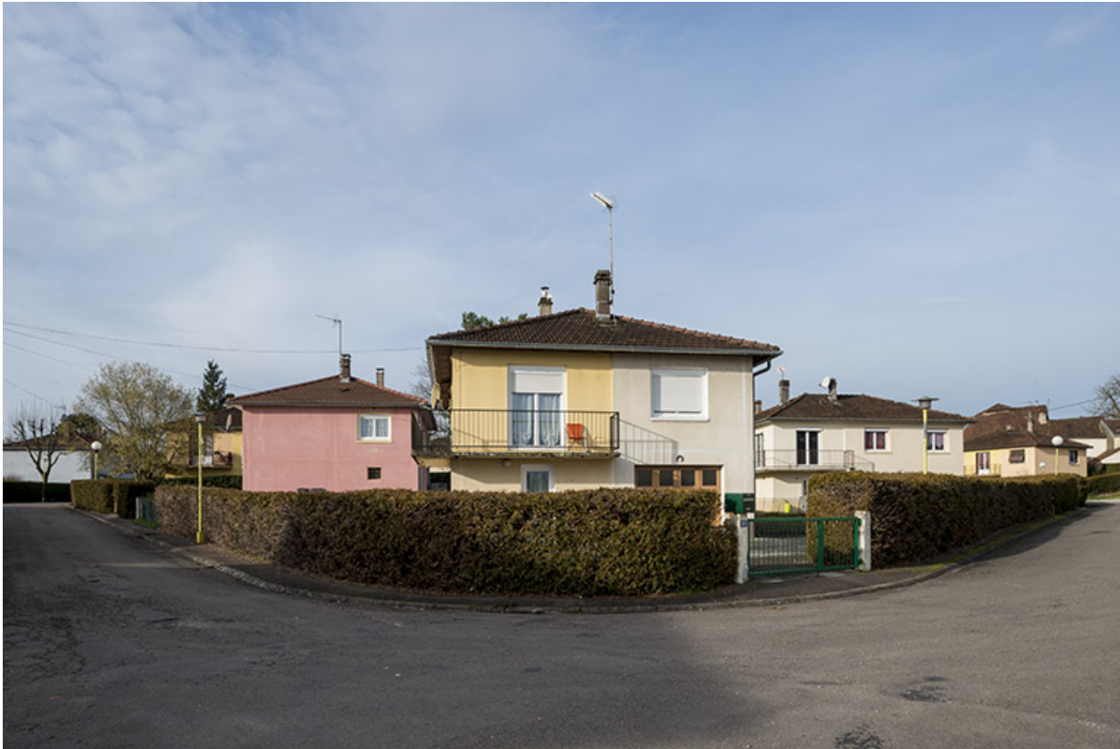
Lotissement, avenue du Plein Soleil. 70, Port-sur-Saône