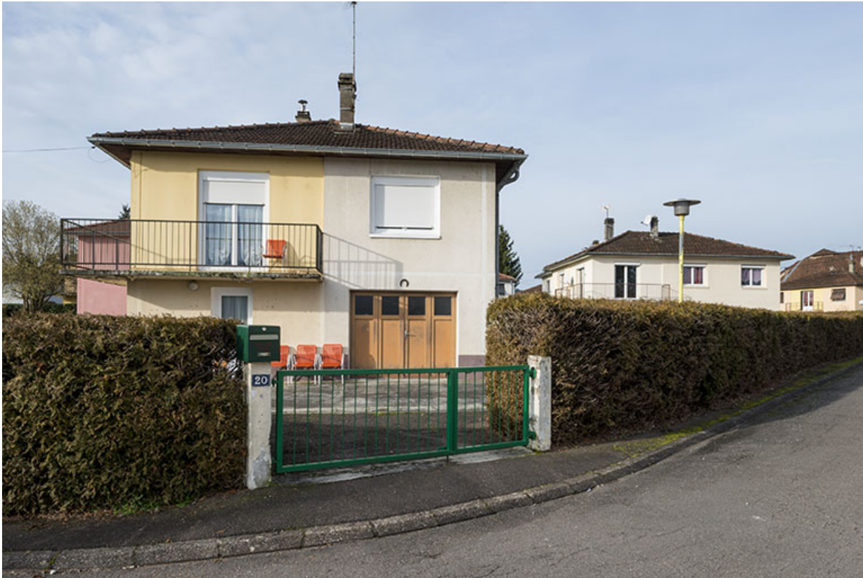
Façade antérieure d'une des maisons.