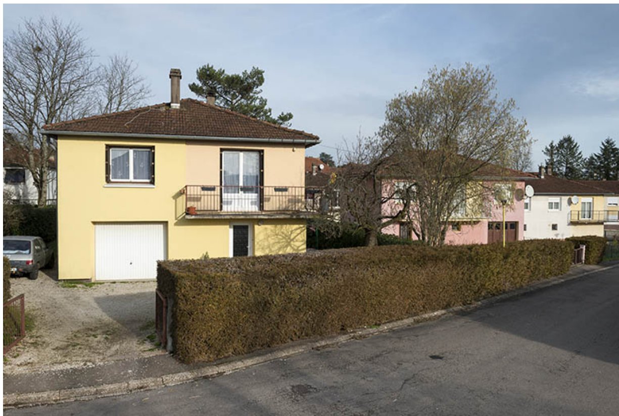
Maison avec balcon au niveau de l'étage carré. 70, Port-sur-Saône