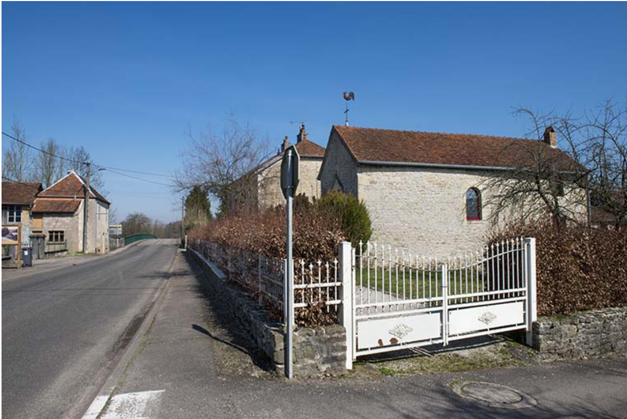
La rue principale.