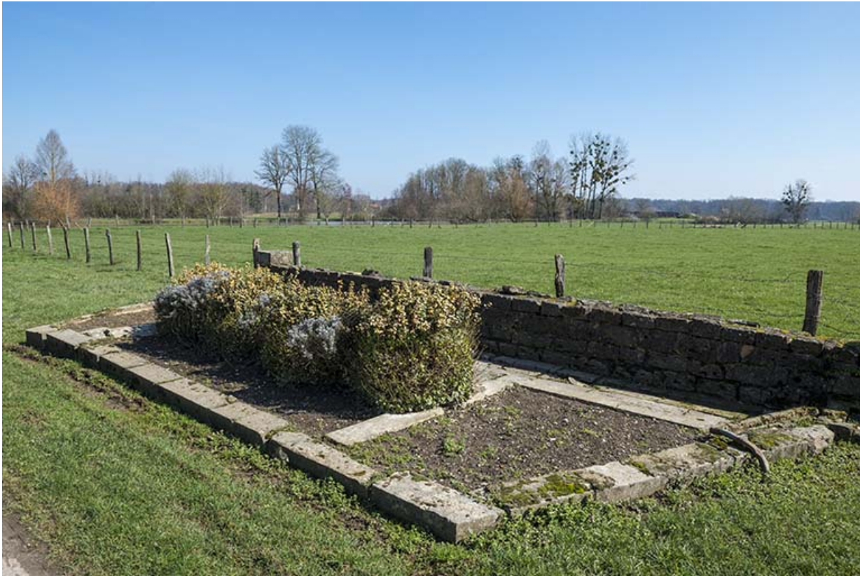
Fontaine, rue du Bac à Port d'Atelier.