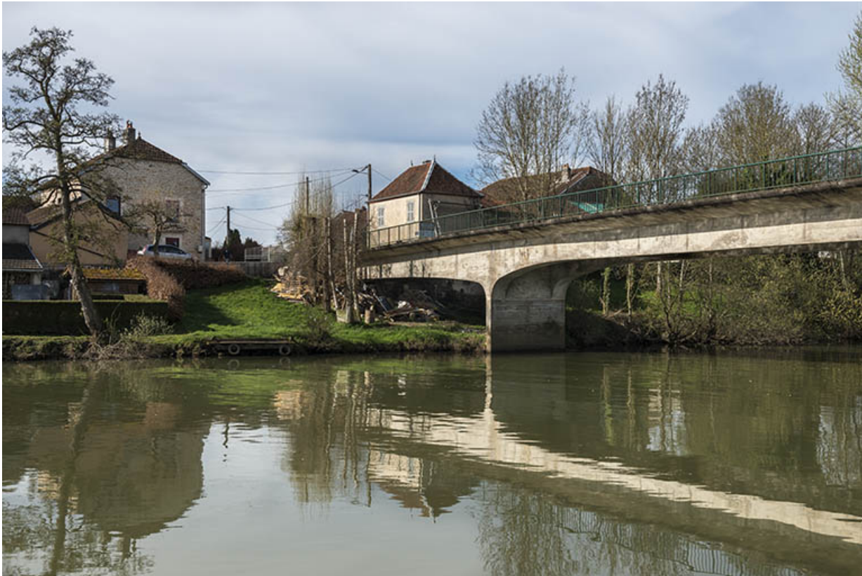
Le pont et le hameau en arrière-plan.