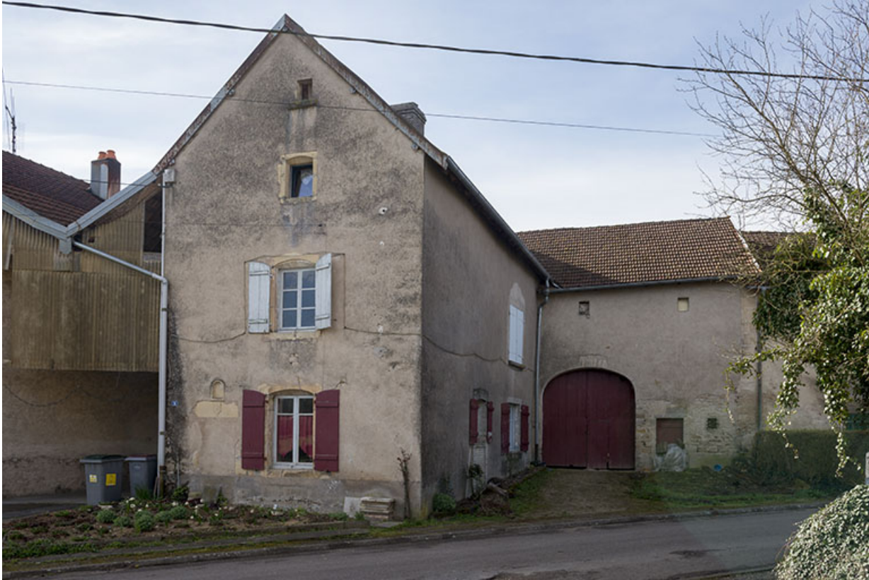
Ferme en équerre, rue du Bac.