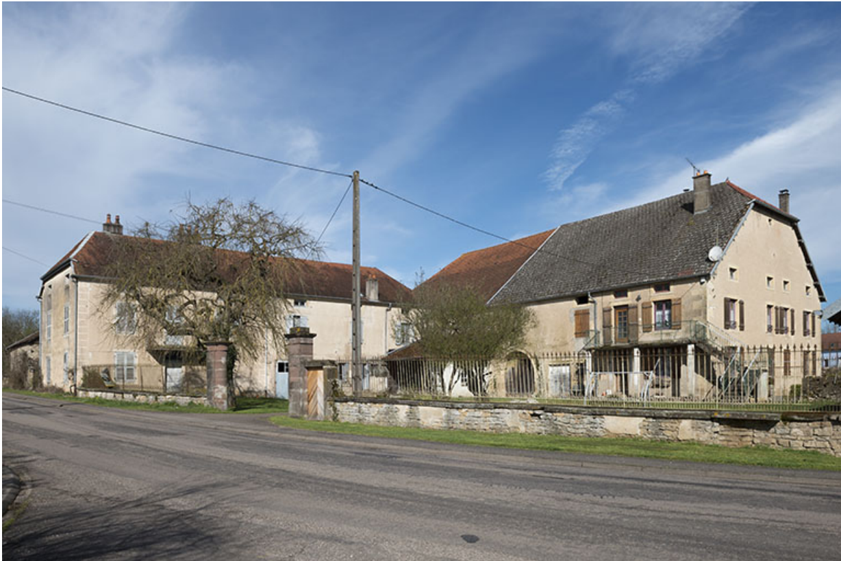
La maison Cardot, négociant au 19e siècle.