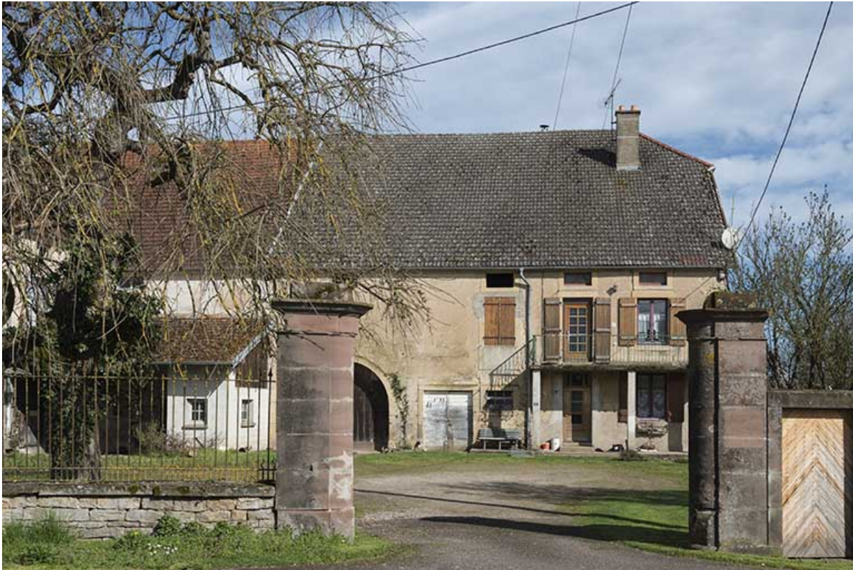
Les piliers du portail d'entrée et la maison en arrière-plan.