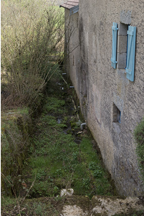
Bief de dérivation, moulin Guyot.