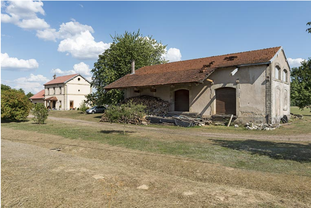
Vue générale du site de l'ancienne gare avec l'entrepôt commercial au premier plan.