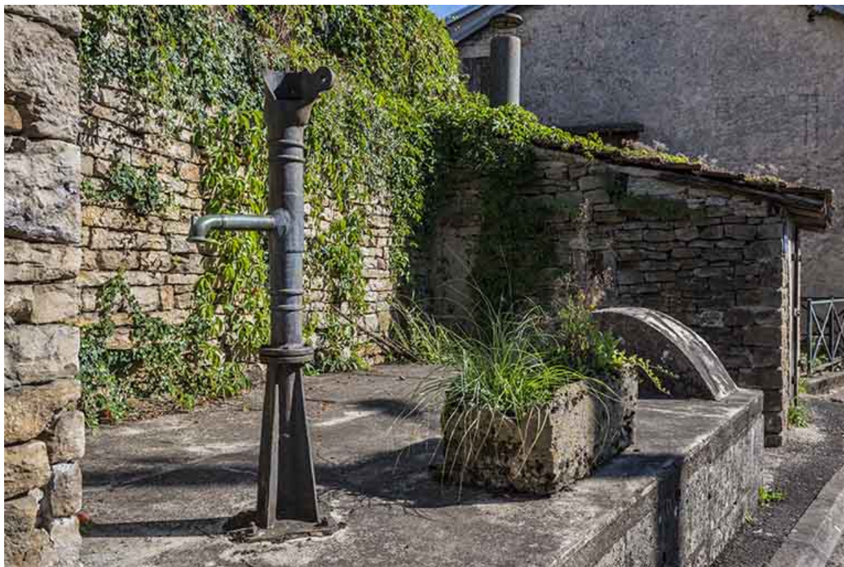
La pompe en fonte.