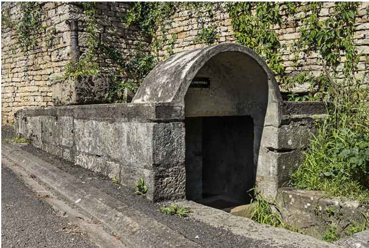
Vue sur l'entrée du puisard avec la couverture en béton armé.