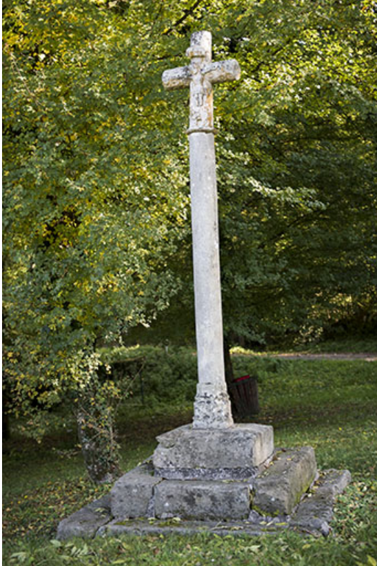
Croix située à la sortie du village en direction de Vauvillers. 70, Demangevelle