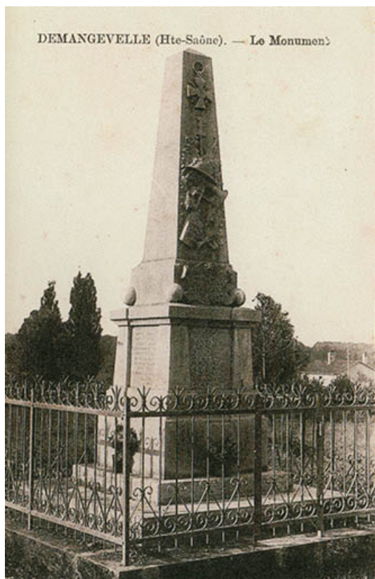
Demangevelle. Le monument. Carte postale. 70, Demangevelle