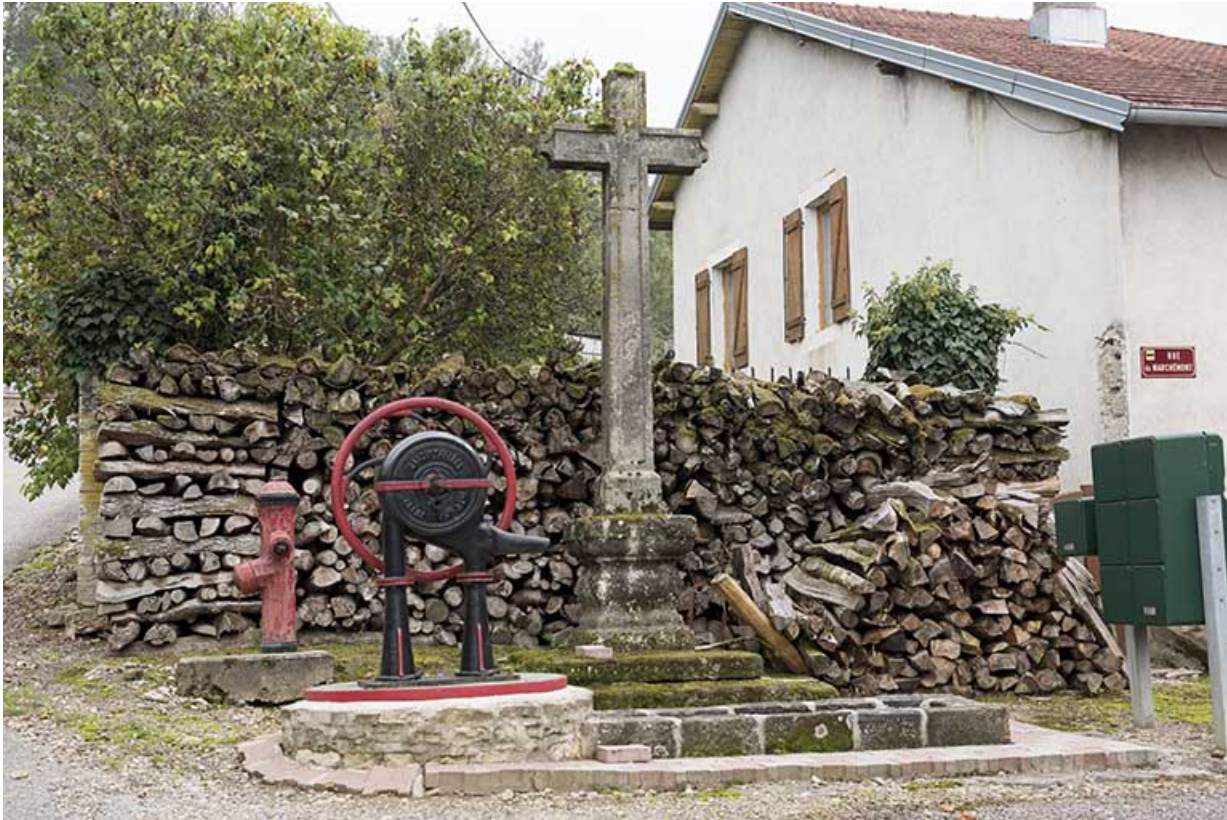
Croix érigée à l'angle du chemin du Marchemont et de la rue des Chenevières. 70, Demangevelle