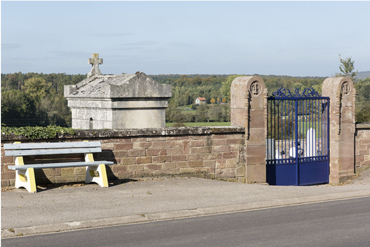
Entrée du cimetière.