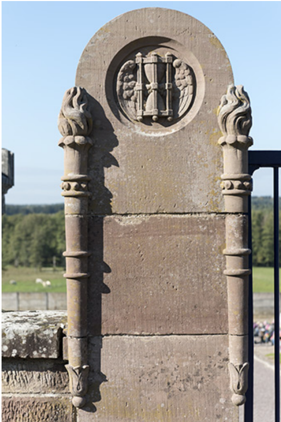
Détail du pilier gauche du portail d'entrée. 70, Demangevelle