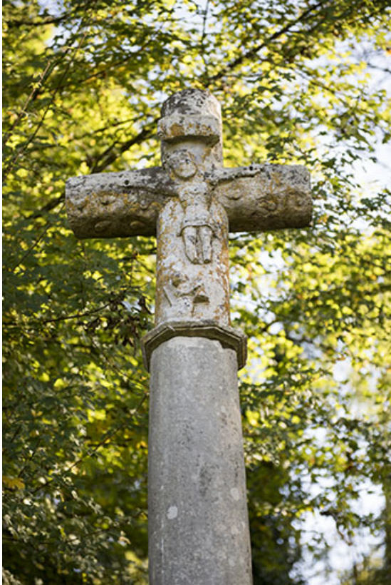
Vue rapprochée. 70, Demangevelle