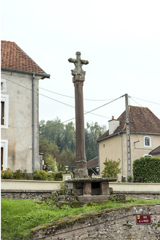
Croix érigée à l'angle de la rue de la poste et de la grande rue. 70, Demangevelle