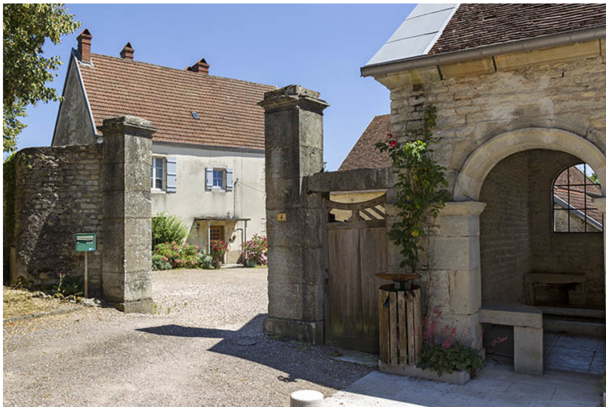
Vue générale depuis la place de l'Eglise.