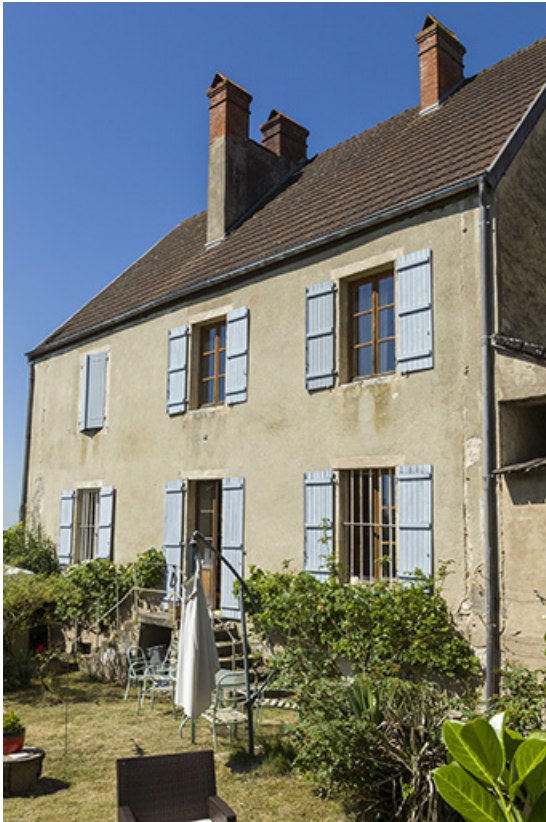
Façade postérieure du logis, côté jardin.