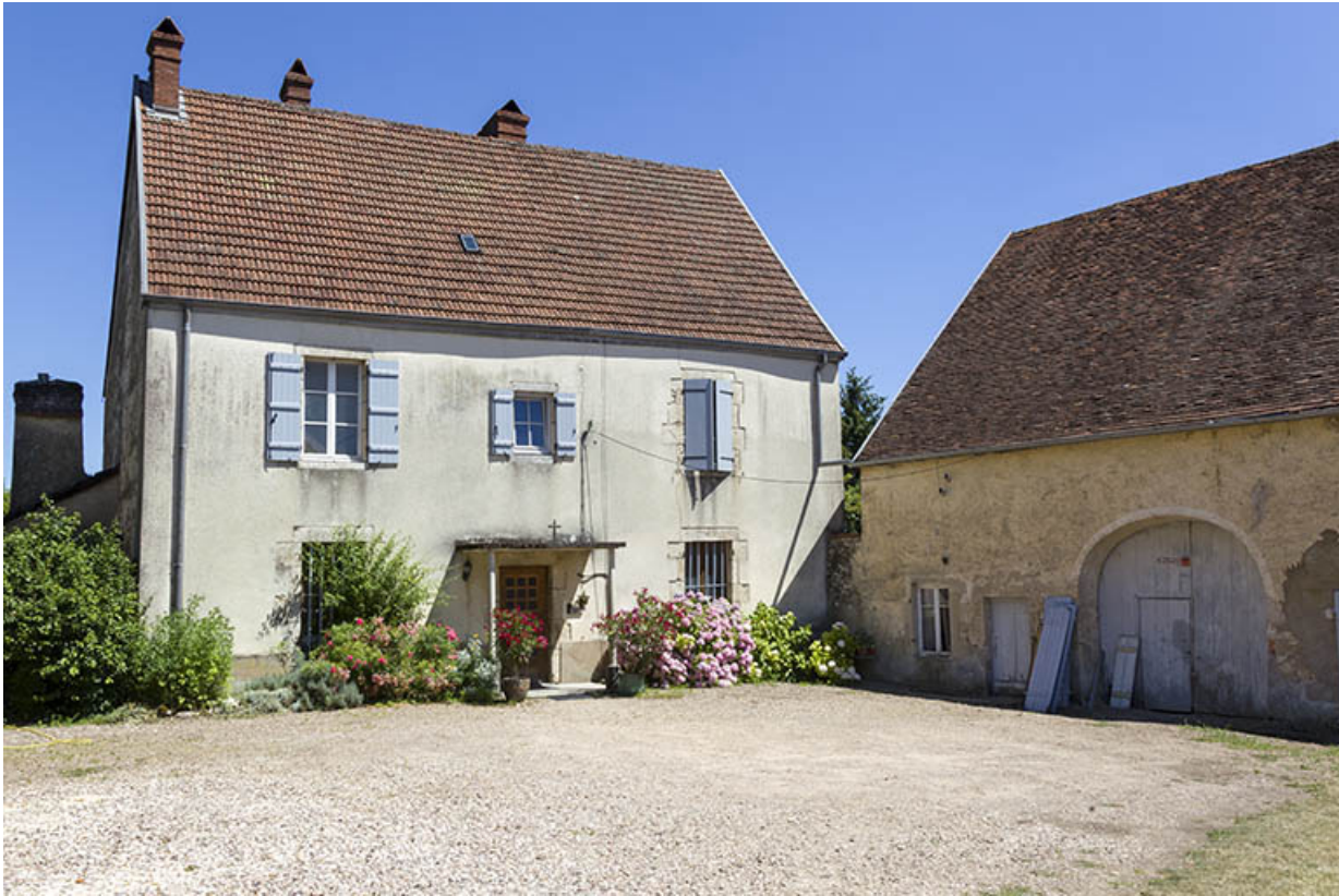
Vue d'ensemble depuis l'entrée.