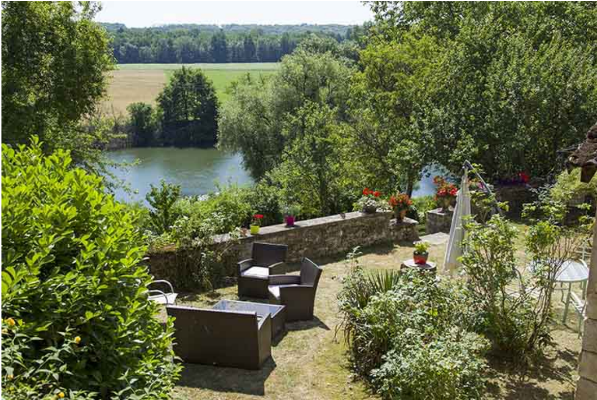
Le jardin en terrasse et la Saône.