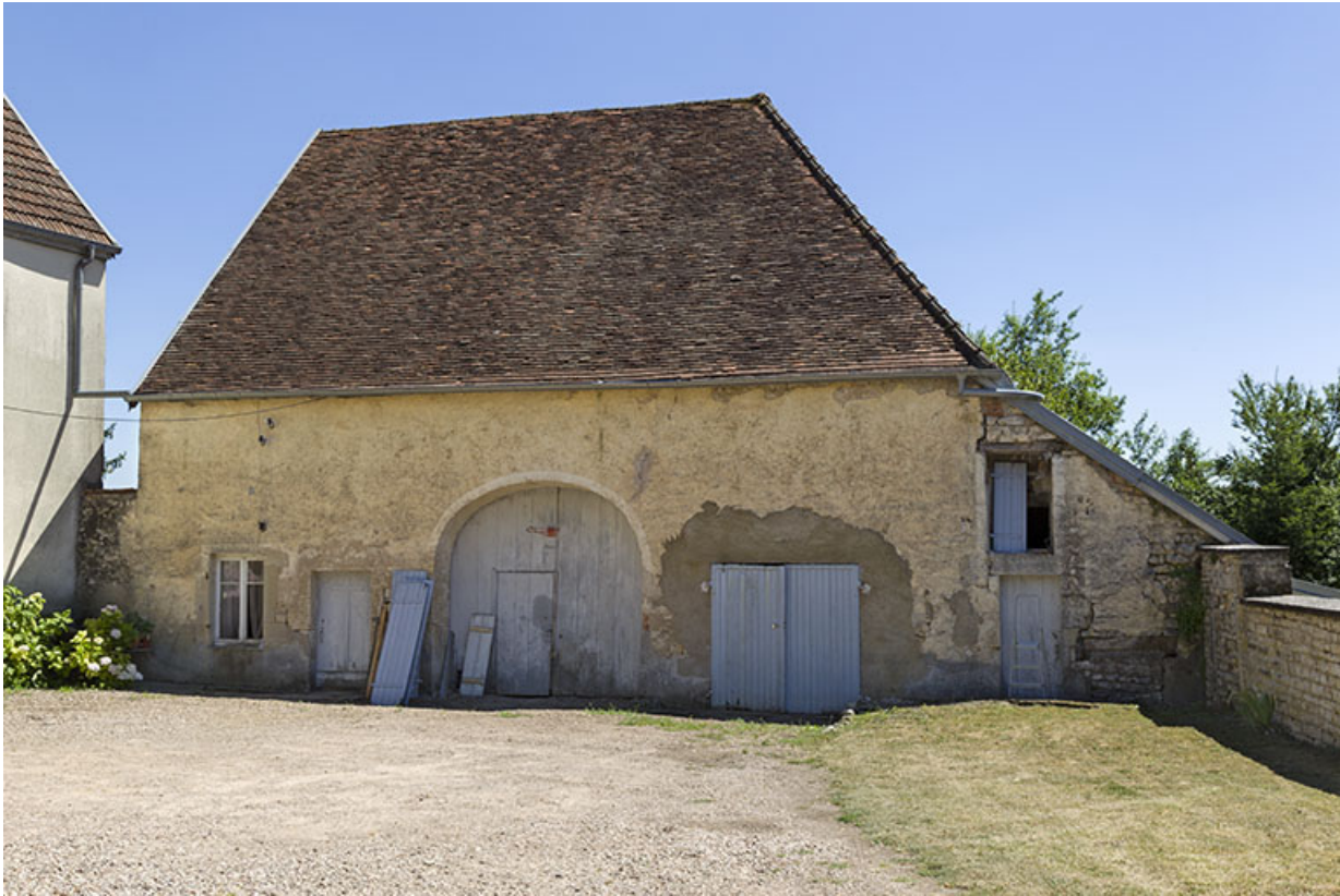
Vue générale du bâtiment agricole sur cour.