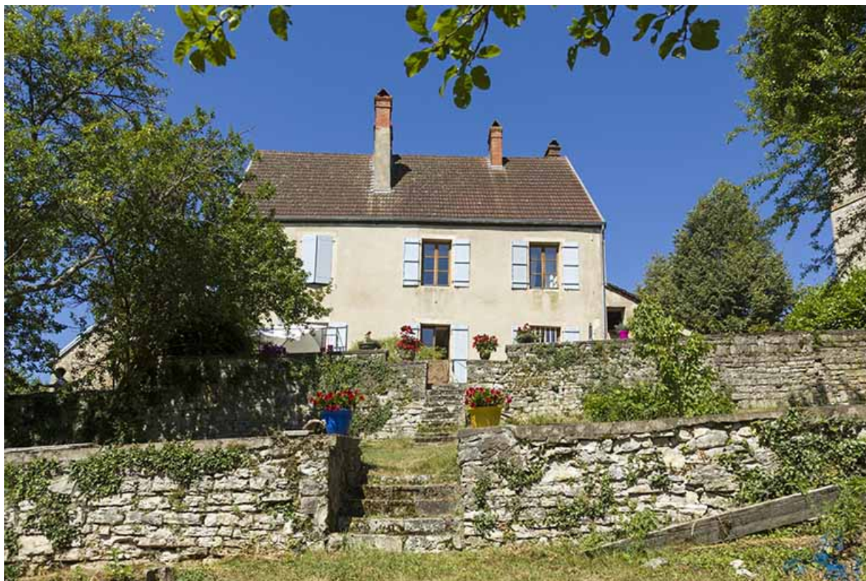
Le logis et le jardin en terrasse côté Saône.