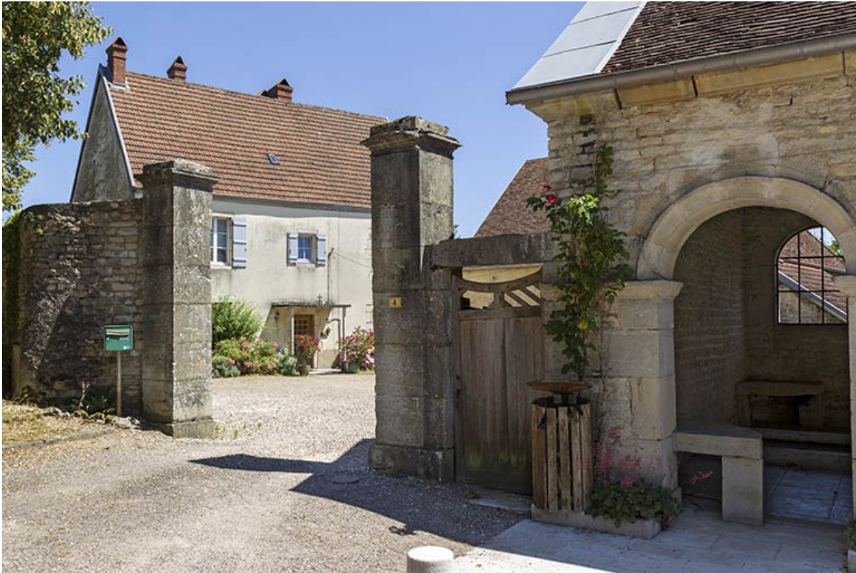
Vue générale depuis la place de l'Eglise.