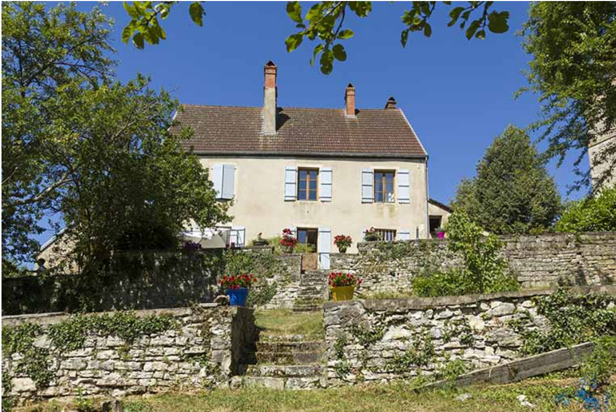
Le logis et le jardin en terrasse côté Saône.