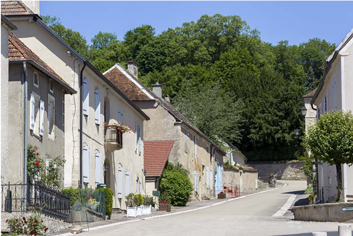
Vue partielle du haut de la rue du Château depuis la place Gabrielle de Salverte. 70, Ray-sur-Saône