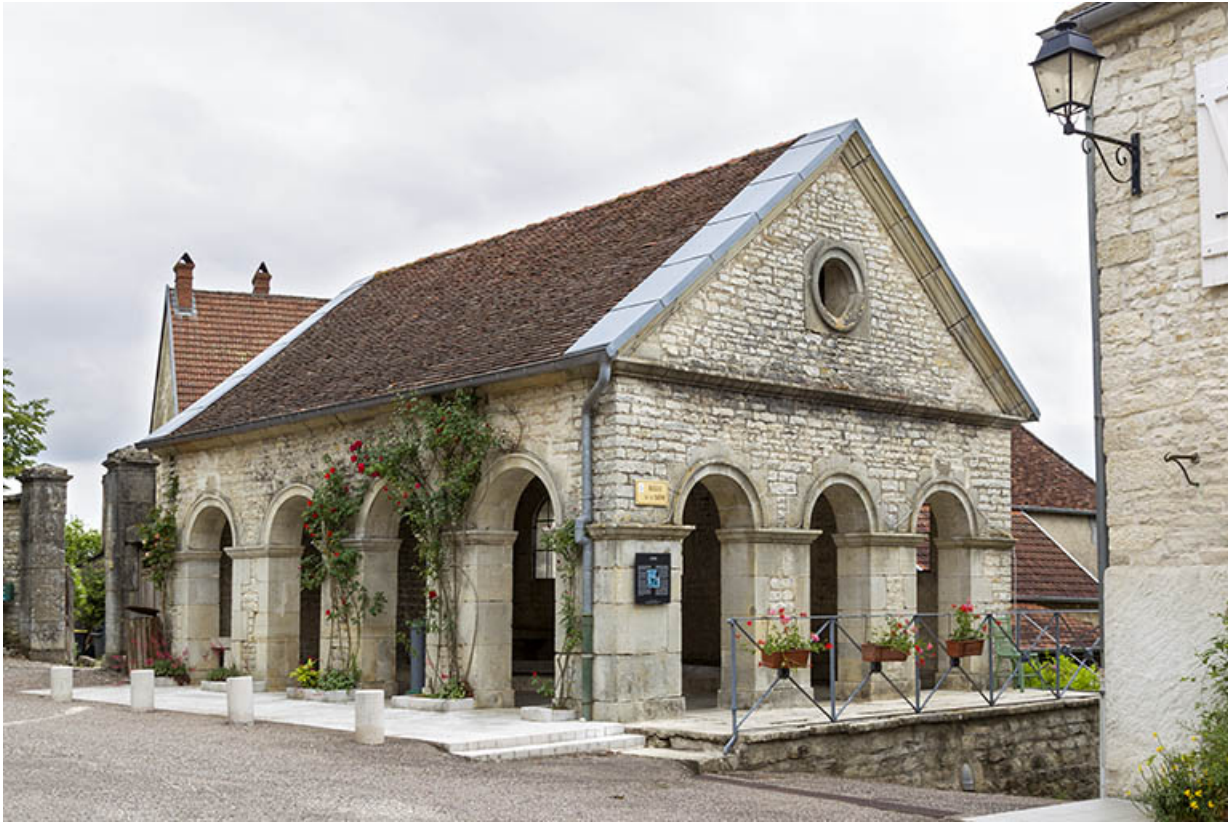
Vue depuis la place de l'église.