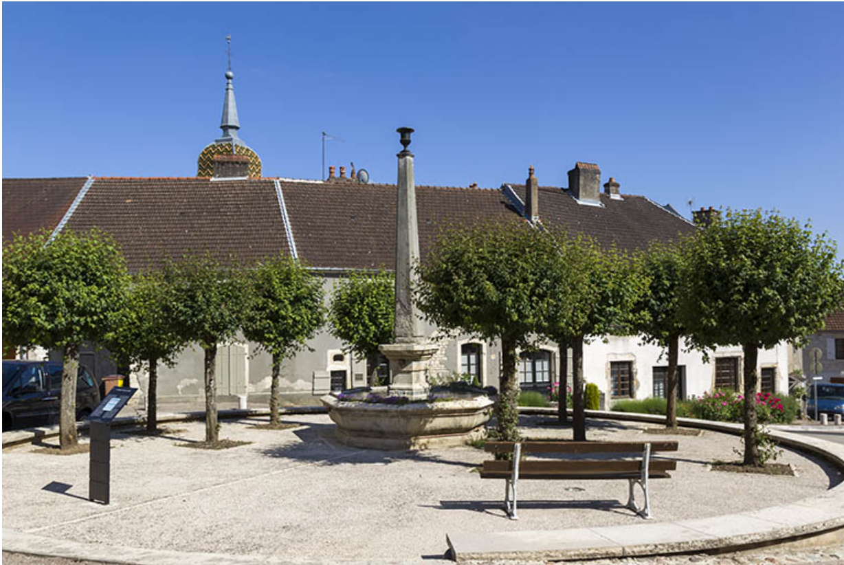
Vue de la fontaine et de la place Gabrielle de Salvete.

70, Ray-sur-Saône place Gabrielle de Salvete