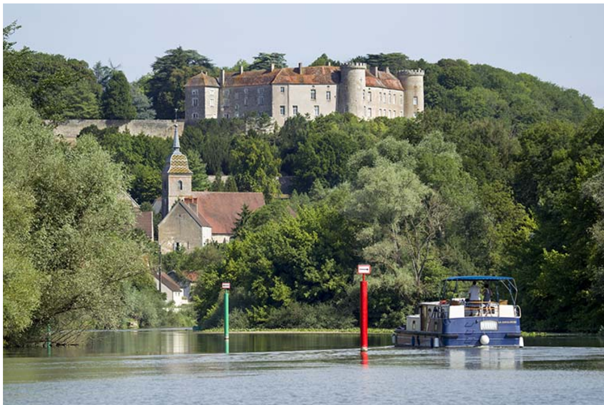
Vue du château surplombant l'église paroissiale Saint-Pancrace et la Saône. 70, Ray-sur-Saône