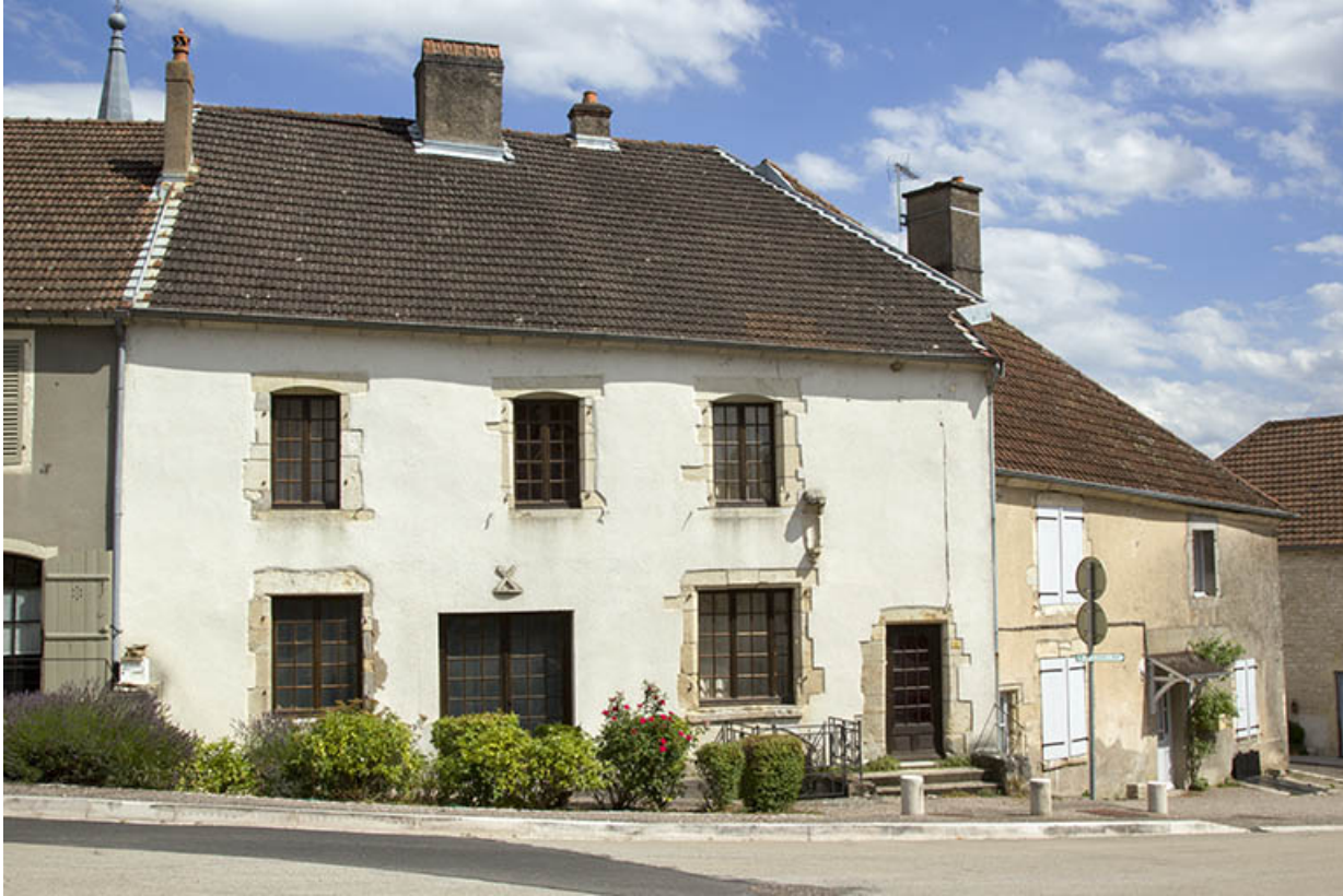
Maison 2 place Gabrielle de Salverte.