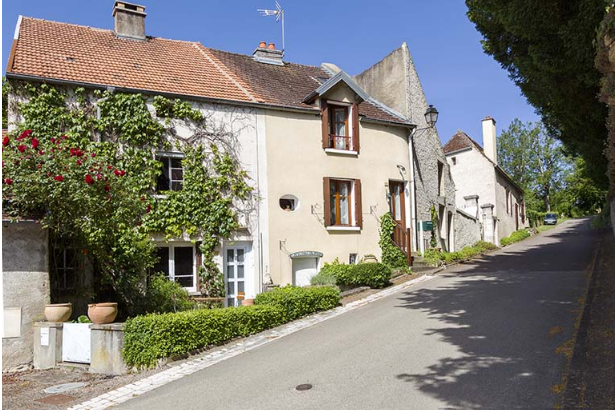
Maisons vigneronnes à l'extrémité de la rue du Château. Ces maisons se signalent par leur entrée de cave. 70, Ray-sur-Saône