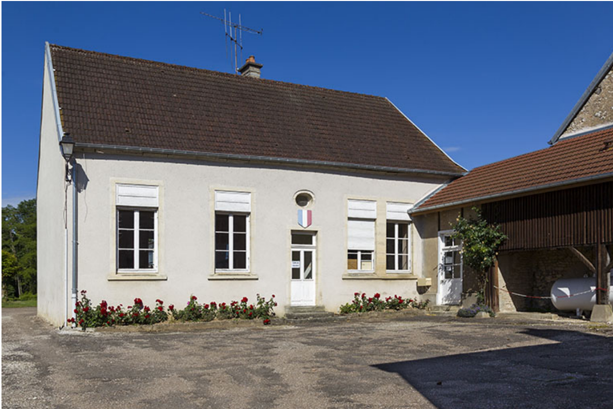
Ancienne école de garçons : façade antérieure, de trois quarts gauche. 70, Ray-sur-Saône