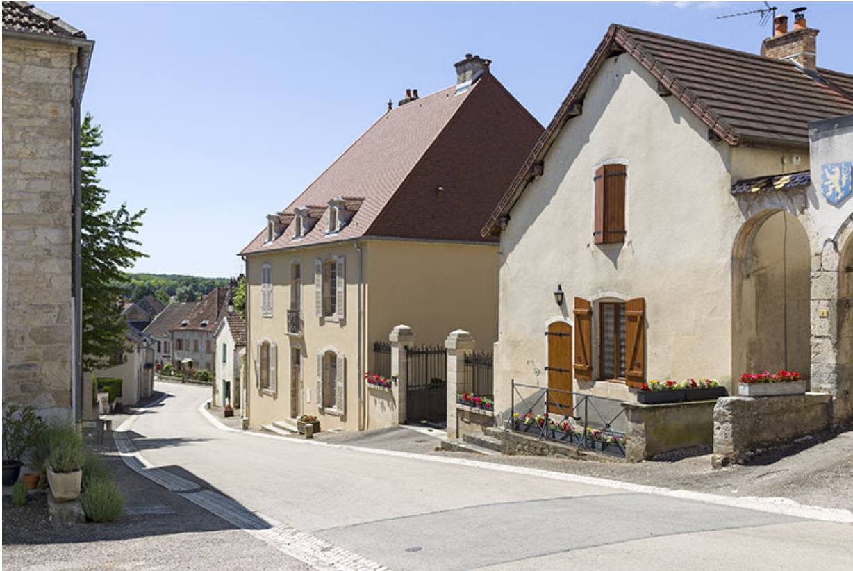
Vue partielle de la Grande Rue.