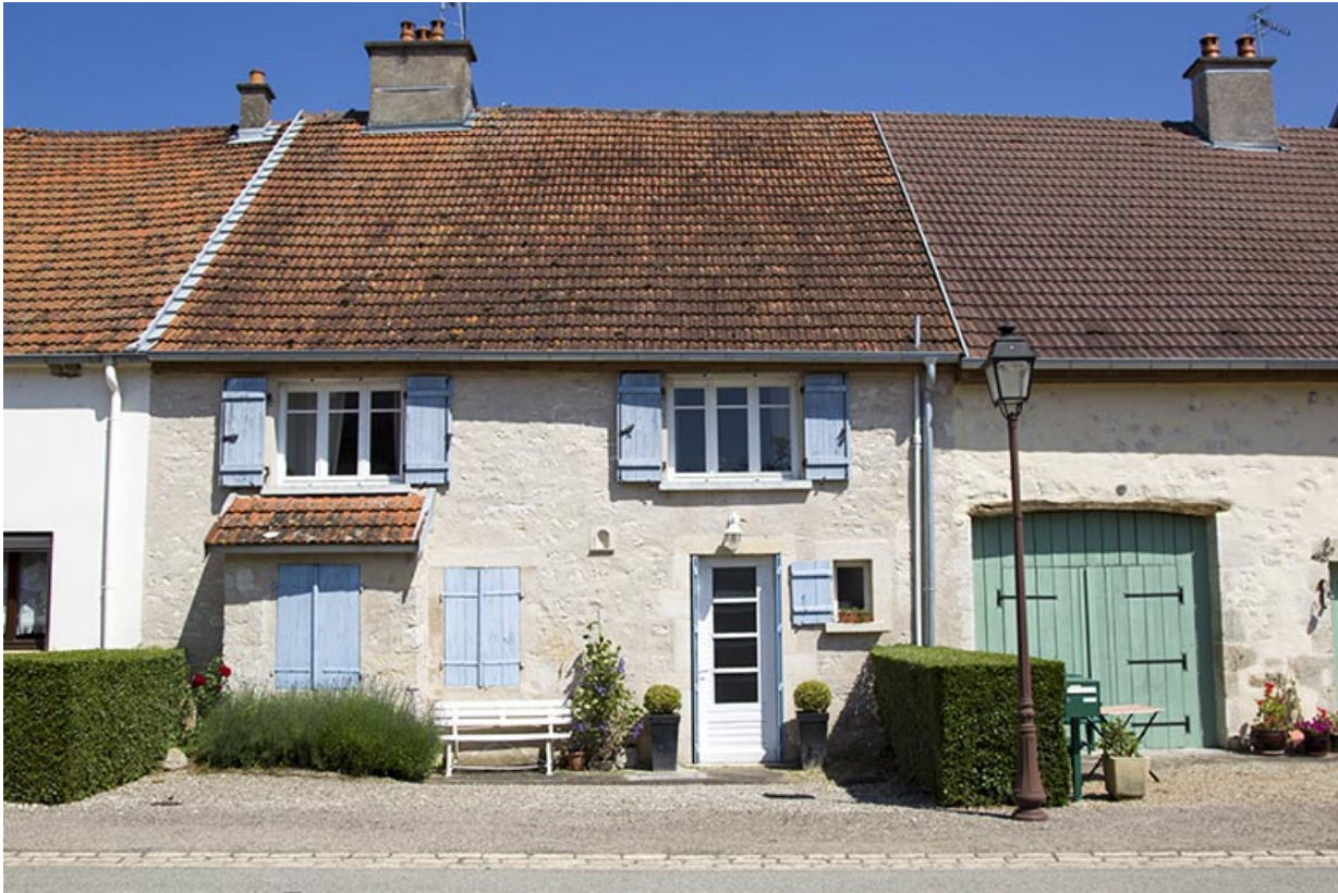
Maison au 43 Grande Rue.