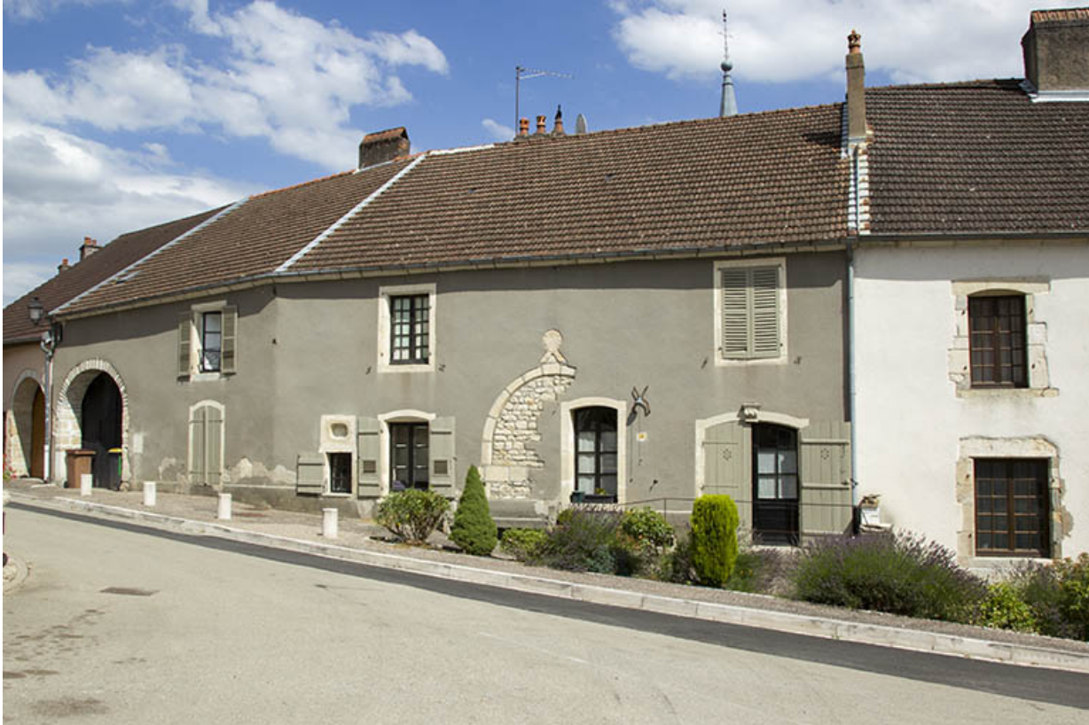
Maison 4 place Gabrielle de Salverte.