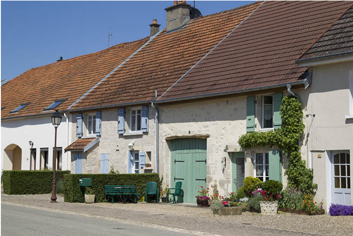
Exemple de fermes et maison situées "au bas du village", dans la Grande Rue. 70, Ray-sur-Saône