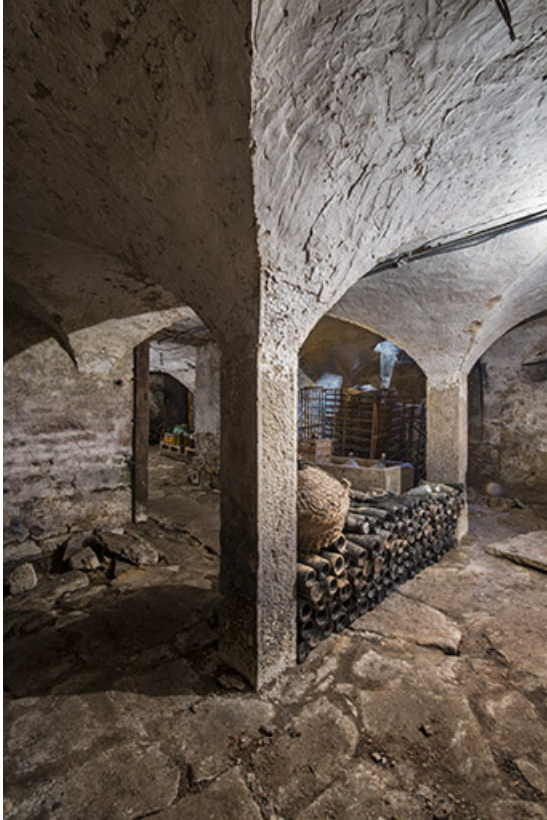
Détail d'une colonne supportant les voûtes. 70, Purgerot rue de la Fontaine carrée