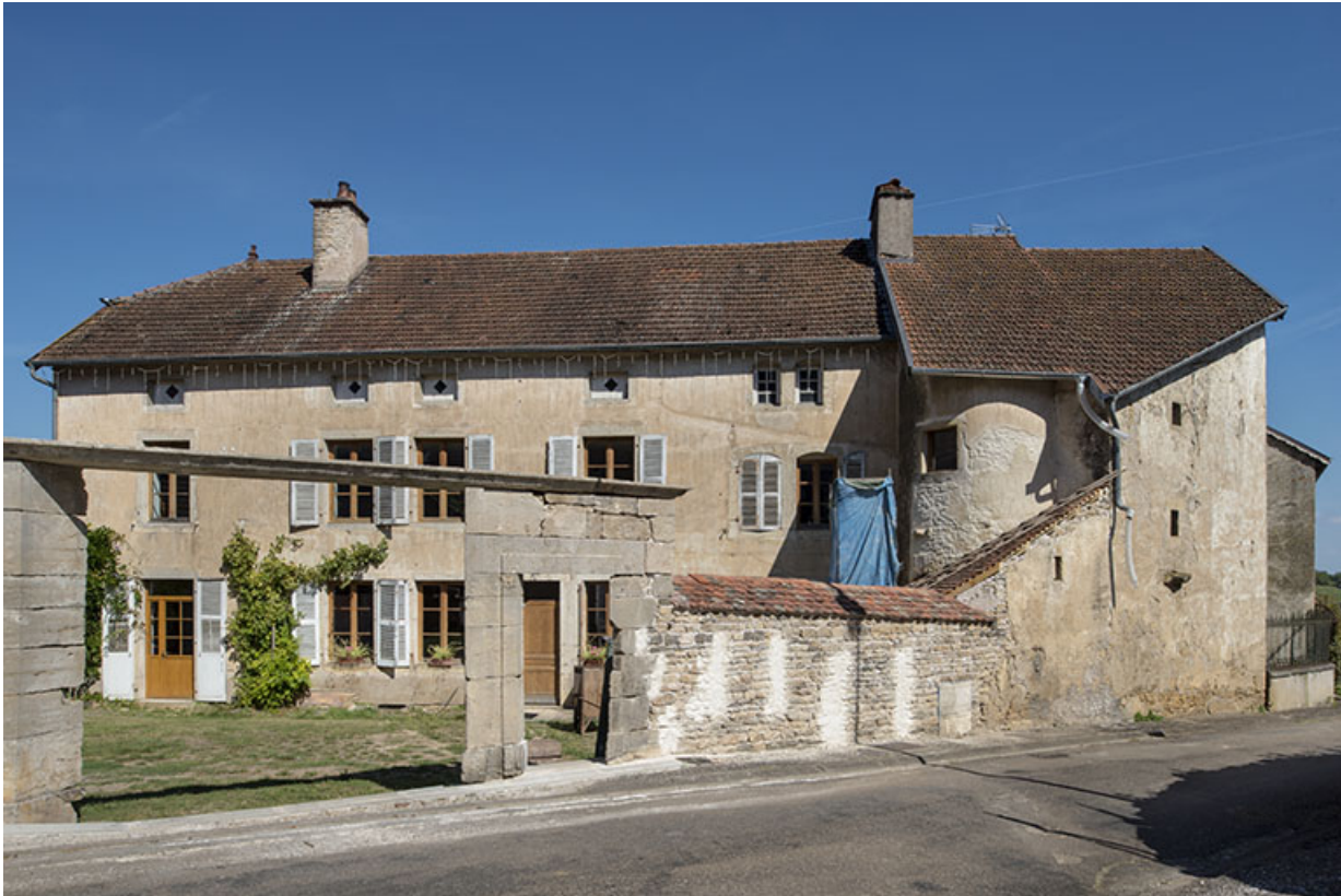
La façade antérieure depuis la rue.