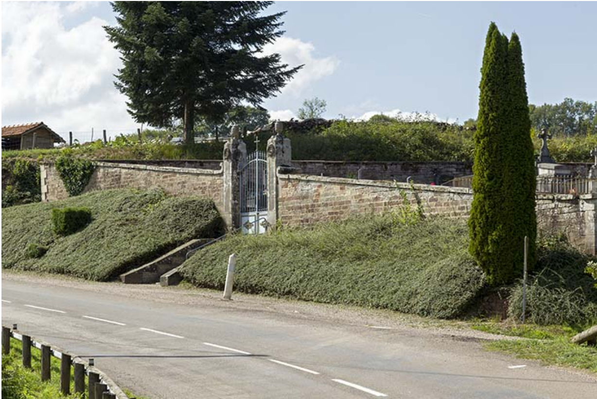
Le cimetière d'Ambiéwillers.