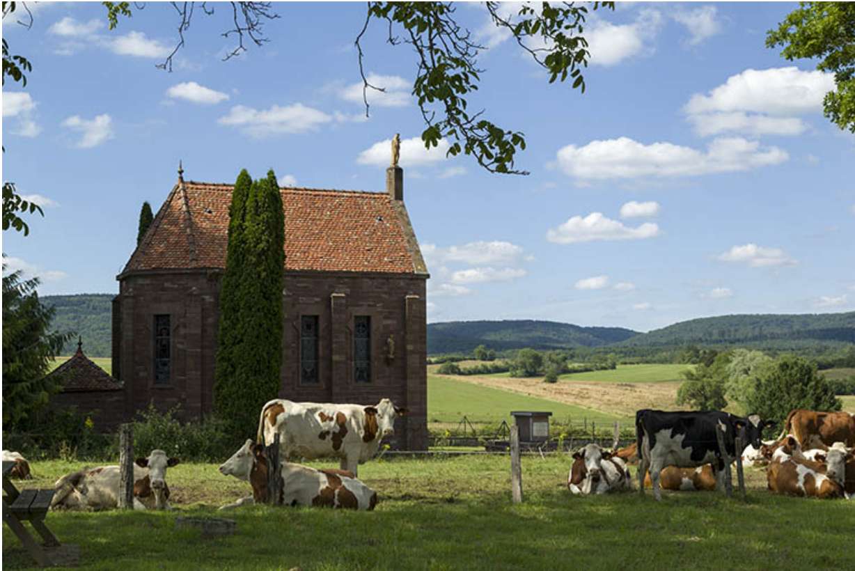
La chapelle des Martyrs.