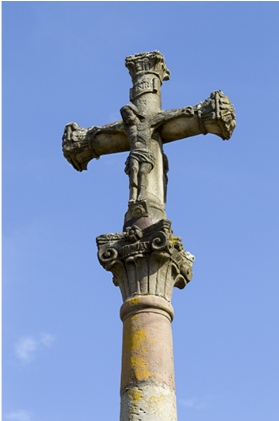
Détail de la croix.