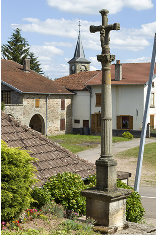
Croix au centre du village avec le clocher de l'église au second plan. 70, Ambiéwillers