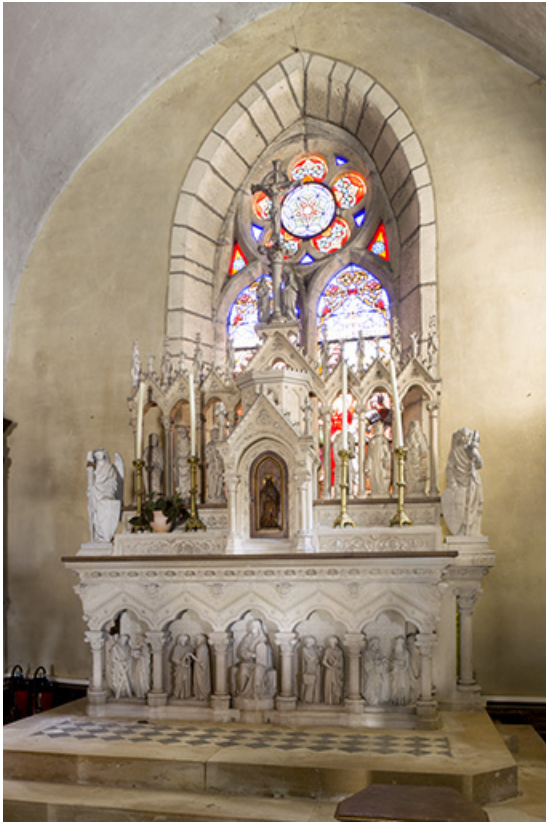
Le maître-autel et son vitrail.