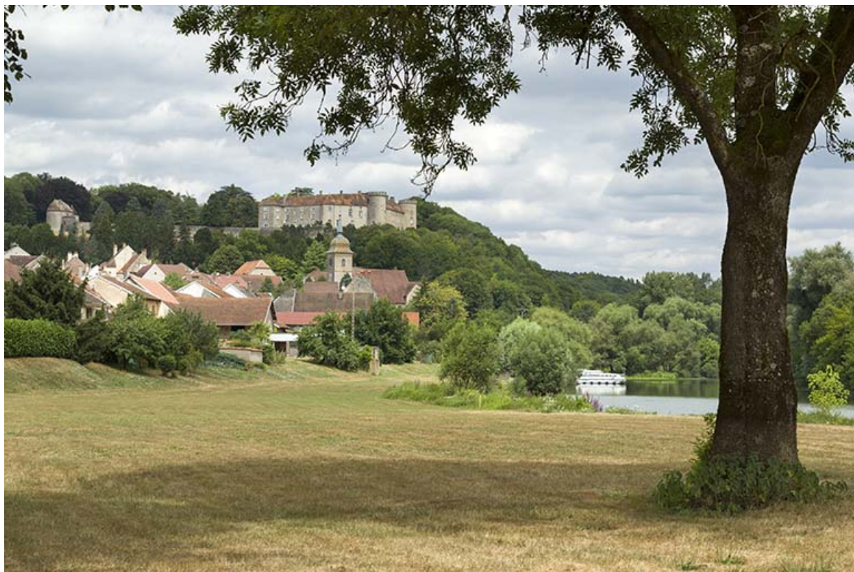
Vue générale depuis le sud-est.