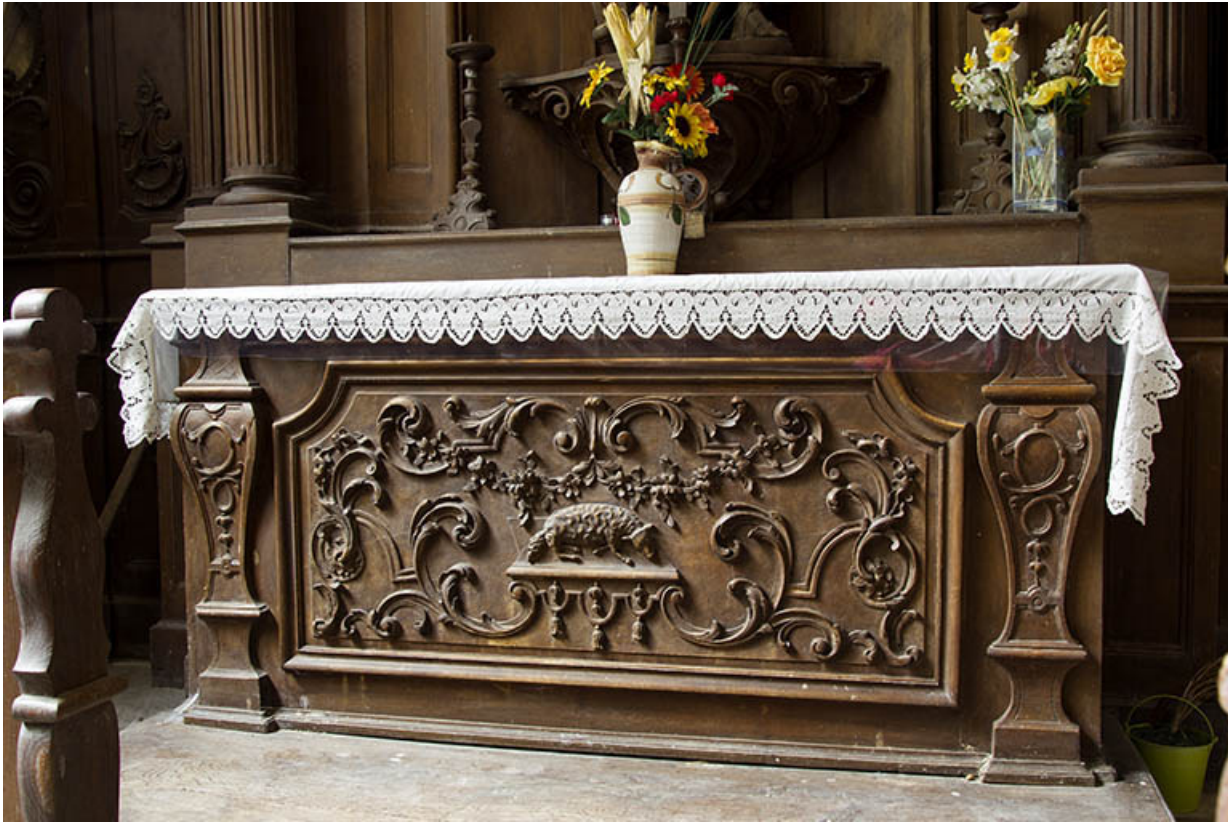
Chapelle seigneuriale : l'autel.