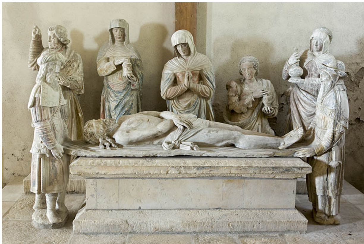
Groupe sculpté (dans la nef) : la Mise au tombeau, vue de face.