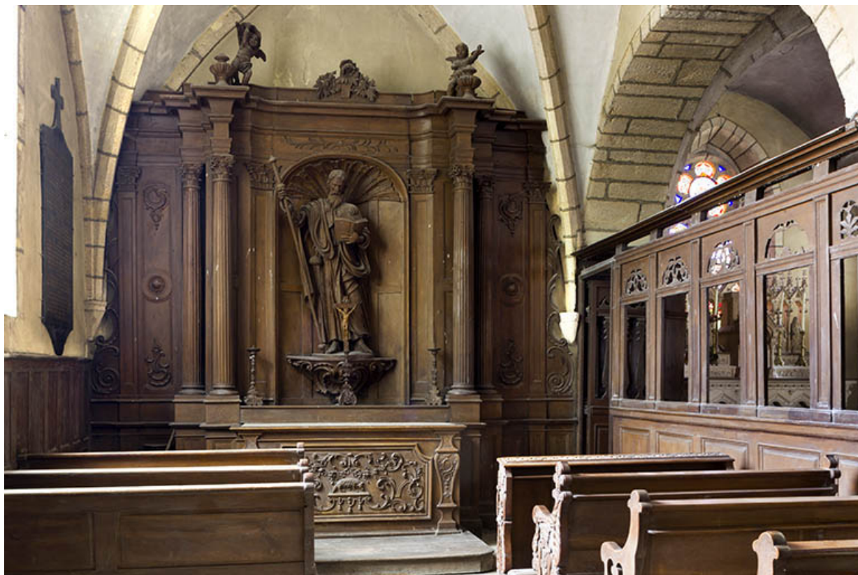
Chapelle seigneuriale : autel-retable et bancs de famille.