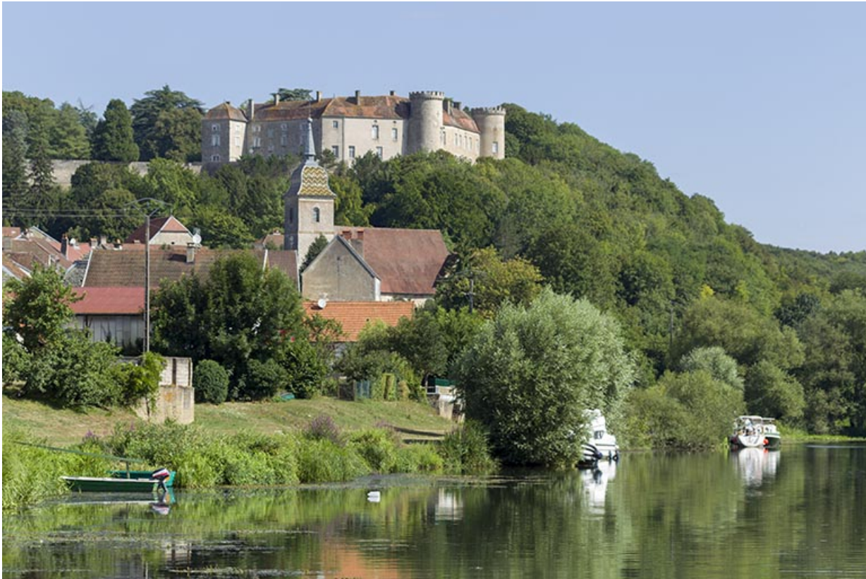
Vue générale depuis la Saône.