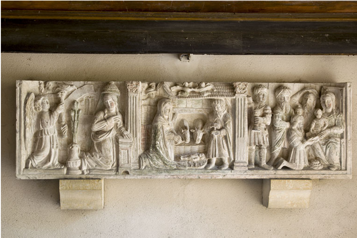
Relief : Annonciation, Nativité et Adoration des mages.