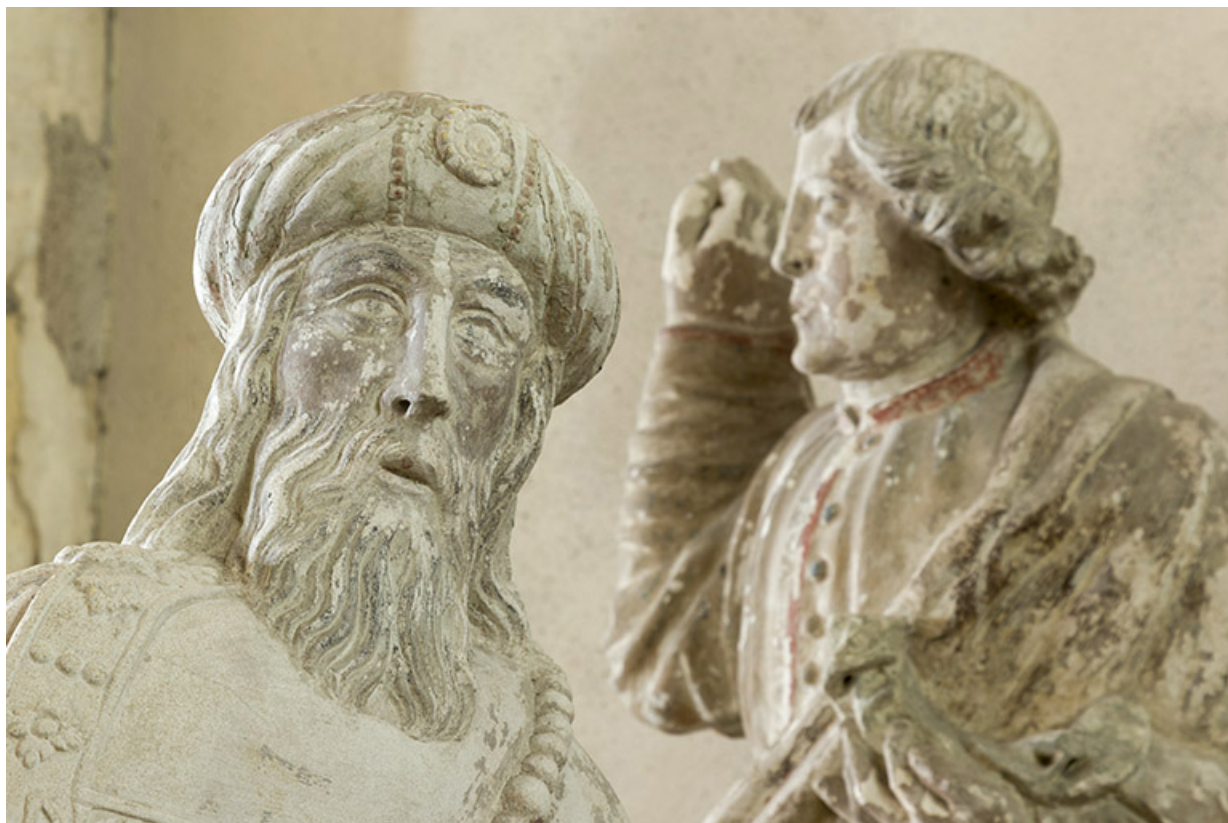
Groupe sculpté : saint Joseph d'Arimathie.