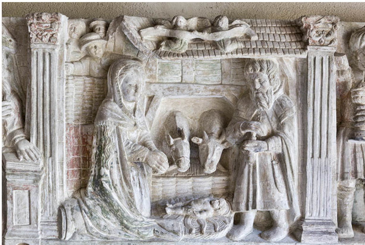
Relief : la Nativité.