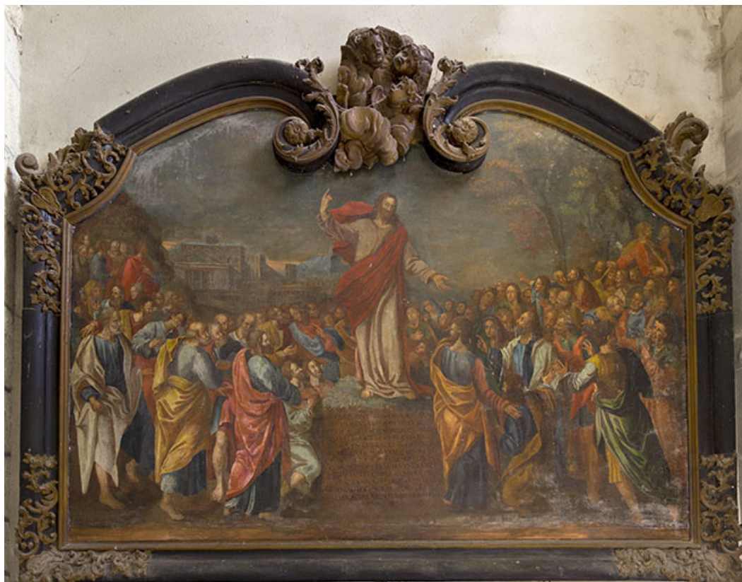
Tableau : la Prédication de Jésus Christ.