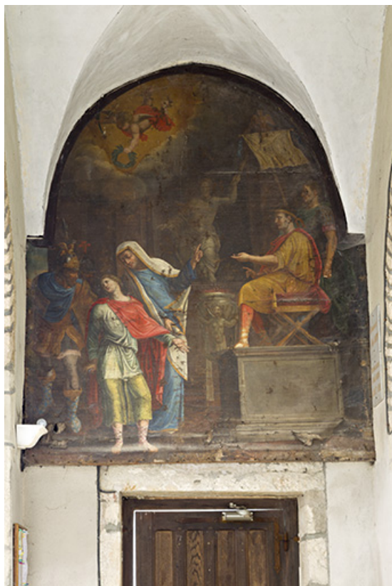
Tableau : saint Pancrace devant l'empereur Dioclétien et refusant de sacrifier aux dieux. 70, Ray-sur-Saône place de l' Eglise