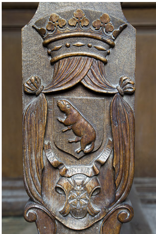
Chapelle seigneuriale : armoiries sur l'un des bancs. 70, Ray-sur-Saône place de l' Eglise