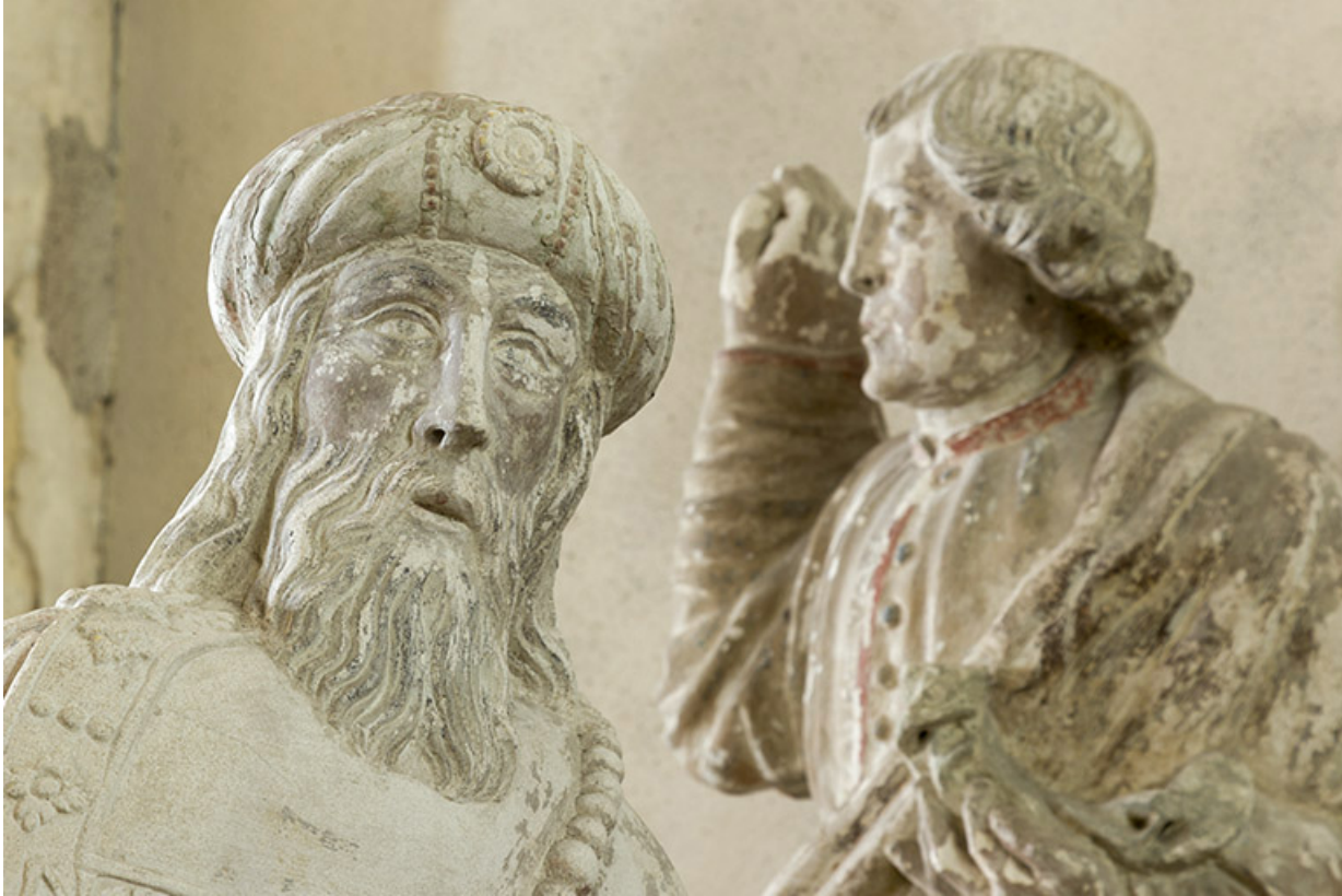
Groupe sculpté : saint Joseph d'Arimathie.