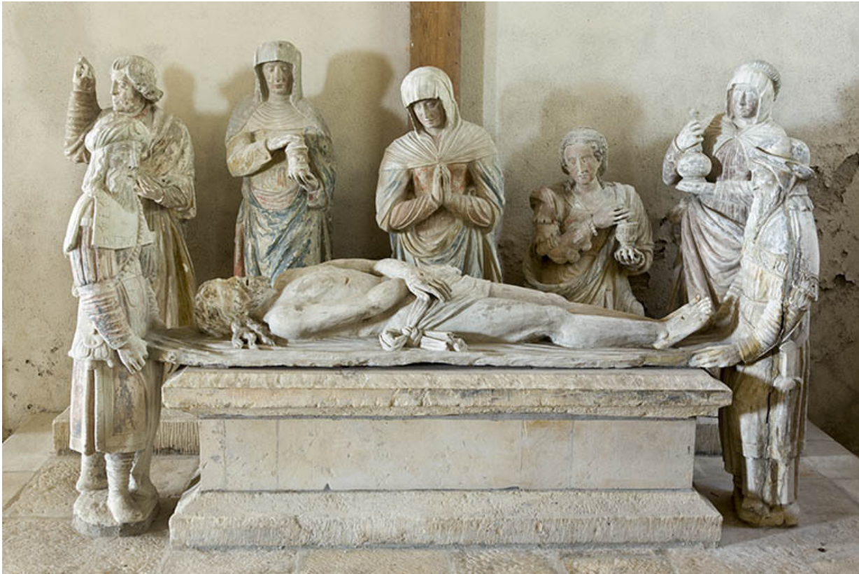
Groupe sculpté (dans la nef) : la Mise au tombeau, vue de face.