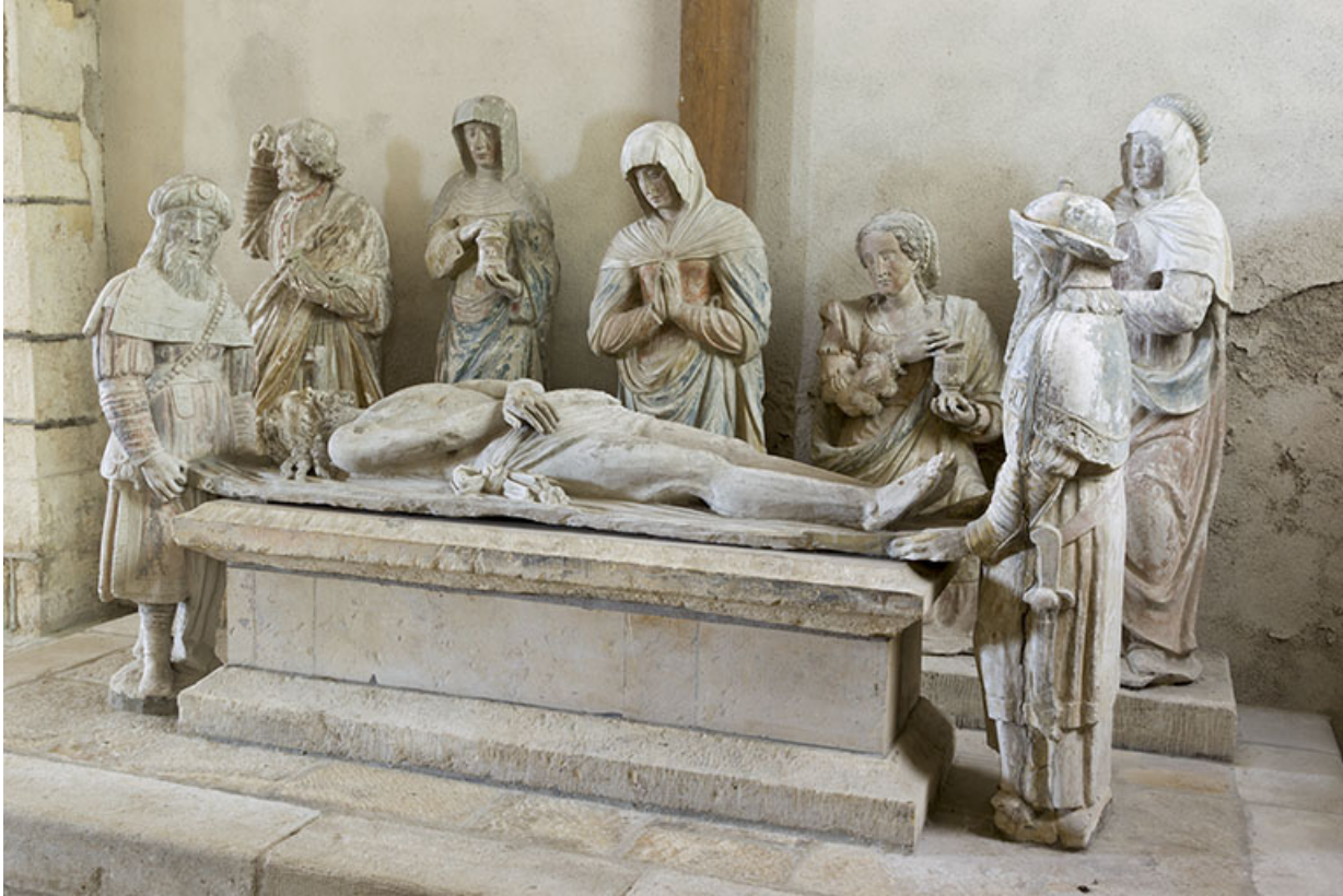
Groupe sculpté : la Mise au tombeau, vue de trois quart.