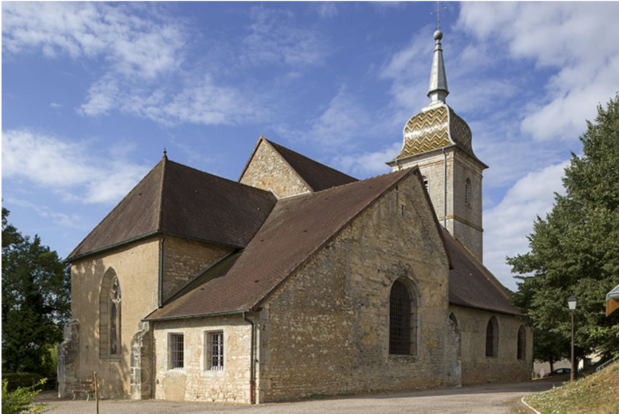
Le chœur et la façade latérale gauche.