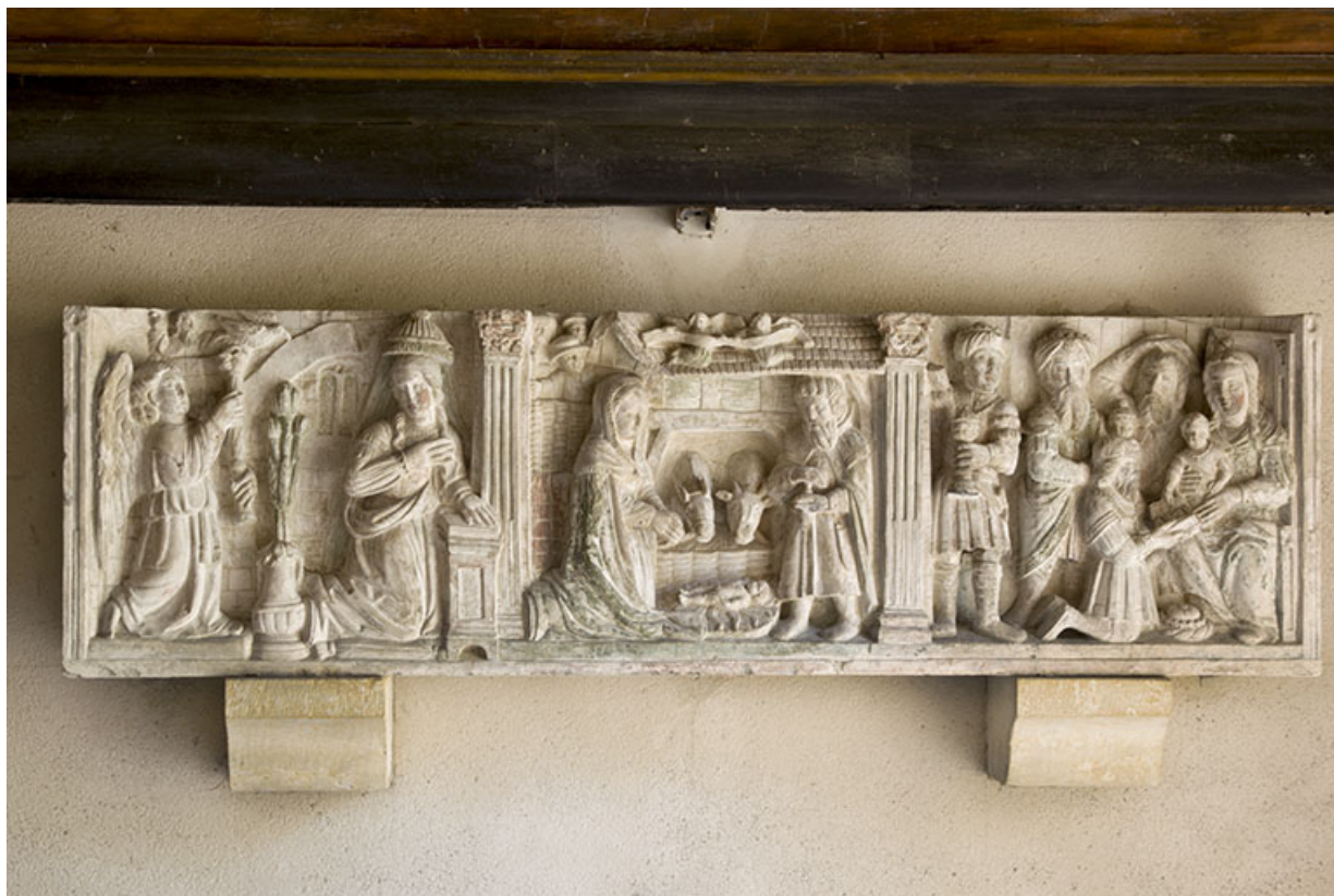
Relief : Annonciation, Nativité et Adoration des mages.