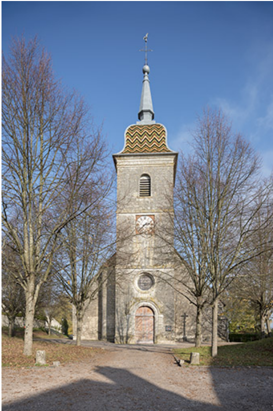
L'église paroissiale Saint-Pancrace, place de l'Eglise.