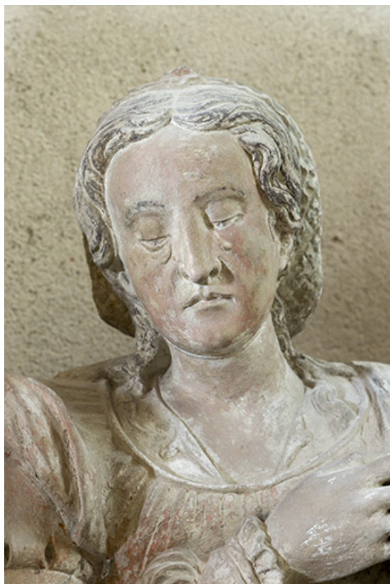
Groupe sculpté : buste de la Madeleine.