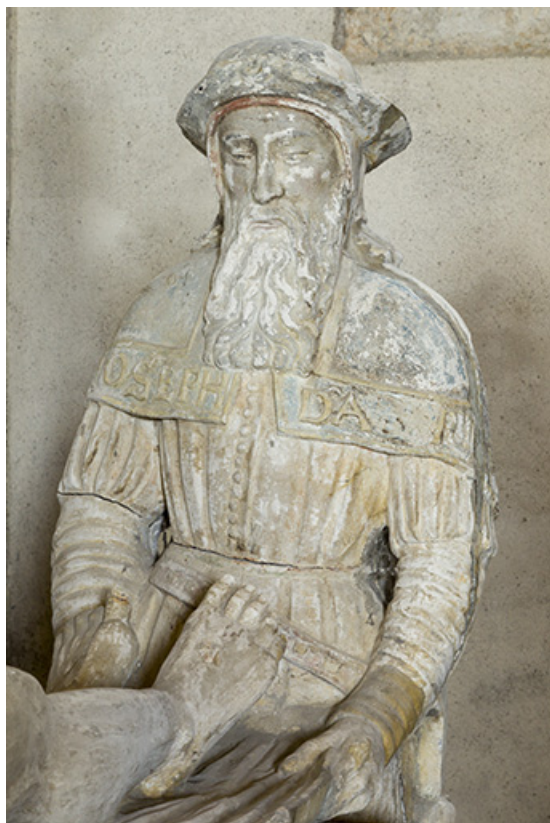
Groupe sculpté : Nicodème.