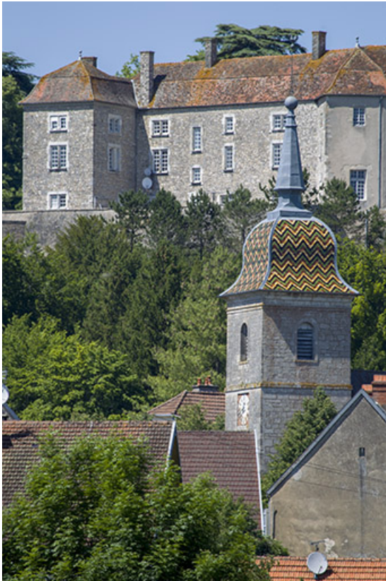
Le clocher et le château.