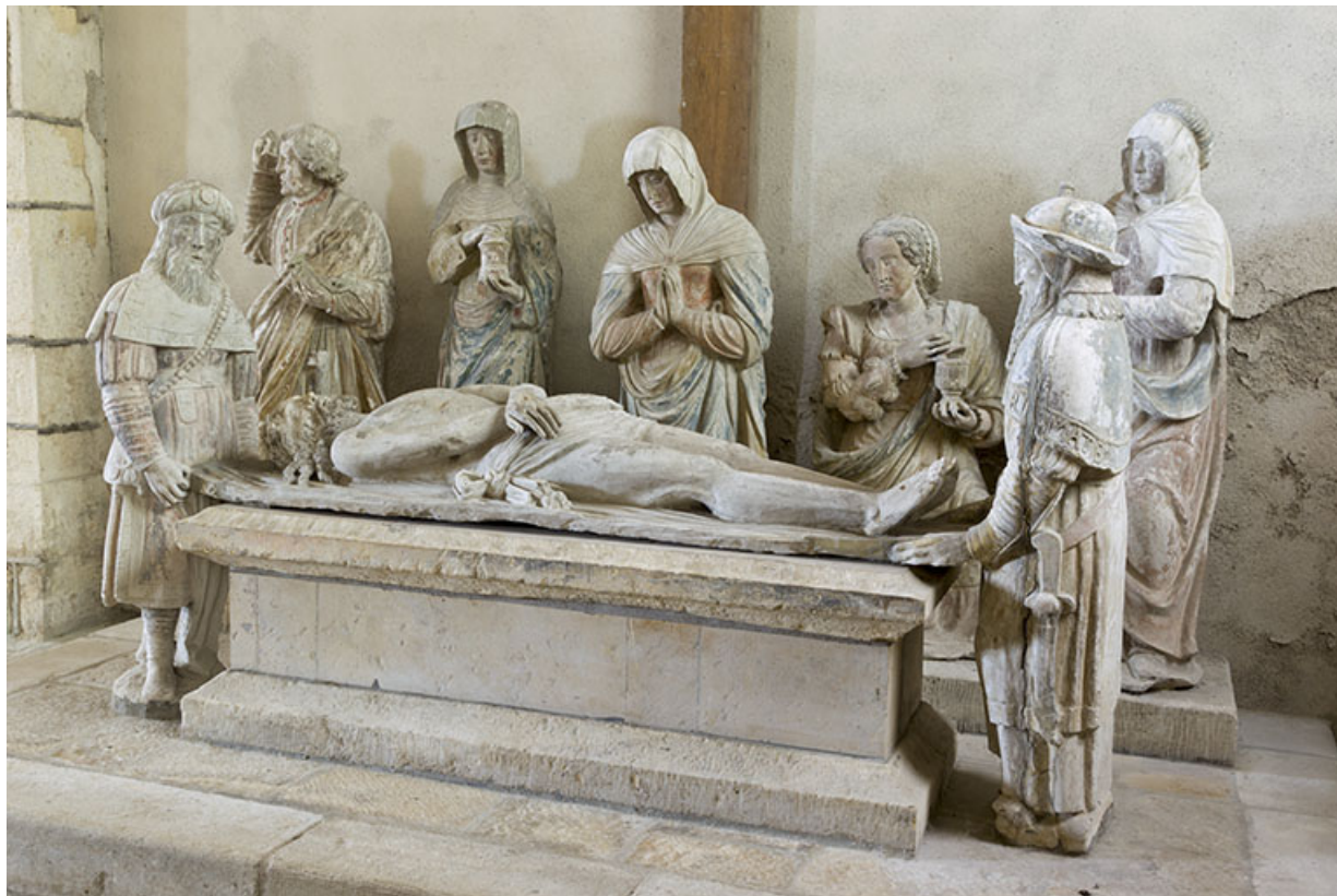
Groupe sculpté : la Mise au tombeau, vue de trois quart.