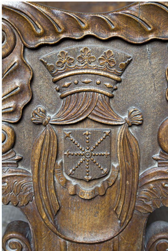
Chapelle seigneuriale : armoiries de la famille de Ray sur l'un des bancs. 70, Ray-sur-Saône place de l' Eglise