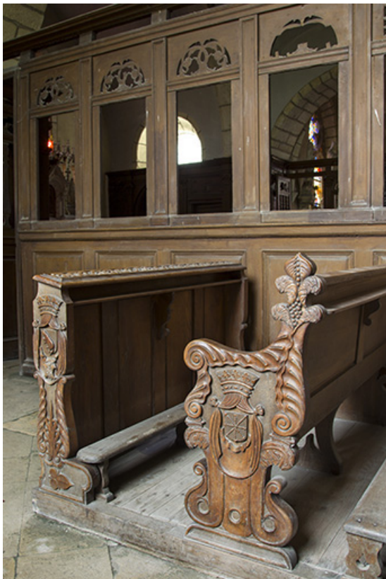
Chapelle seigneuriale : les bancs de famille.