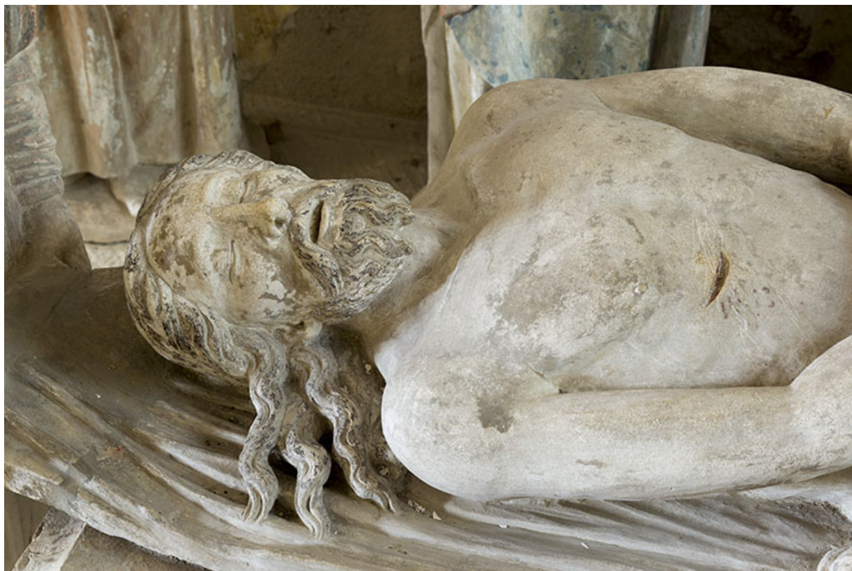
Groupe sculpté : buste du Christ mort.