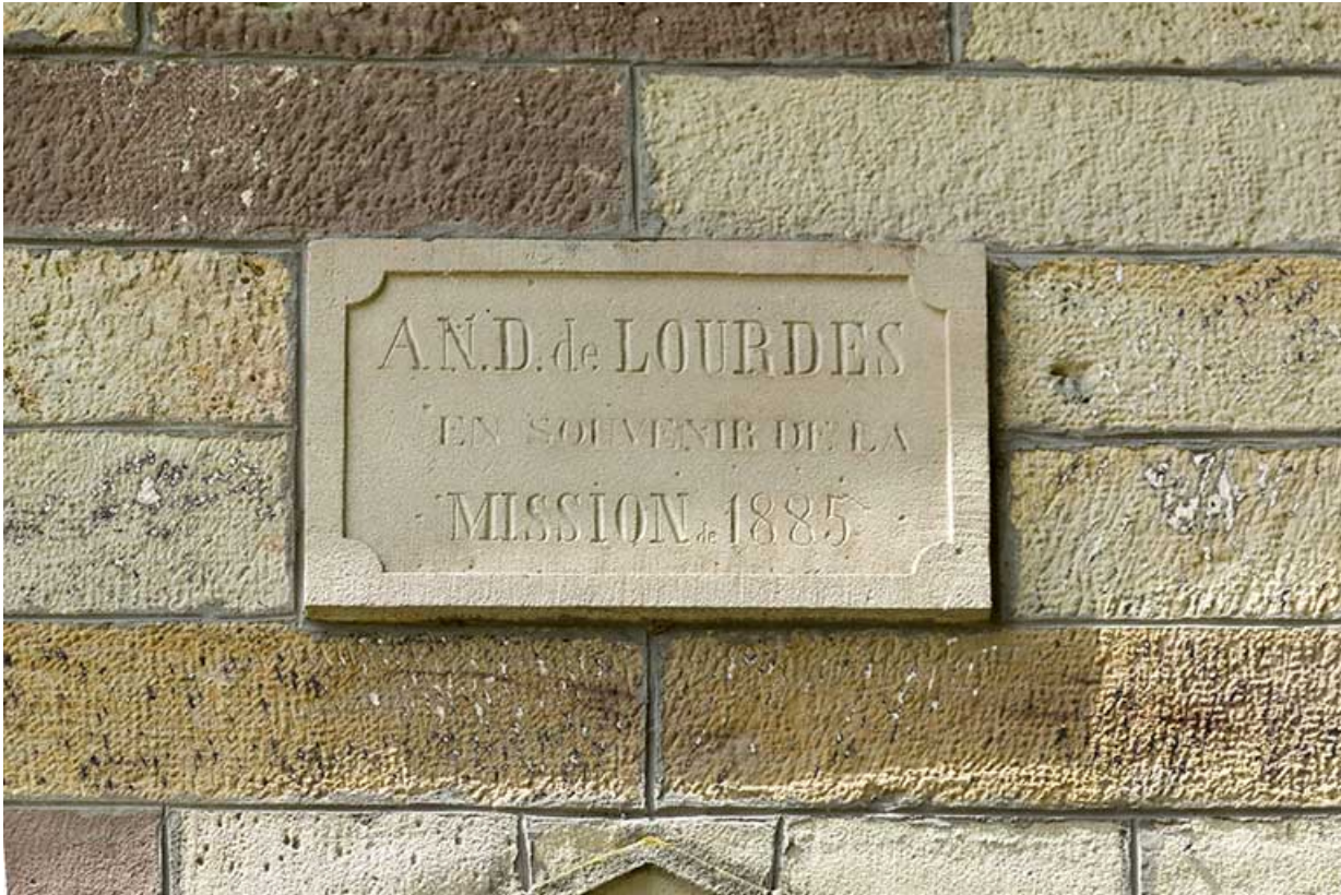
Plaque indiquant l'année de construction de la chapelle.