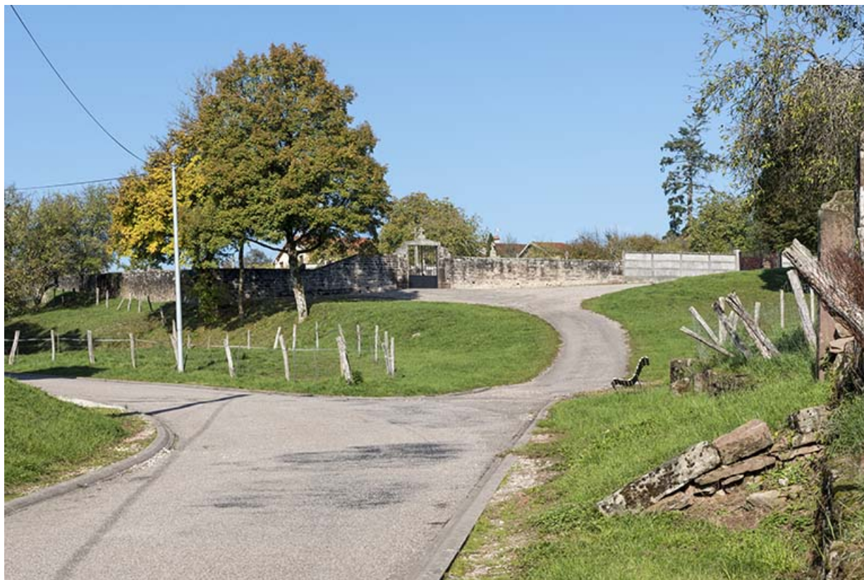
Le cimetière. 70, Selles