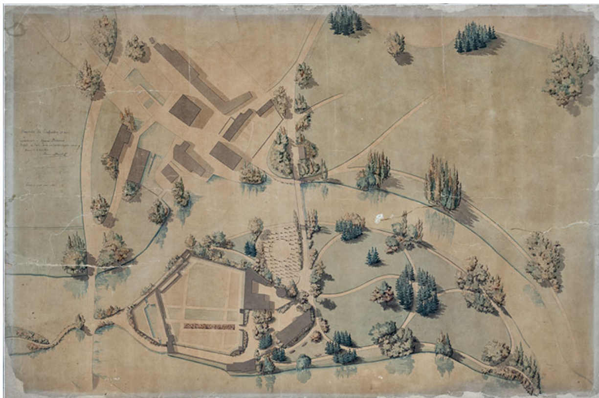
Plan présentant le projet de parc par Brice Michel (1872).