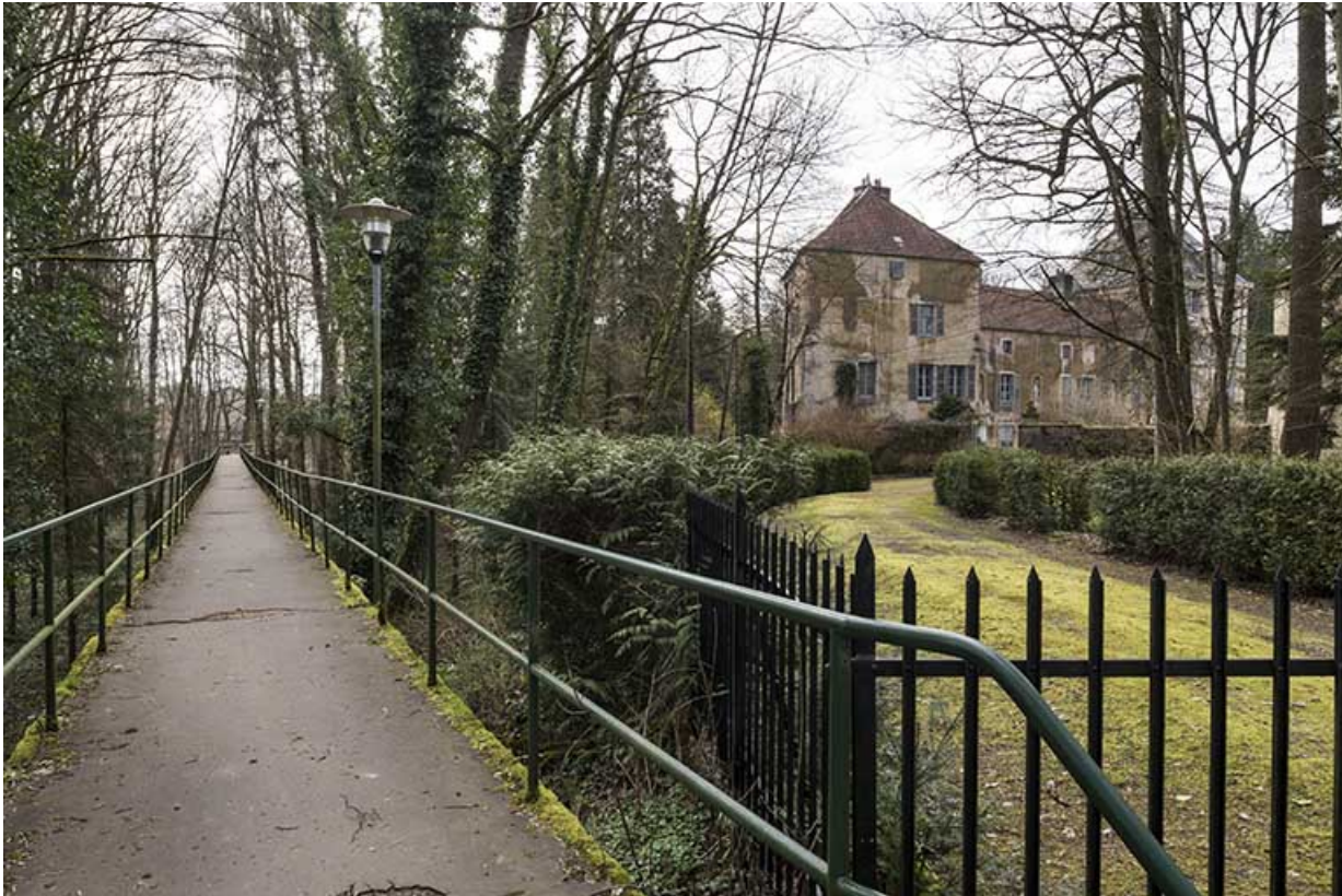
La passerelle reliant le village à l'usine.