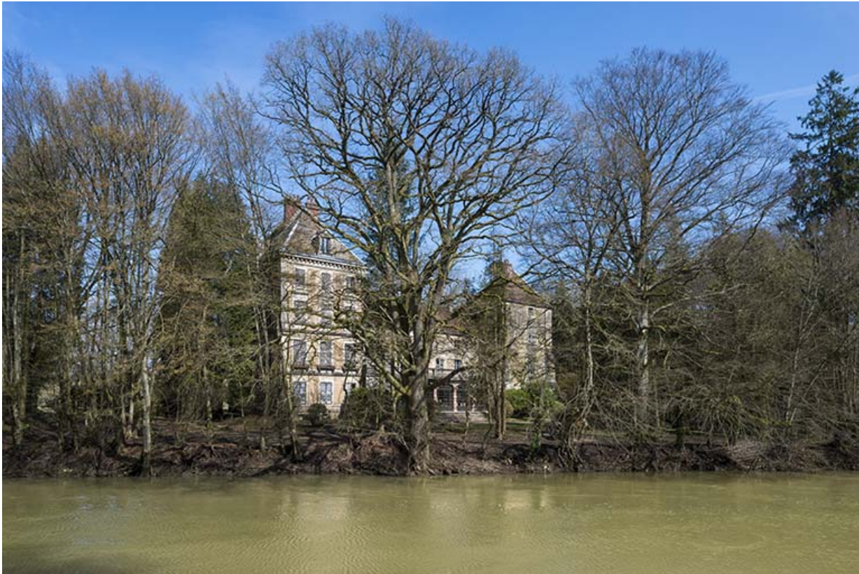
La façade sud-ouest depuis la rue du Moulin rouge.