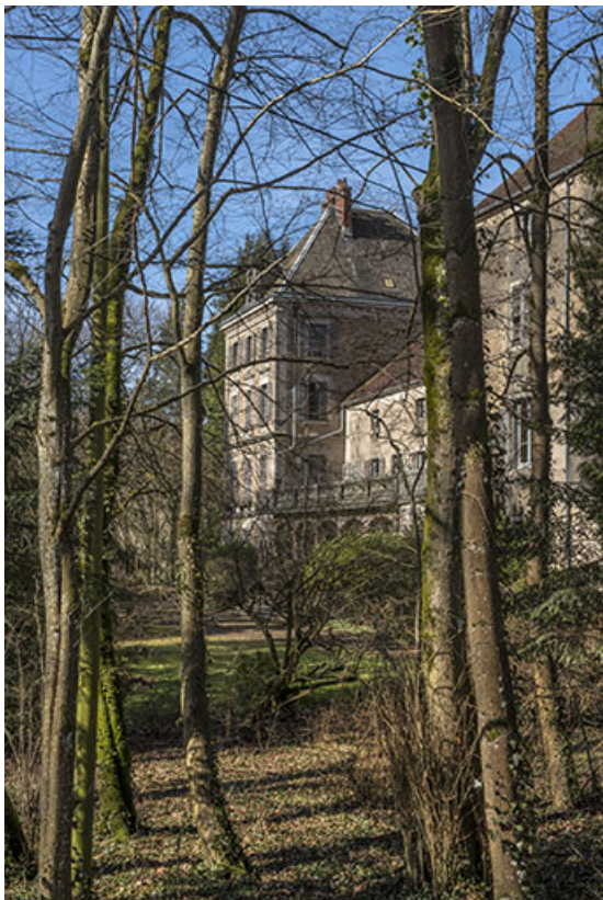
La façade sud-ouest, vue depuis le parc.