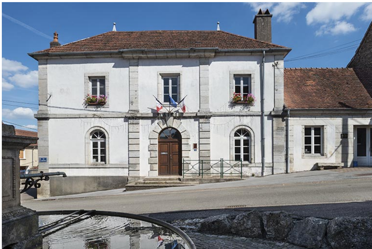
La façade antérieure.