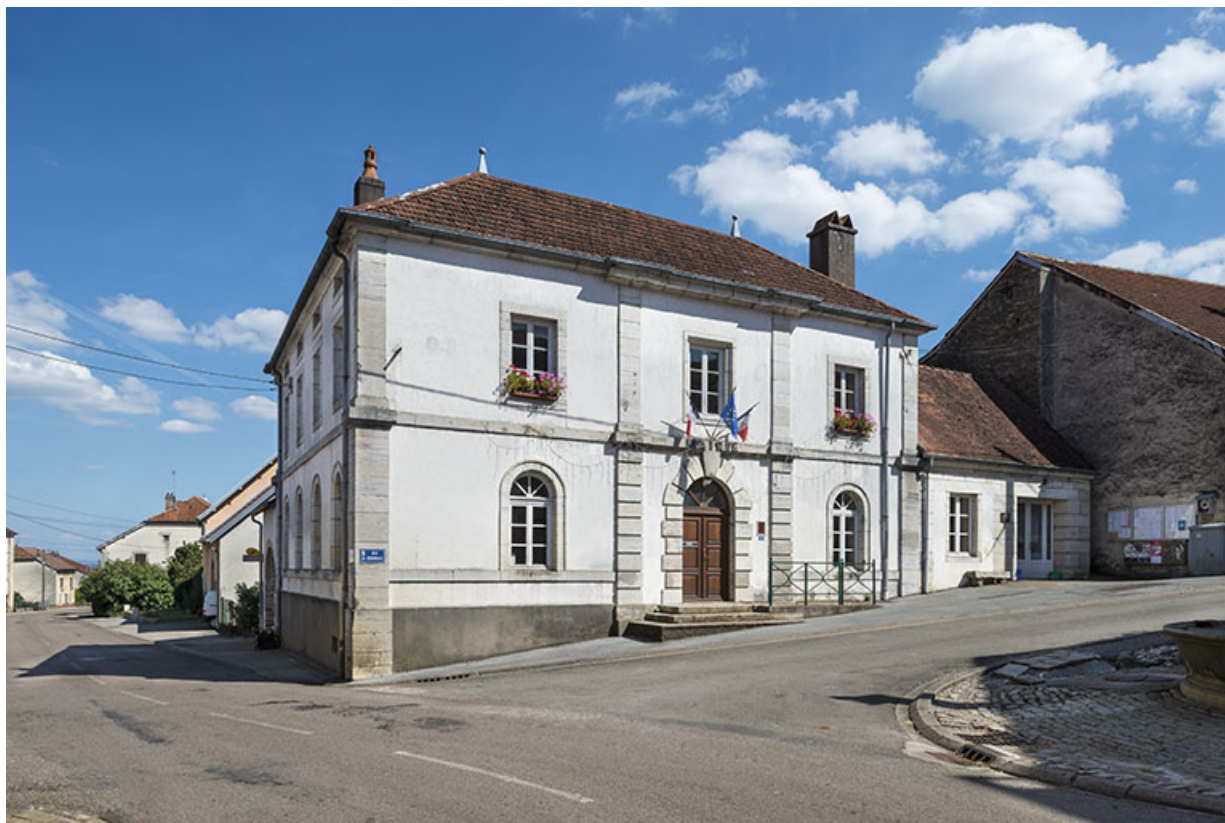
Vue depuis la Grande Rue.