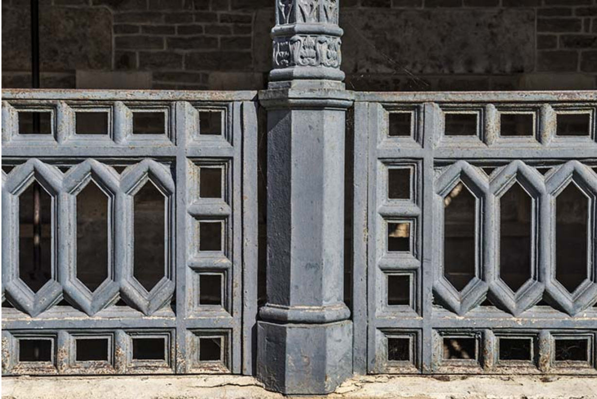
Détail du garde-corps et d'une colone.