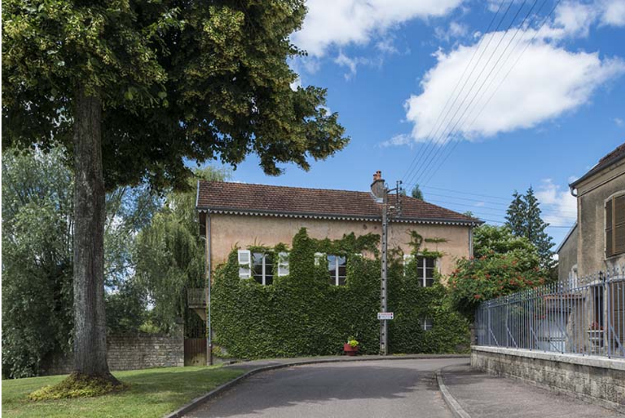
Ancienne tannerie, grande rue du Bourg. 70, Scey-sur-Saône-et-Saint-Albin