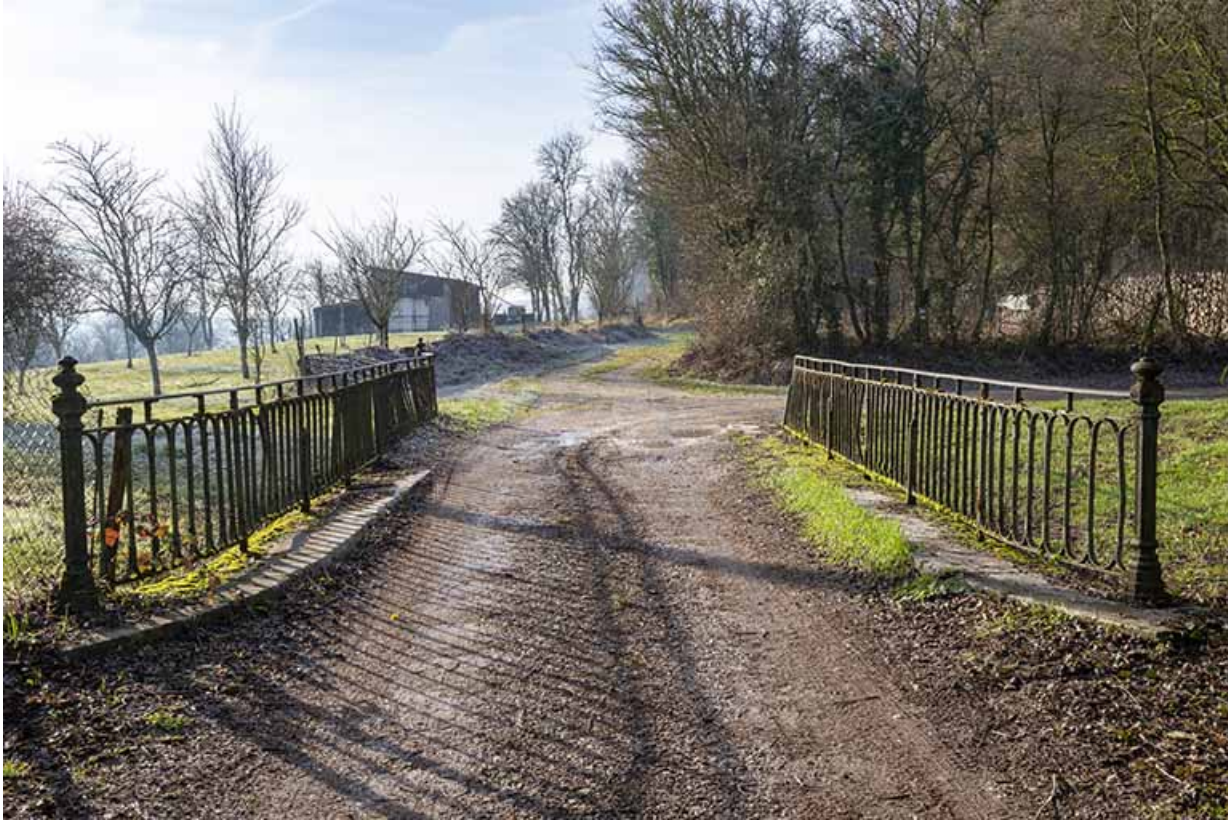
Pont franchissant la tranchée de la voie ferrée (aujourd'hui comblée) dans le quartier de l'Église.