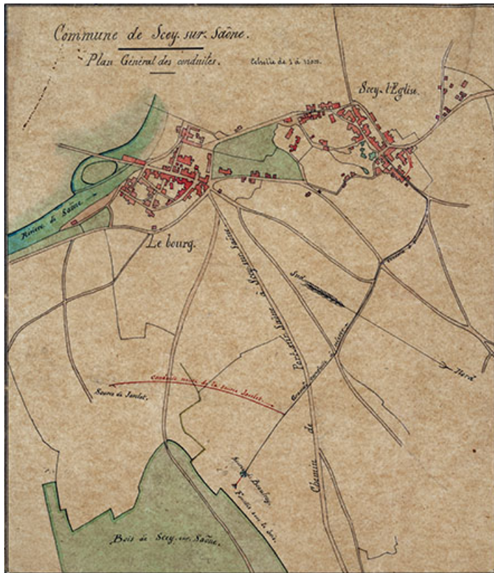
Plan montrant l'implantation du bâti à Scey-sur-Saône (1862).