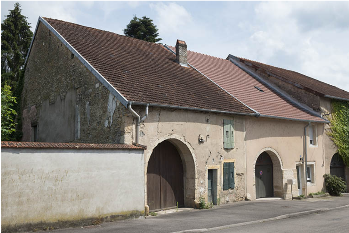
Ensemble de deux fermes, Grande rue du Bourg.