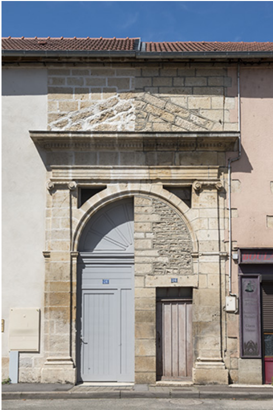
Maison commune, justice de paix, école et halle de la première moitié du 19e siècle. 70, Sceaux-sur-Saône-et-Saint-Albin