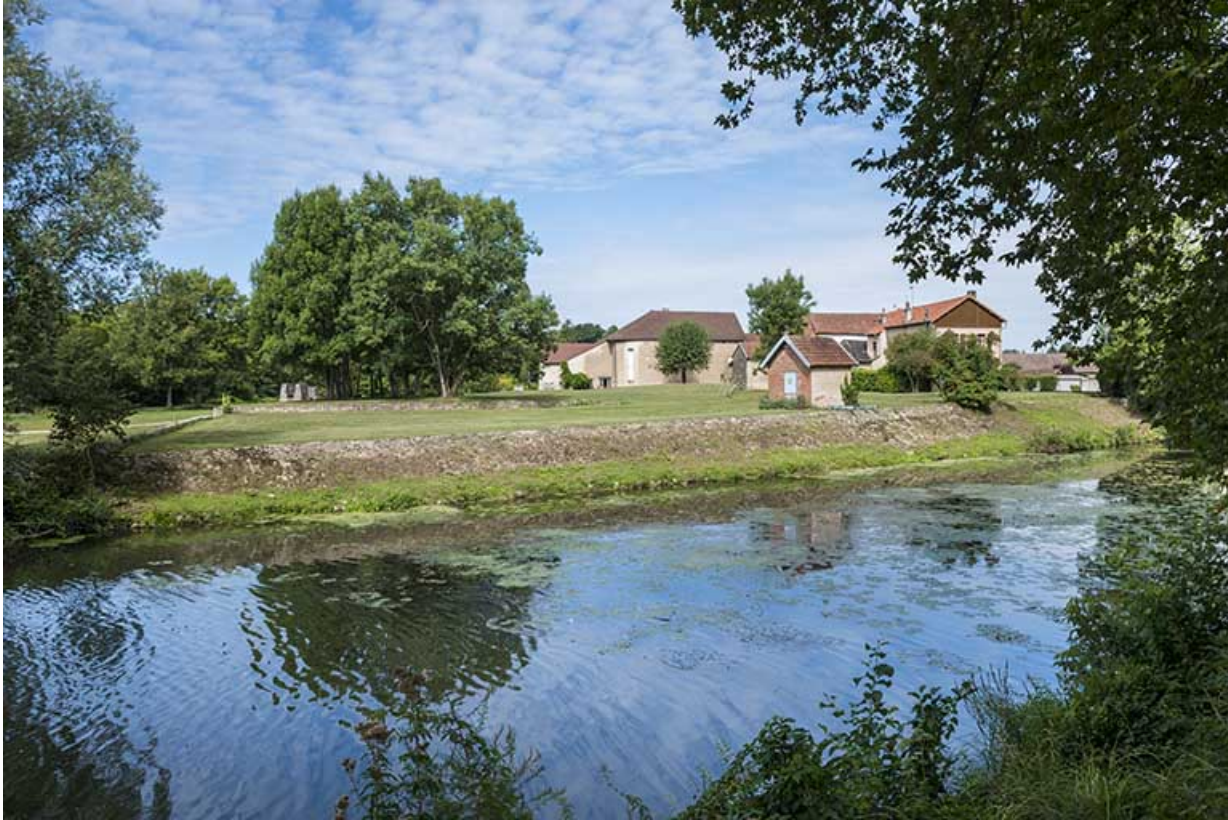
Sud de l'île, vue depuis la digue.