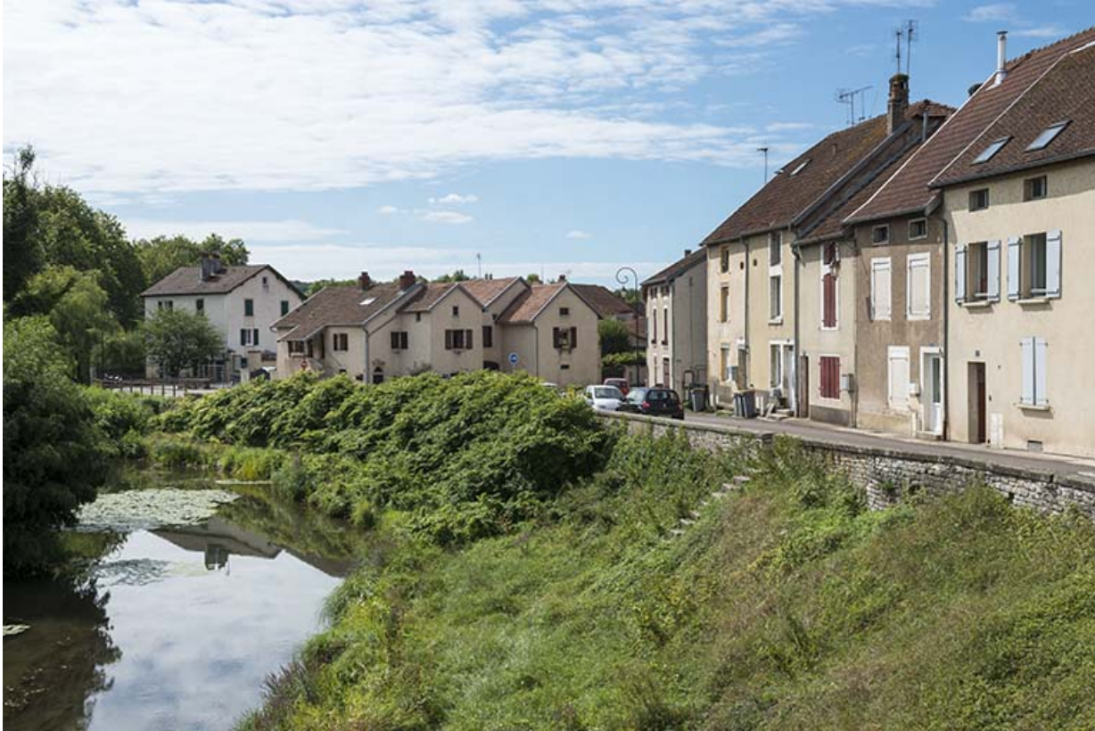
Vue d'ensemble de l'habitat depuis la route nationale. 70, Port-sur-Saône