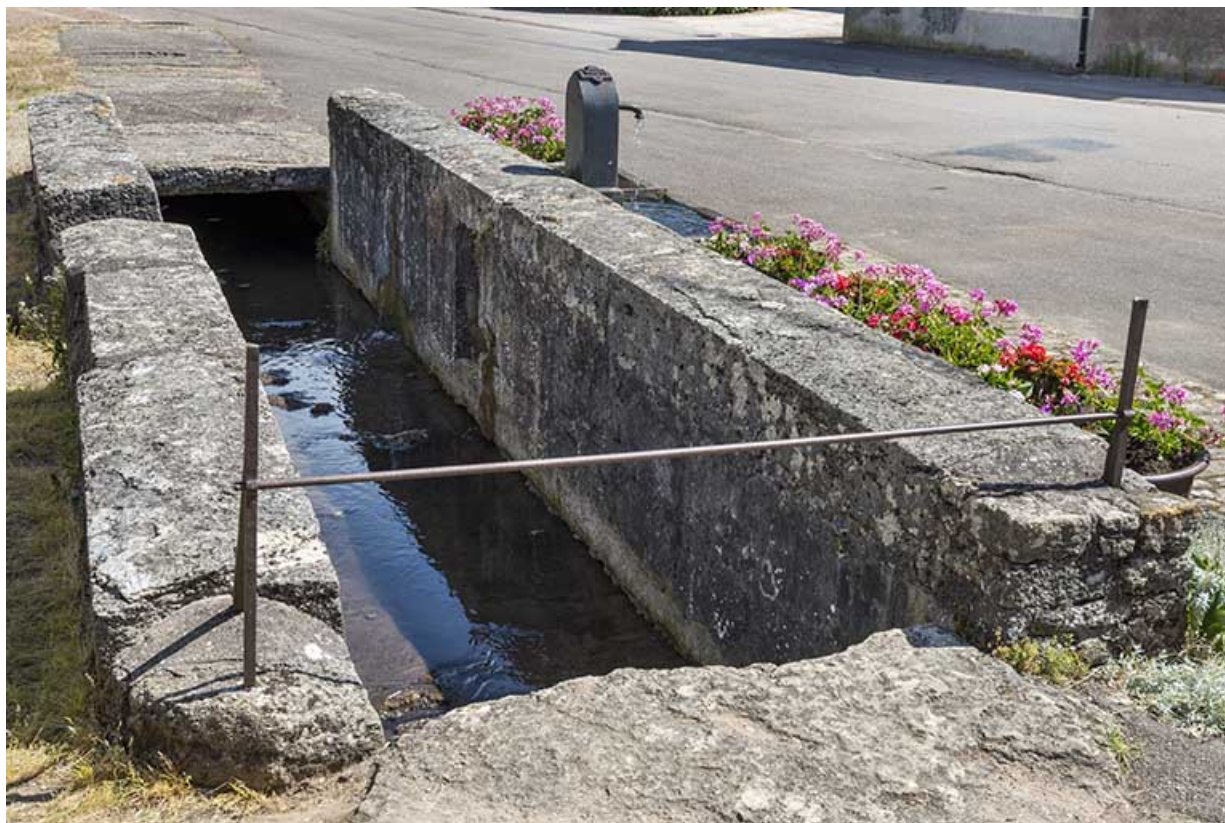
Le ruisseau canalisé alimentant les bornes fontaines.