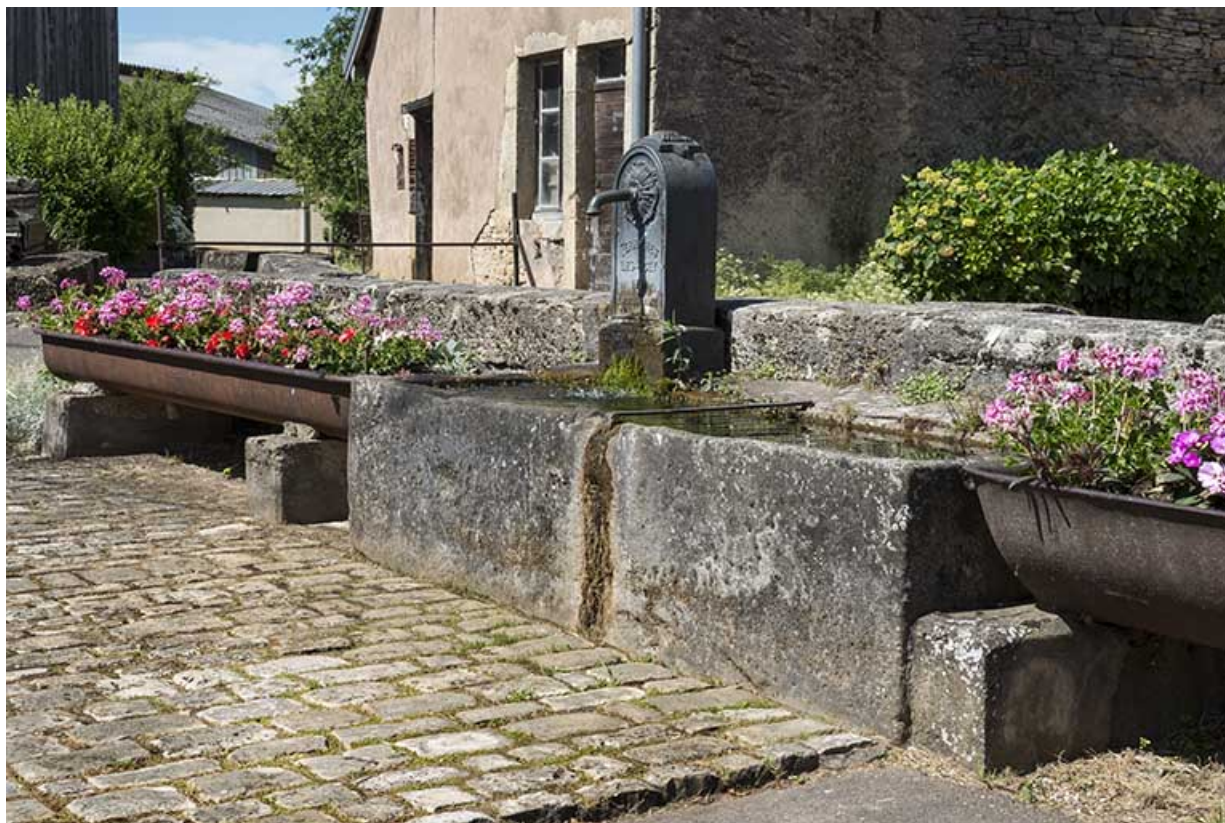
Borne-fontaine et auges d'abreuvoir en fonte rue de la Prairie. 70, Ferrières-lès-Scey