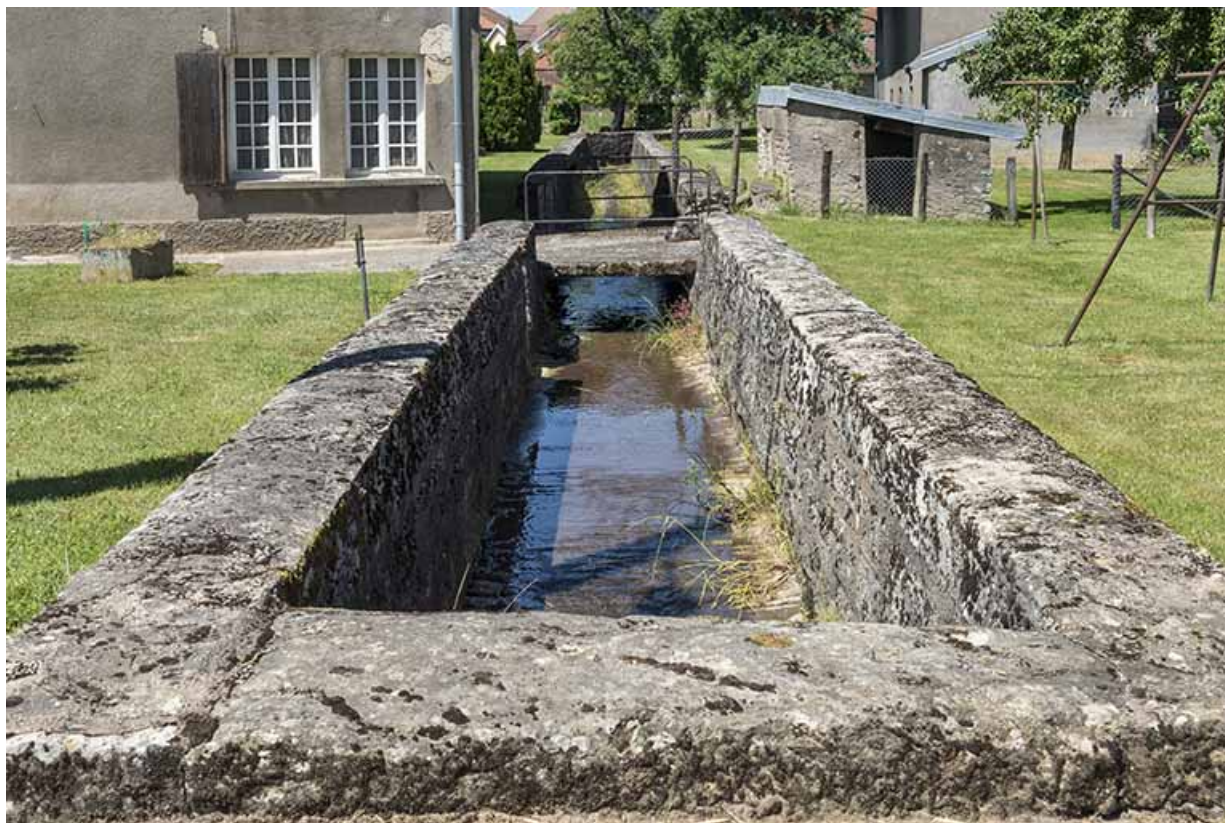
Le ruisseau canalisé qui traverse le village.