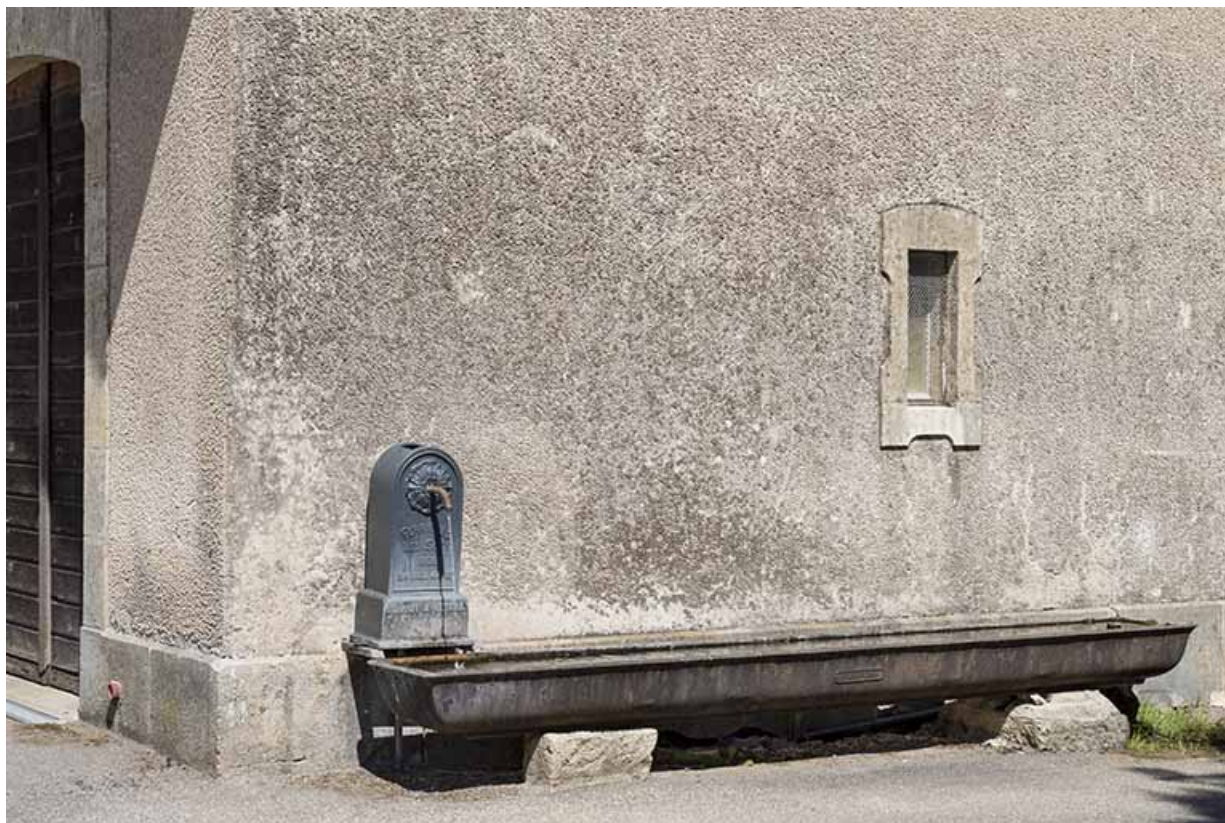
Abreuvoir situé contre la façade droite.