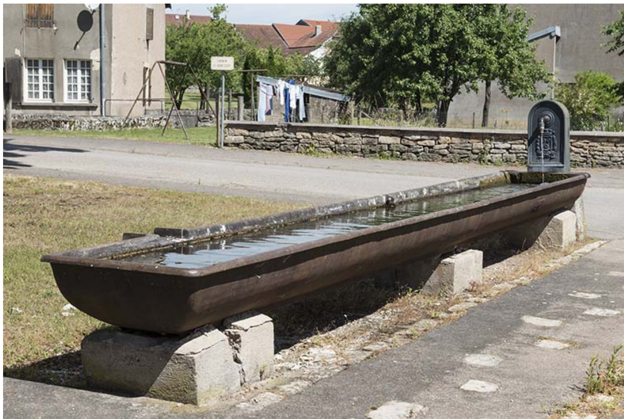
Borne-fontaine et auge d'abreuvoir en fonte situées à l'extrémité sud du village. 70, Ferrières-lès-Scey