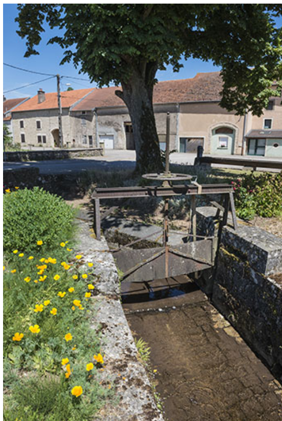
Vanne située à l'extrémité sud du village.