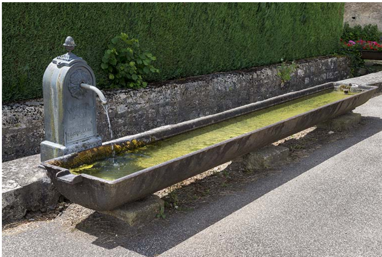
Borne-fontaine et auge d'abreuvoir en fonte situées route de Port-sur-Saône. 70, Ferrières-lès-Scey