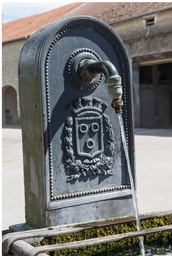
Vue rapprochée de la borne-fontaine située à l'extrémité sud du village. 70, Ferrières-lès-Scey