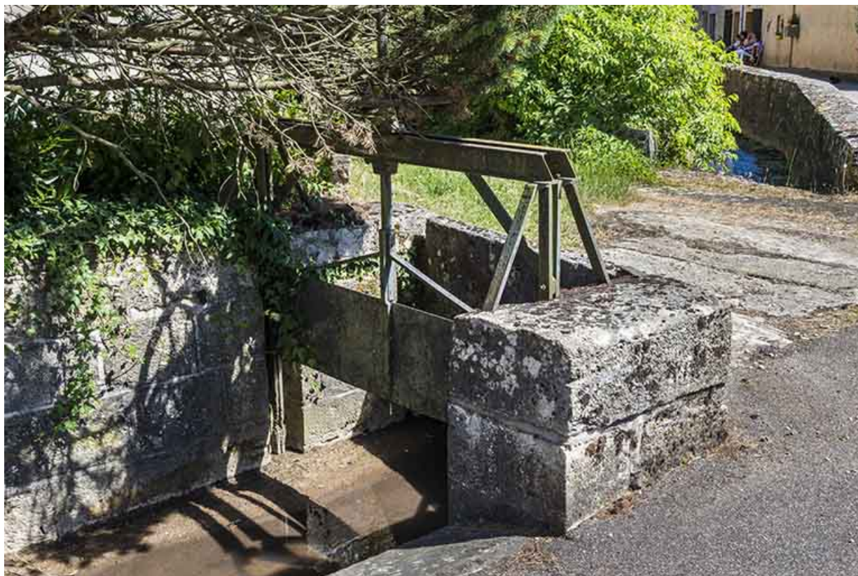
Vanne située à l'angle de l'impasse du château. 70, Ferrières-lès-Scey