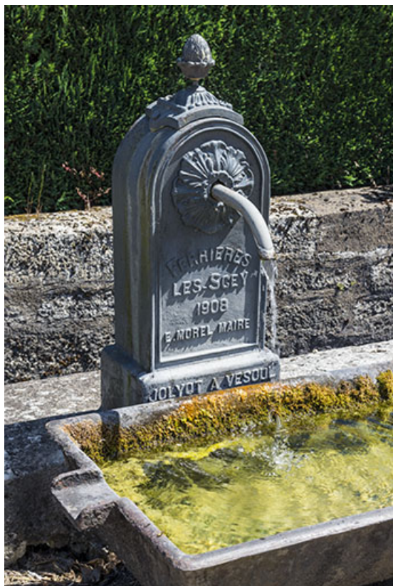
Détail de la borne-fontaine située route de Port-sur-Saône. 70, Ferrières-lès-Scey