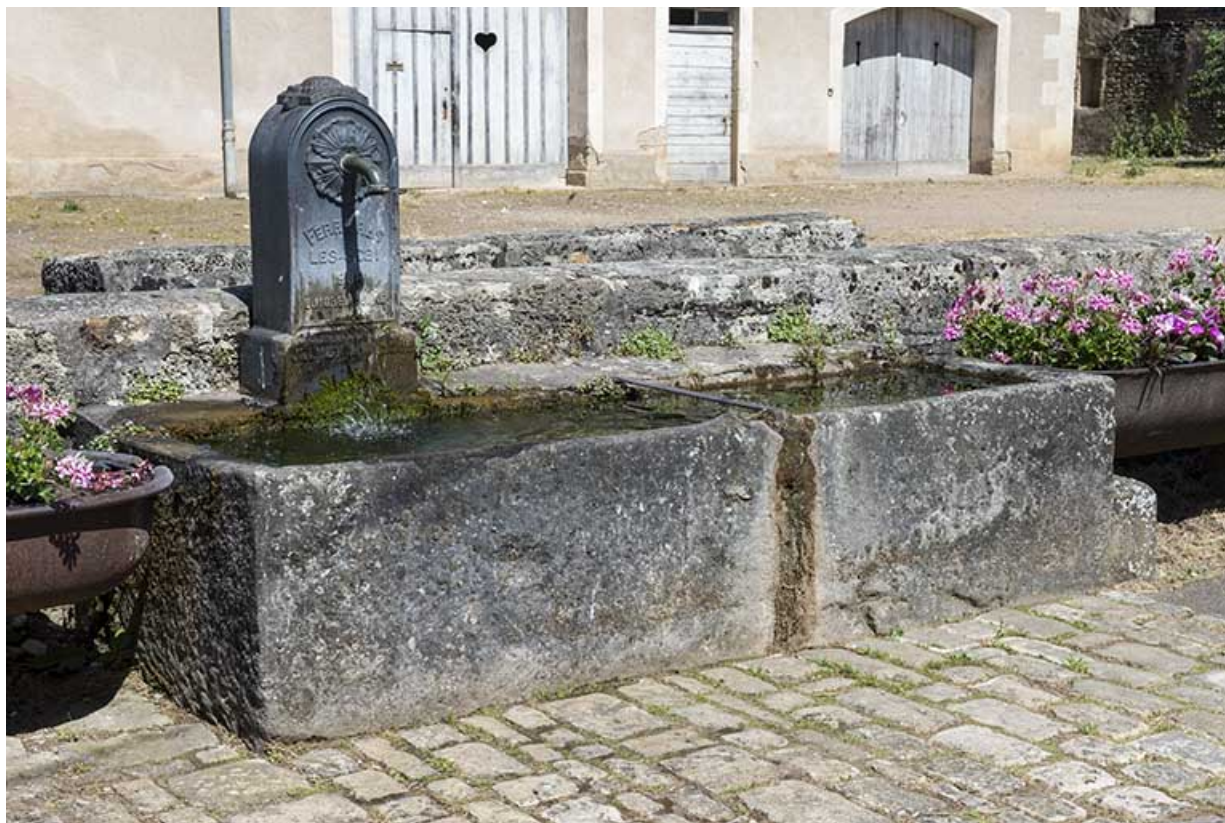
Borne-fontaine située rue de la Prairie.