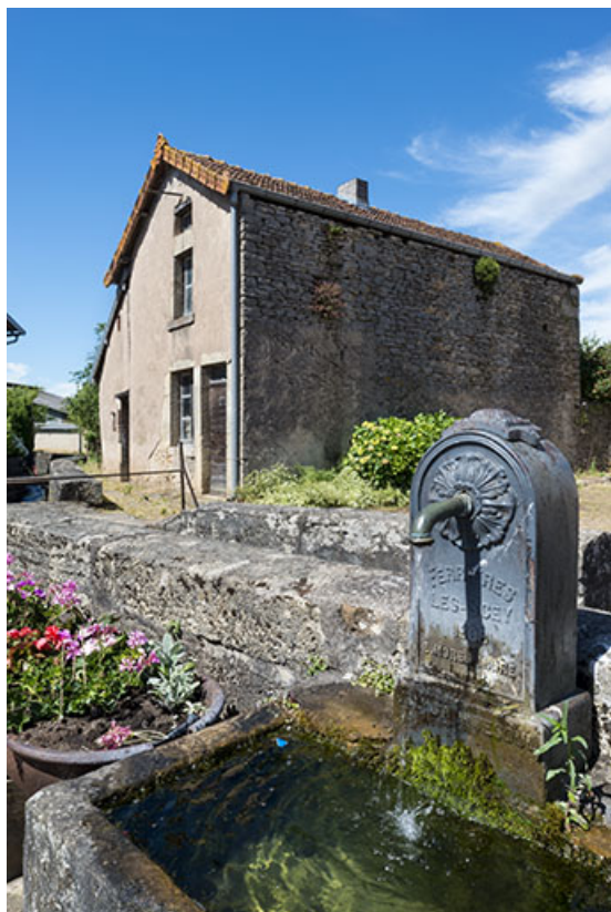
Détail de la borne-fontaine située rue de la Prairie. 70, Ferrières-lès-Scey