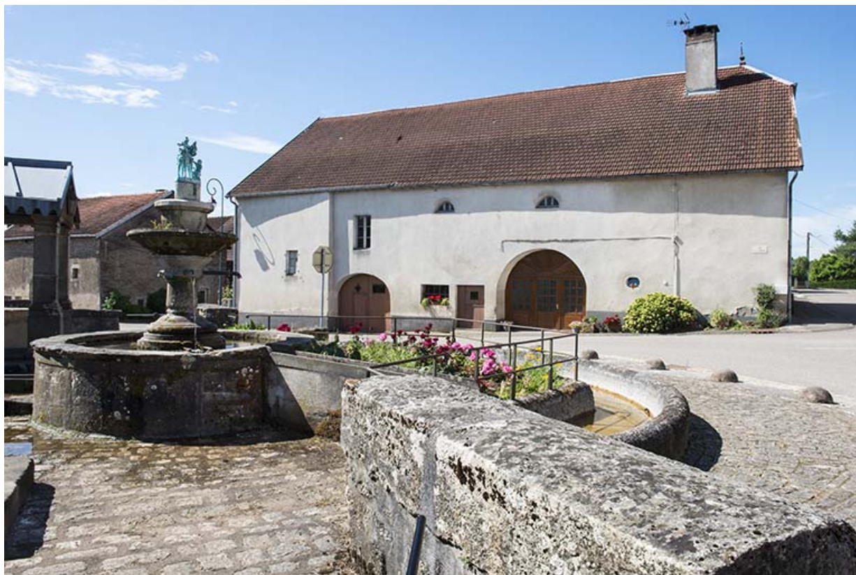
Fontaine principale située au centre du village. 70, Ferrières-lès-Scey