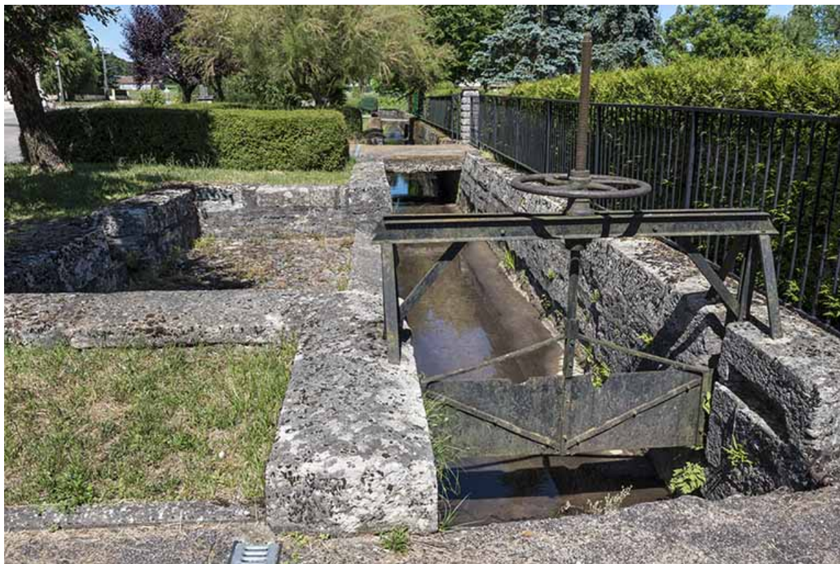
Détail de la vanne située en aval sud de la remise de matériel d'incendie et d'un lavoir en pierre. 70, Ferrières-lès-Scey