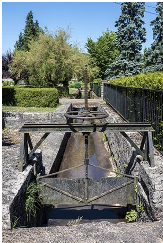
Vanne située en aval sud de la remise de matériel d'incendie, à l'entrée du village. 70, Ferrières-lès-Scey