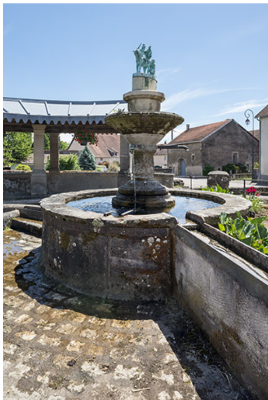
Le bassin central de la fontaine.