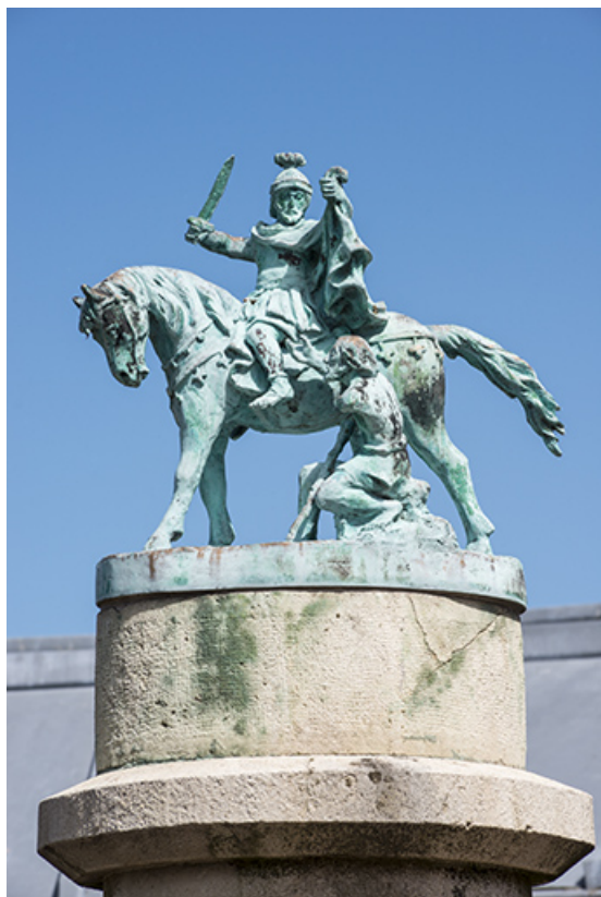
La statuette en métal ornant le bassin central représentant Saint Martin partageant son manteau avec un mendiant. 70, Ferrières-lès-Scey