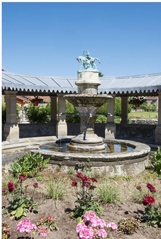
Le bassin central et de la galerie couverte des laveuses. 70, Ferrières-lès-Scey