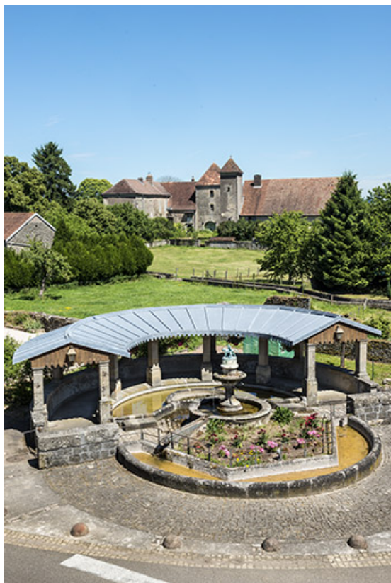
Vue d'ensemble de la fontaine avec la maison forte en arrière-plan. 70, Ferrières-lès-Scey