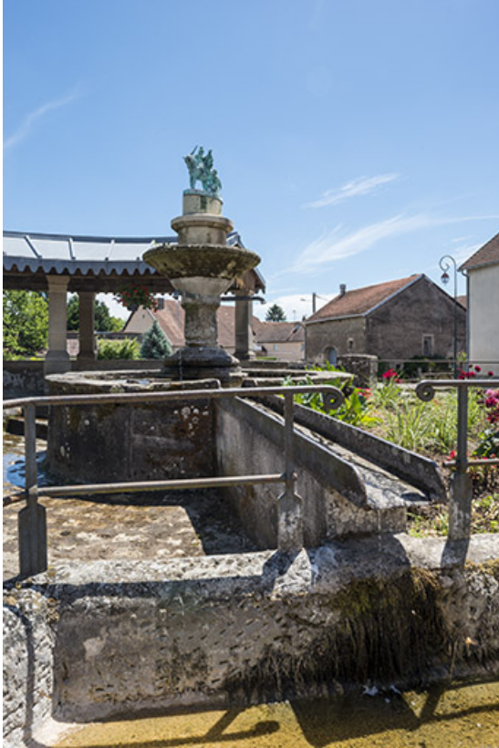
Détail de la fontaine.