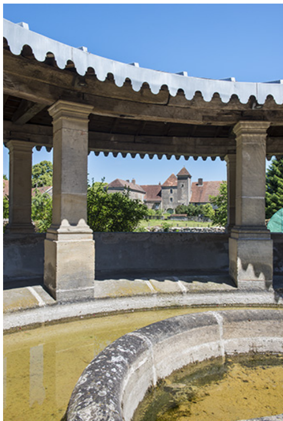
Le lavoire et la galerie couverte des laveuses.