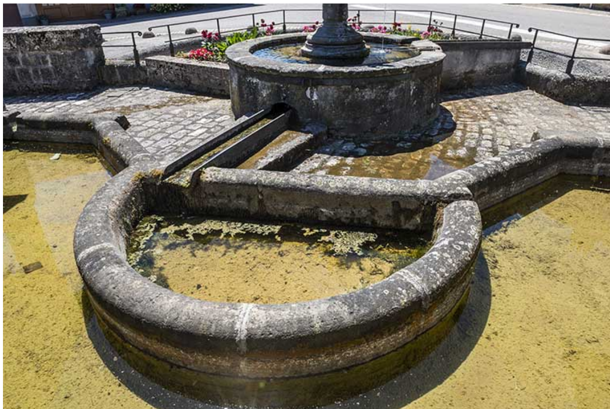
Le rinçoir de la fontaine.