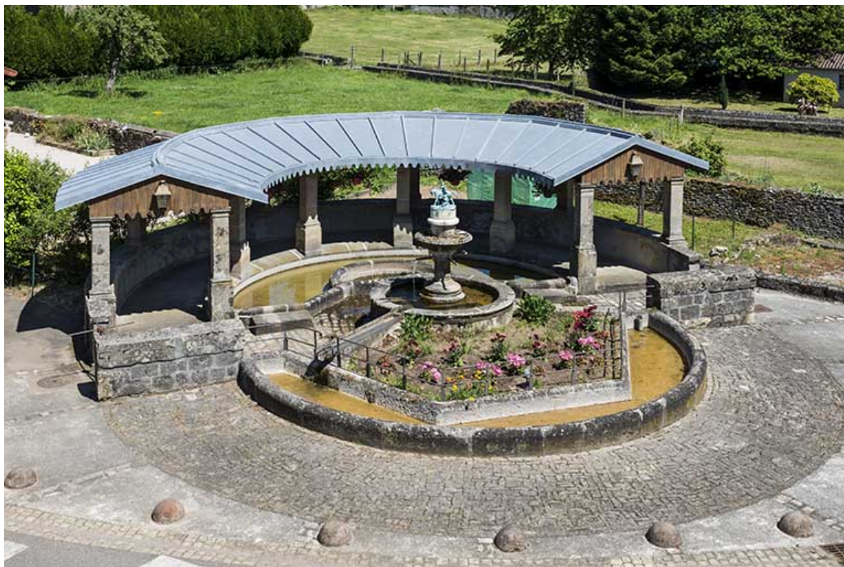
Vue d'ensemble de la fontaine.