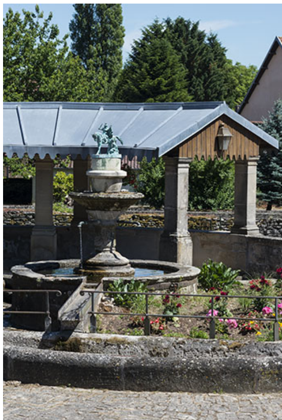
Vue rapprochée de l'extrémité droite de la galerie des laveuses et du bassin central. 70, Ferrières-lès-Scey