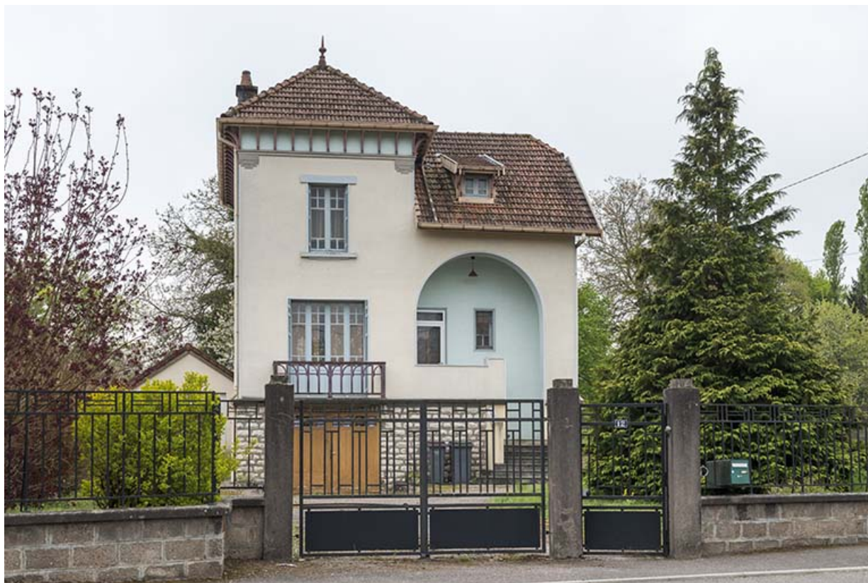
Vue générale depuis la rue du Tertre.