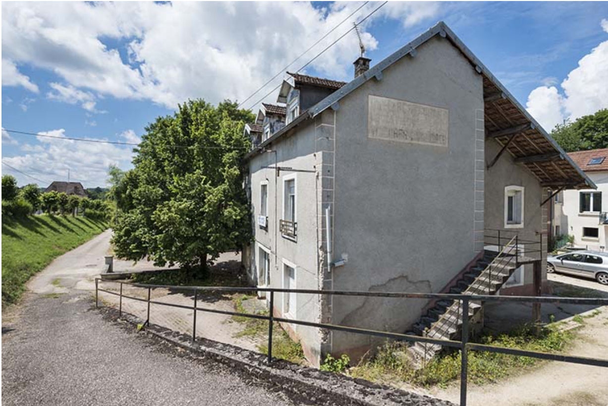
Ancien café-hôtel de la gare.