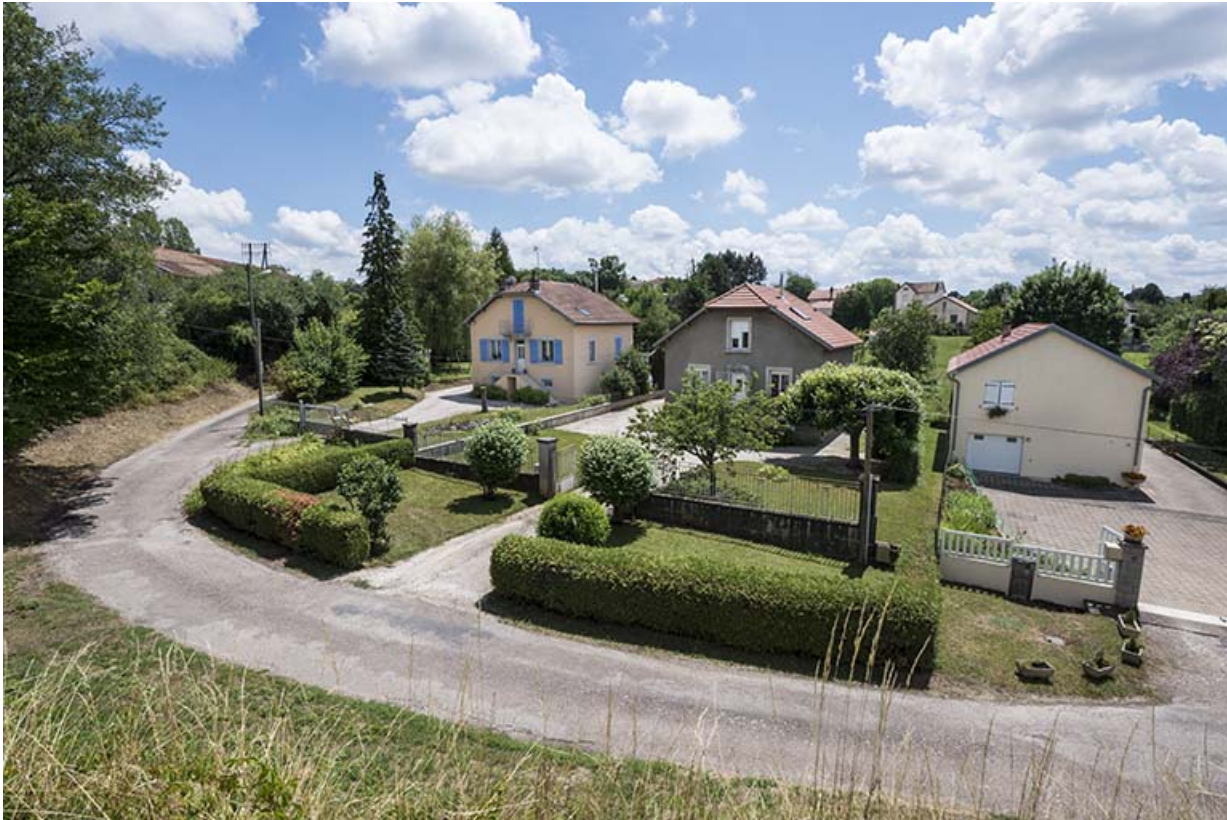
Pavillons construits en contre-bas de la gare.