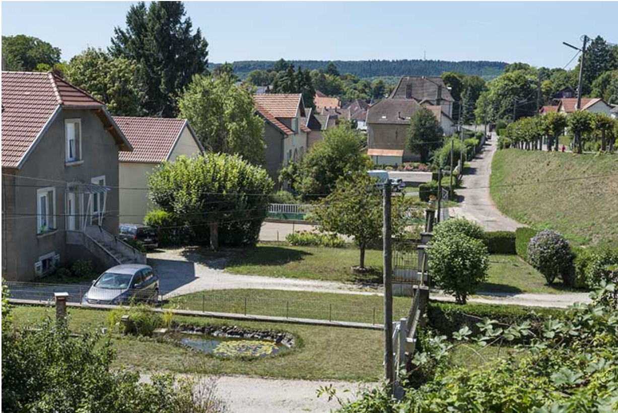
L'allée des Lilas, voie parallèle à l'avenue de la Gare. 70, Port-sur-Saône