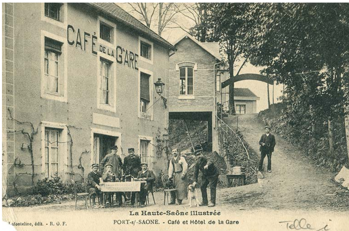
Hôtel et café de la gare, carte postale.