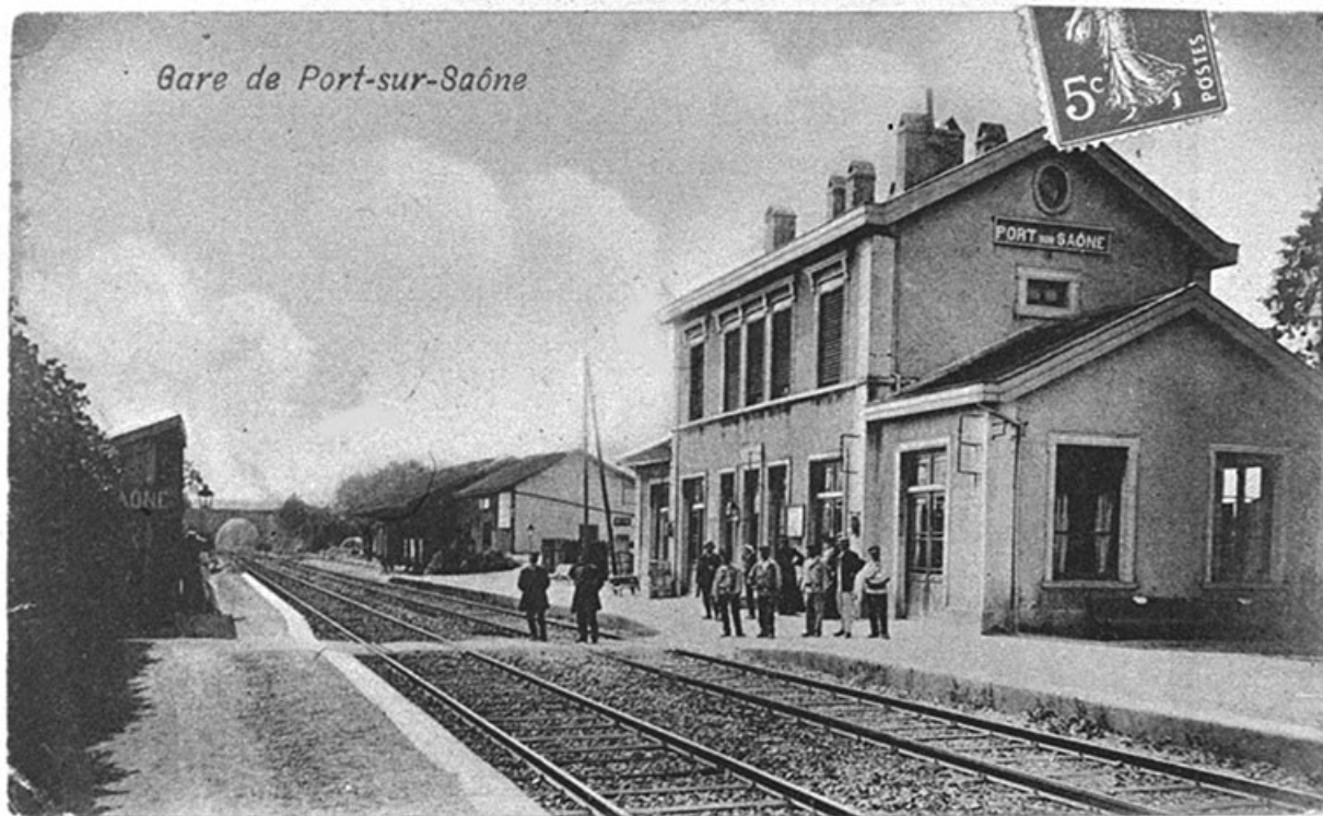
La gare, carte postale.