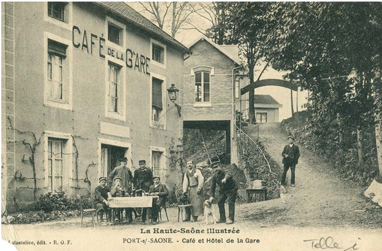
Hôtel et café de la gare, carte postale. 70, Port-sur-Saône