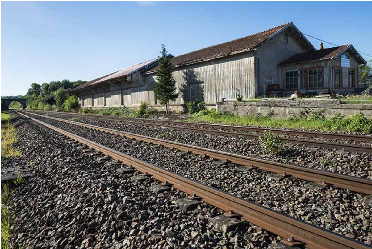
L'entrepôt de l'ancienne gare de Port-sur-Saône.