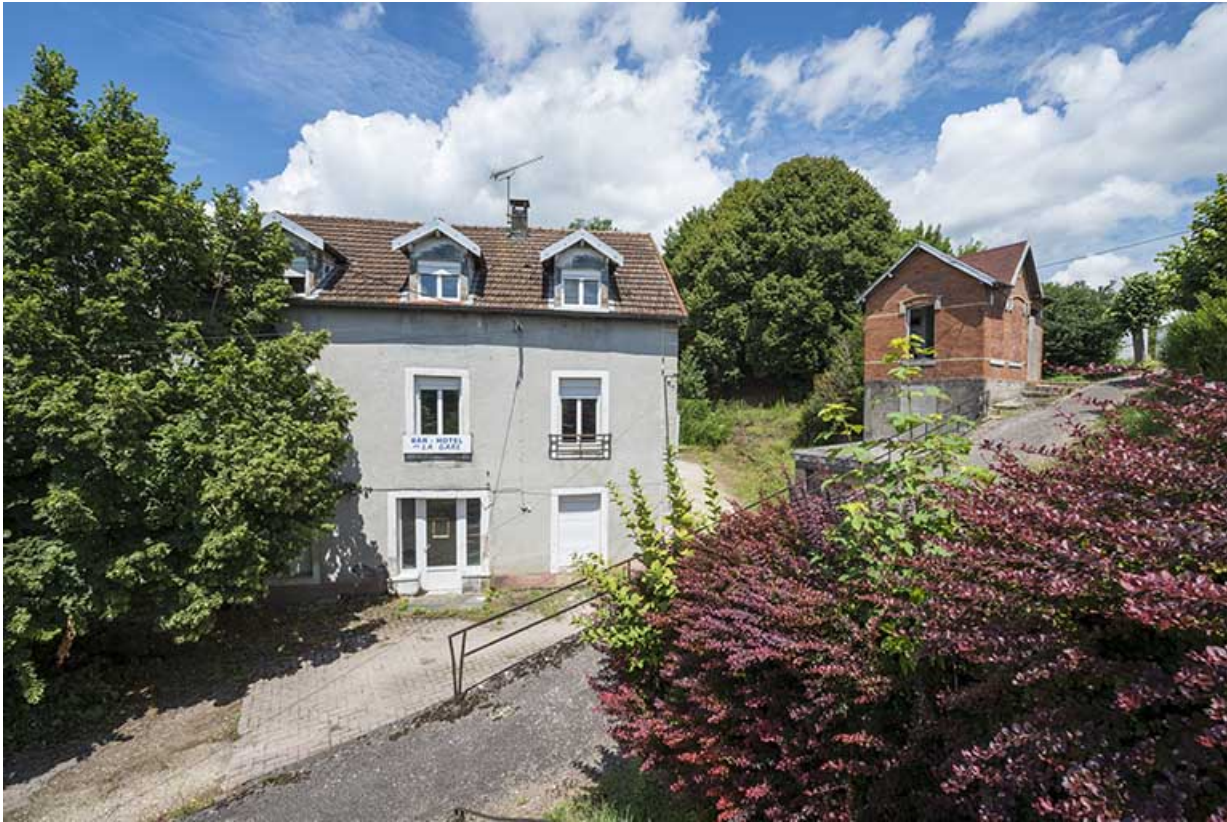
La rue montant vers la gare avec l'ancien café-hôtel en arrière plan.