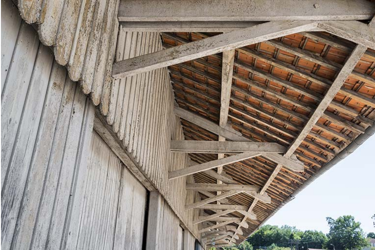
Détail de l'avant-toit de l'ancienne halle.