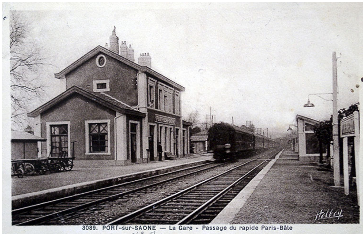
La gare : le bâtiment de voyageurs, carte postale.