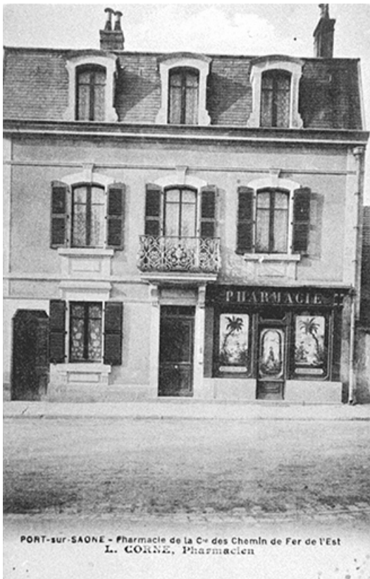
Pharmacie L.Corne, carte postale.

70, Port-sur-Saône, 54 rue François Mitterand