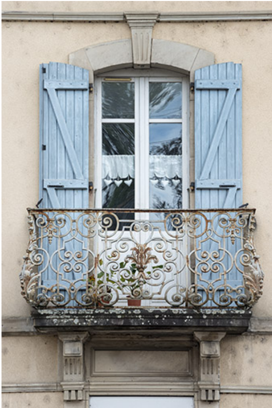
Le balcon, travée centrale.

70, Port-sur-Saône, 54 rue François Mitterand