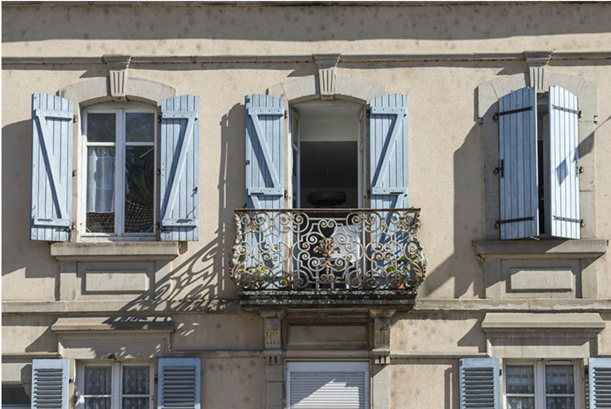
Etage carré, façade antérieure.

70, Port-sur-Saône, 54 rue François Mitterand