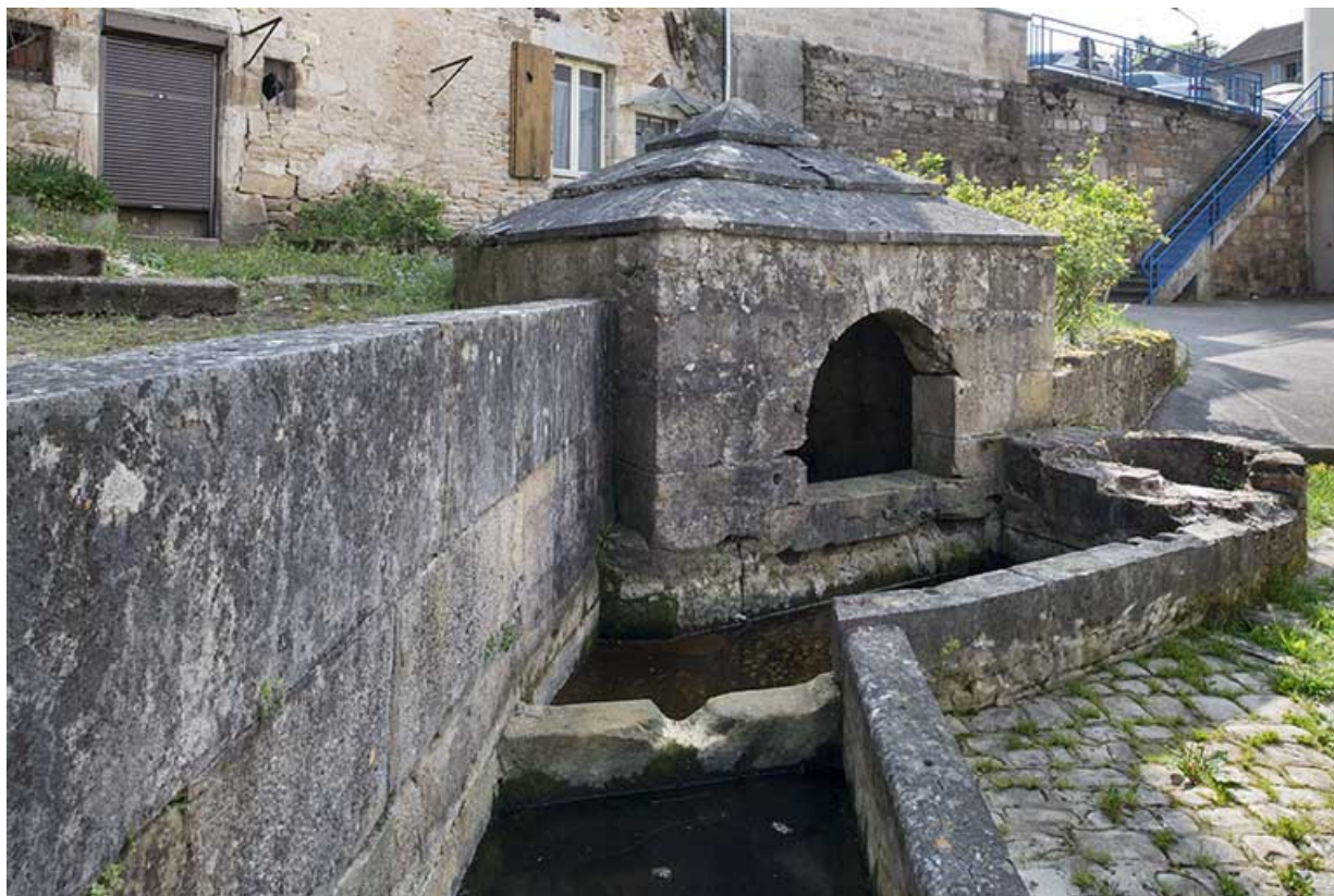
Le puisard et le canal alimentant les bassins.