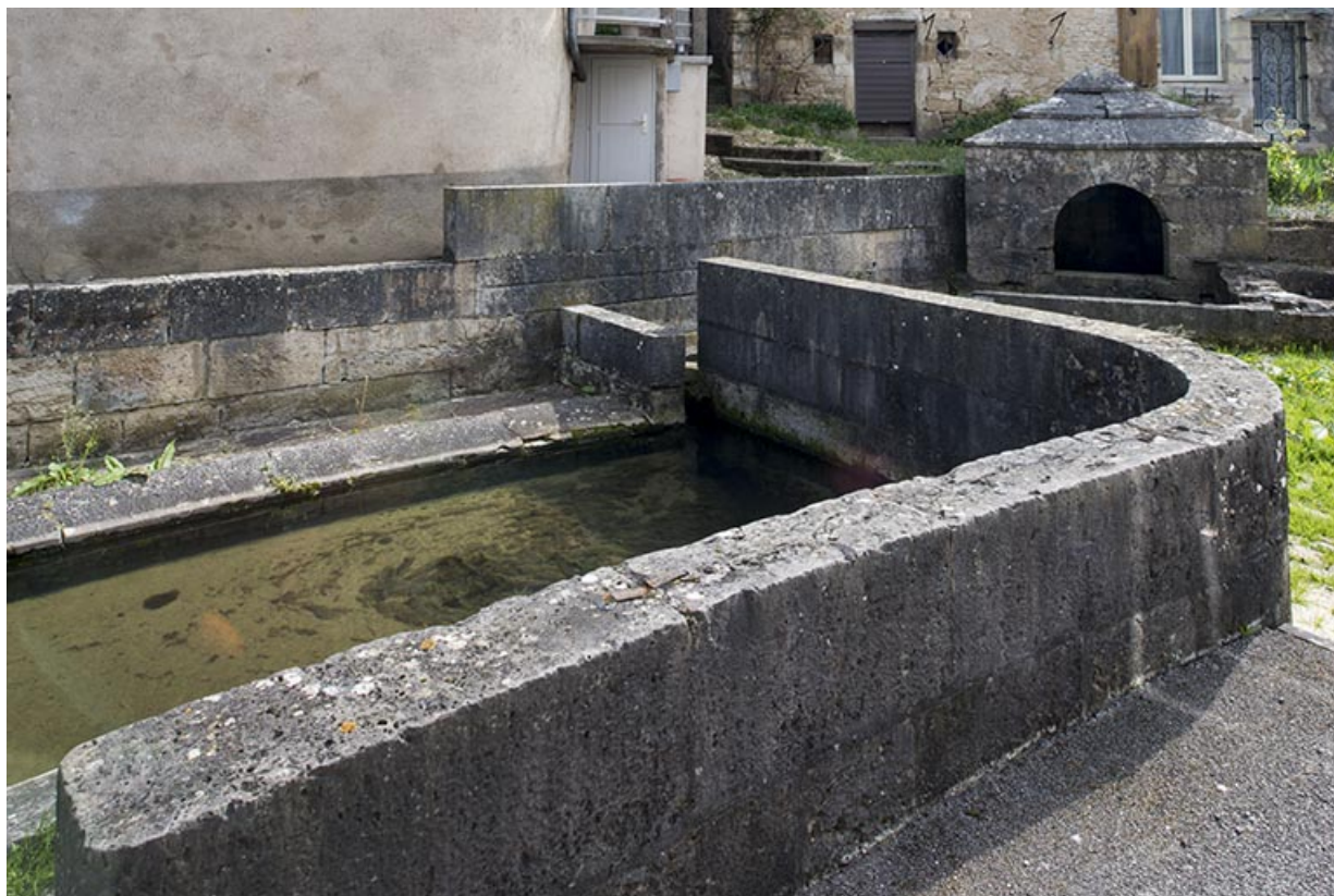
Muret protégeant les laveuses.