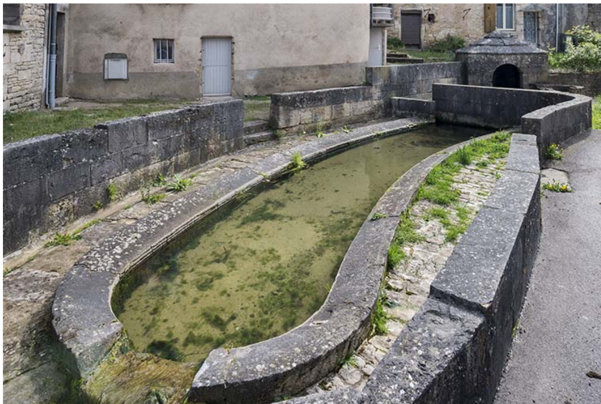
Vue sur le bassin central.