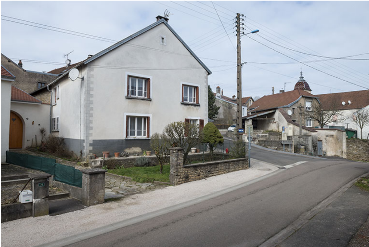
Carrefour au centre du village.