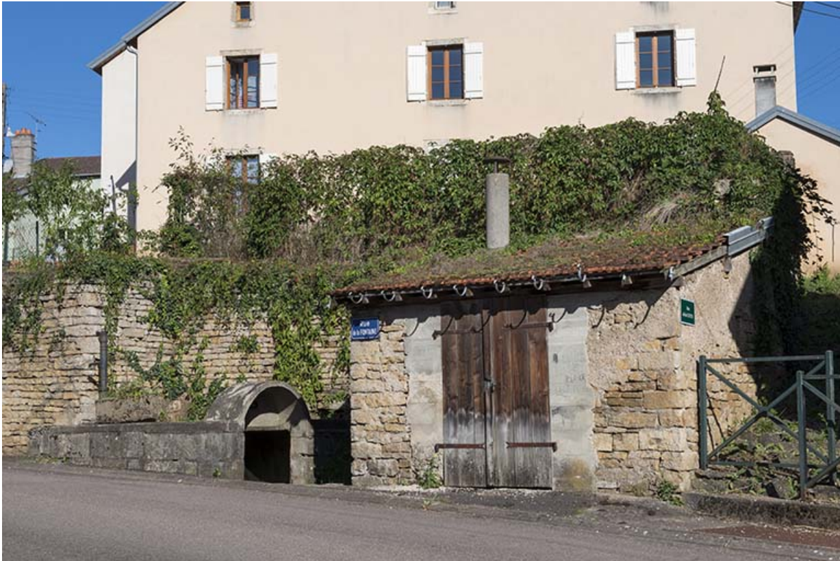
La fontaine, Grande rue.