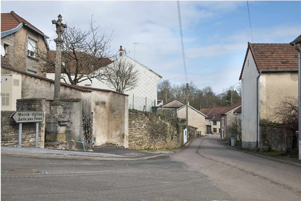
Vue sur une portion de la Grande rue. 70, Conflandey