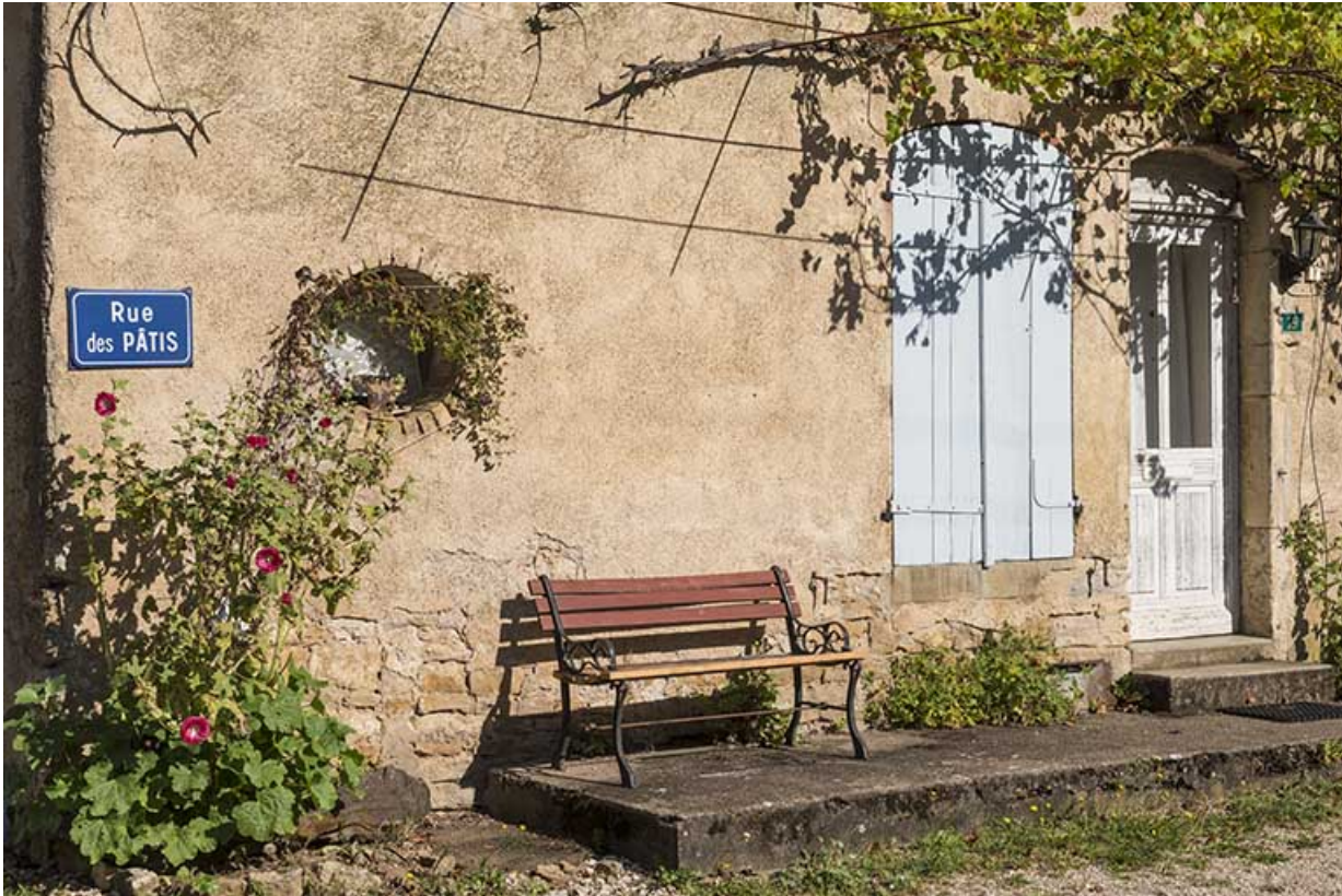
Ferme rue du Pâtis.