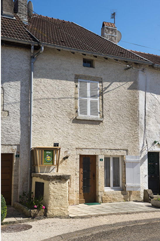
Une des plus anciennes maisons du village. 70, Conflandey