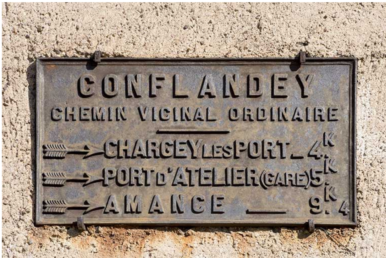
plaque de rue.