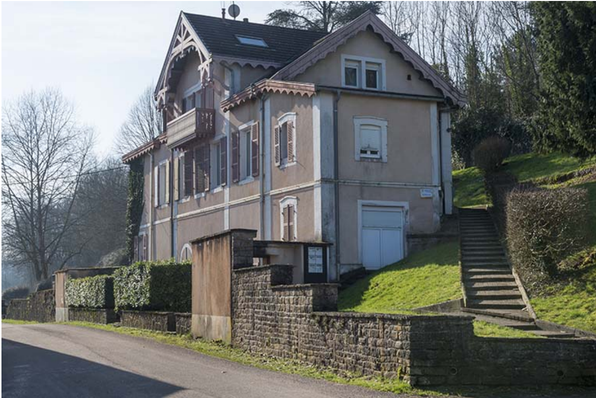
Maison en bordure de rivière.