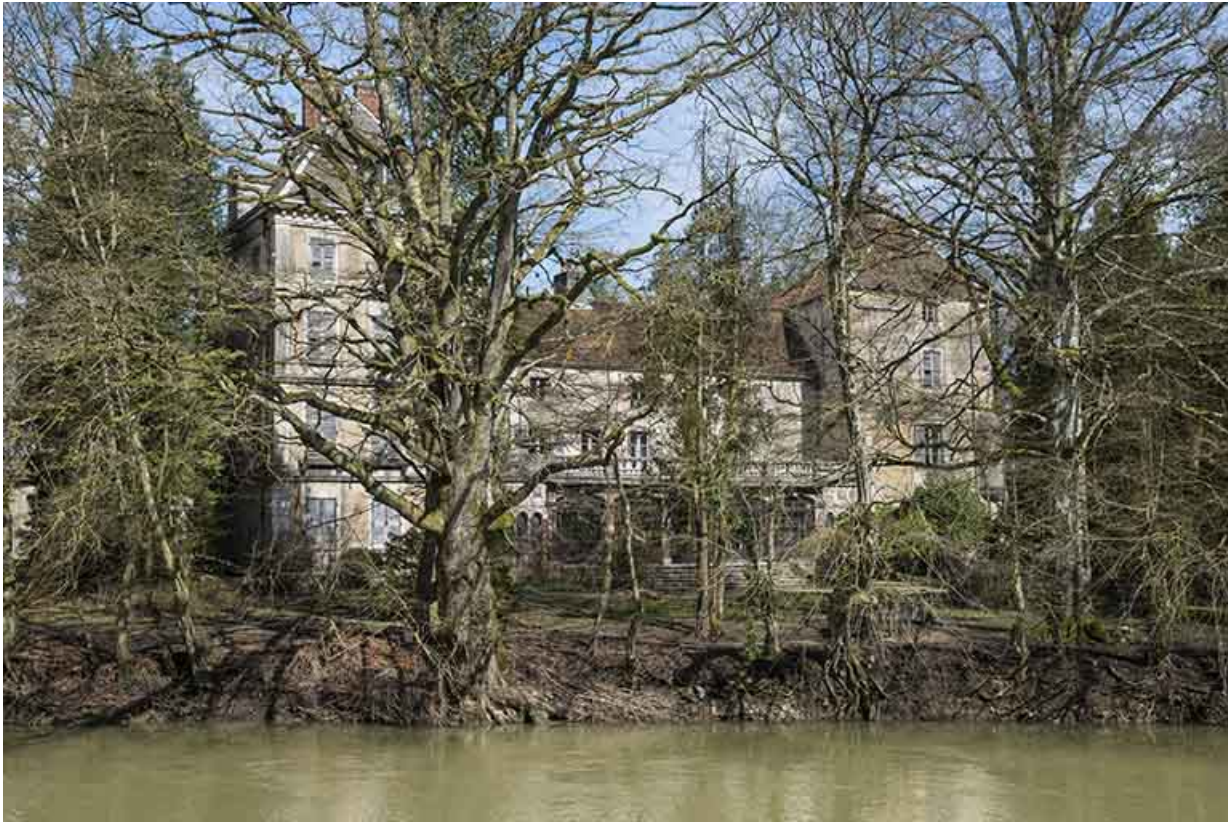
Le château depuis la rive opposée.