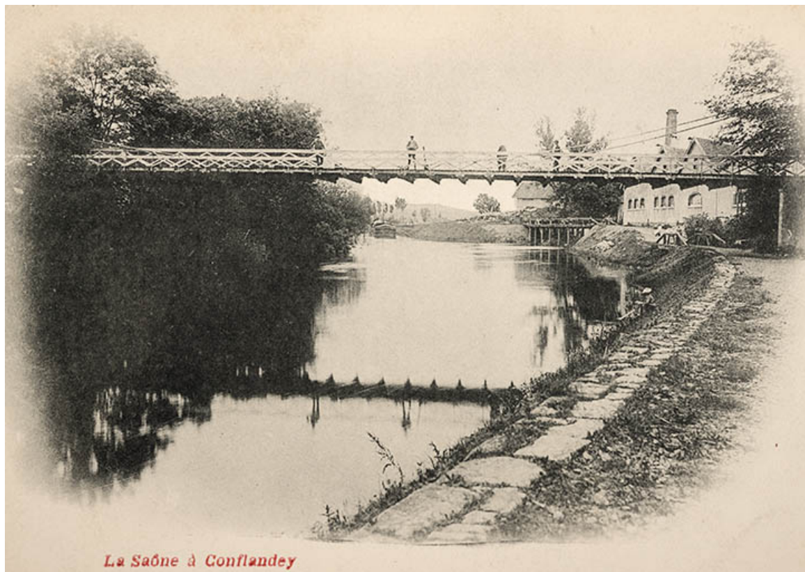
La Saône à Conflandey, carte postale.