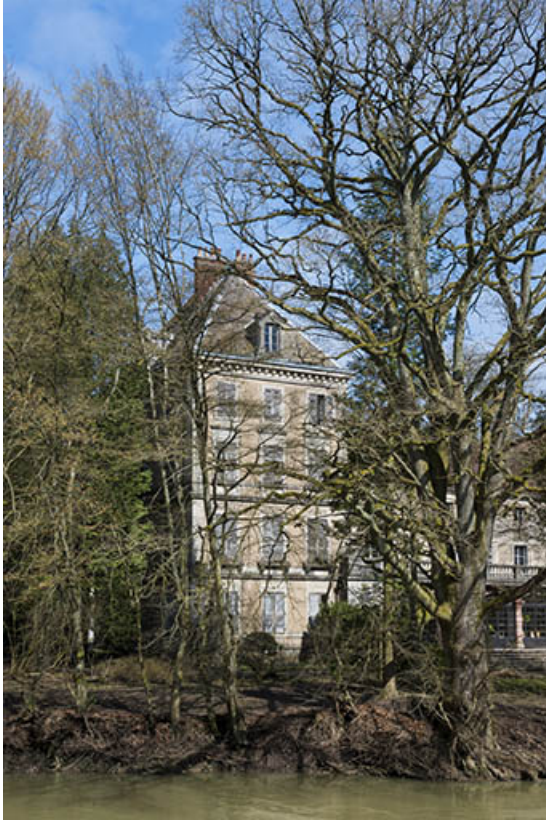
Le pavillon ouest du château.