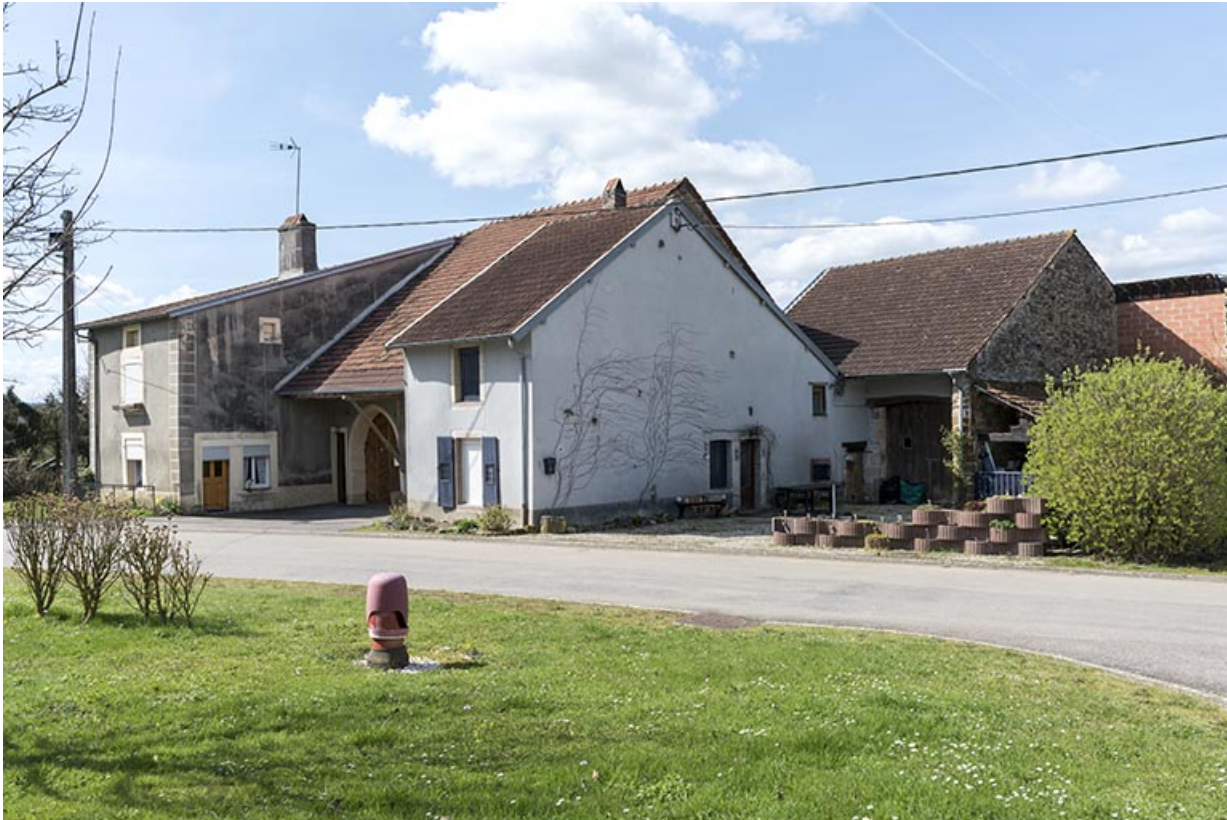
Groupe de maisons-fermes en L : 27, 29 grande rue. 70, Betaucourt