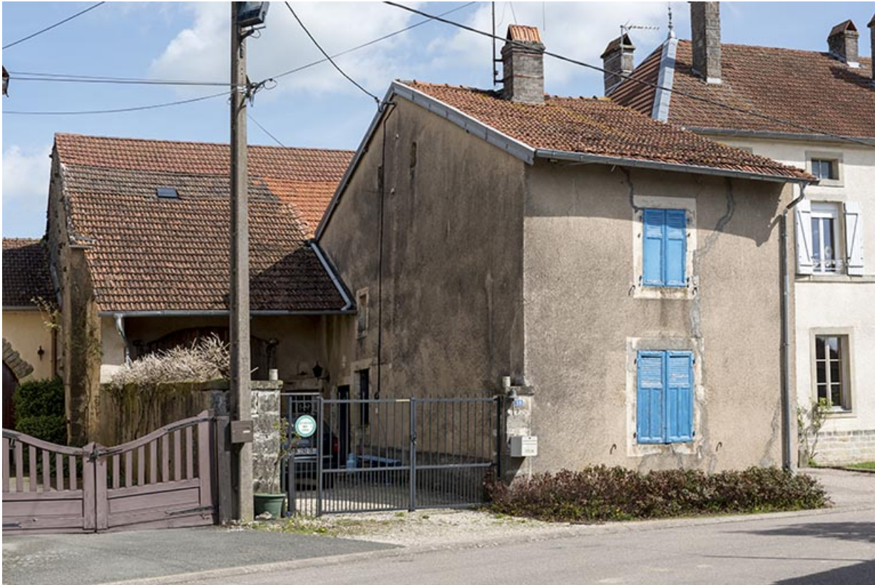
Maison-ferme en L, 18 rue saint-Antoine. 70, Betaucourt