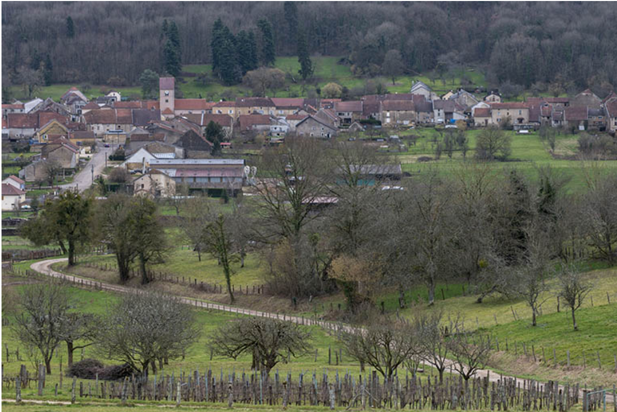
Le village de Purgerot depuis la ferme de la Grande vigne.