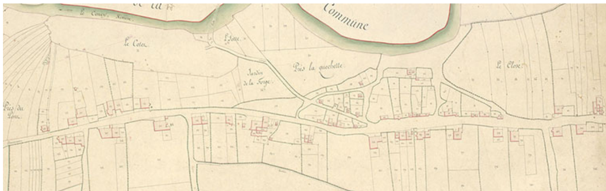
Extrait du cadastre napoléonien levé en 1820 : section A dite du village et des Bruaux.

Cadastre napoléonien, La Basse-Vaivre. Tableau d'assemblage et feuilles de sections. 1820, papier.