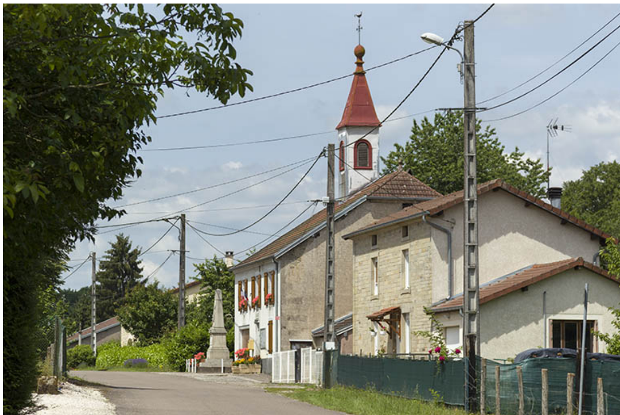
La mairie vue de trois-quart depuis l'est.