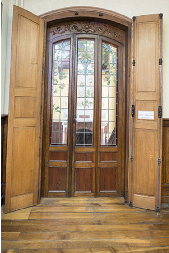
Porte à trois vantaux conduisant à la salle de bal (ou de musique).