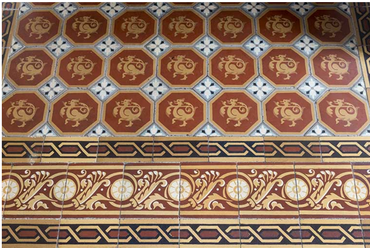
Le carrelage du foyer de la cheminée.

70, Port-sur-Saône, 67 rue François Mitterrand