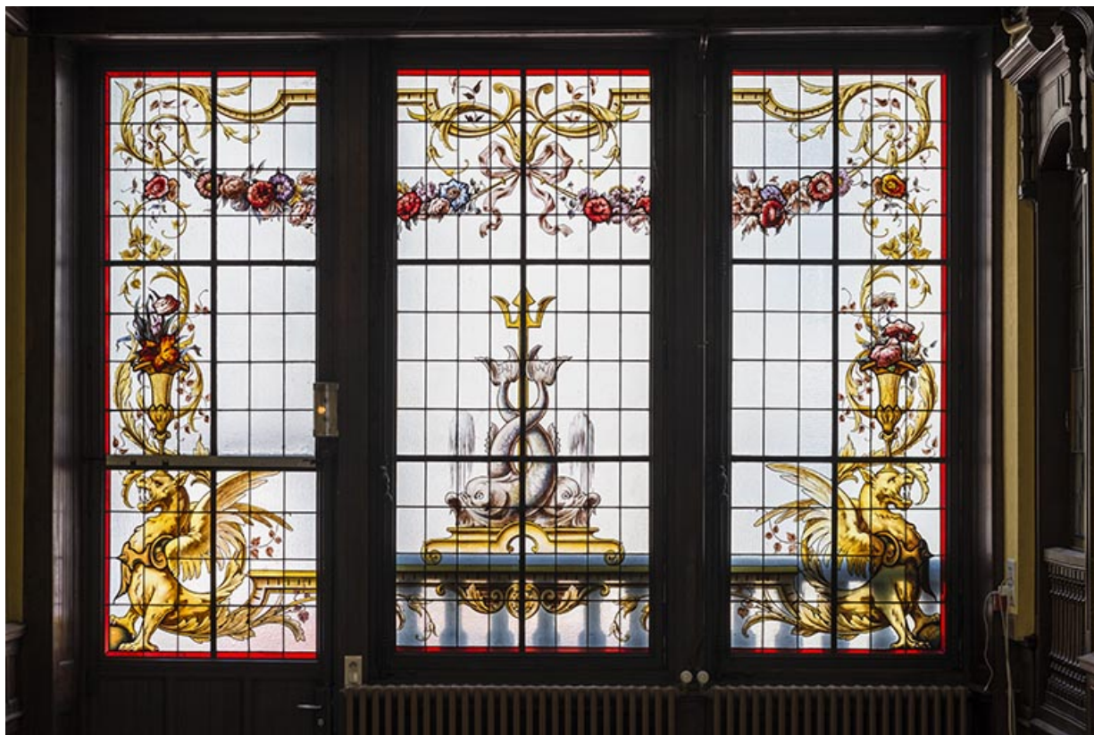
Vue générale de la verrière, côté rue.