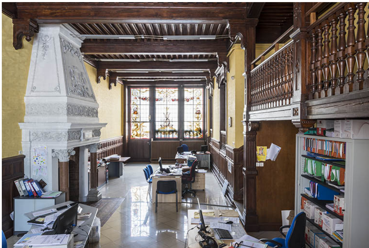
Vue d'ensemble de la salle depuis le sud.

70, Port-sur-Saône, 67 rue François Mitterrand