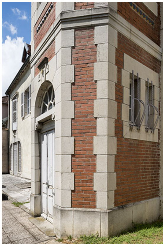
Base de la tourelle avec jeux de chaînages en pierre de taille.

70, Port-sur-Saône, 67 rue François Mitterrand