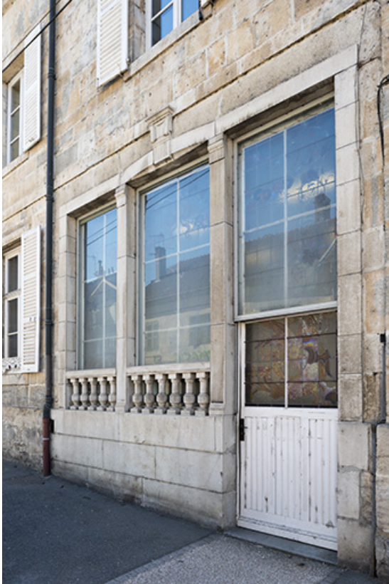
Partie occidentale de la façade antérieure. 70, Port-sur-Saône, 67 rue François Mitterrand