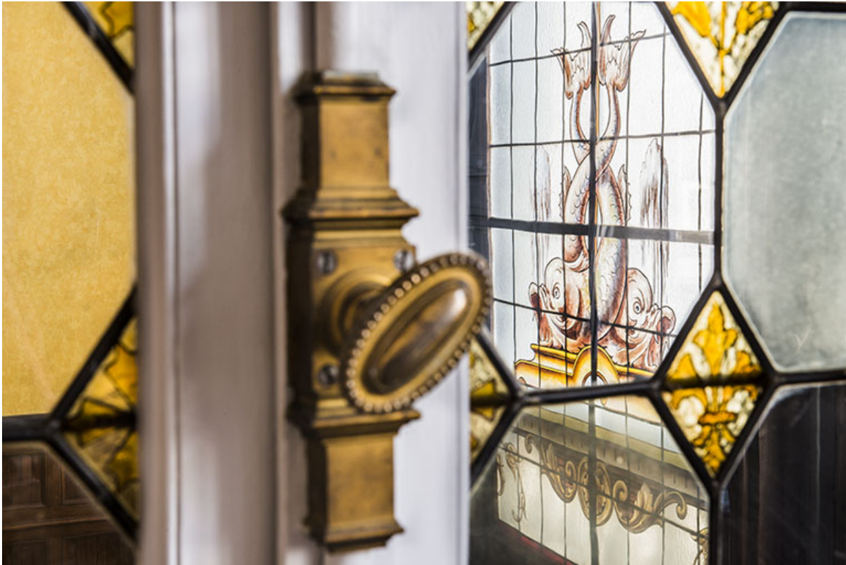
Aperçu de la verrière de la salle de bal par le châssis vitré à motifs géométriques.