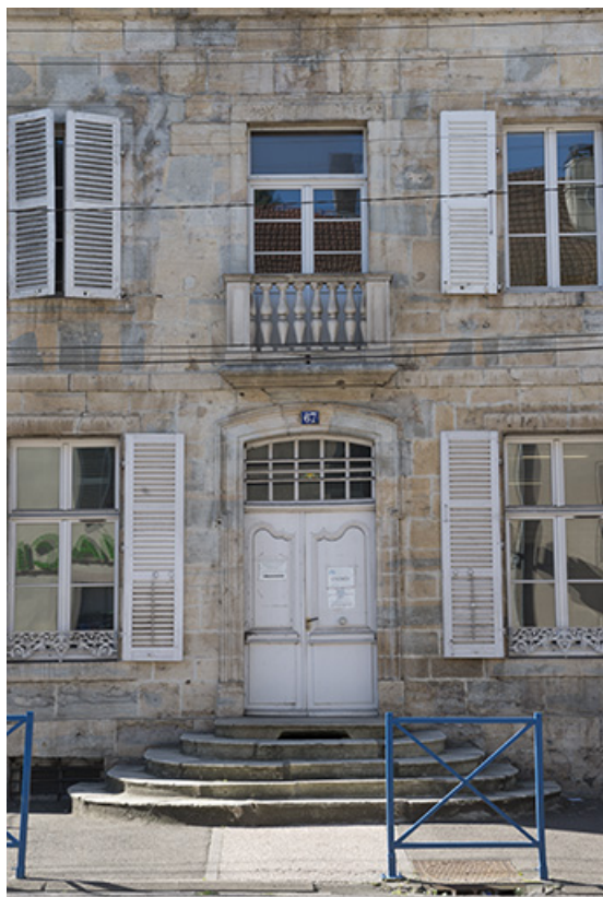
Vue de la travée principale, façade antérieure.

70, Port-sur-Saône, 67 rue François Mitterrand