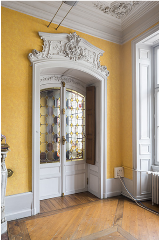
Porte à chassis vitré conduisant à la salle de bal (ou de musique).