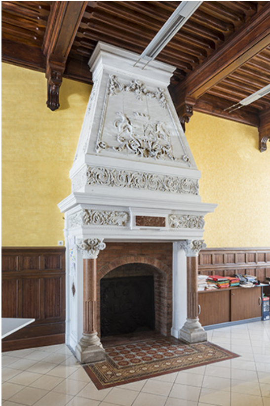
La cheminée à décor factice.

70, Port-sur-Saône, 67 rue François Mitterrand