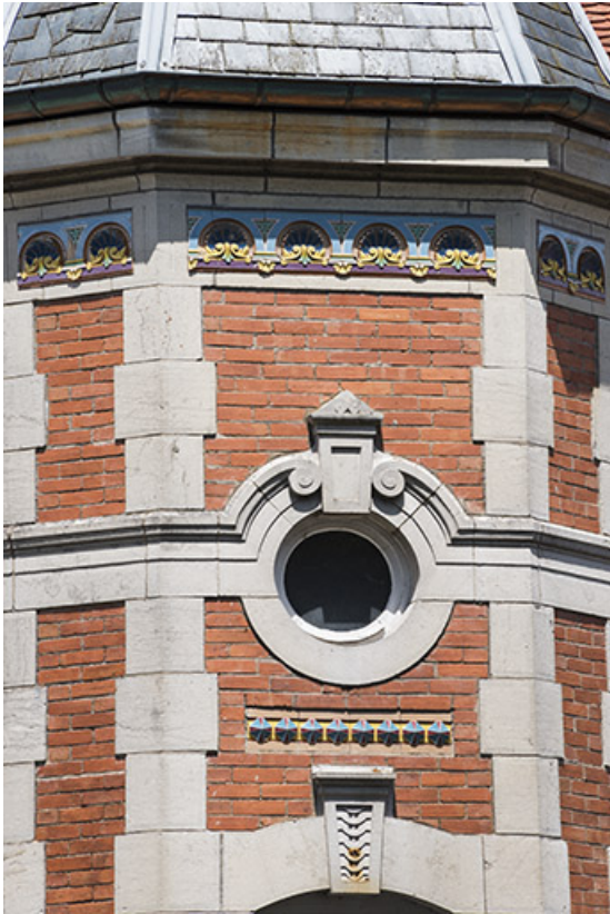
Détail de l'oculus central de la partie supérieure.

70, Port-sur-Saône, 67 rue François Mitterrand