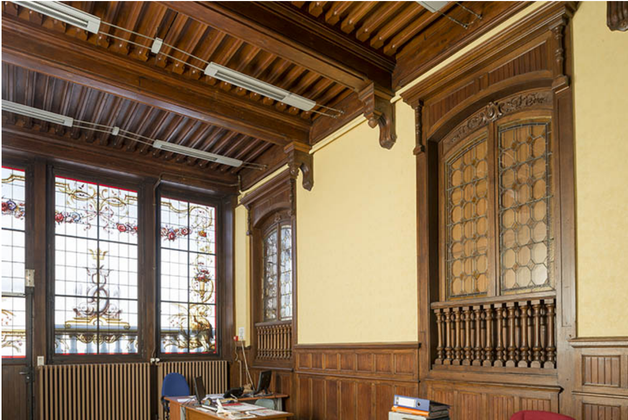
Vue partielle de la salle de bal : la verrière côté rue.