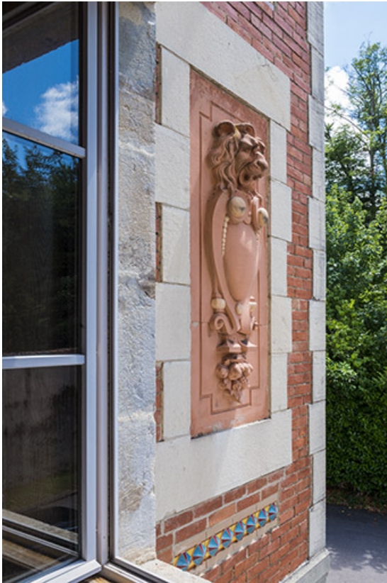
Détail du bas-relief représentant une tête de lion.

70, Port-sur-Saône, 67 rue François Mitterrand