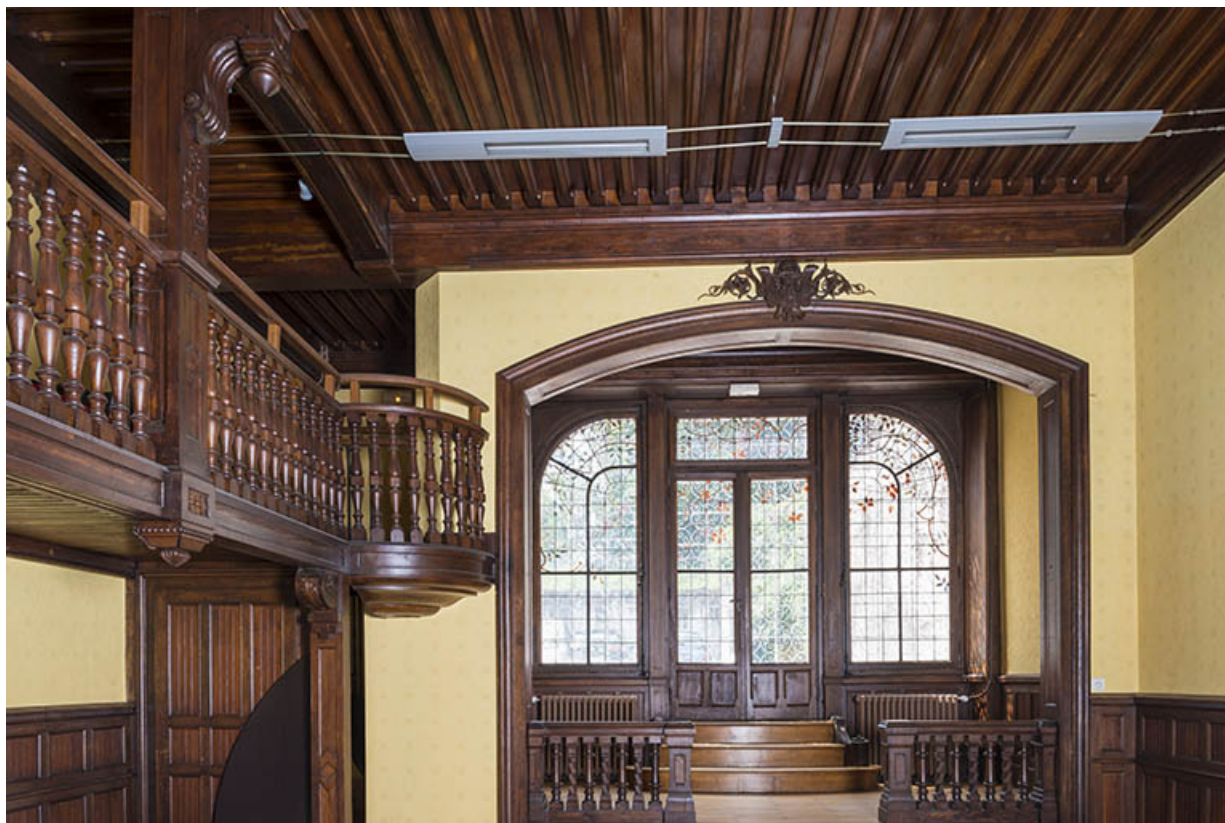
Vue partielle de la salle de bal : la verrière côté cour.