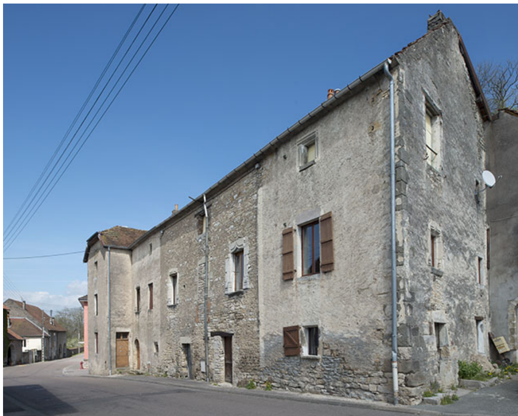
Vue générale de l'édifice depuis le Sud.