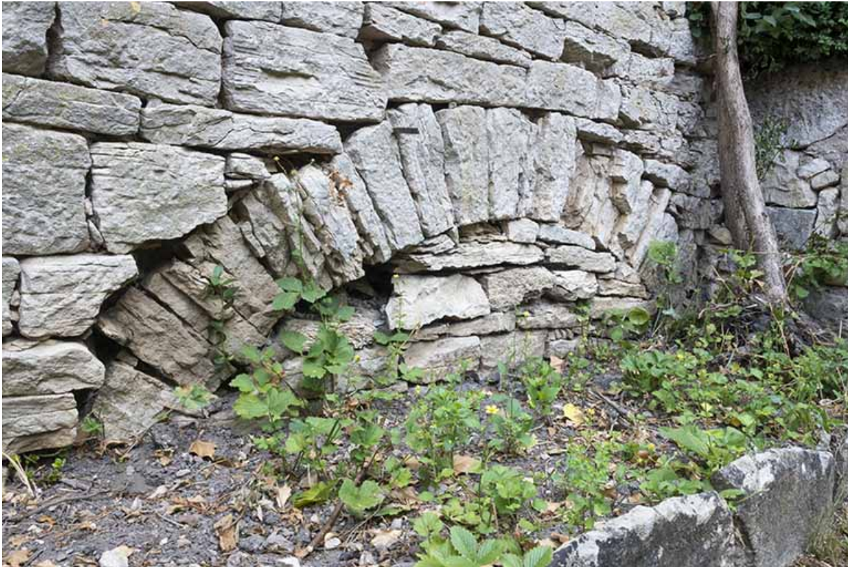
Détail sur la maçonnerie d'une voûte.