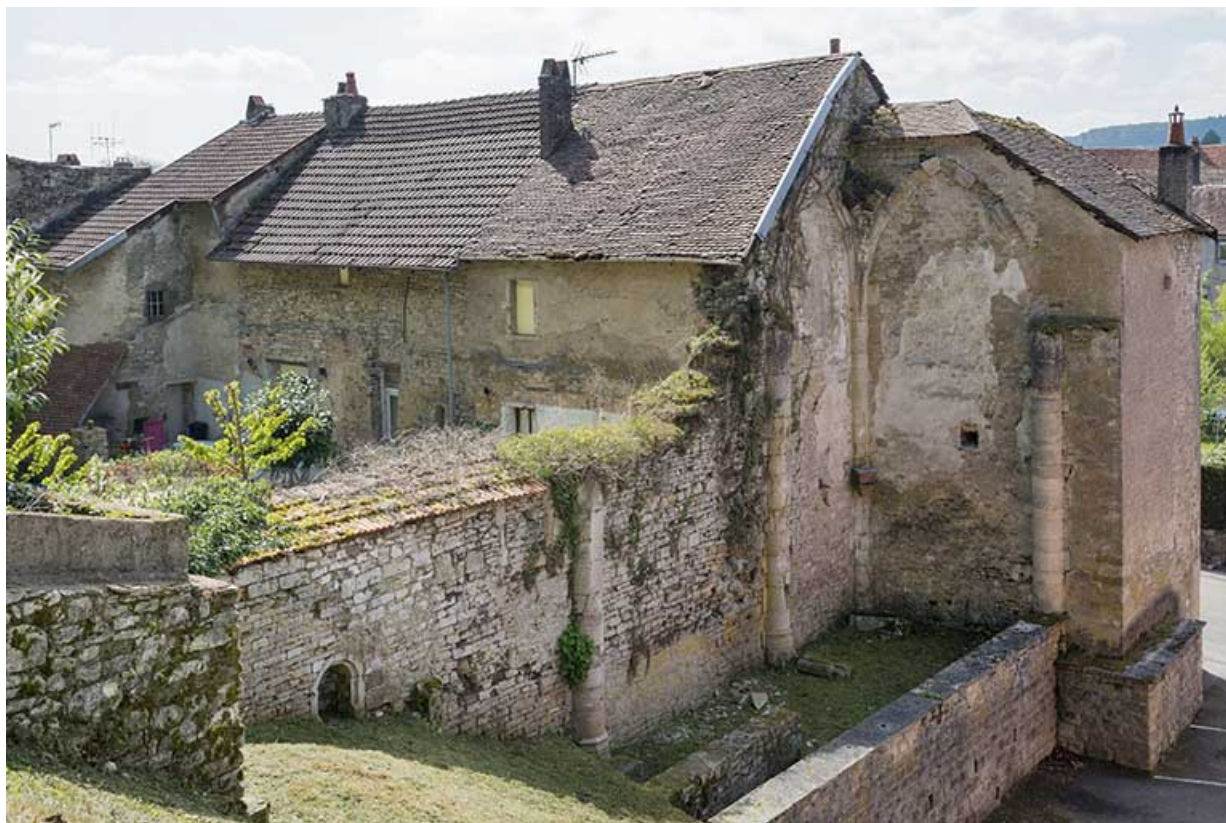
Ruines de l'ancienne église.