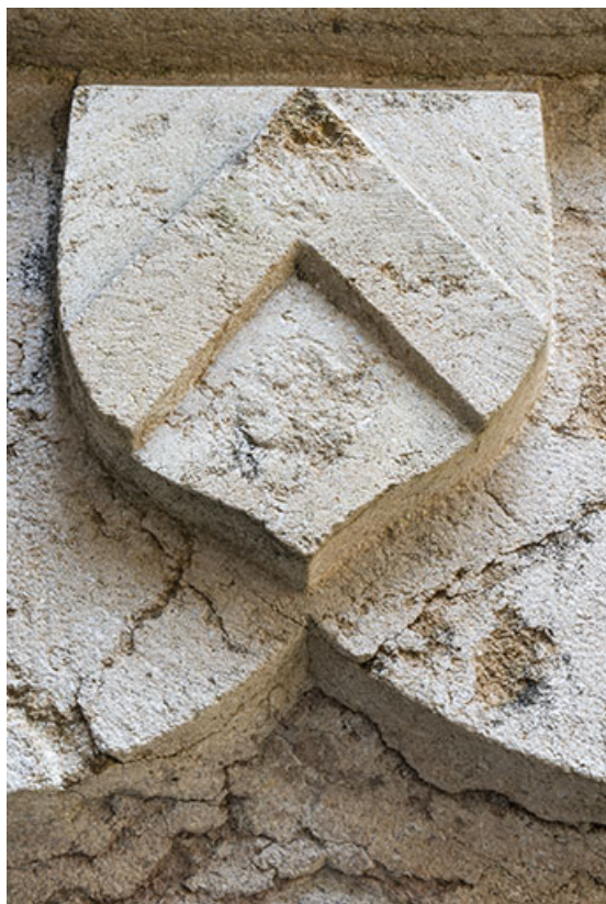
Blason situé au dessus de la porte d'accès à la tour depuis la cour intérieure. 70, Port-sur-Saône rue de l' Église