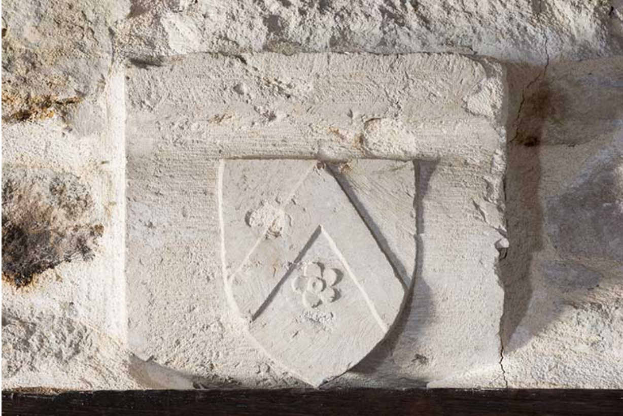
Blason situé au premier étage. 70, Port-sur-Saône rue de l'Église