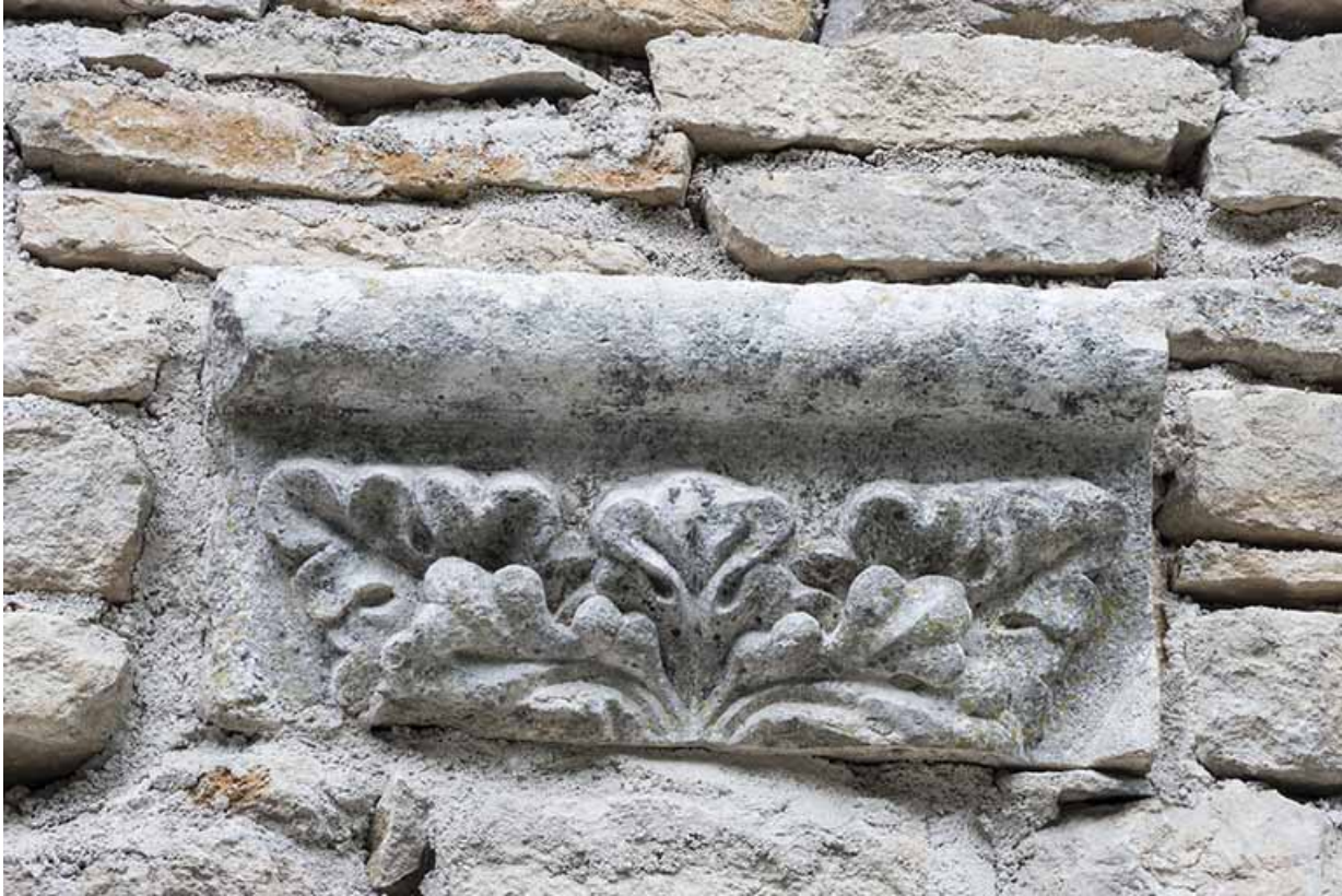
Fragment d'un chapiteau, façade côté cour. 70, Port-sur-Saône rue de l' Église