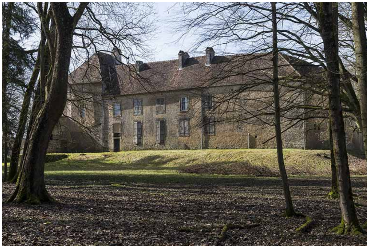
Façade Est du château.