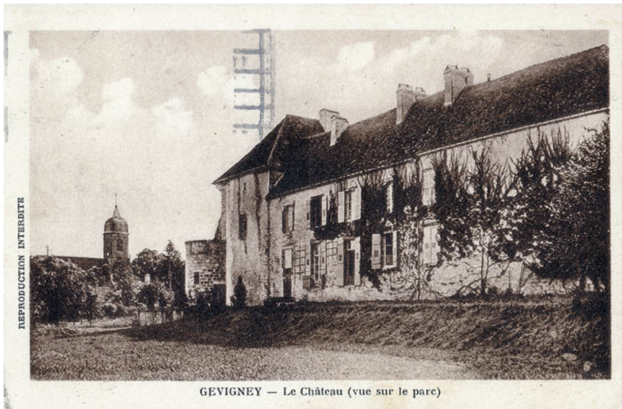
Le château, vue depuis le parc, carte postale.