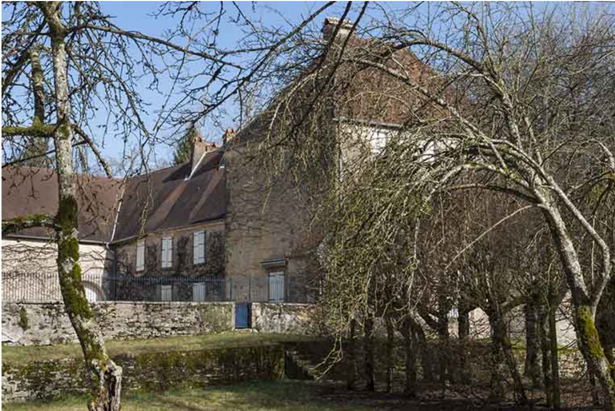
Partie donnant sur la cour intérieure de l'édifice.