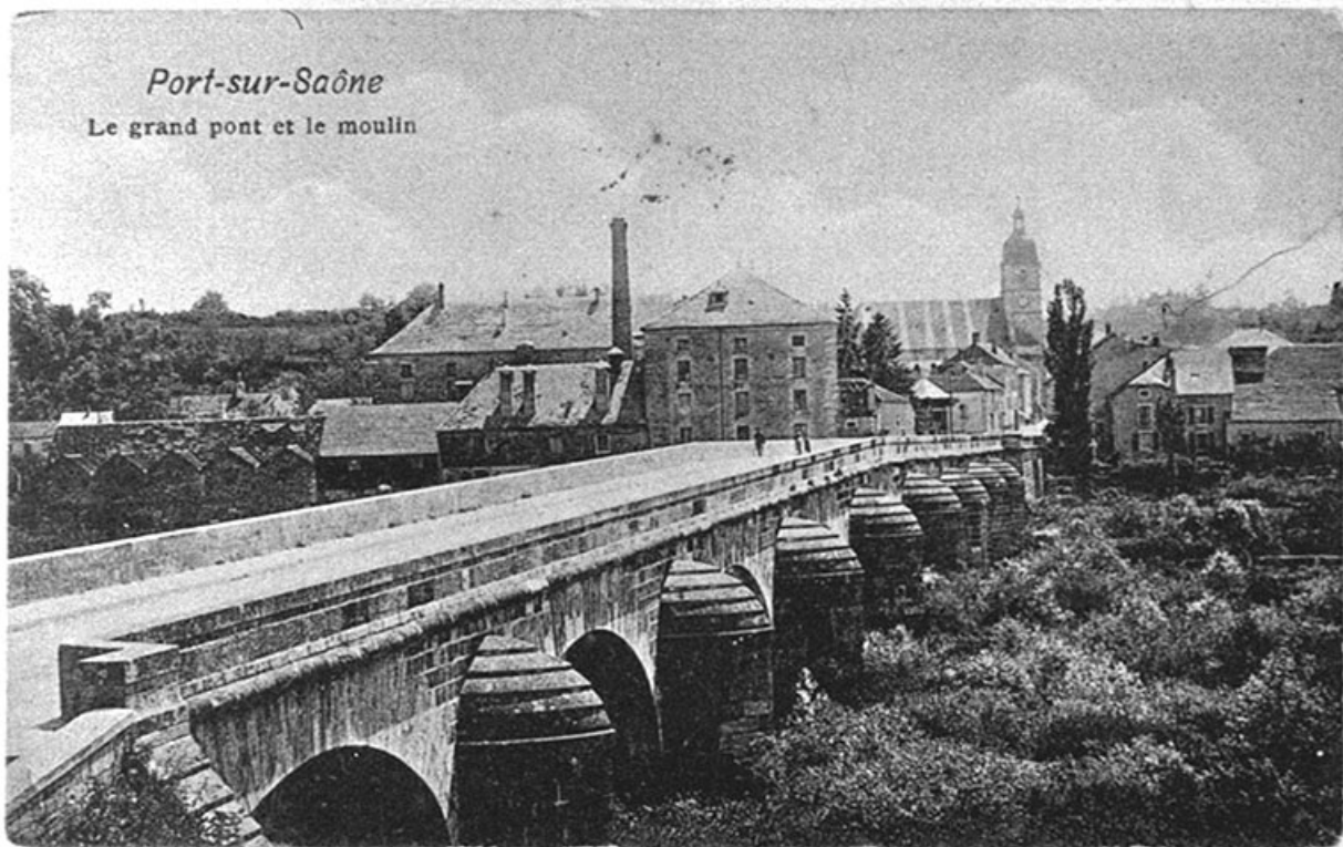
Le pont, carte postale. 70, Port-sur-Saône