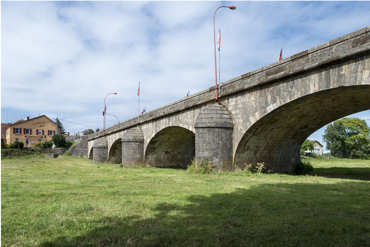
Vue depuis l'aval. 70, Port-sur-Saône