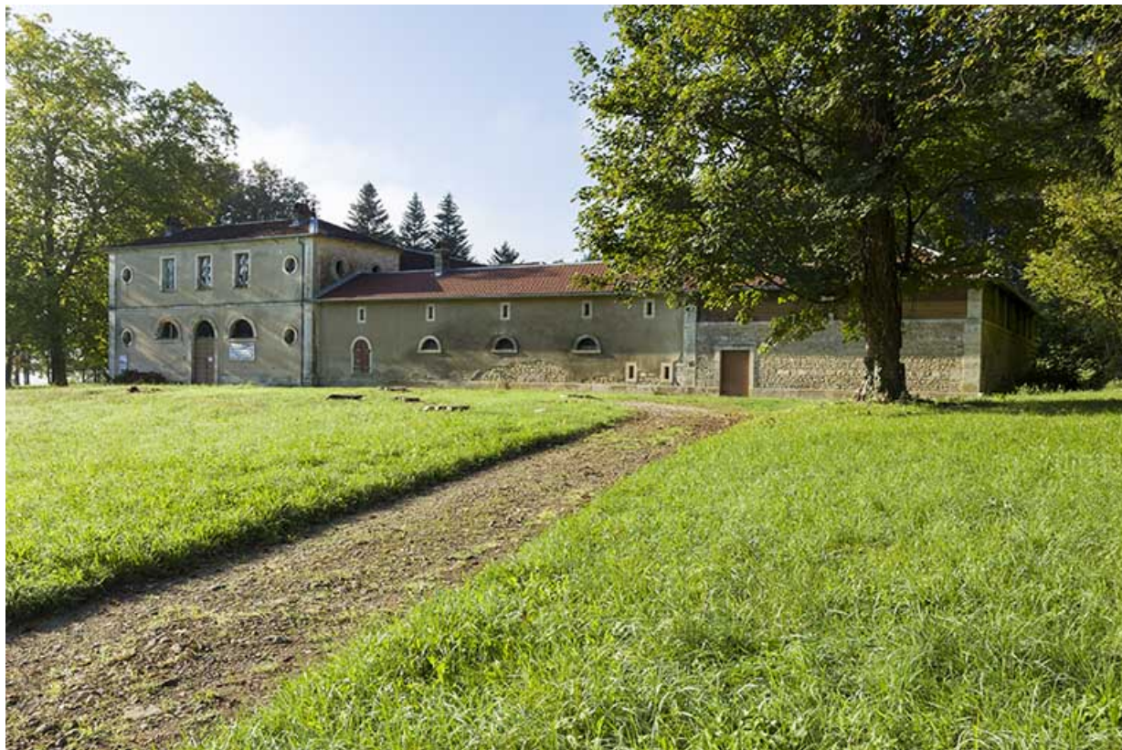
Façade latérale droite de la ferme.