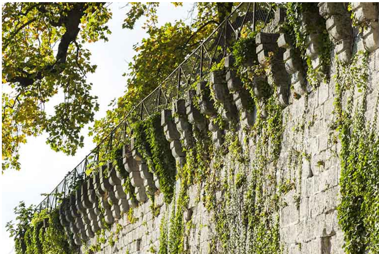
Détail de l'enceinte, au nord-est.