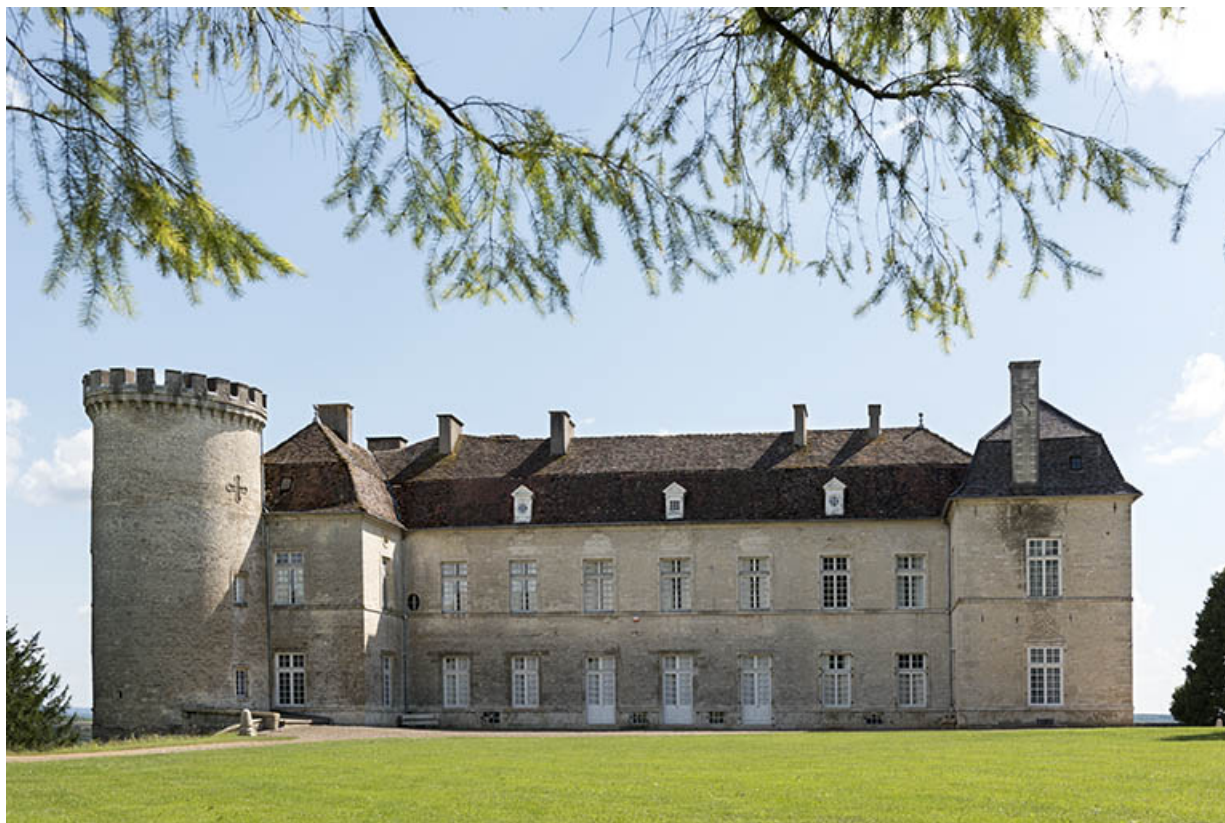
Vue générale de la façade nord.