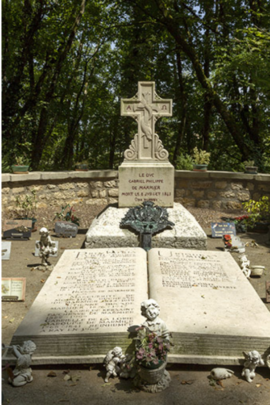
Tombeau de la famille de Marmier.