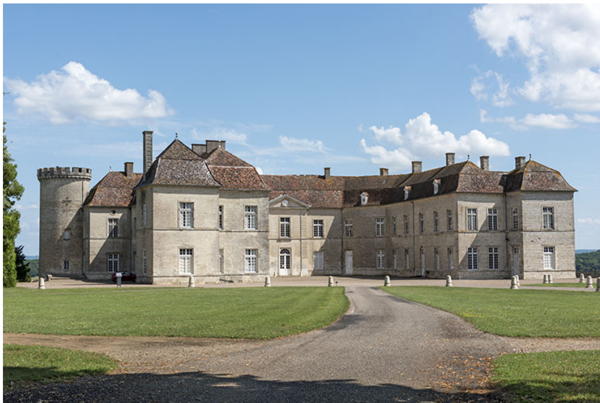
Vue générale de la cour d'honneur de trois quart gauche.