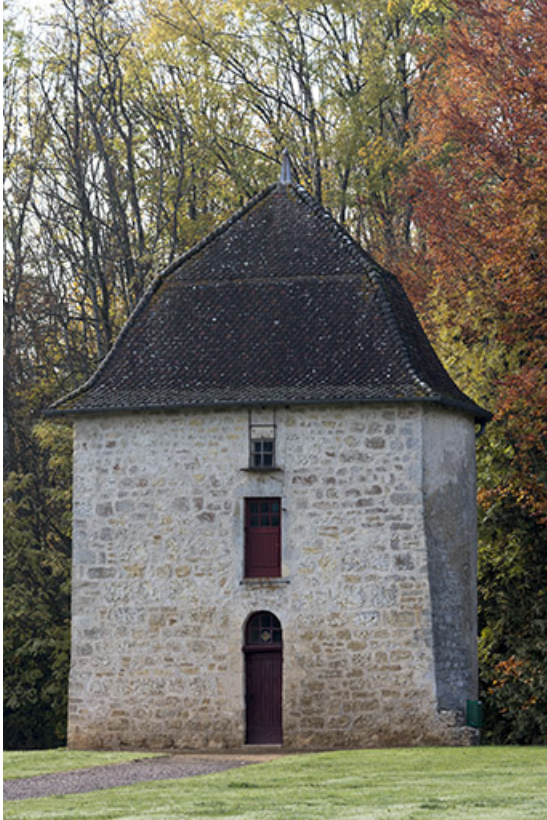
La tour tranchée.