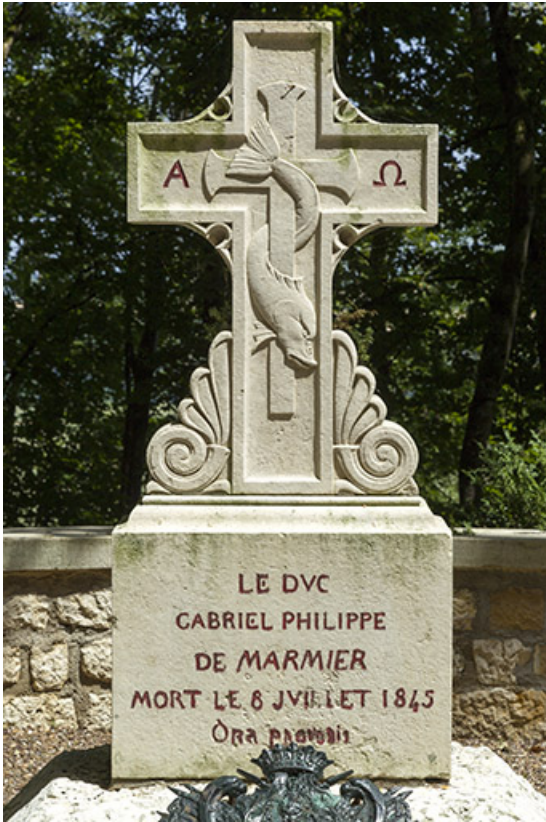
Tombeau de la famille de Marmier : détail de la croix et de l'épithaphe. 70, Ray-sur-Saône