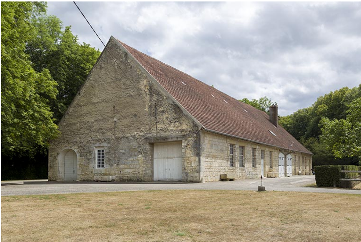
Vue de trois quarts de l'ancien manège.