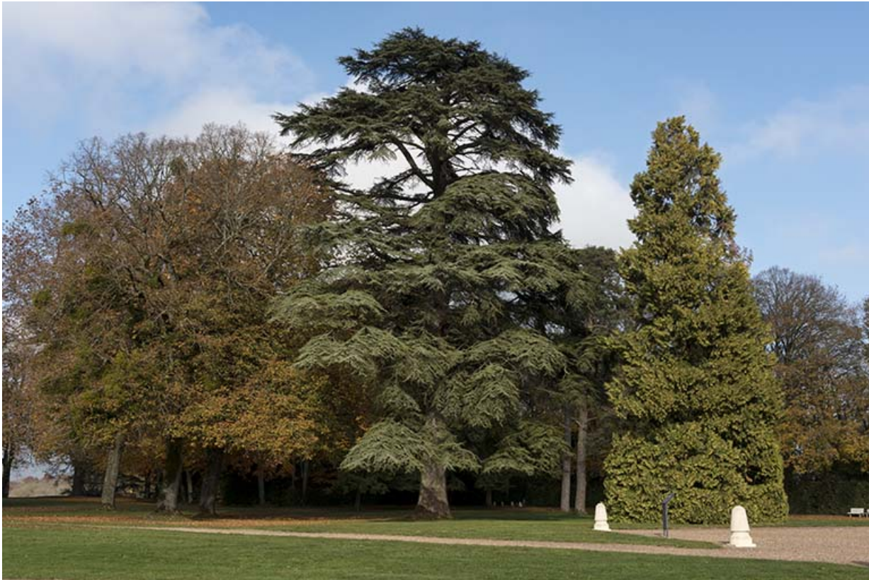
Vue partielle du parc.