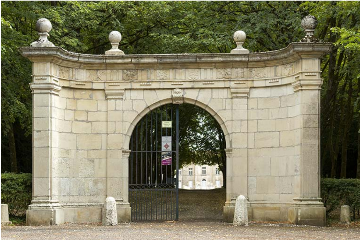
Portail à l'entrée du parc. 70, Ray-sur-Saône