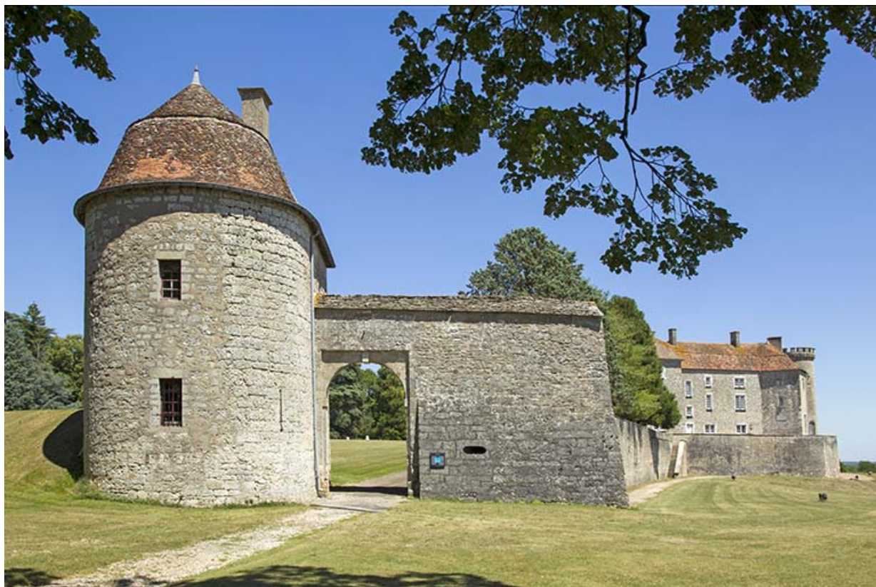
La tour du guet. 70, Ray-sur-Saône