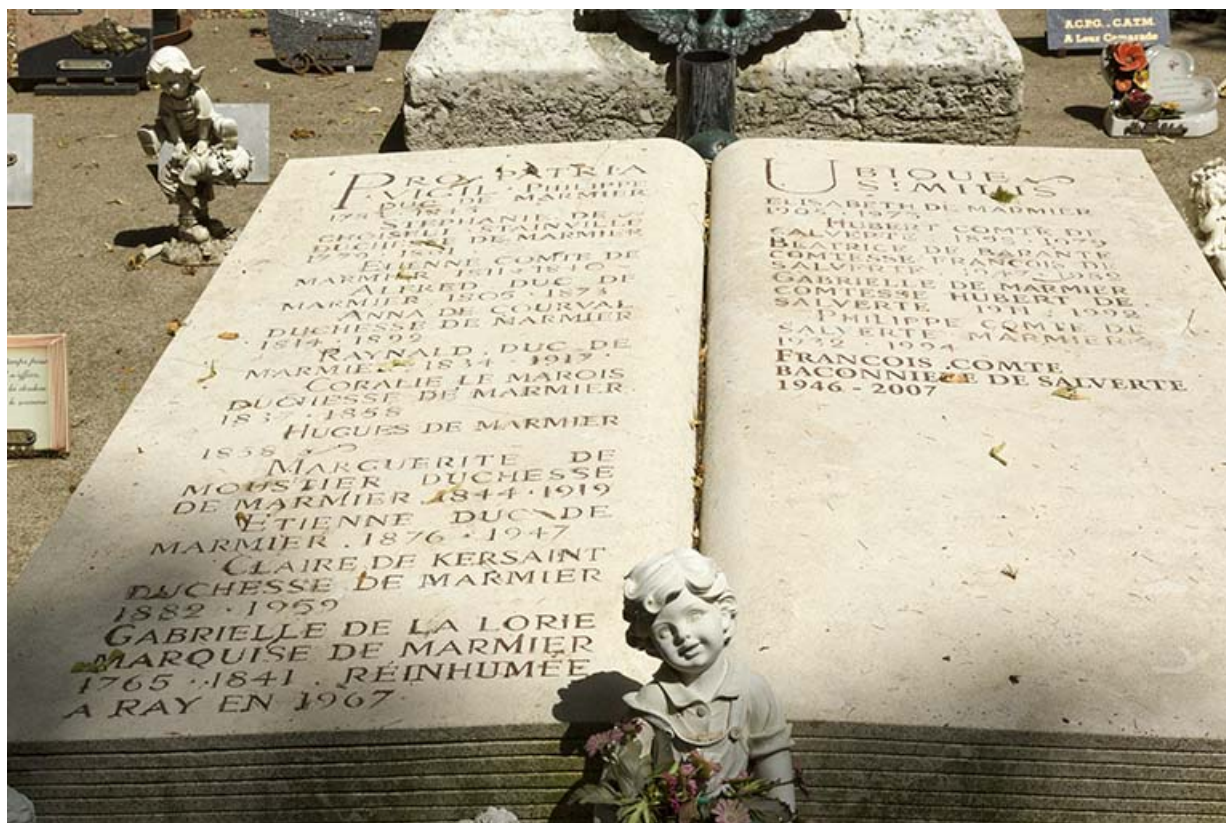
Tombeau de la famille de Marmier : vue rapprochée.