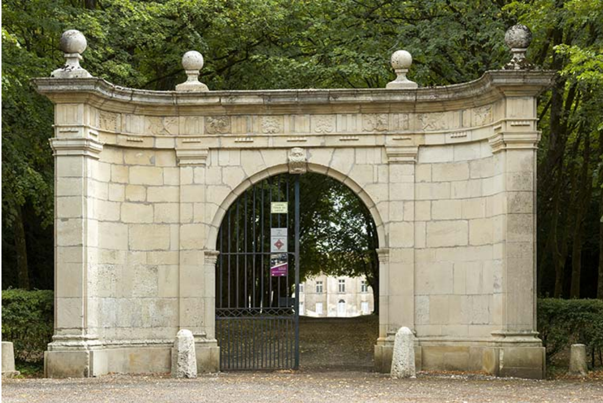
Portail à l'entrée du parc.