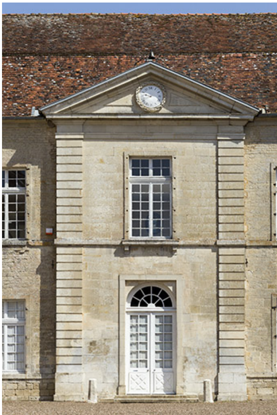
Façade sur la cour d'honneur (façade ouest) : travée centrale. 70, Ray-sur-Saône