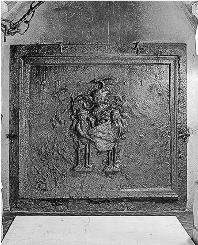
Intérieur : plaque de cheminée de la grande salle d'armes. 70, Ray-sur-Saône