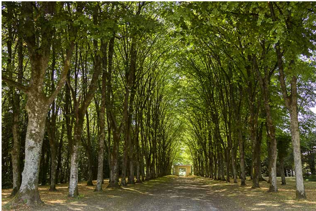
L'allée bordée de tilleuls, vue en direction du portail.