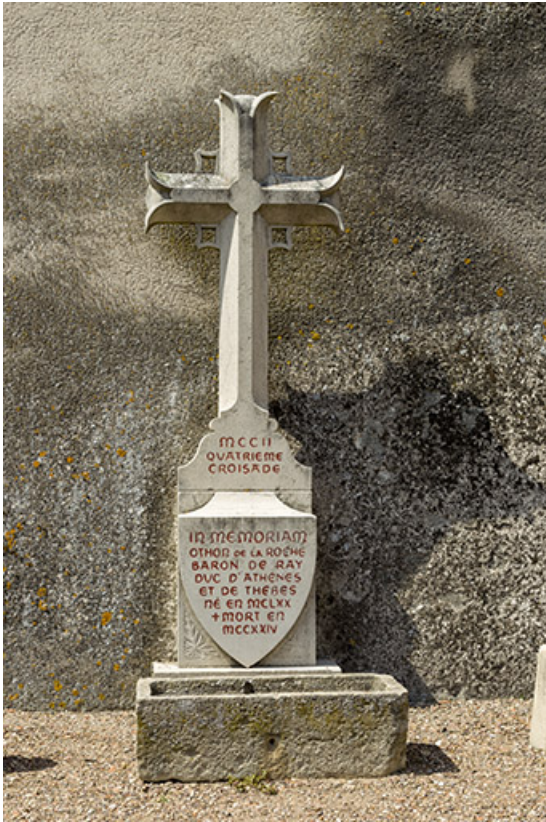
Monument funéraire d'Othon de la Roche.