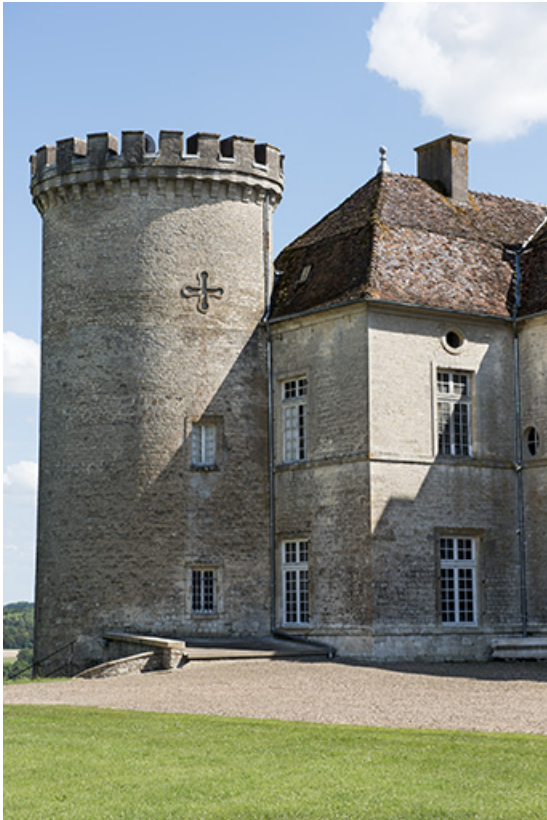
La tour à l'angle nord-ouest.