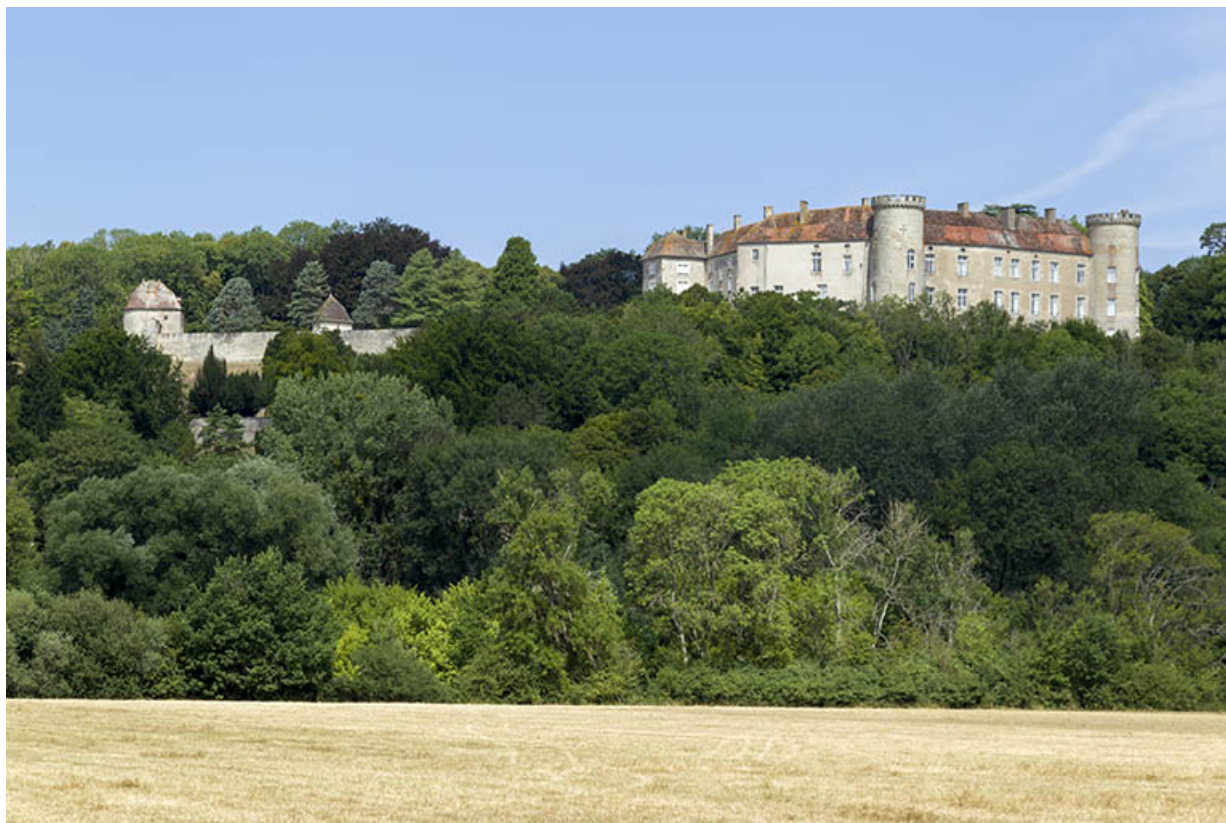
Vue générale depuis le sud-est.