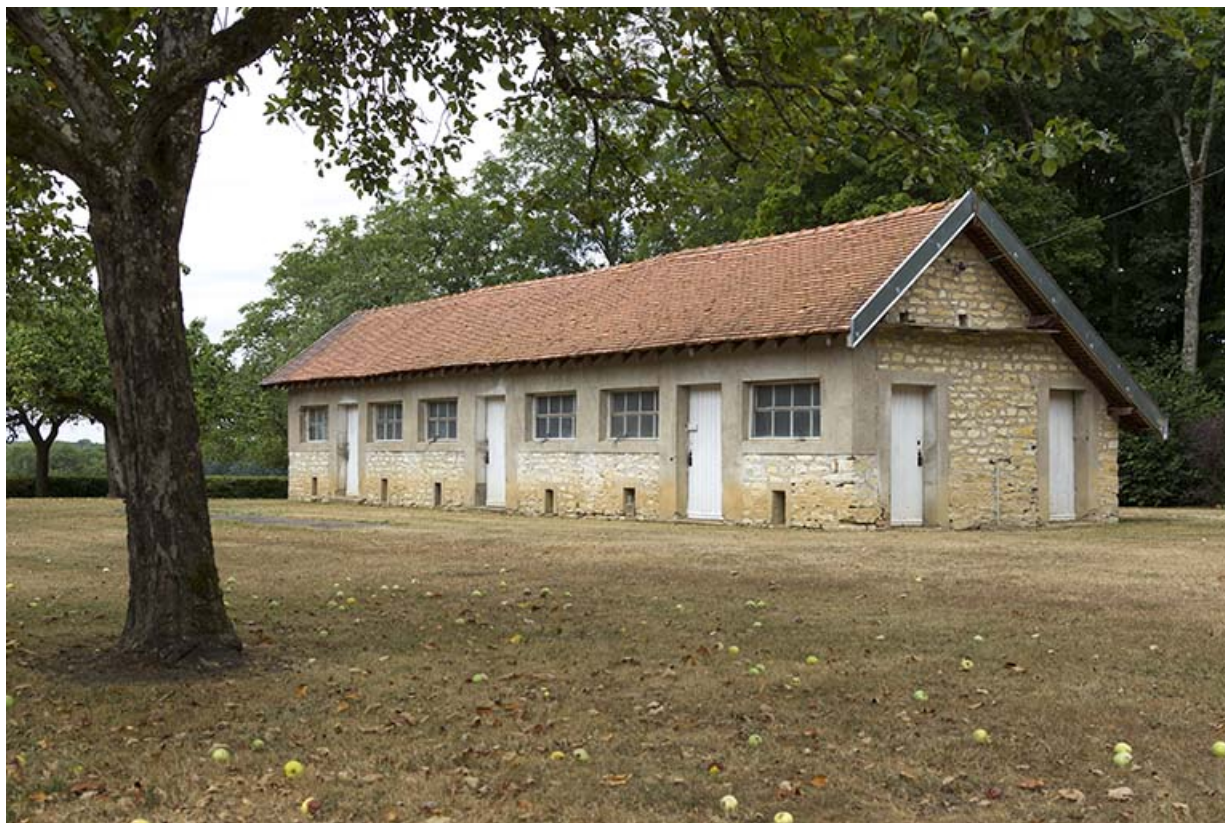
Ancien poulailler (milieu 20e siècle). 70, Ray-sur-Saône