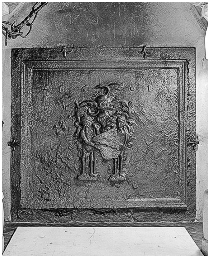
Intérieur : plaque de cheminée de la grande salle d'armes. 70, Ray-sur-Saône