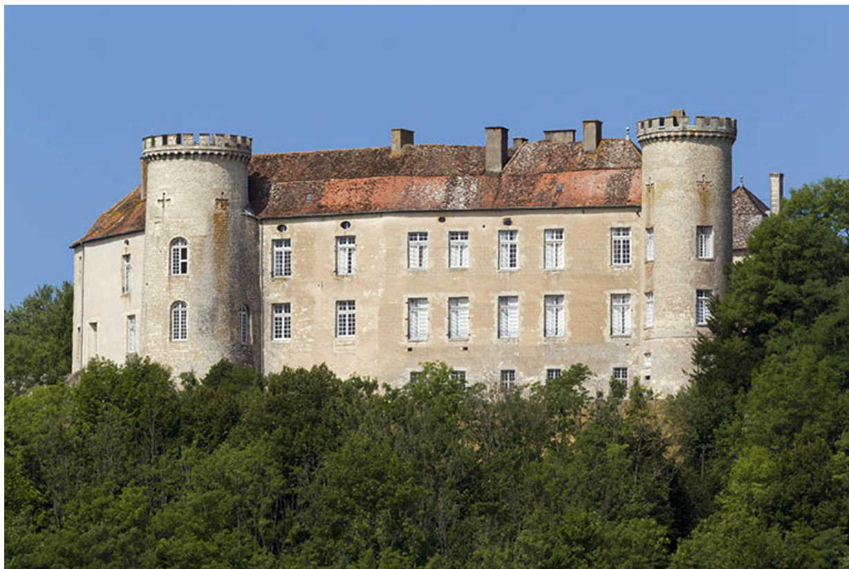
Vue générale de la façade est.