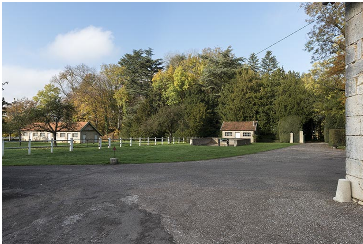
Vue générale de deux bâtiments du milieu du 20e siècle : poulailler à gauche et porcherie à droite. 70, Ray-sur-Saône