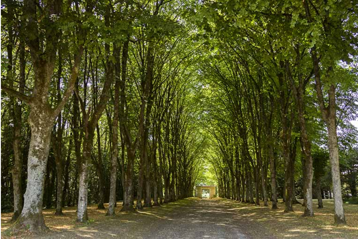
L'allée bordée de tilleuls, vue en direction du portail.