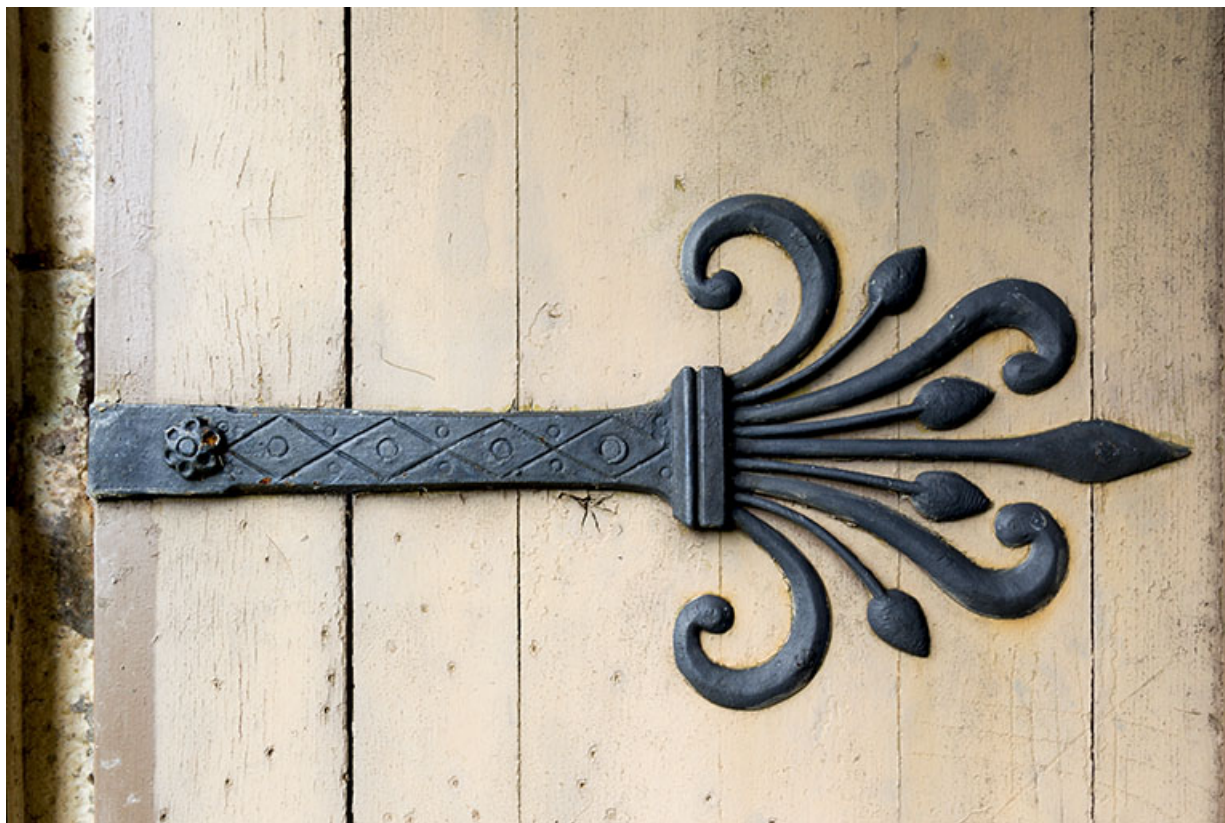
Détail ornemental de la porte d'entrée.