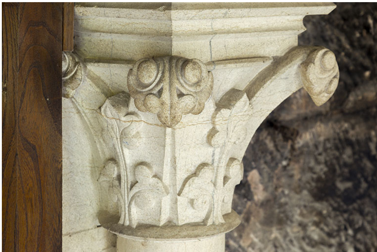
Détail : le chapiteau d'une des colonnes de la cheminée.