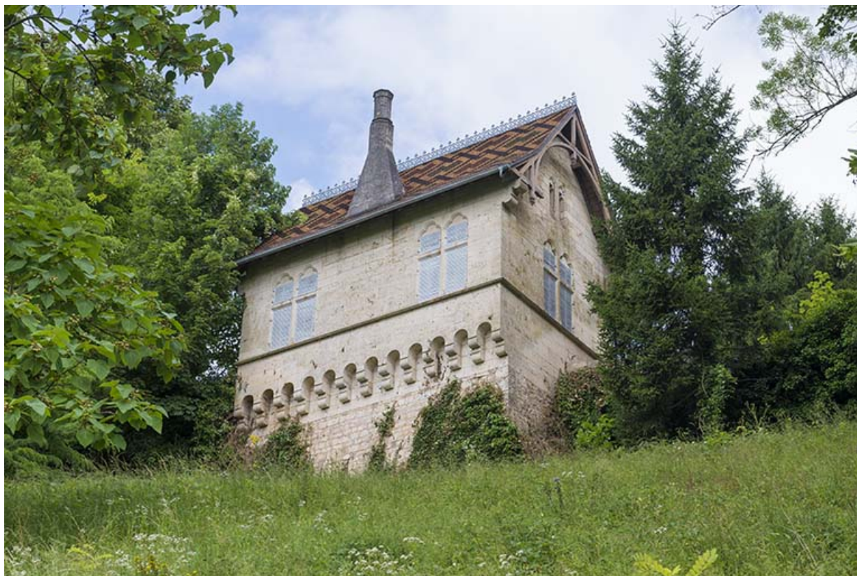
Vue générale depuis le sud, en contre-plongée.