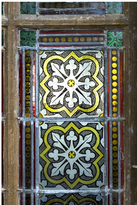
Détail d'une des verrières du rez-de-chaussée.