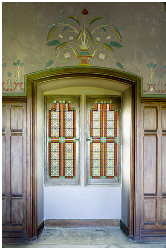
Intérieur : détail d'une des baies située au nord.