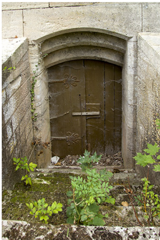
Détail : porte conduisant au sous-sol.