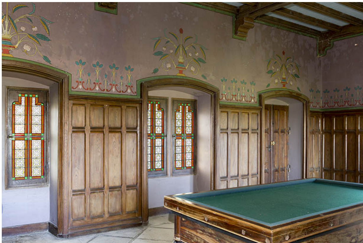
Intérieur : porte d'entrée et baies ouvrant sur le parc.