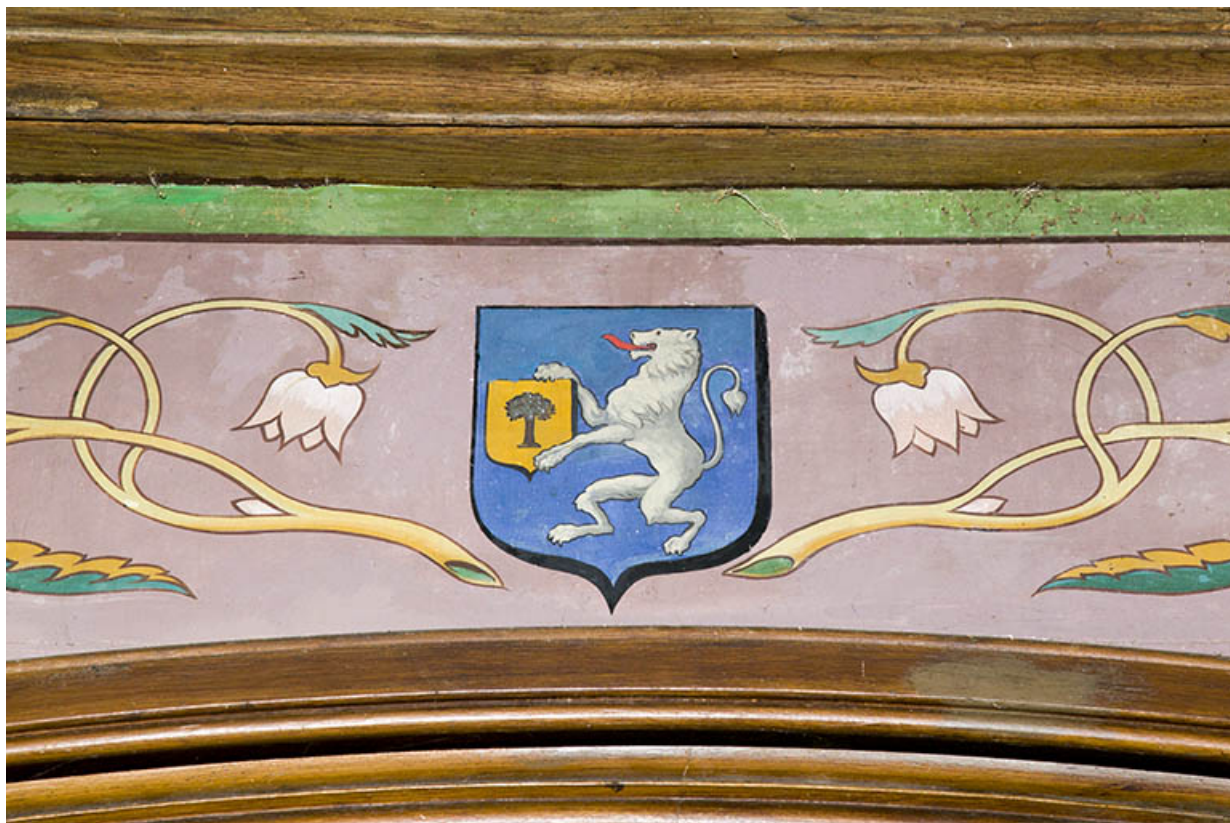
Intérieur : détail du décor peint : les armoiries de la famille de Buyer, peintes sur le mur ouest. 70, Rupt-sur-Saône, 5 rue de la Garenne