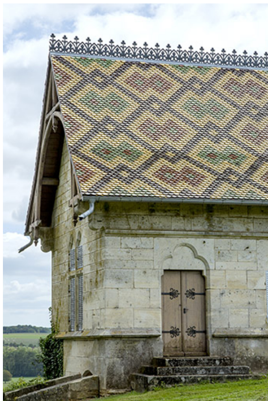
Détail : porte d'entrée.