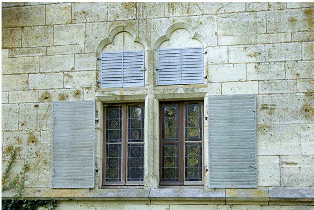
Détail : baies jumelées du 1er étage.