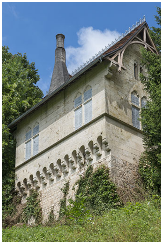
Vue générale de trois quarts montrant la tour, depuis le sud.