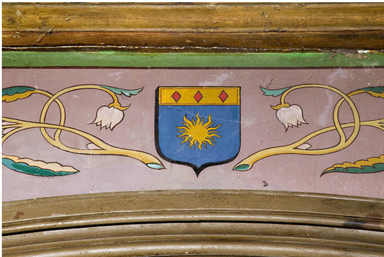
Intérieur : détail du décor peint : les armoiries simplifiées de la famille de Boutechoux, peintes sur le mur est. 70, Rupt-sur-Saône, 5 rue de la Garenne