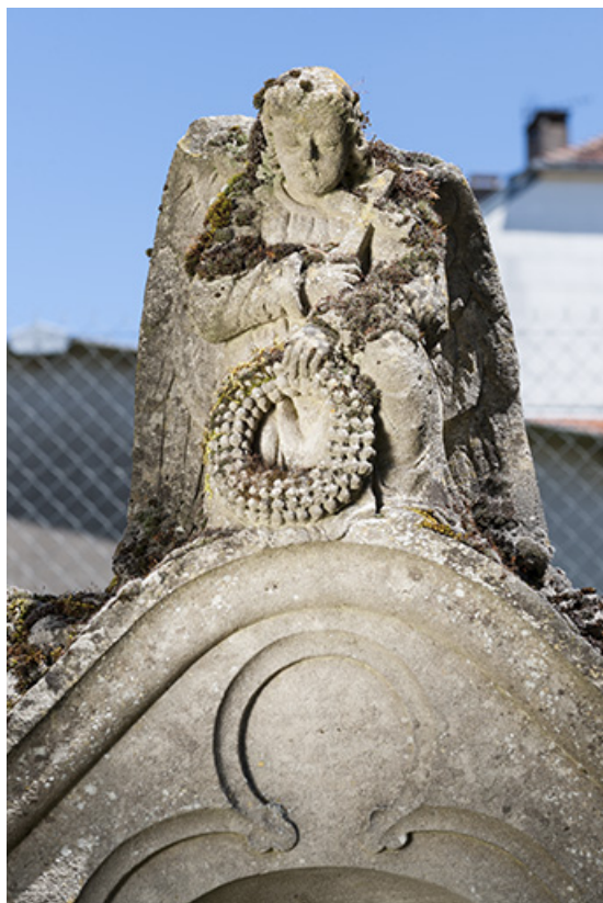
Détail de l'ange ailé au sommet de l'une des tombes de l'ancien cimetière 70, Chaux-lès-Port