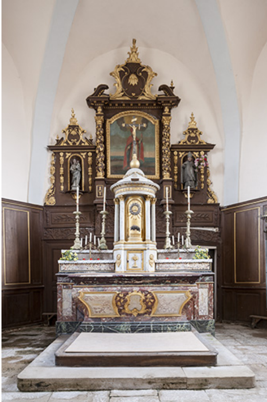
Vue du maître autel, tabernacle et gradin d'autel 70, Chaux-lès-Port