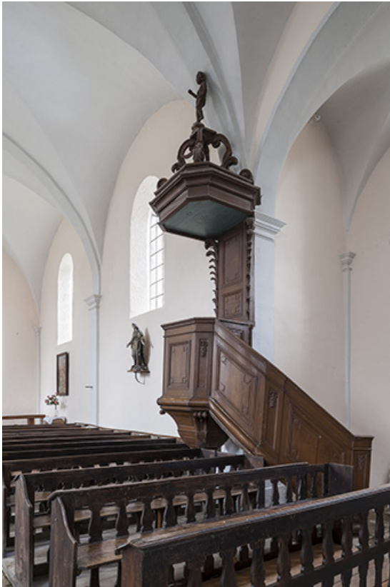
Chaire à prêcher