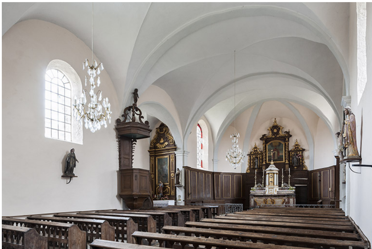
Vue d'ensemble de la nef et du chœur