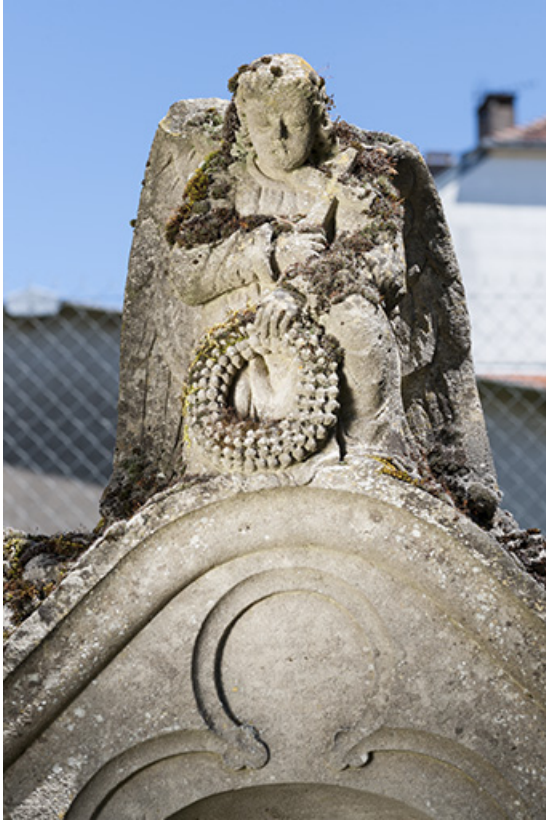
Détail de l'ange ailé au sommet de l'une des tombes de l'ancien cimetière 70, Chaux-lès-Port