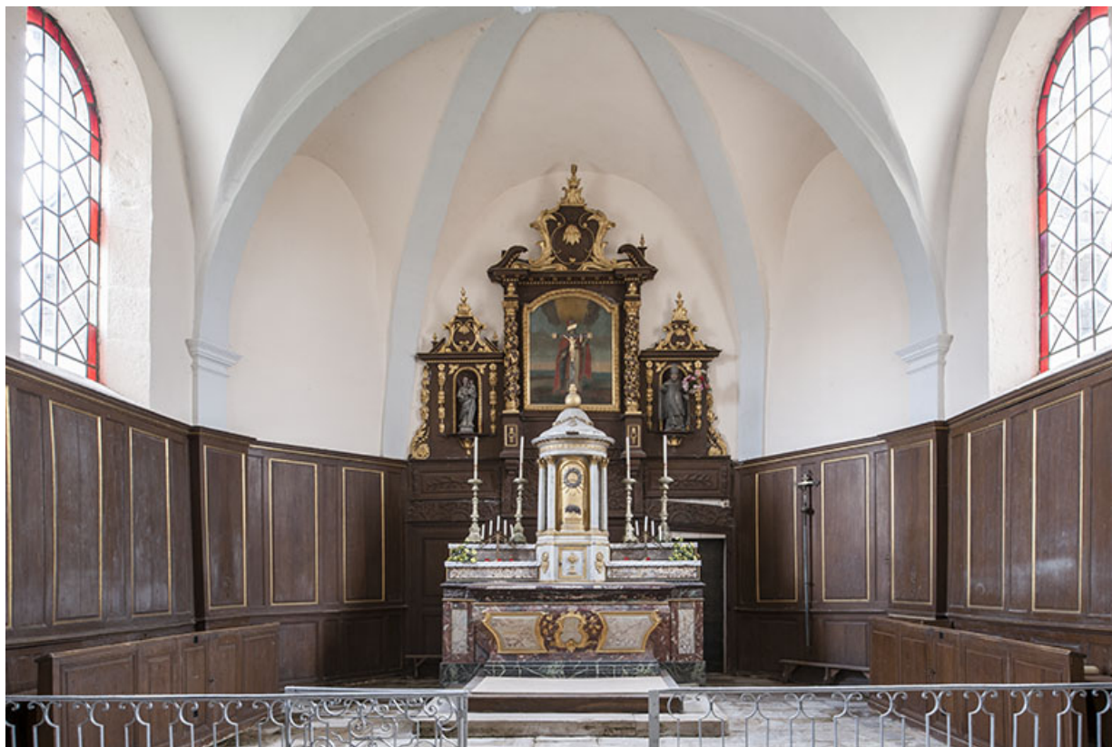
Vue du chœur