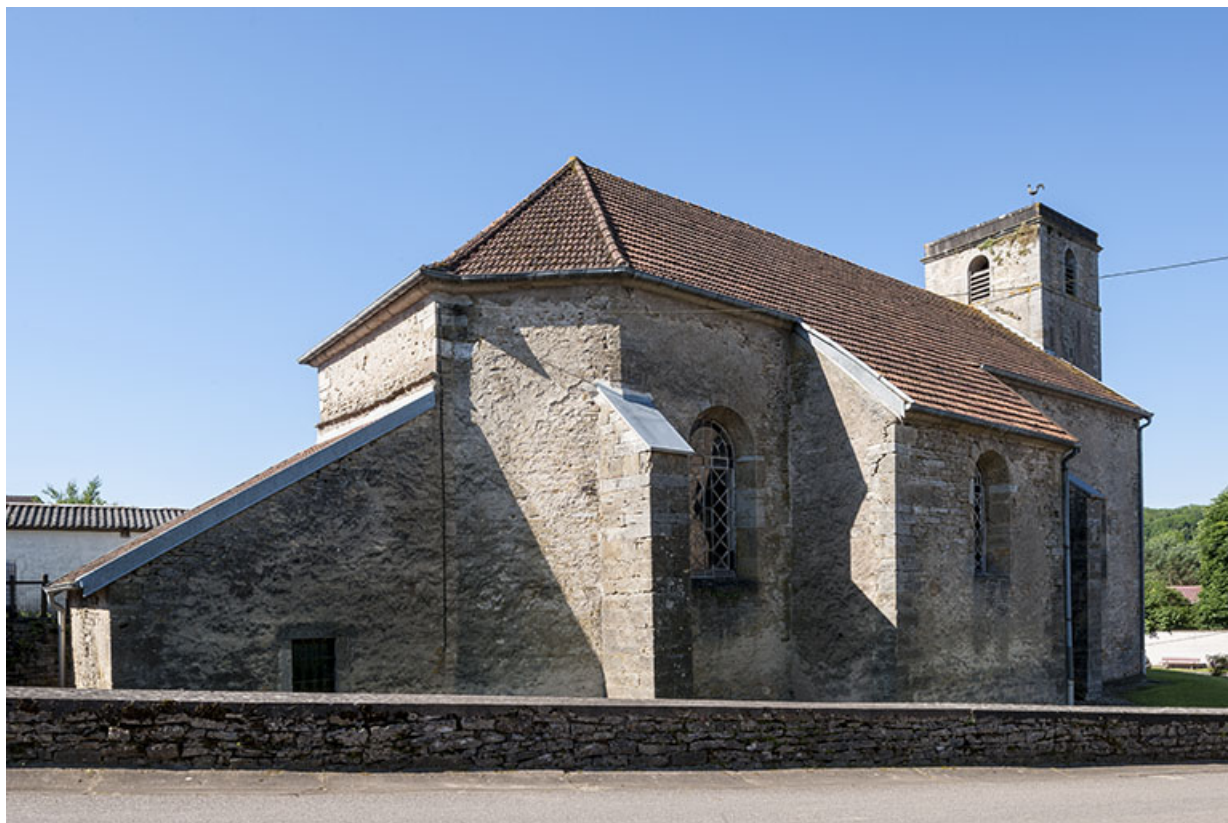
Vue latérale Nord, chevet et sacristie 70, Chaux-lès-Port