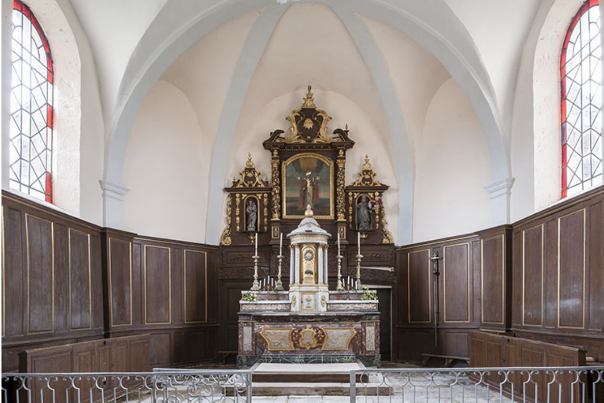
Vue du chœur