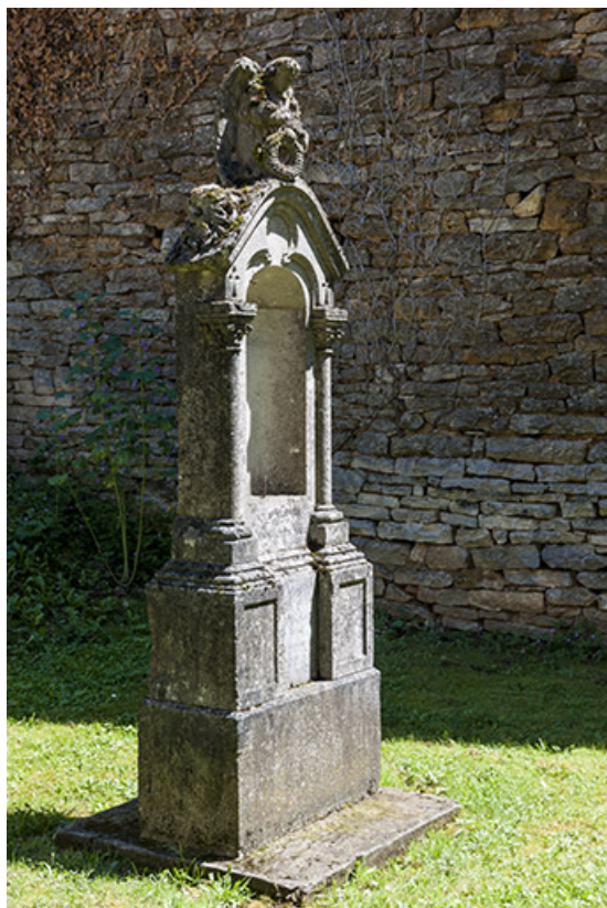
Tombe de l'ancien cimetière