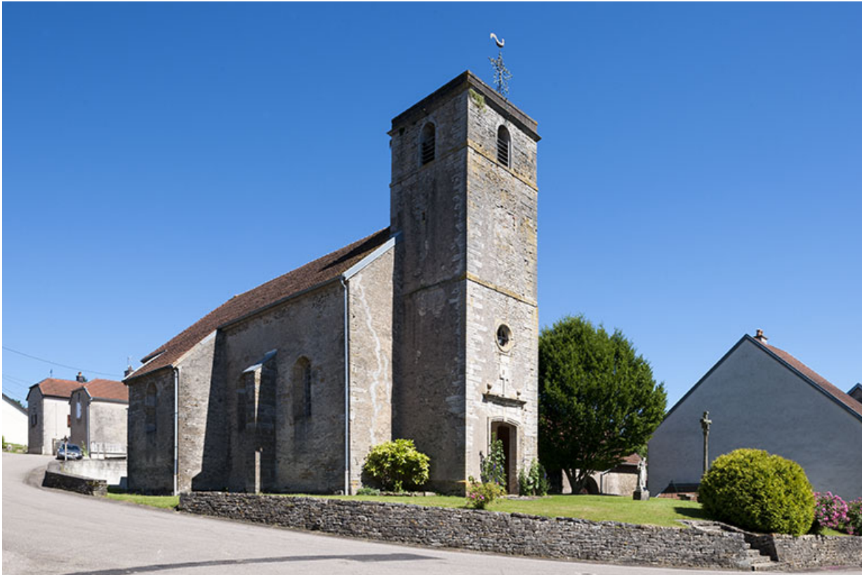
Eglise, vue Nord-Ouest