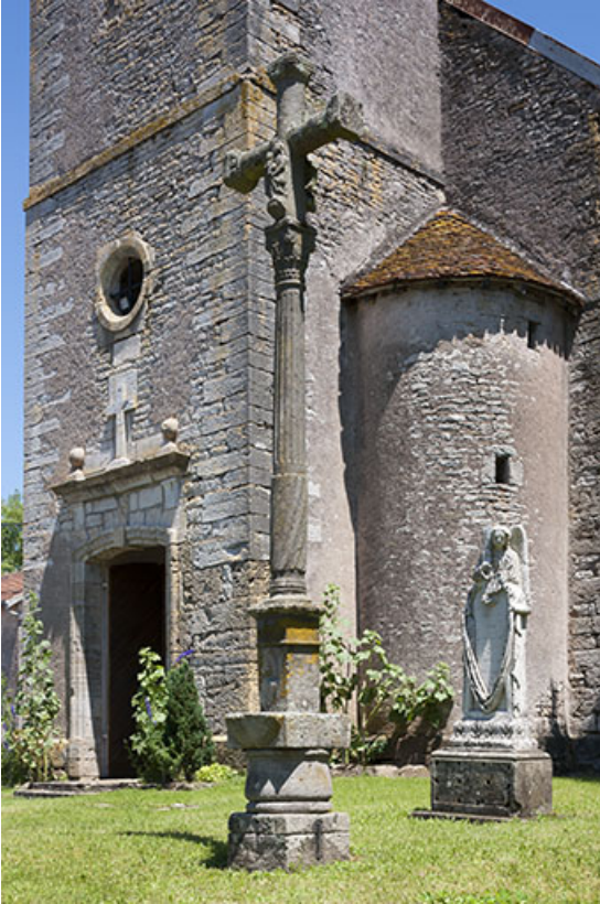
Vestiges de l'ancien cimetière