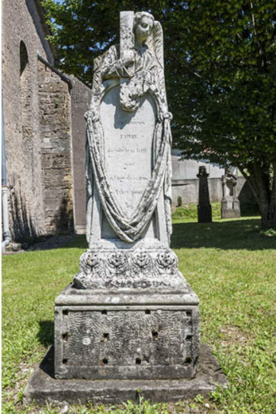
Vue d'ensemble d'une tombe de l'ancien cimetière 70, Chaux-lès-Port