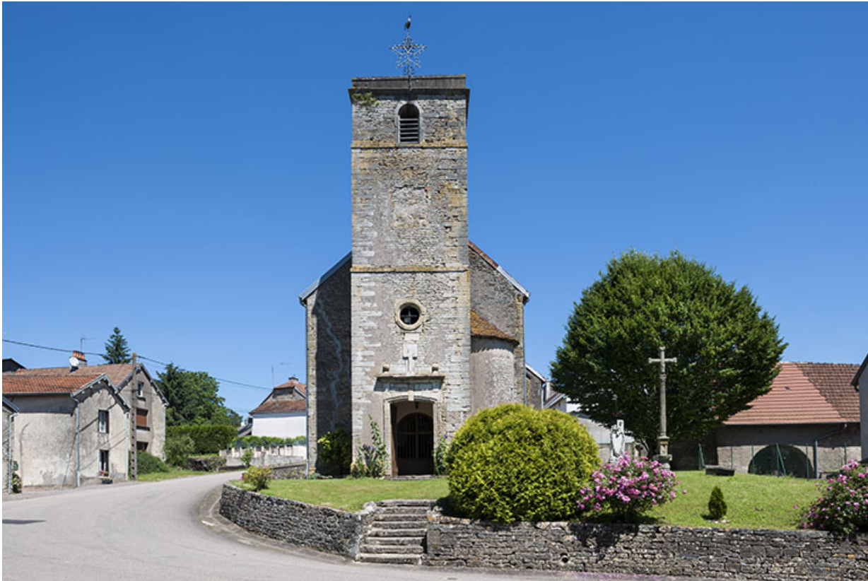
Eglise et ancien cimetière