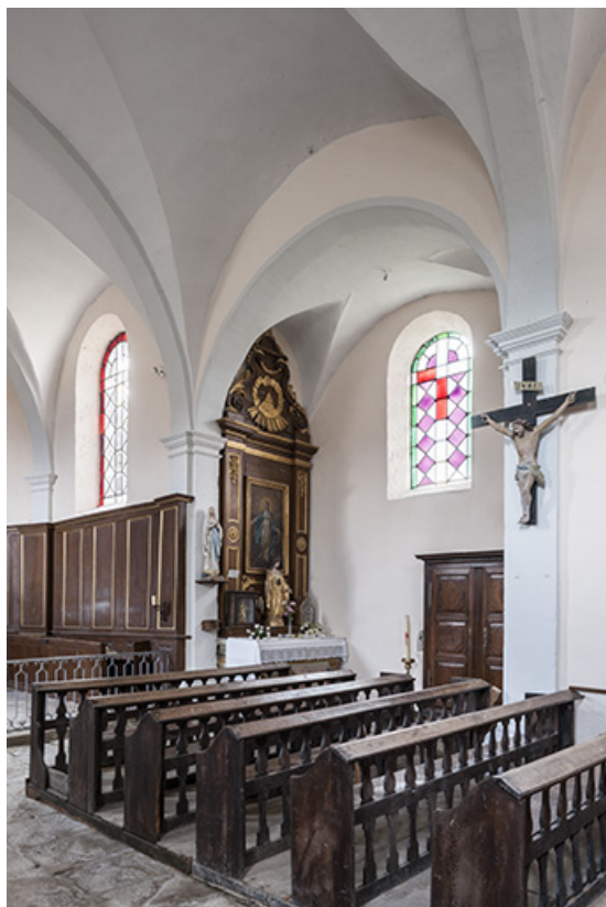
Vue du transept Sud, autel secondaire 70, Chaux-lès-Port