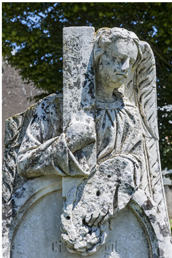
Détail de l'ange sculpté, tombe de l'ancien cimetière 70, Chaux-lès-Port