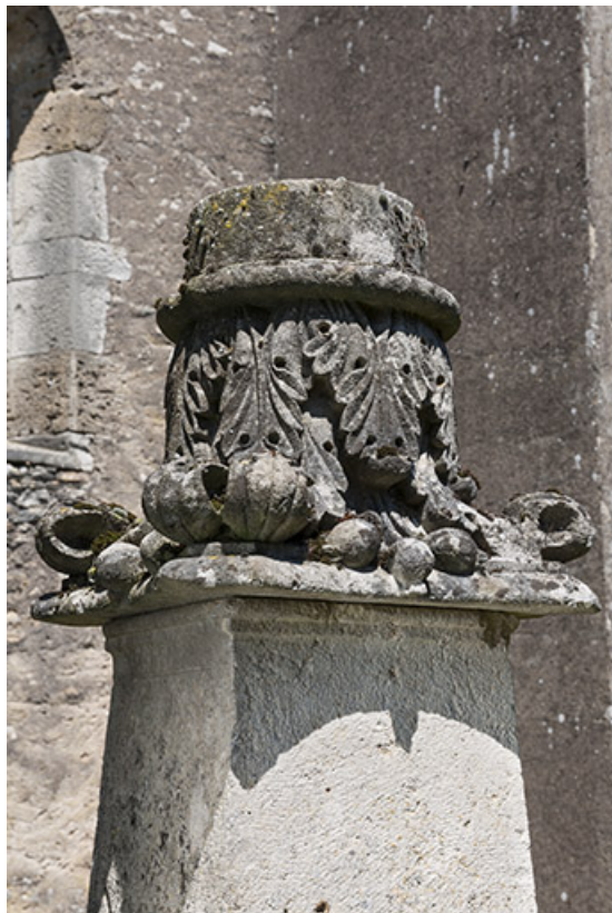
Détail de l'une des tombes de l'ancien cimetière 70, Chaux-lès-Port