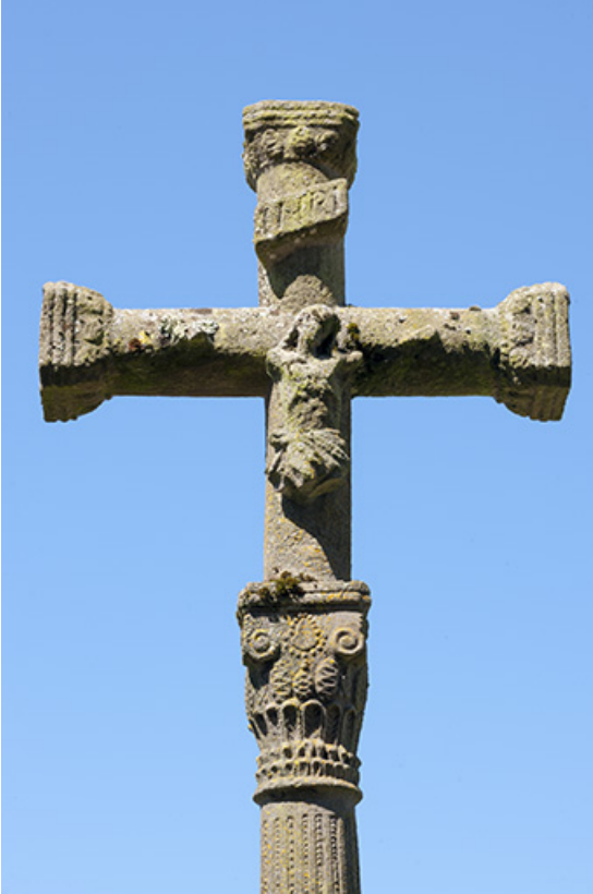
Partie sommitale de la croix, représentation du Christ crucifié 70, Chaux-lès-Port