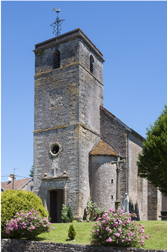
Vue de la façade principale, le clocher porcher, la tourelle d'angle et l'ancien cimetière 70, Chaux-lès-Port