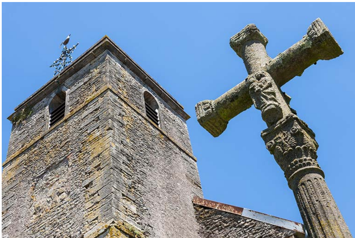
Vue du clocher porche et croix sculptée dans l'ancien cimetière 70, Chaux-lès-Port