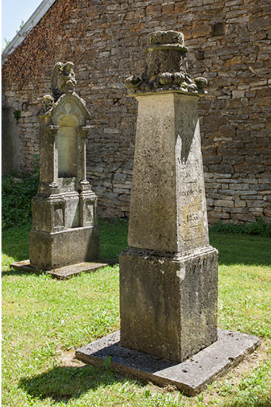
Deux tombes, vestiges de l'ancien cimetière 70, Chaux-lès-Port