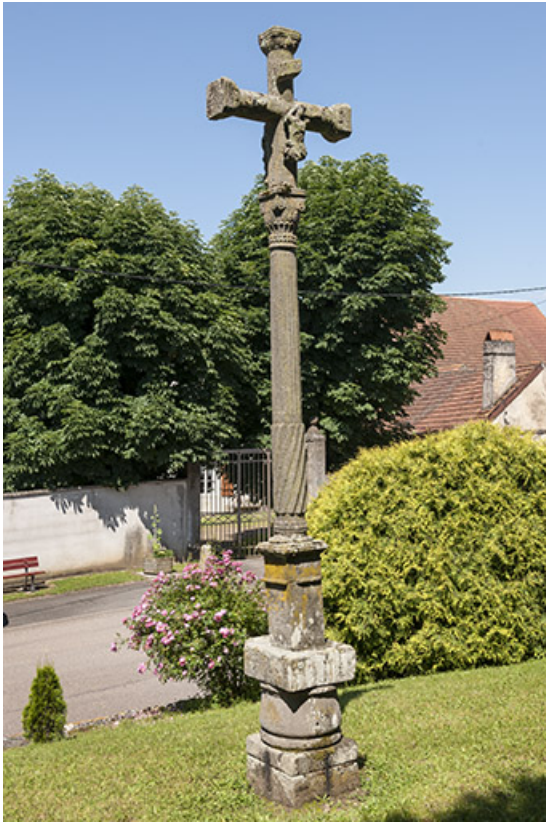
Croix sculptée, vestige de l'ancien cimetière 70, Chaux-lès-Port