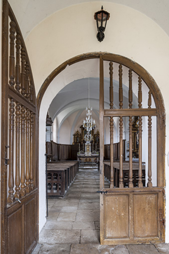
Vue de la nef depuis le portail d'entrée à claire-voie 70, Chaux-lès-Port