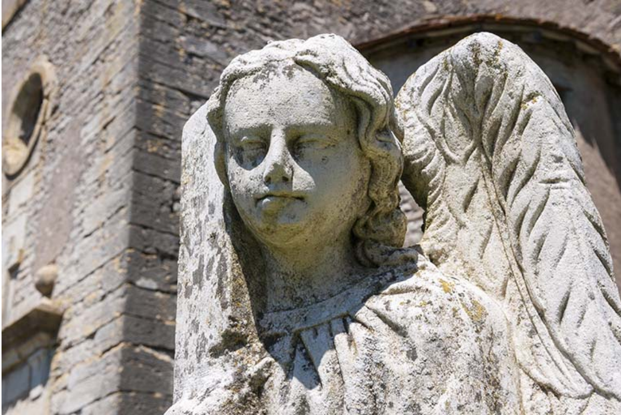
Détail du visage de l'ange sculpté, tombe de l'ancien cimetière 70, Chaux-lès-Port