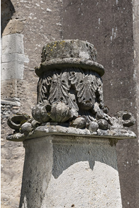
Détail de l'une des tombes de l'ancien cimetière 70, Chaux-lès-Port