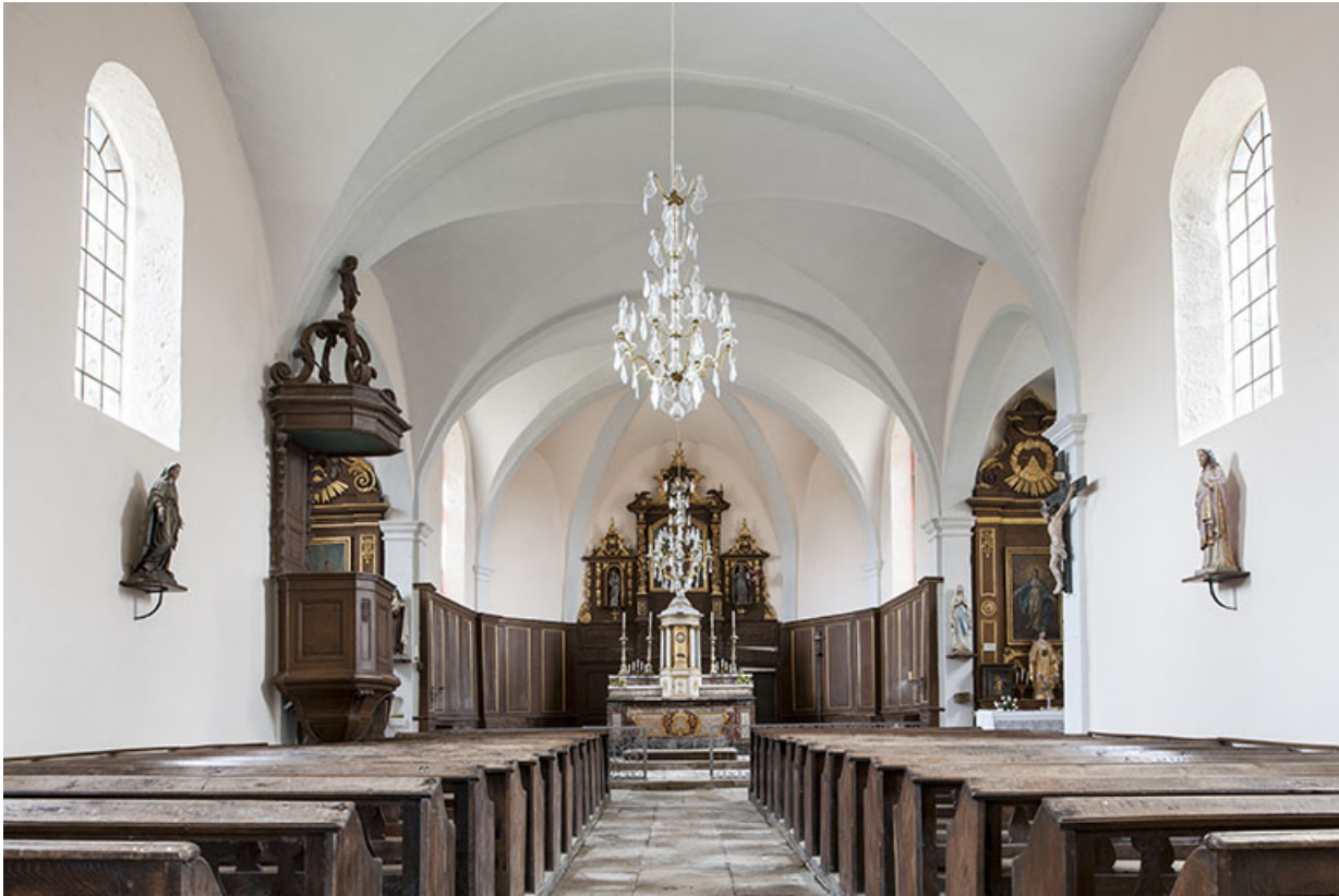
Vue d'ensemble de la nef