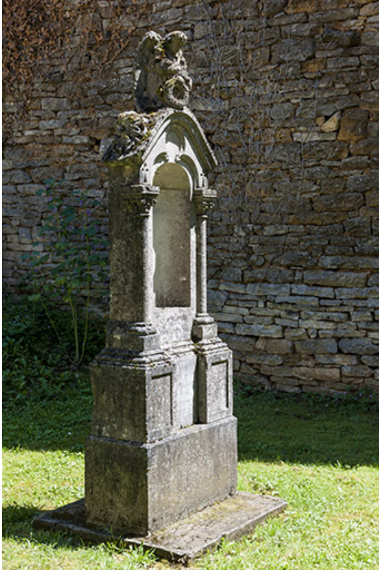
Tombe de l'ancien cimetière