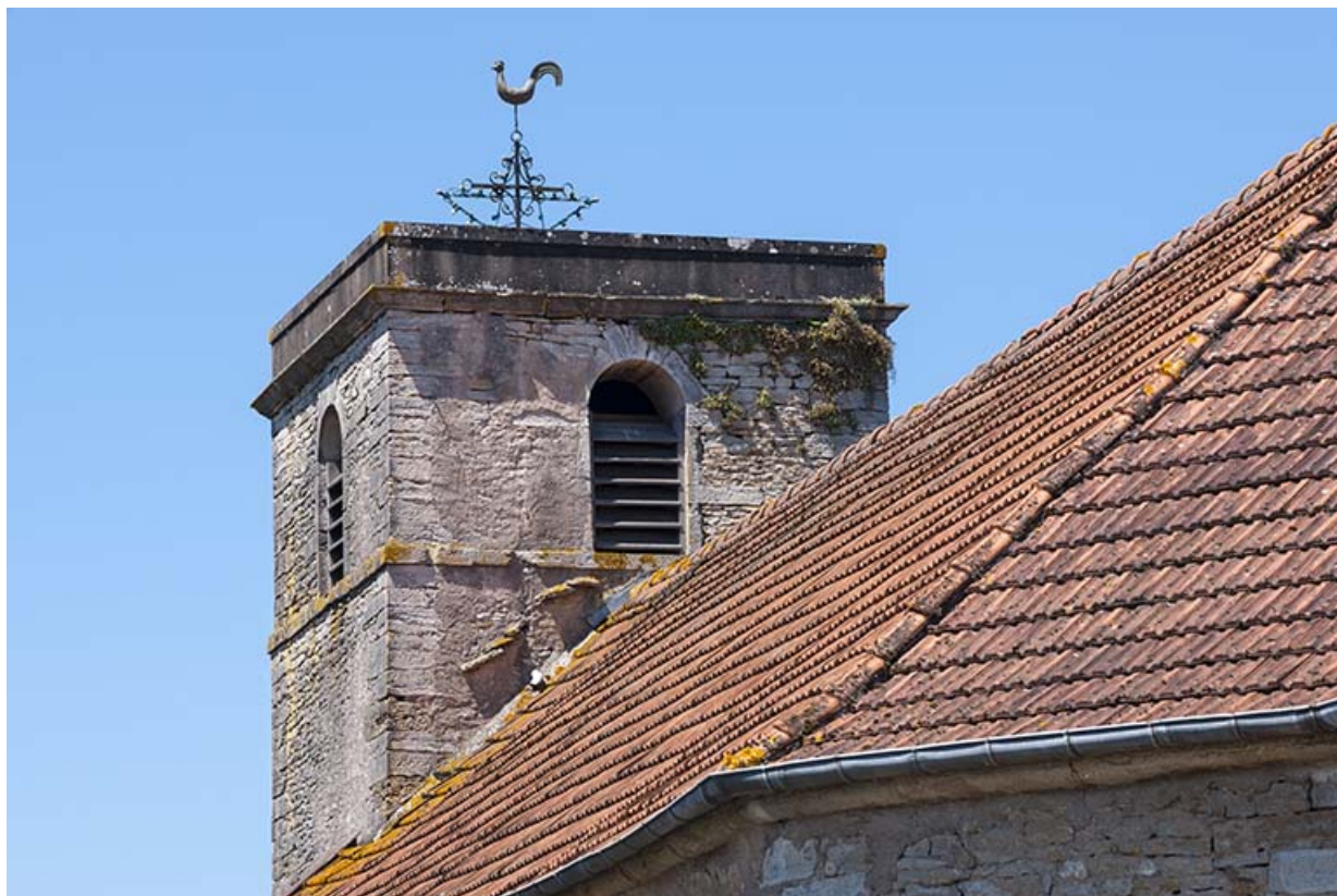
Vue du clocher 70, Chaux-lès-Port