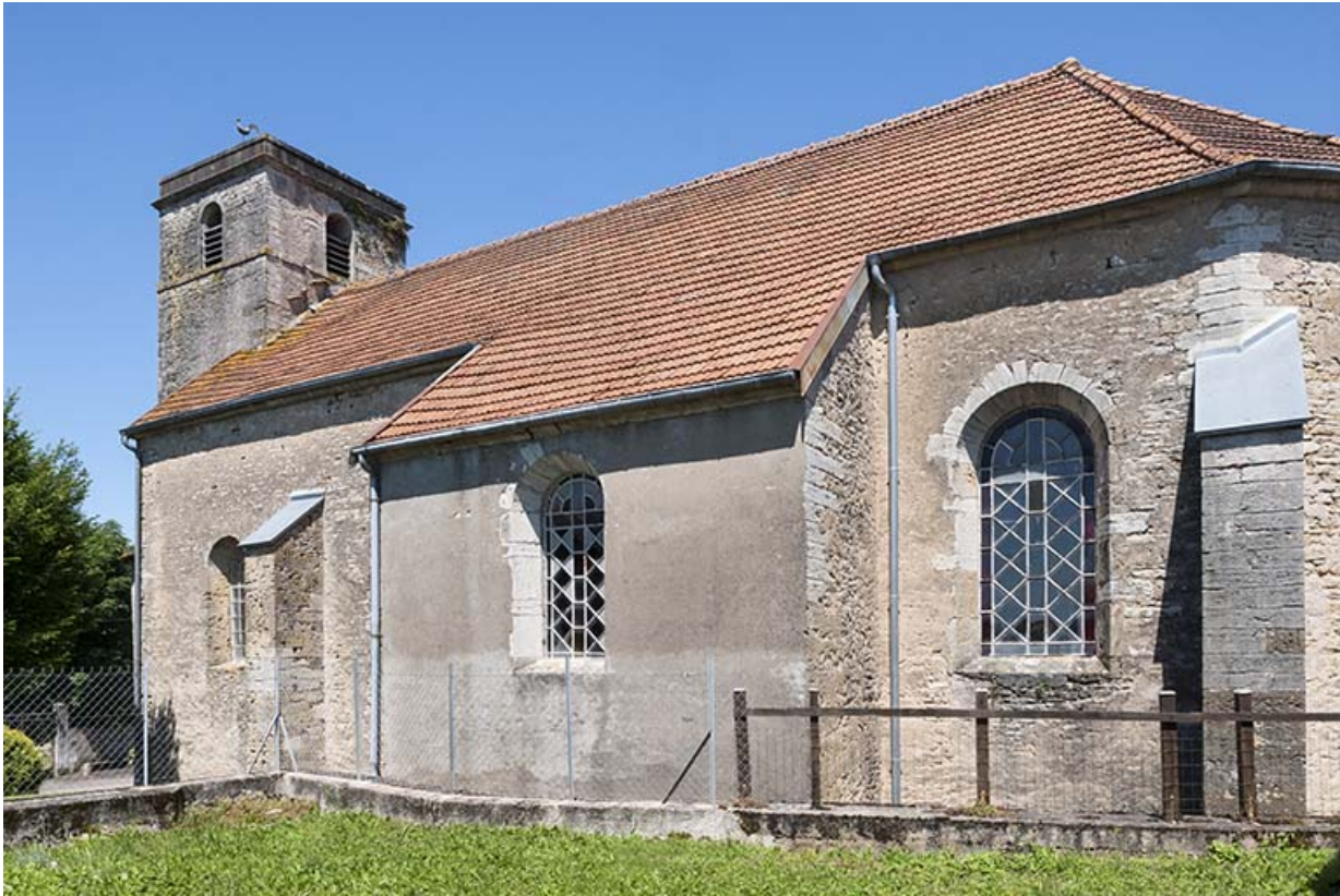
Vue latérale Sud 70, Chaux-lès-Port