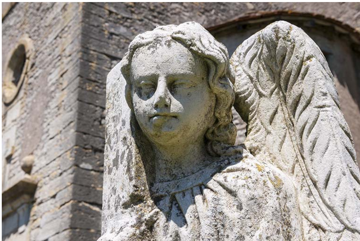
Détail du visage de l'ange sculpté, tombe de l'ancien cimetière 70, Chaux-lès-Port