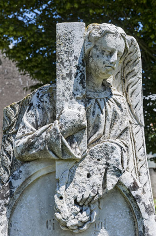
Détail de l'ange sculpté, tombe de l'ancien cimetière 70, Chaux-lès-Port