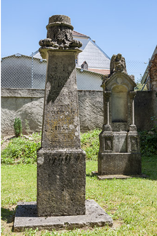
Deux tombes, vestiges de l'ancien cimetière 70, Chaux-lès-Port