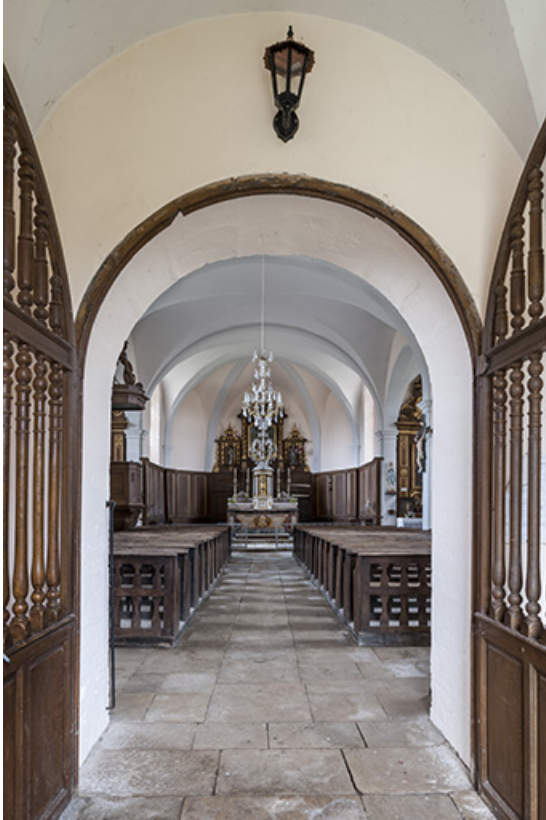
Vue de la nef depuis le portail d'entrée