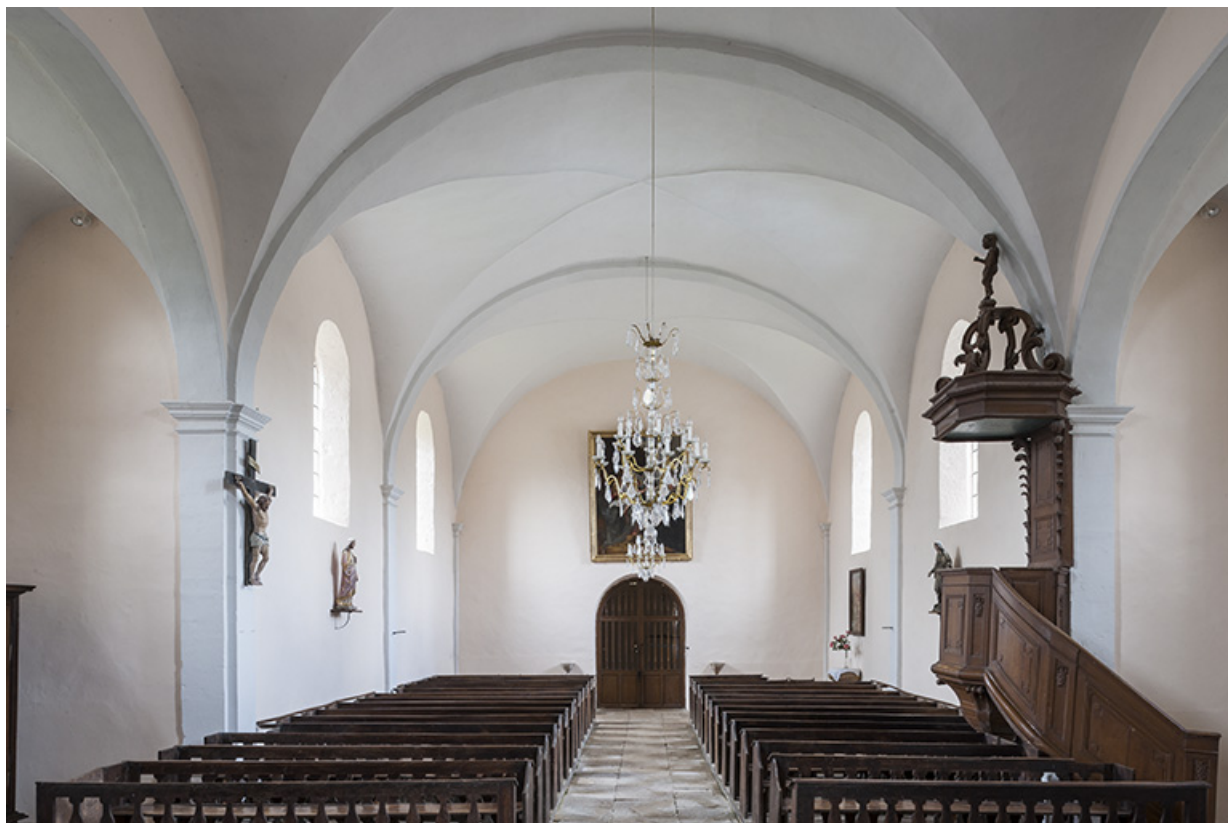
Vue de l'entrée principale, depuis le chœur