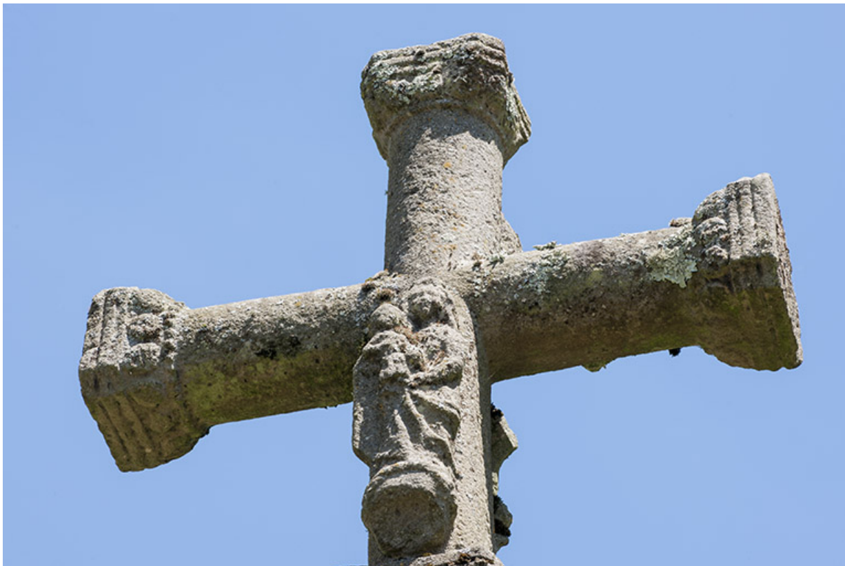
Partie sommitale de la croix, représentation de la Vierge à l'Enfant 70, Chaux-lès-Port