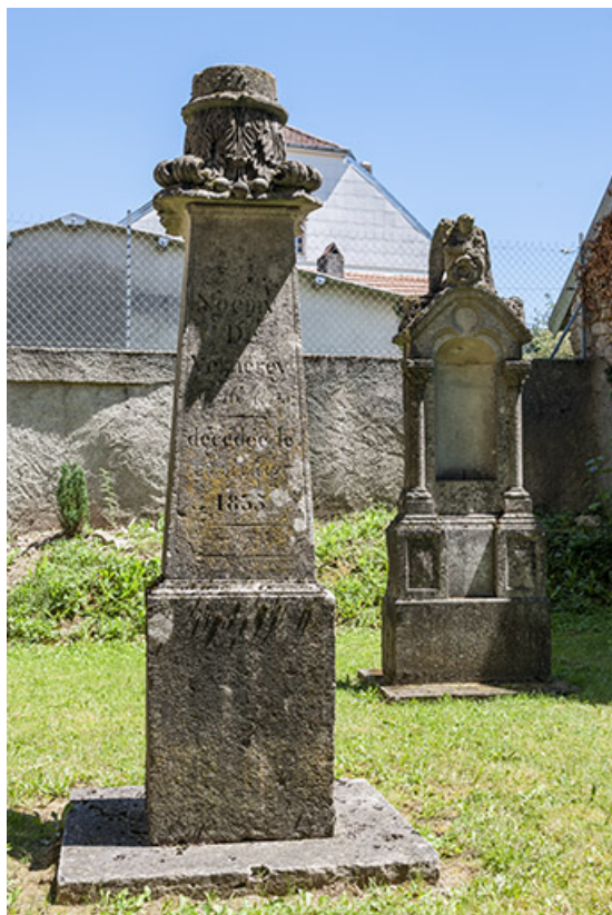
Deux tombes, vestiges de l'ancien cimetière 70, Chaux-lès-Port