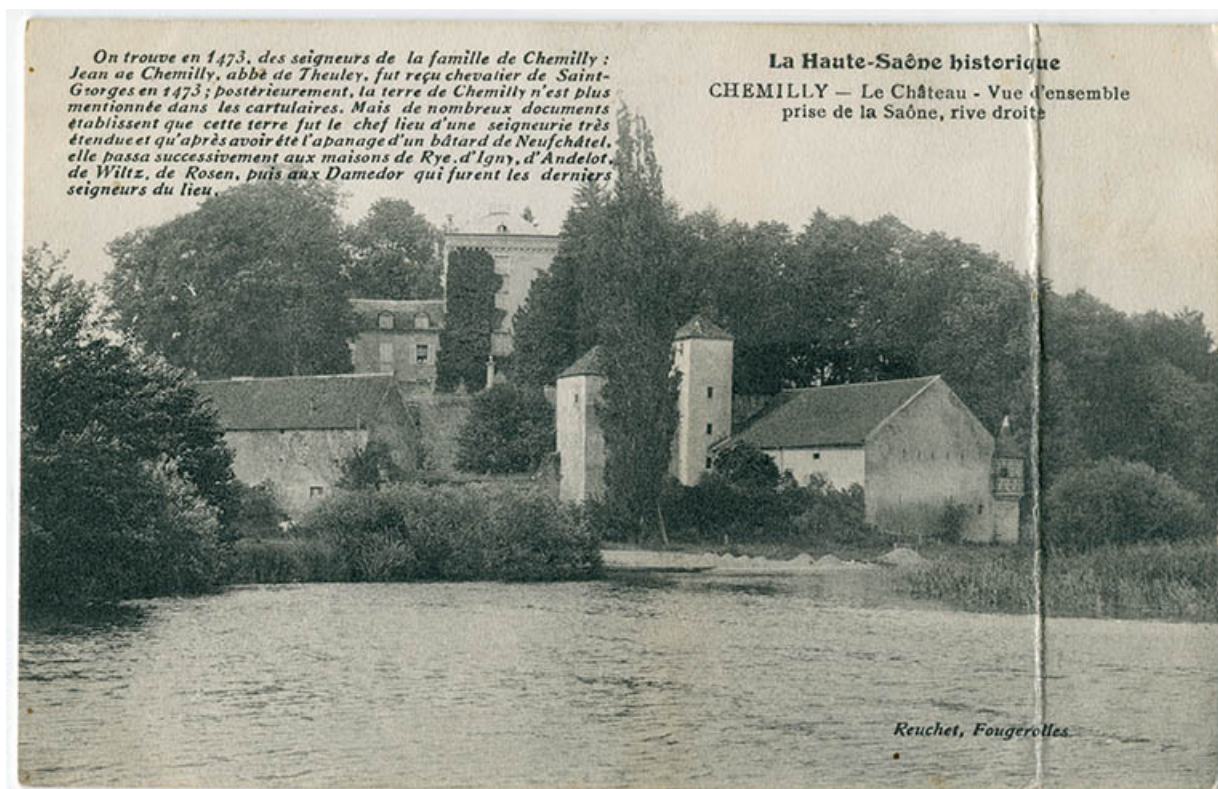
Vue d'ensemble du château, prise depuis la Saône.