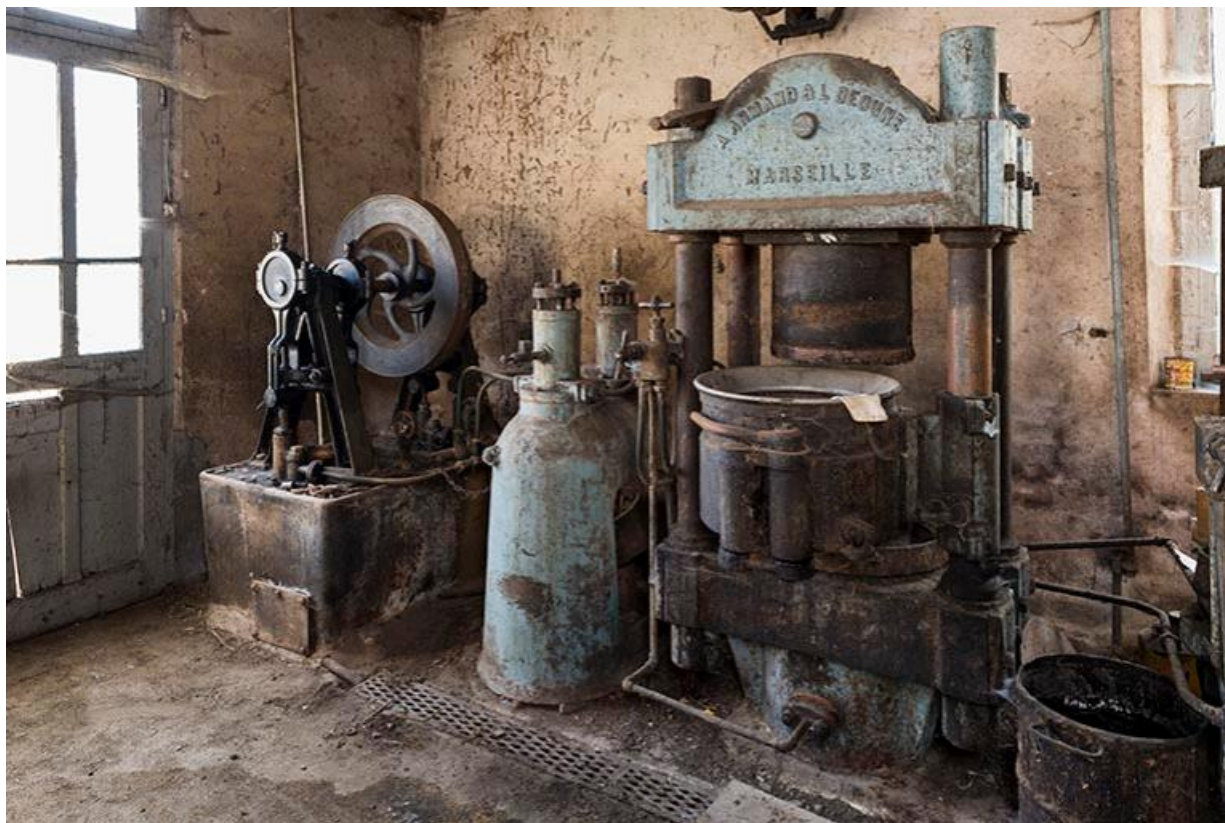
Vue des machines du rez-de-chaussée 70, Chemilly Grande rue