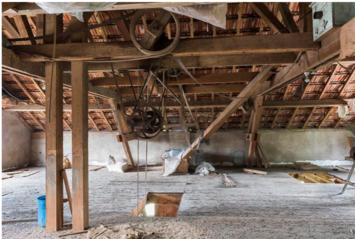
Vue de l'étage en surcroît, système de transmission par poulies et courroies et conduits fermés en bois 70, Chemilly Grande rue