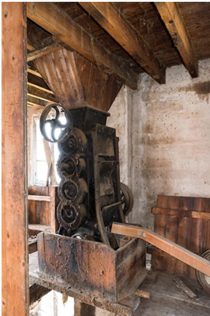
Vue de l'arrière du broyeur situé au premier étage 70, Chemilly Grande rue