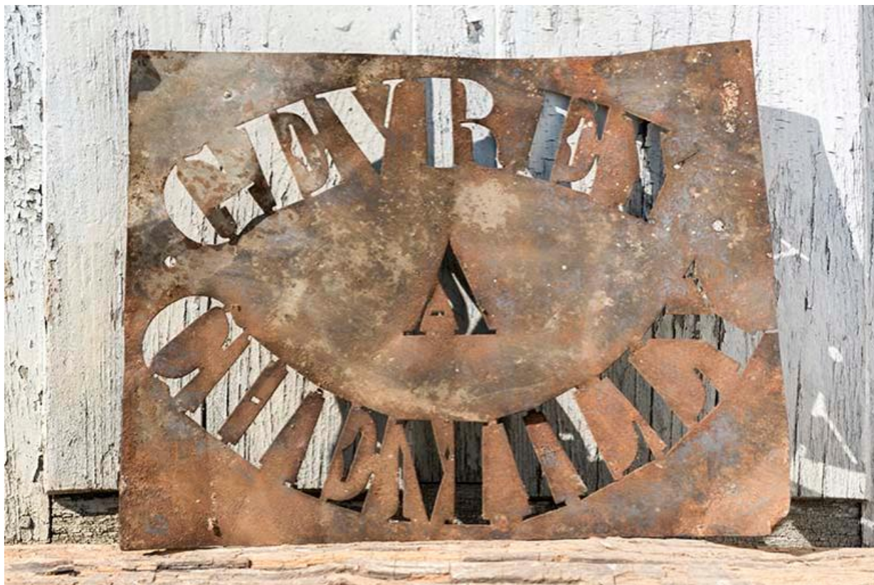
Pochoir pour marquer les sacs au nom du propriétaire