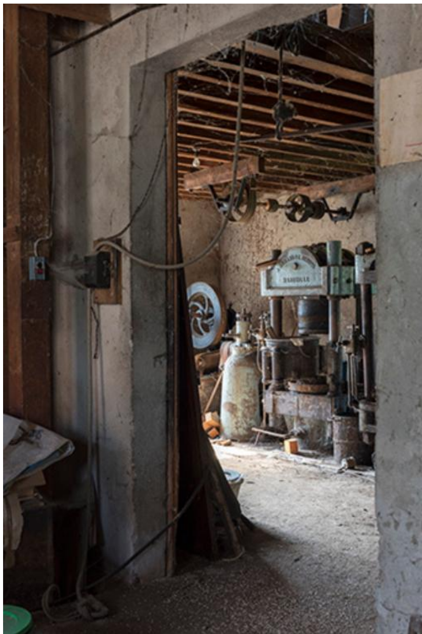
Vue du rez-de-chaussée depuis le magasin 70, Chemilly Grande rue