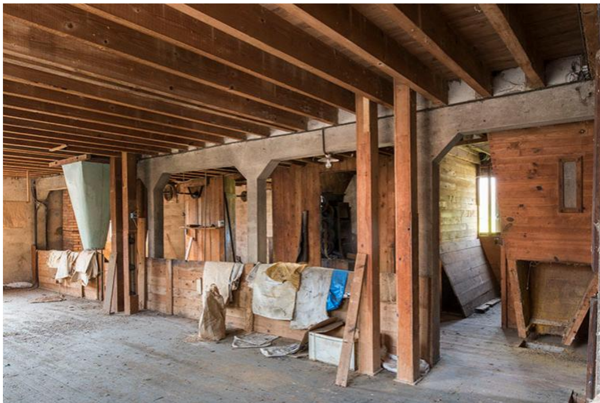
Vue d'ensemble du premier étage