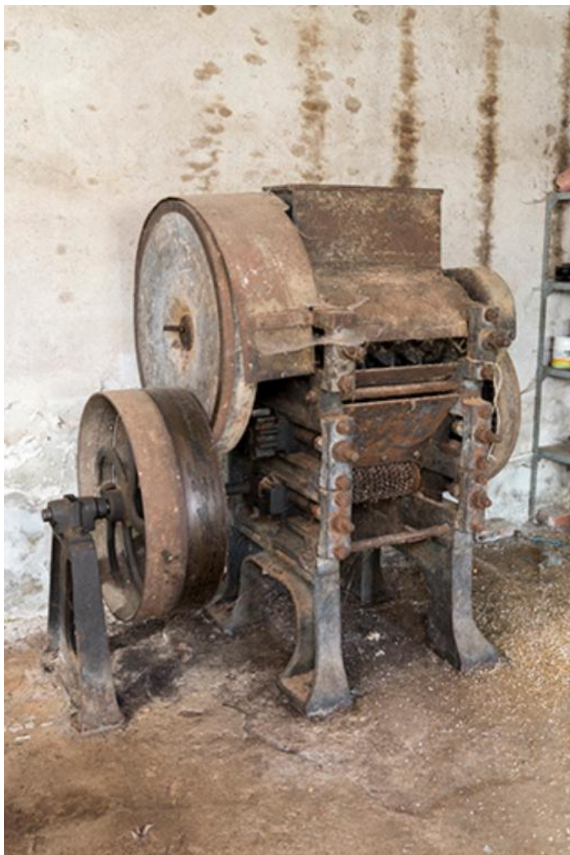
Machine du rez-de-chaussée: broyeur à tourteaux