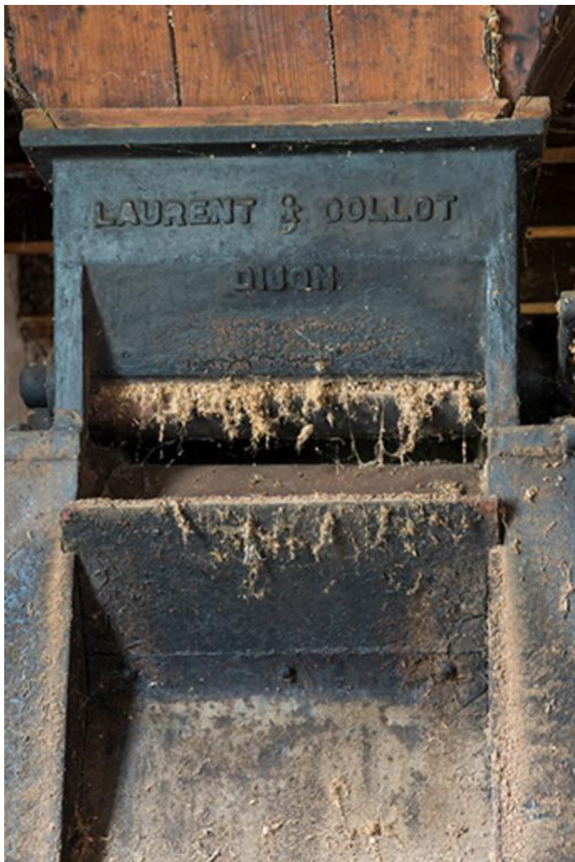
Détail du broyeur laurent et Collot