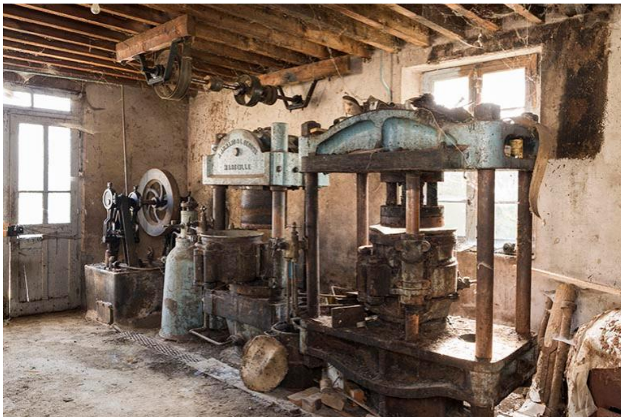
Vue des machines du rez-de-chaussée: pompe hydraulique, régulateur et deux presses hydrauliques 70, Chemilly Grande rue