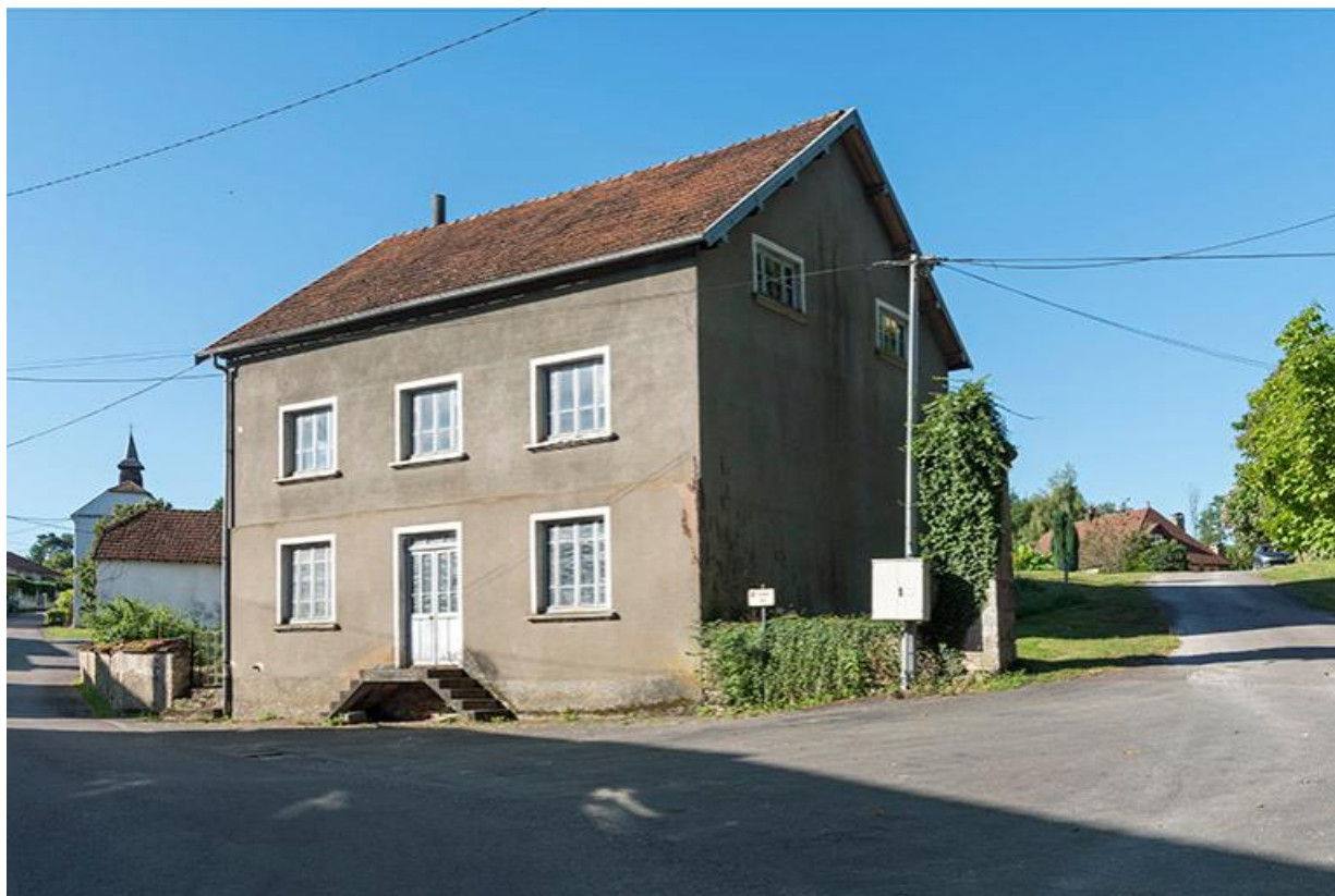
Huilerie à l'entrée du village, Grande rue 70, Chemilly Grande rue