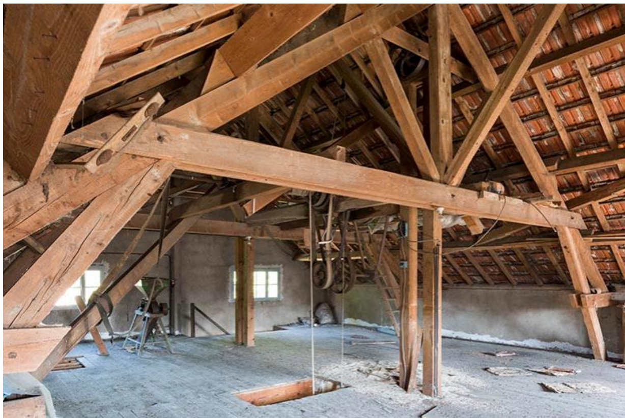
Vue d'ensemble de l'étage en surcroît 70, Chemilly Grande rue