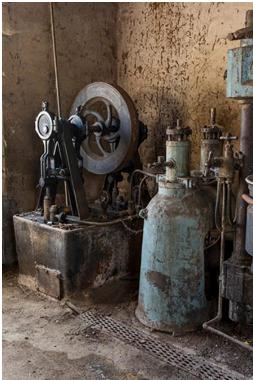
Machines du rez-de-chaussée: pompe hydraulique et régulateur 70, Chemilly Grande rue