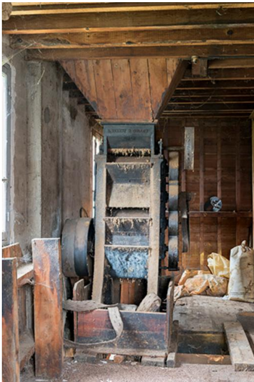
Broyeur et sa trémie situés au premier étage 70, Chemilly Grande rue