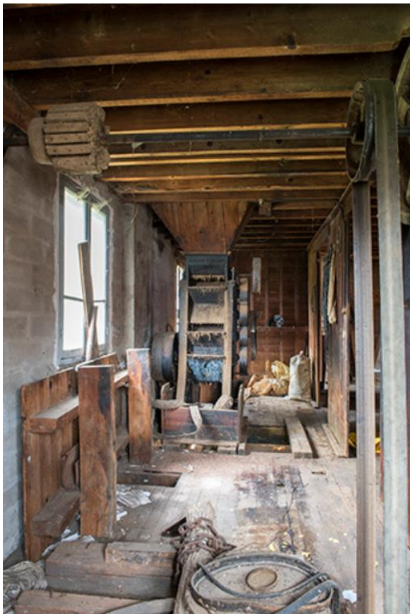
Vue du système de poulie et courroie et de trémie et broyeur à grains, au premier étage 70, Chemilly Grande rue