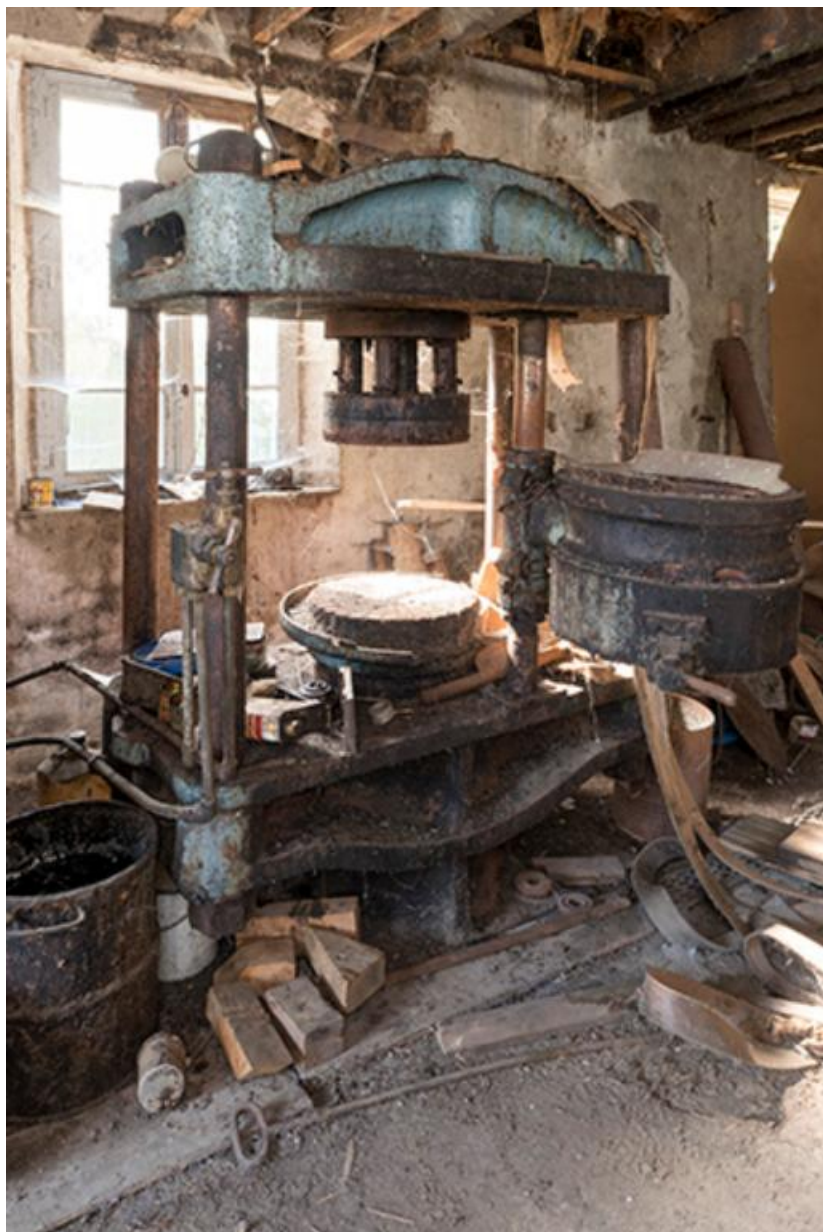
machine du rez-de-chaussée: presse hydraulique