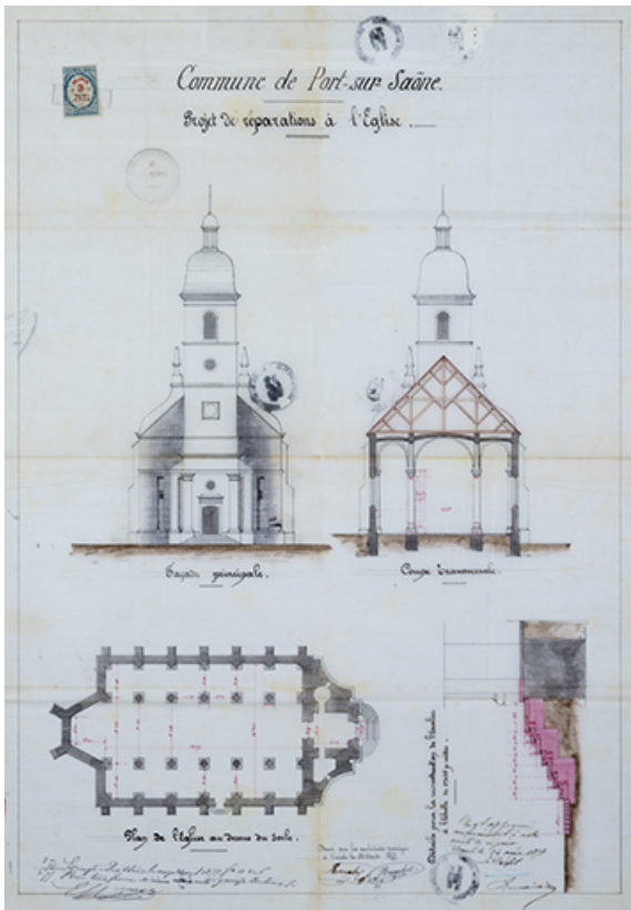
Plan pour projets de réparations, 1877. 70, Port-sur-Saône Grande Rue