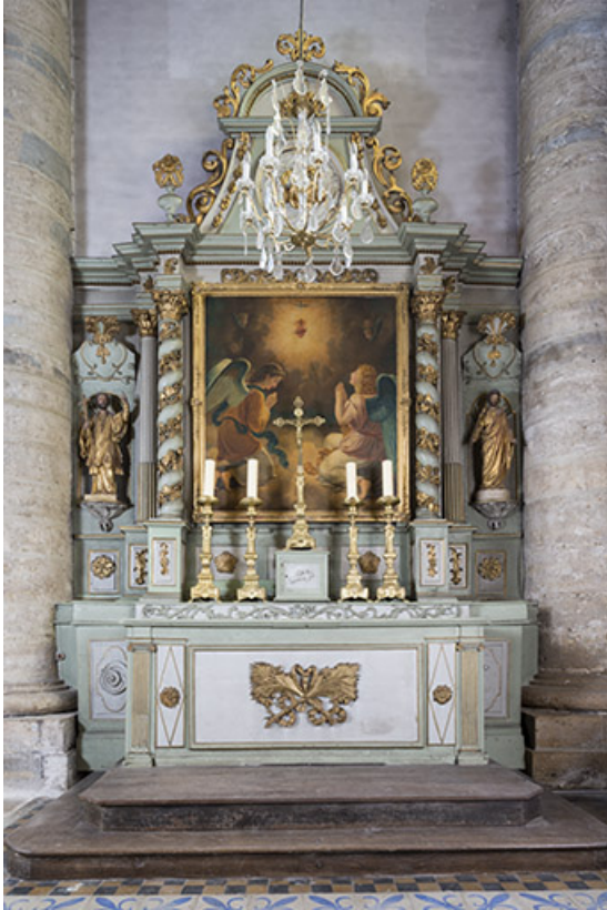
Autel latéral est.