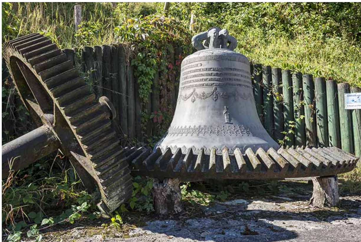
cloche située derrière l'immeuble Madiot. 70, Port-sur-Saône Grande Rue