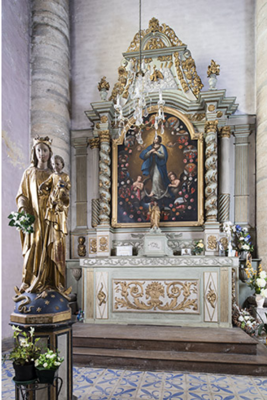
Autel latéral ouest.