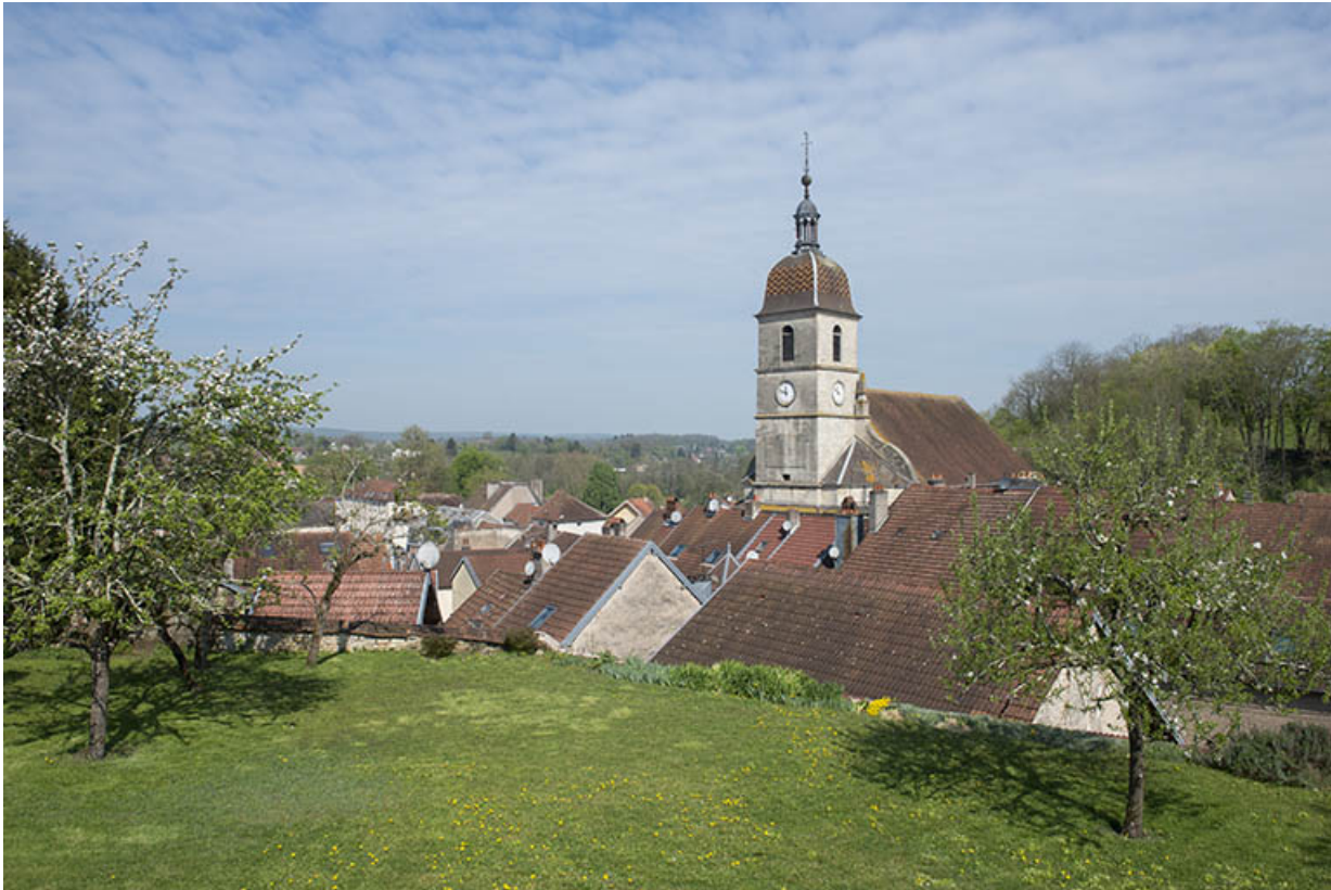
Vue depuis le Tertre.