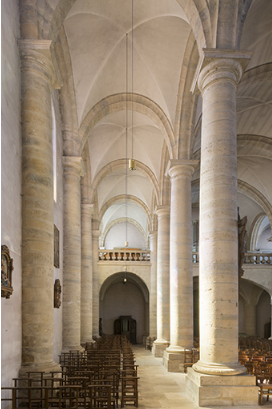
Le collatéral Est depuis l'autel.