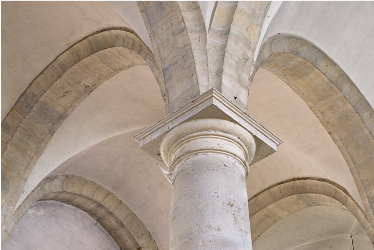
Détail du chapiteau.