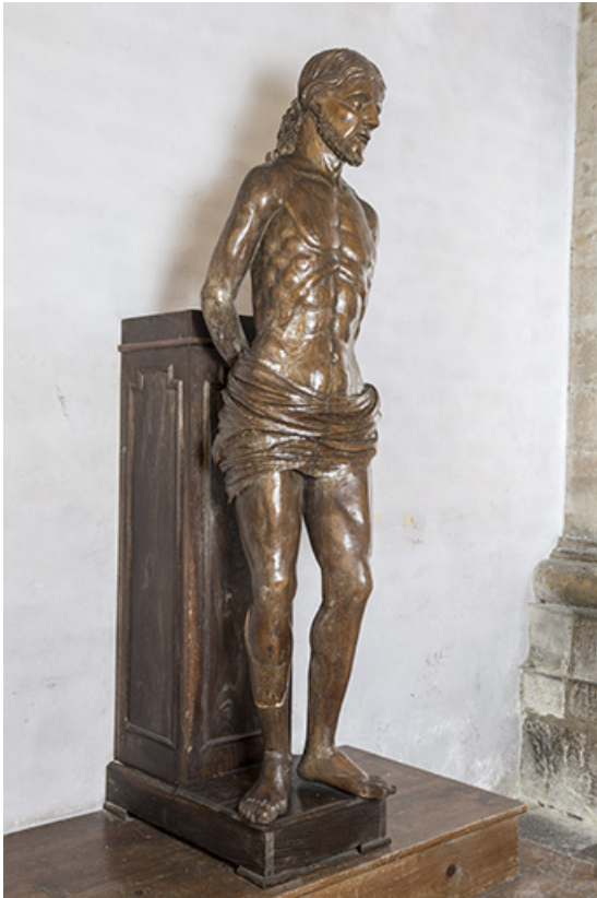
Vue de trois-quart.