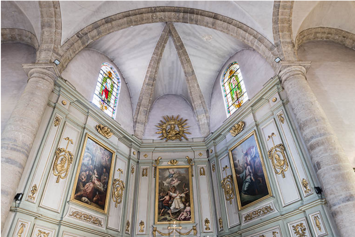
Les boiseries sculptées du sanctuaire.