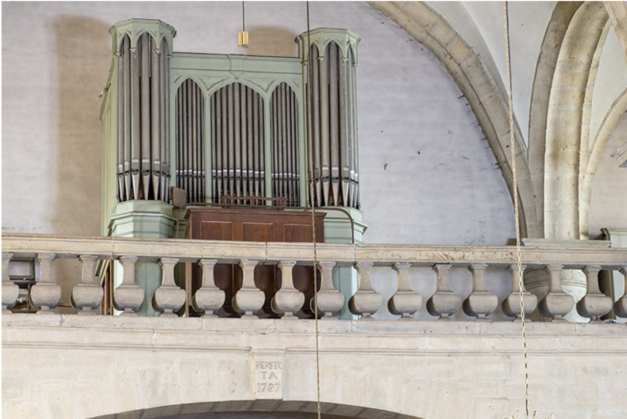
Vue de trois quarts en 2017