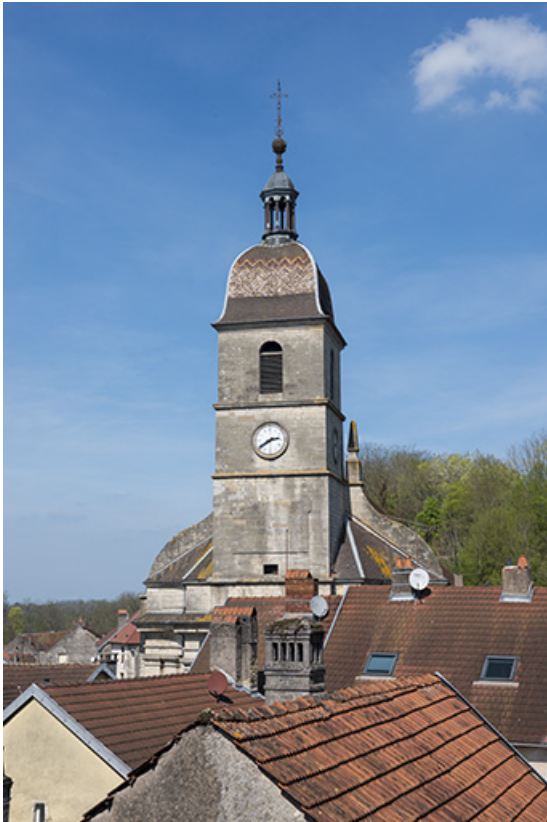
Le clocher avec son toit à l'impérial.