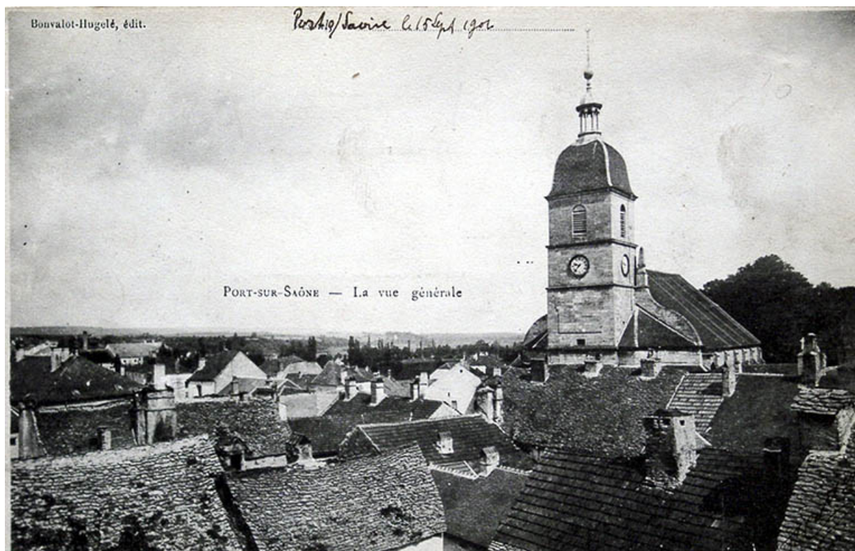
Le clocher de l'église, carte postale.