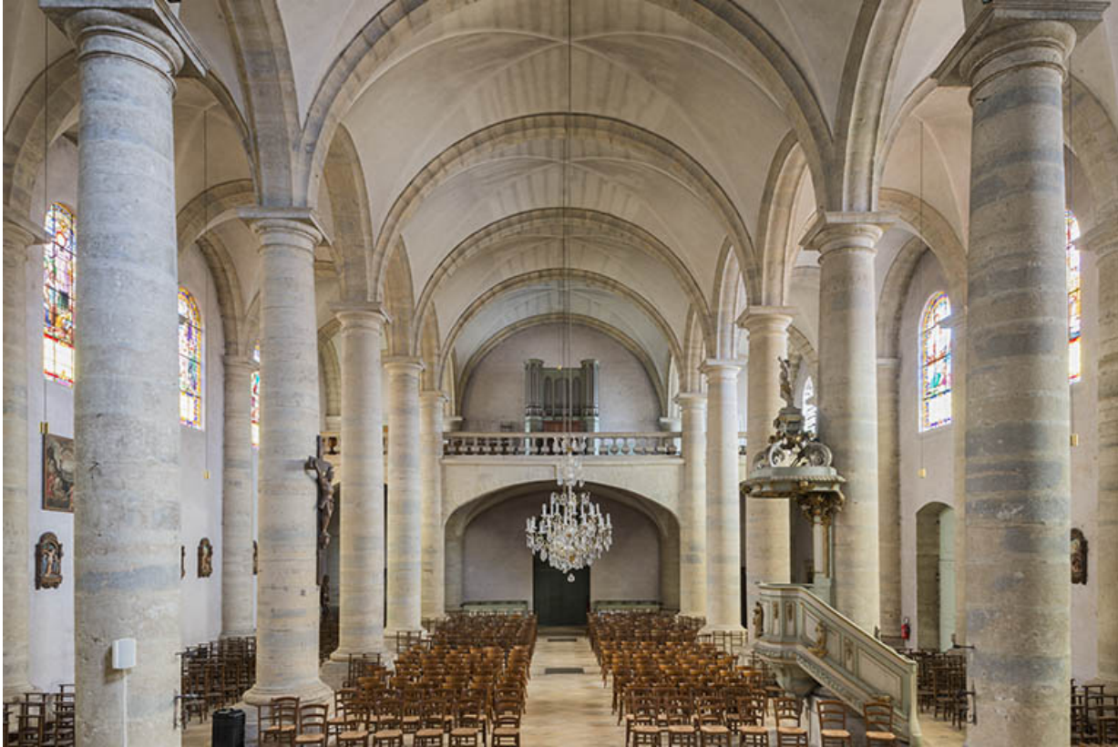
Vue générale de l'église de type halle.