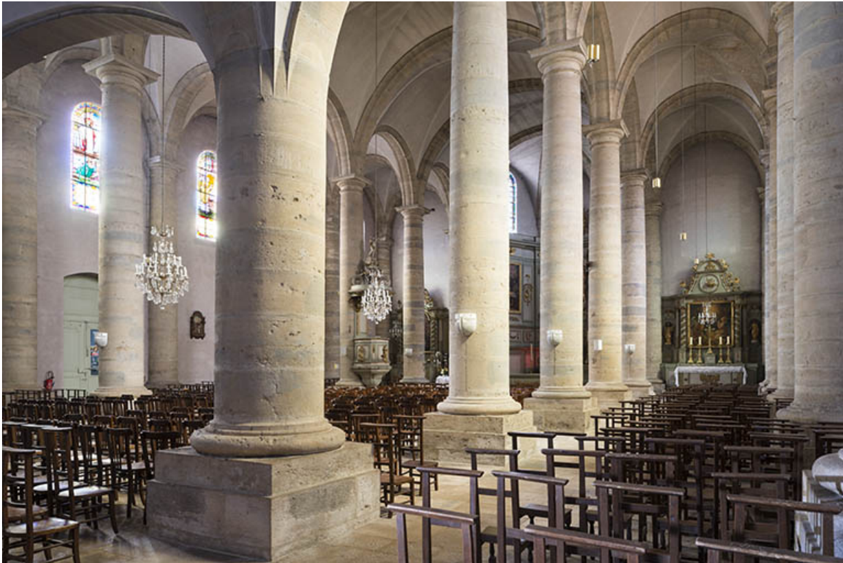
La nef, vue de trois-quart.