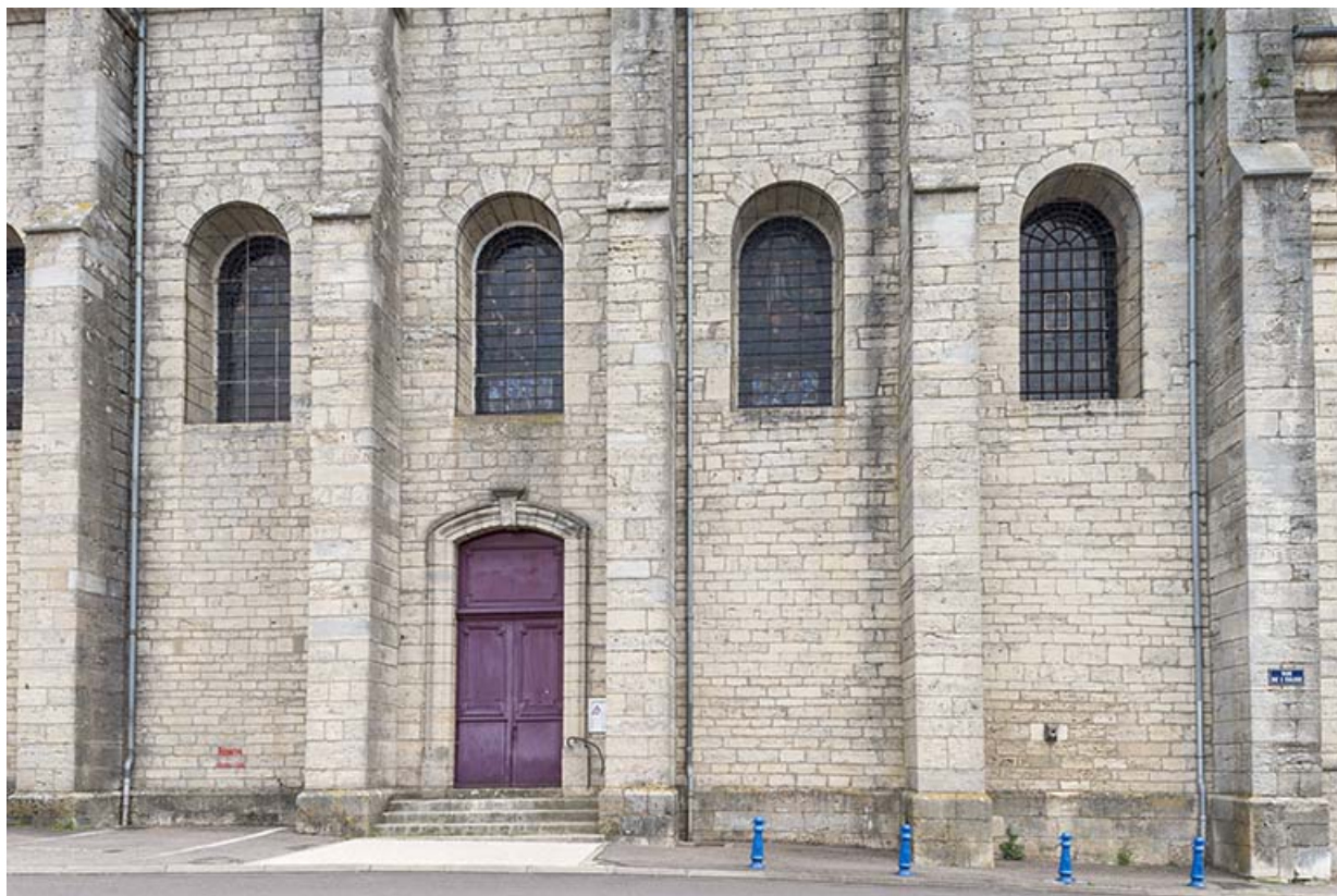
Le mur latéral ouest avec les baies en plein cintre.