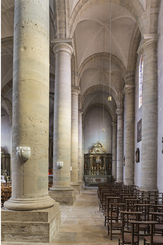
Le collatéral Est.