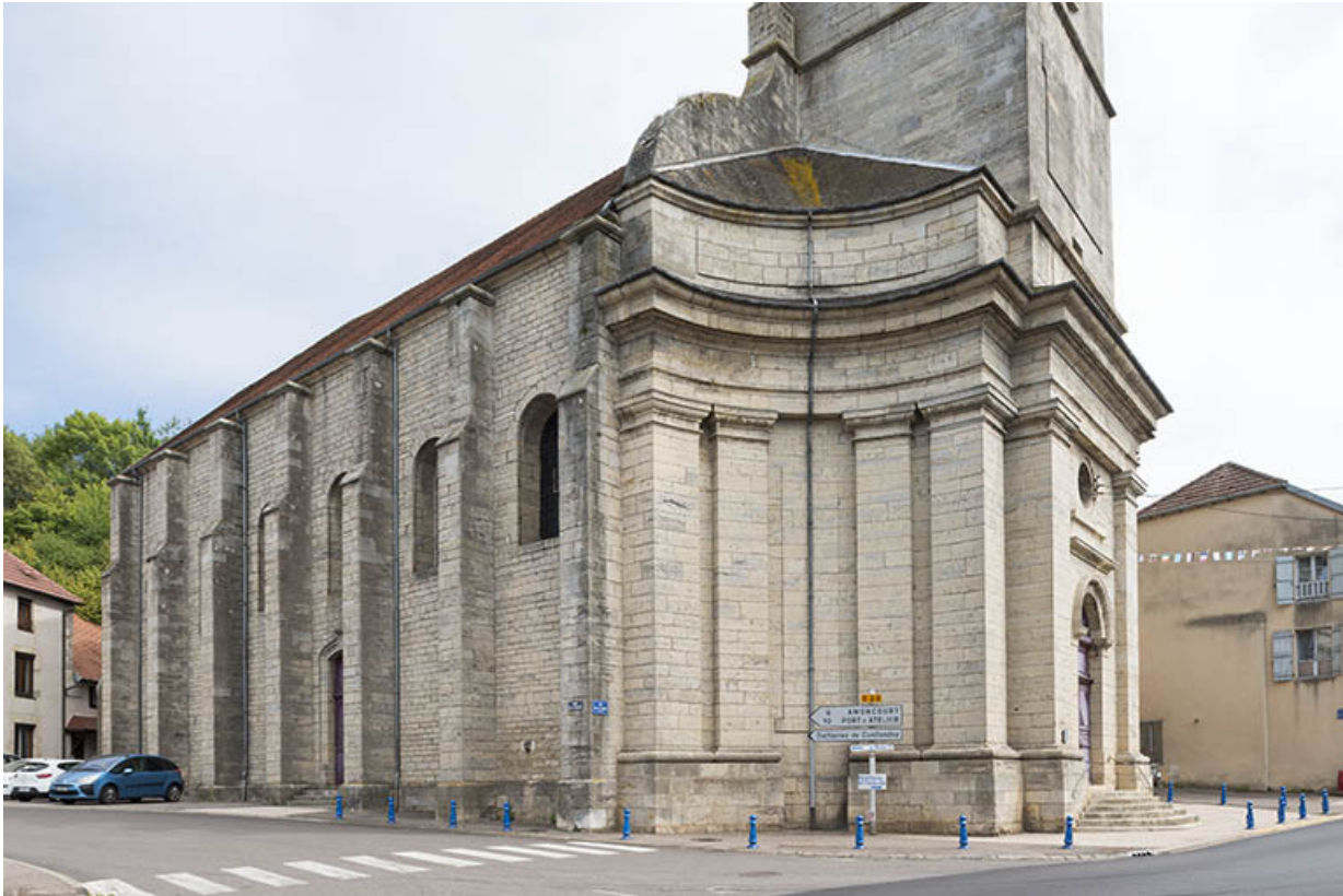
Le mur latéral ouest de l'édifice.