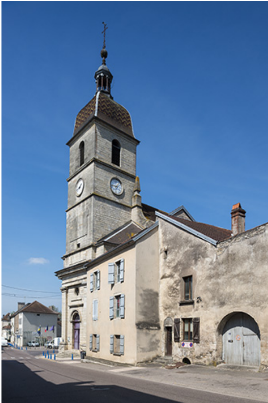
Le clocher carré et le toit à l'impérial.