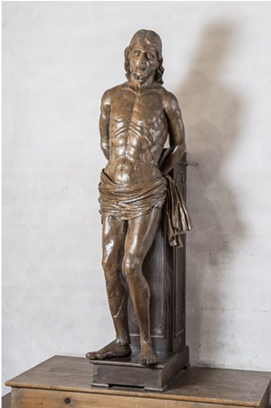
Statue représentant un Christ à la colonne.