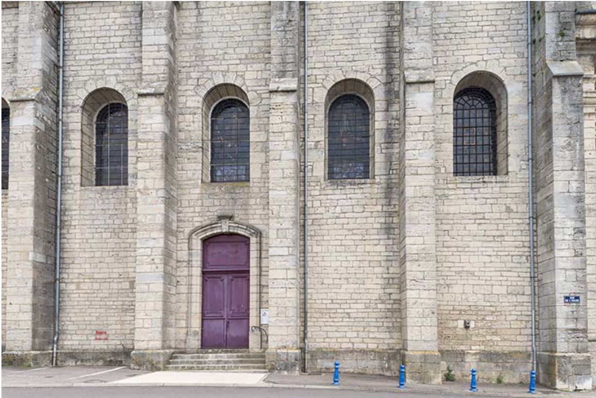
Le mur latéral ouest avec les baies en plein cintre.