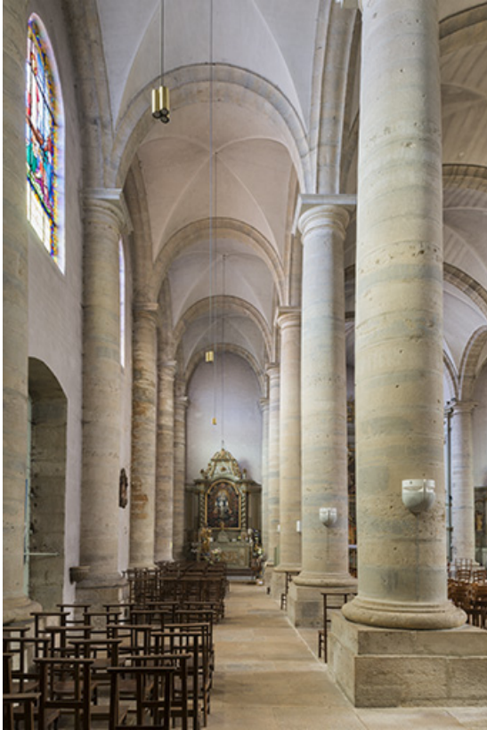
Le collatéral Ouest.