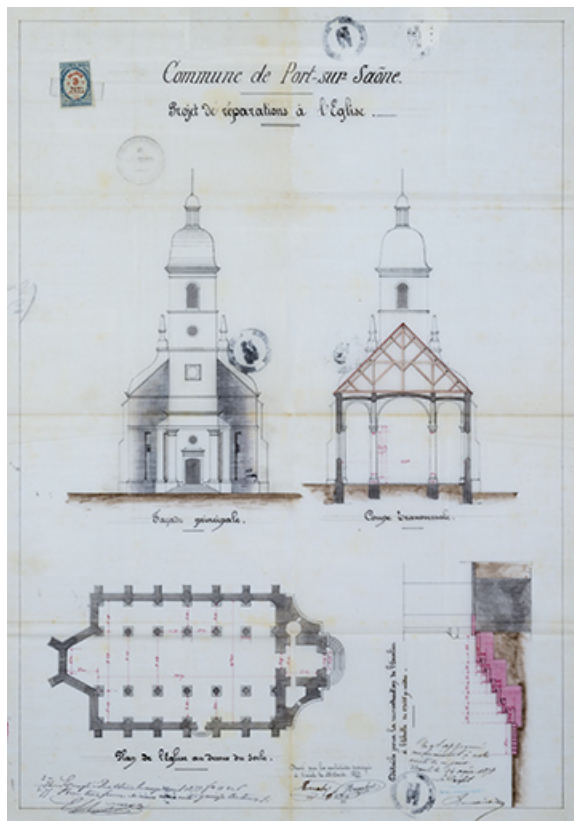
Plan pour projets de réparations, 1877.