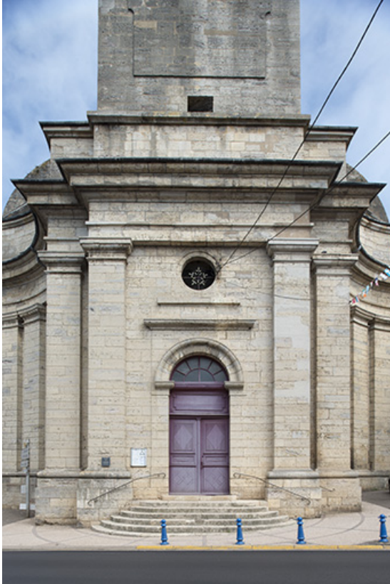
La façade principale et le portail d'entrée.