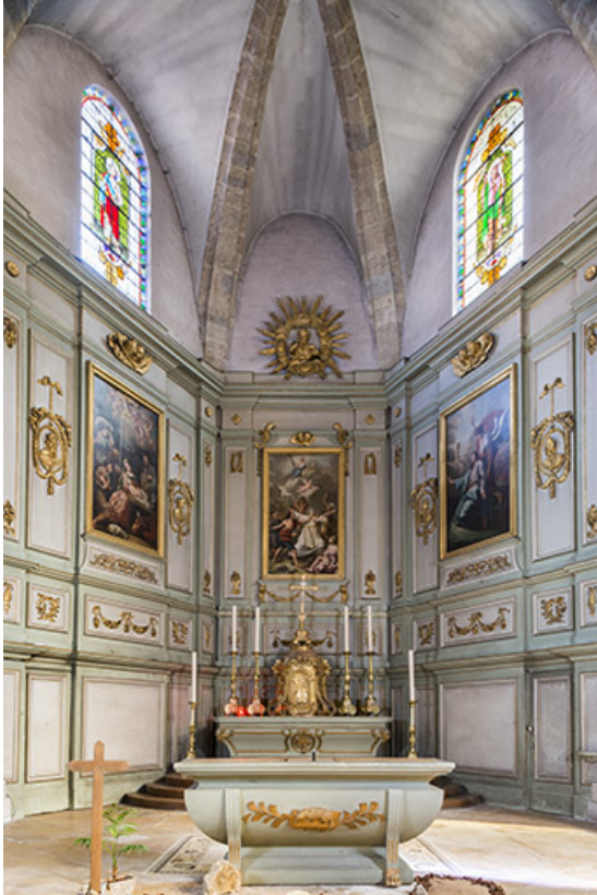
Vue sur le sanctuaire.