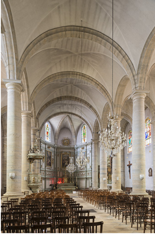
Vue générale de la nef centrale.