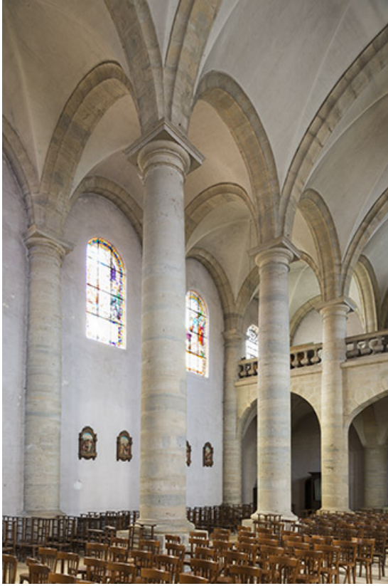
Vue sur les colonnes séparant la nef du collatéral Ouest. 70, Port-sur-Saône Grande Rue