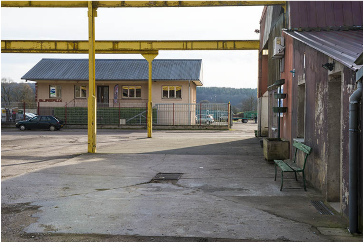
Les anciens bureaux de la société Selam, route de Ferrières. 70, Port-sur-Saône