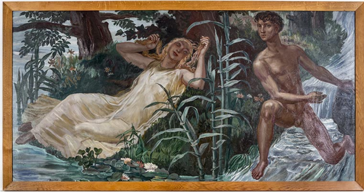
Tableau " La Saône et le Doubs" d'A. Decaris, mairie de Port-sur-Saône. 70, Port-sur-Saône