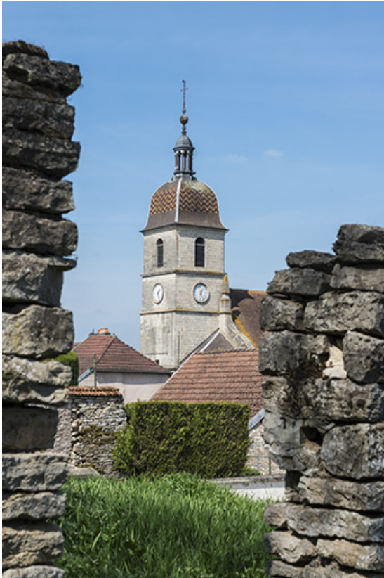
le clocher, vue depuis le Tertre.