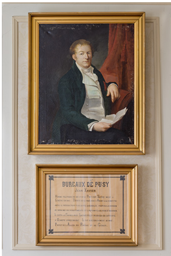
Tableau représentant Jean-Xavier Bureau de Pusy, mairie de Port-sur-Saône. 70, Port-sur-Saône