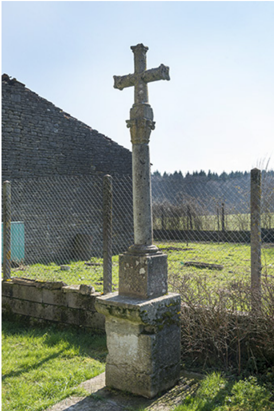
Croix située au hameau des Arpents.