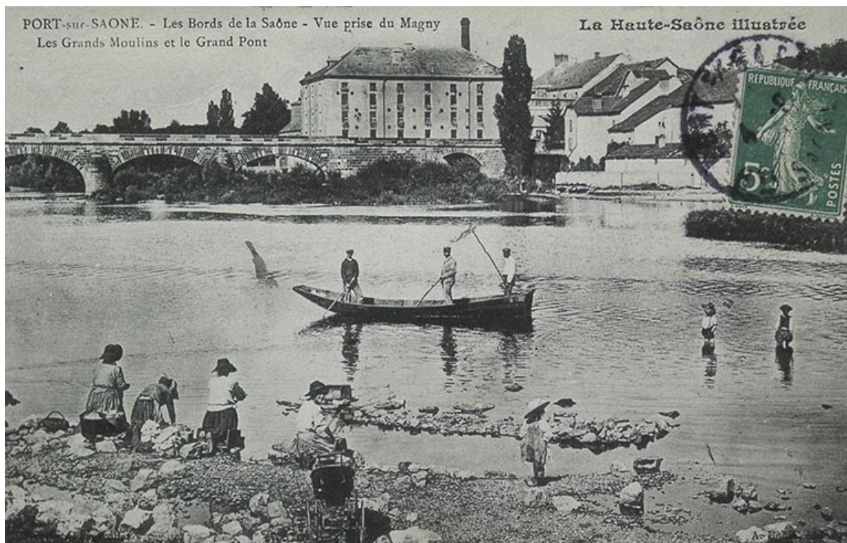
Les bords de Saône, carte postale.