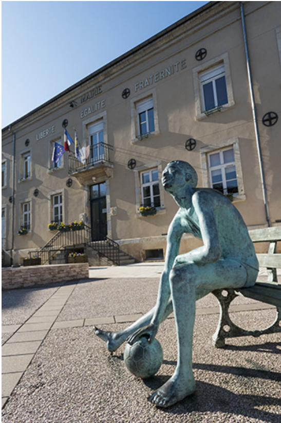
Façade principale de la mairie. 70, Port-sur-Saône