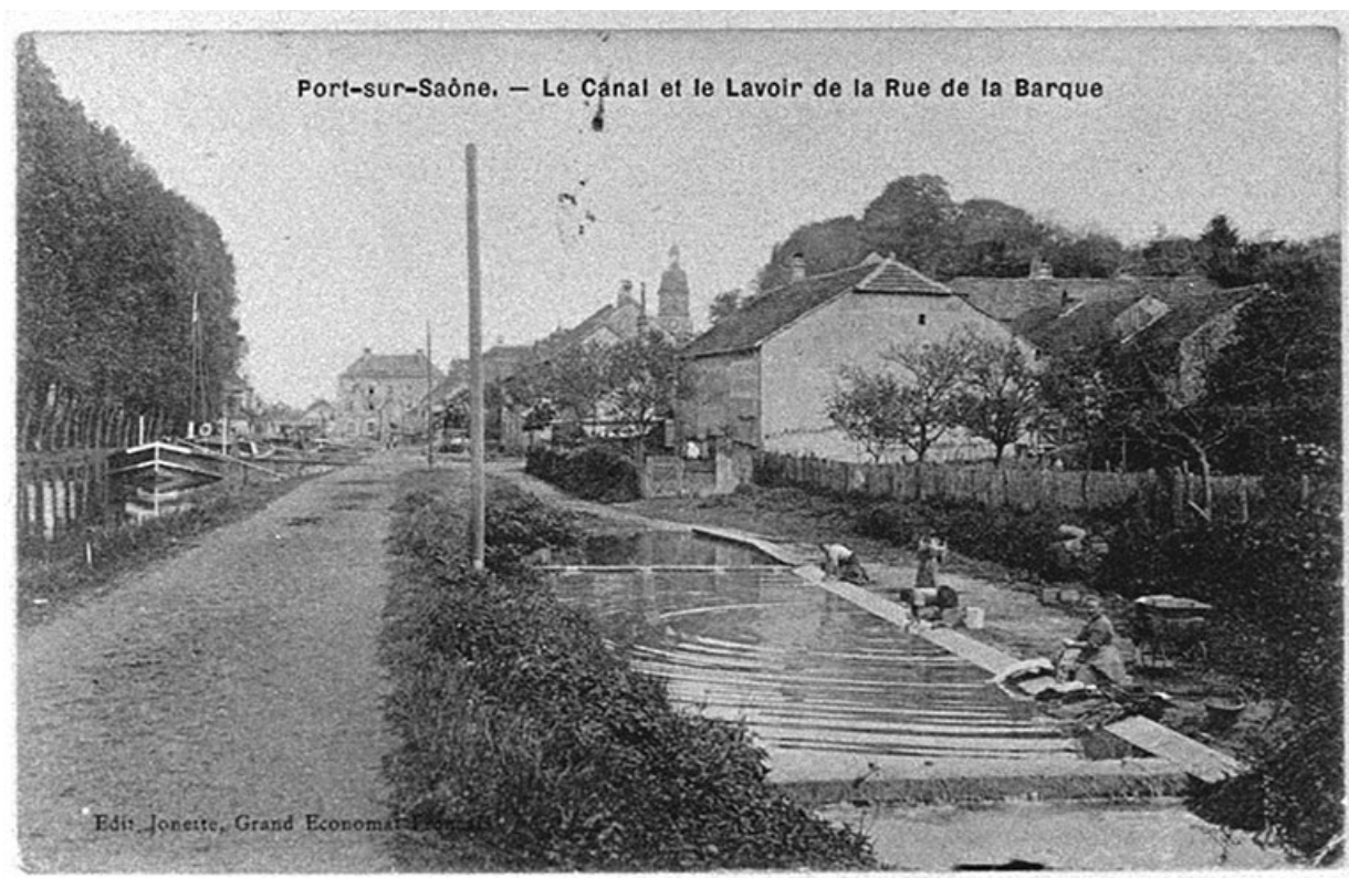
Le lavoir rue de la Barque, carte postale.