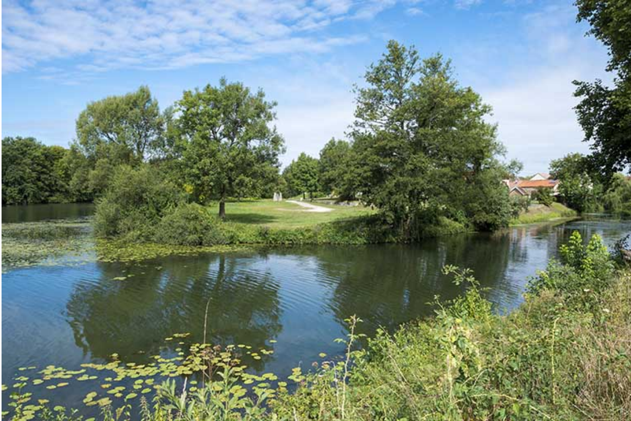
L'île de la Rezelle, vue depuis la digue. 70, Port-sur-Saône