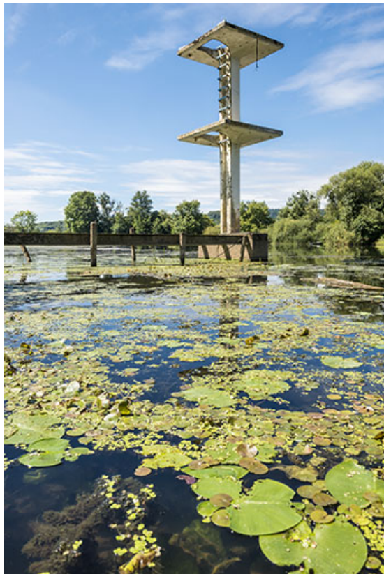
Le plongeur, base de loisir. 70, Port-sur-Saône