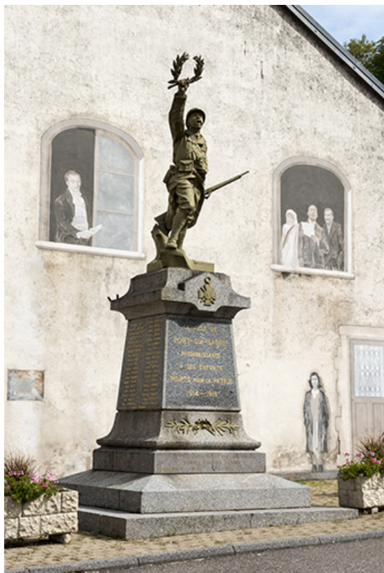
Le monument aux Morts, place de l'église. 70, Port-sur-Saône