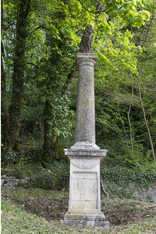
Croix située à l'ancien cimetière, rue de l'Eglise. 70, Port-sur-Saône