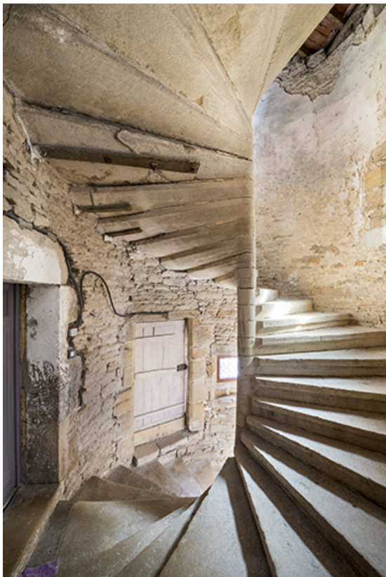
Escahier situé dans l'ancien prieuré.