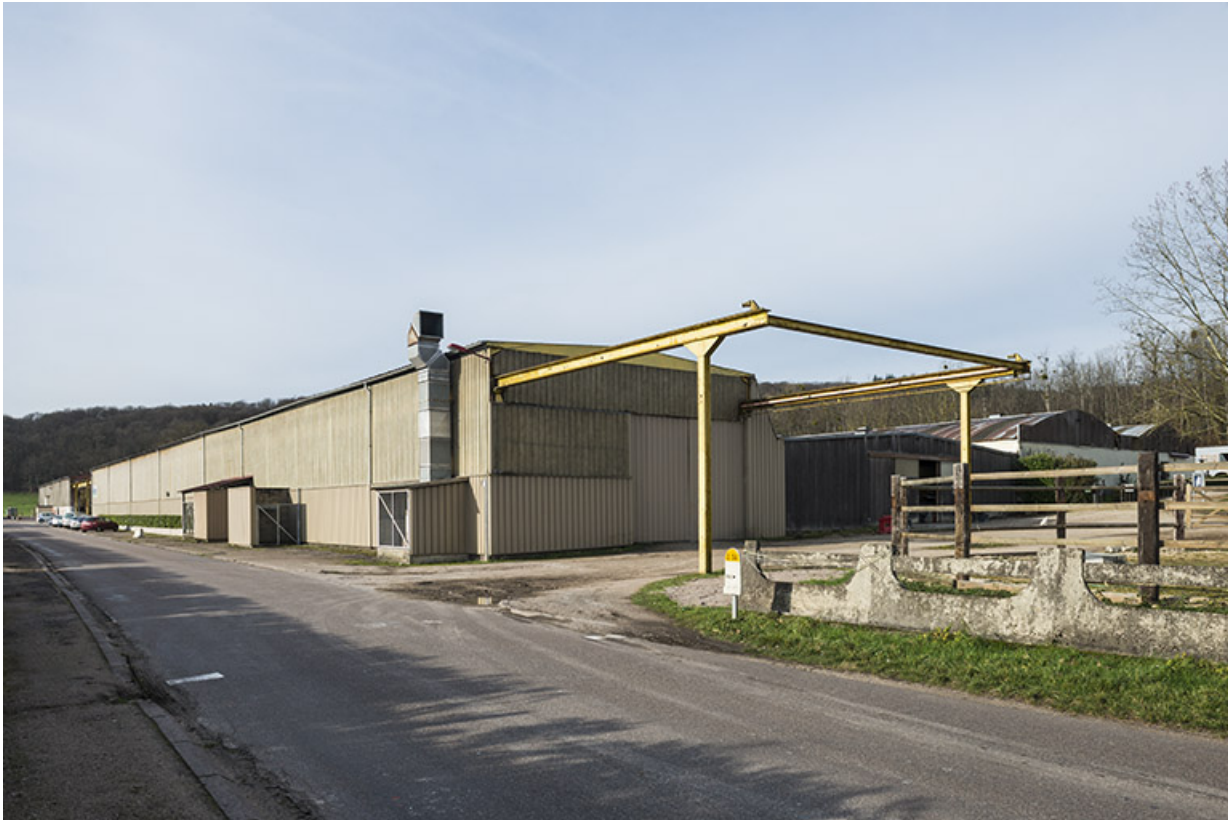
Hangar de la société Selam, route de Ferrières. 70, Port-sur-Saône