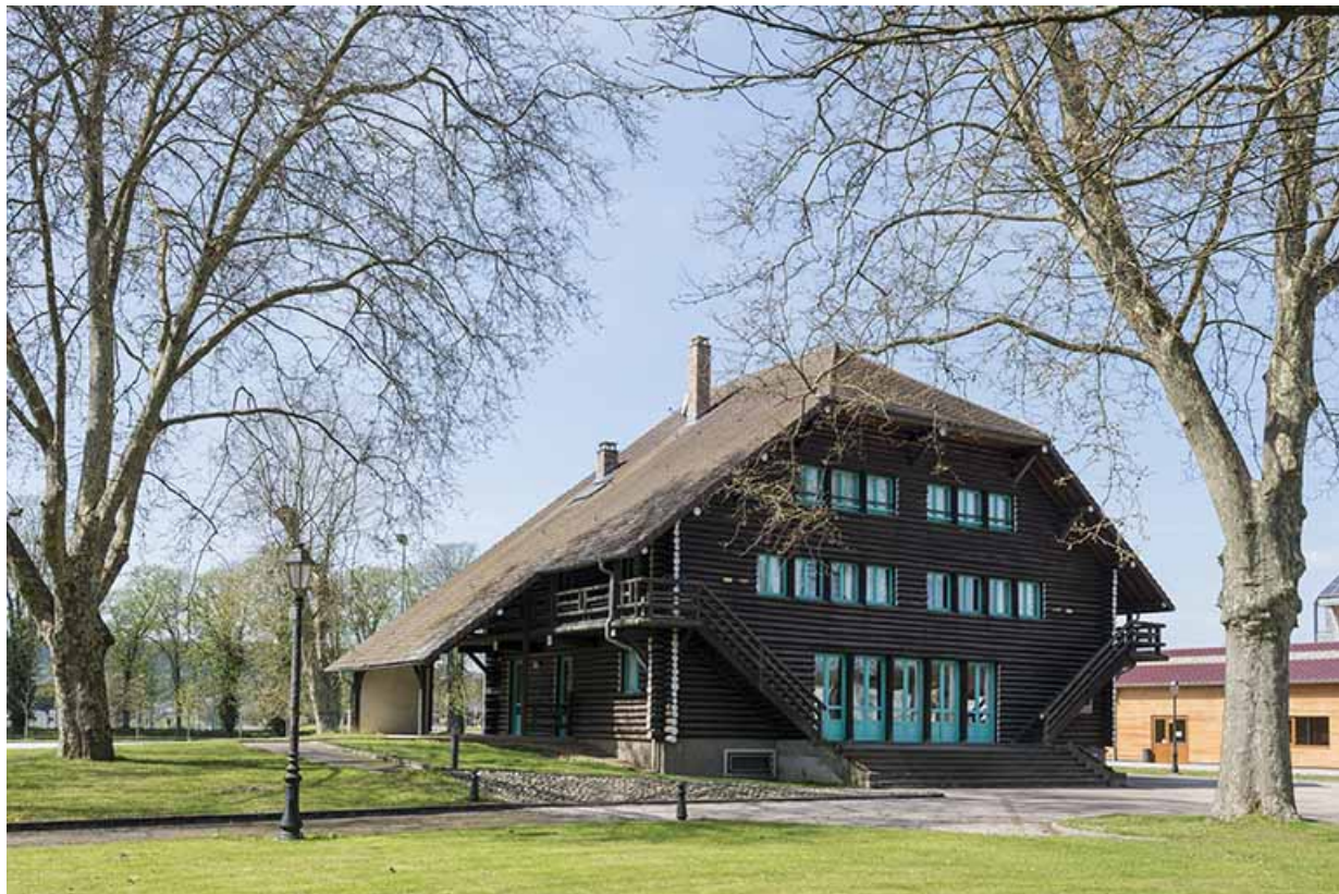
L'auberge de jeunesse. 70, Port-sur-Saône