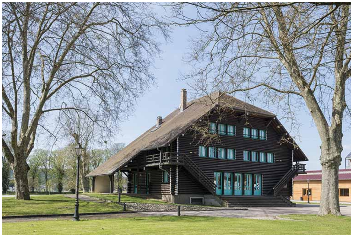
L'auberge de jeunesse.