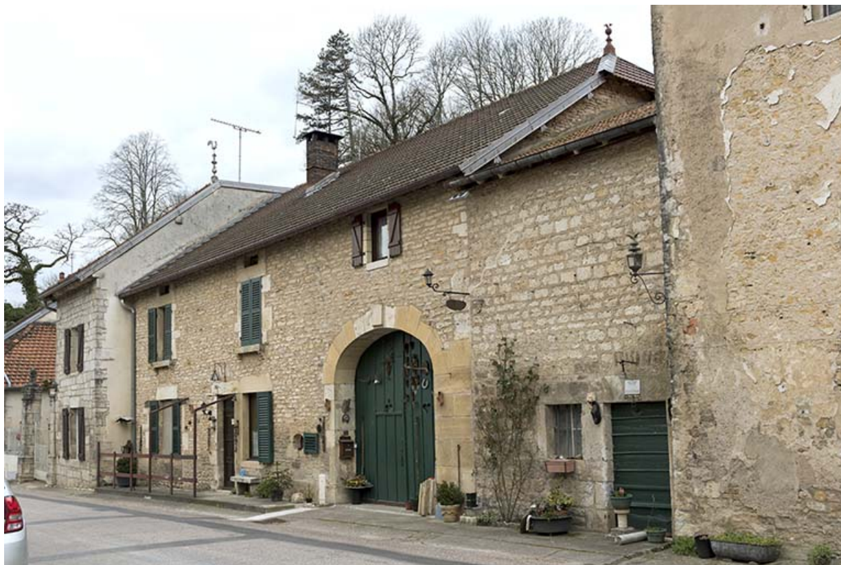
Vue générale de trois quarts droite.