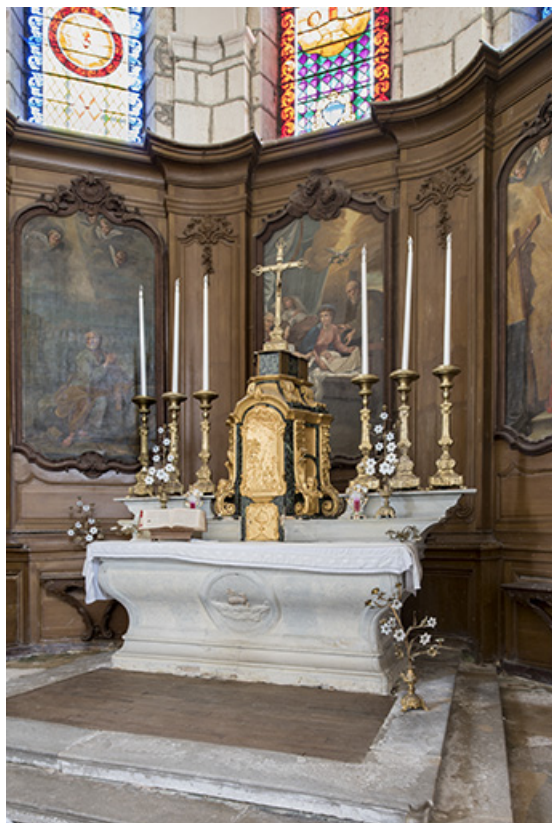
Vue générale du chœur et du maître-autel.