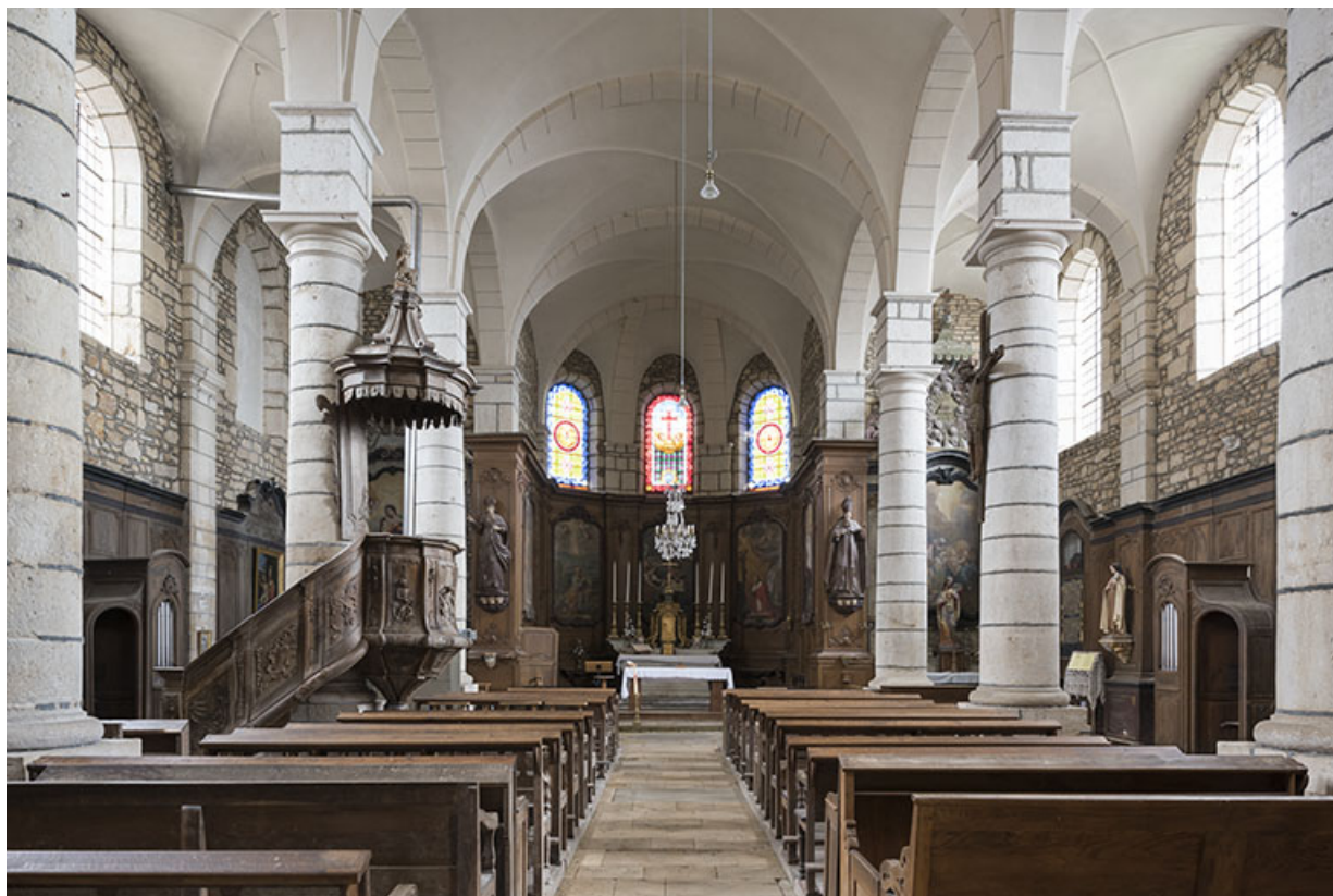
Intérieur : vue des vaisseaux en direction du chœur.