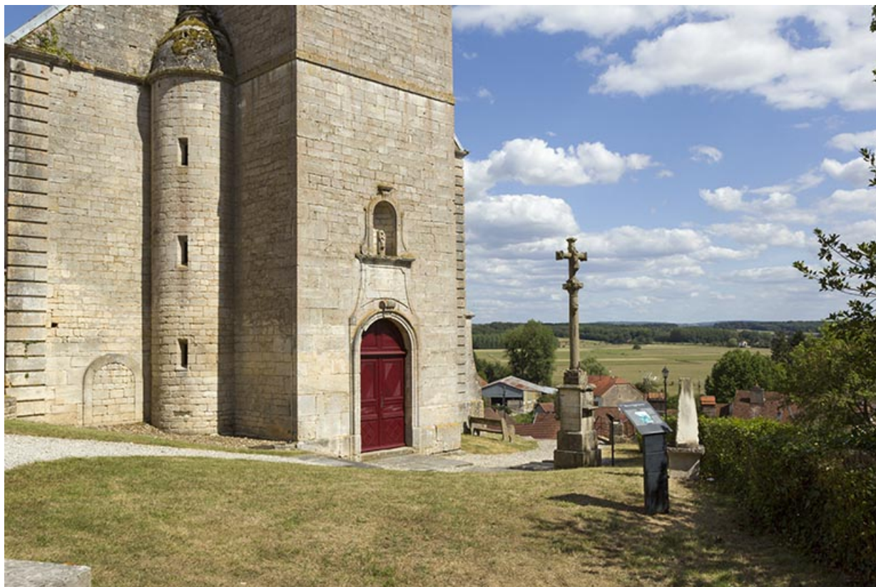
Vue du rez-de-chaussée de la tour-clocher. 70, Rupt-sur-Saône