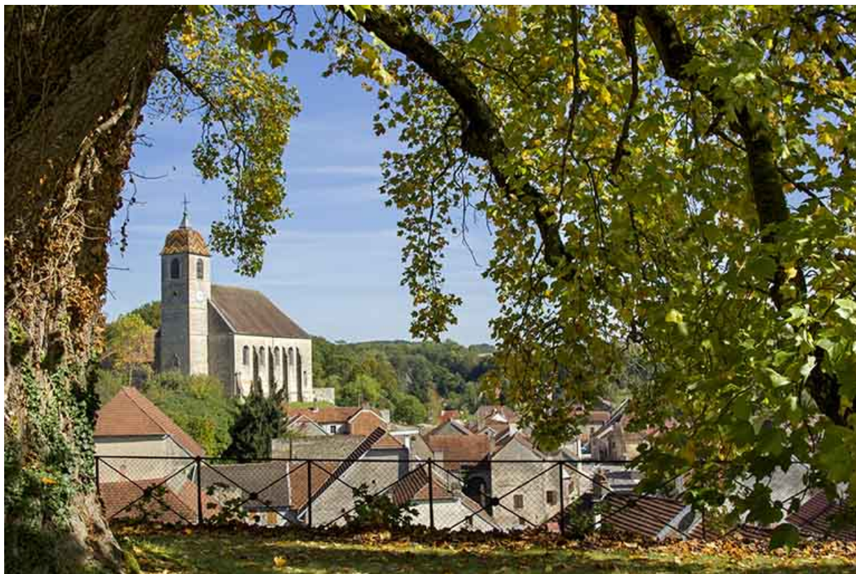
Vue générale depuis le château.