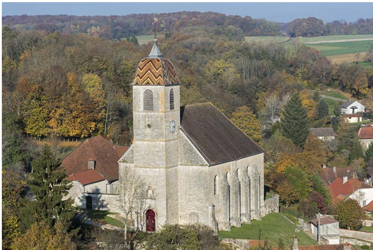
Vue générale depuis le château.