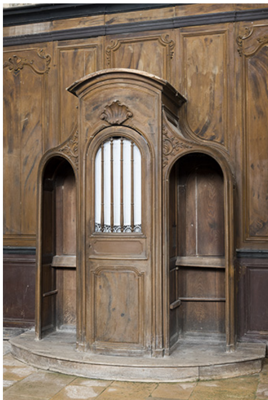
Vue générale d'un confessionnal.