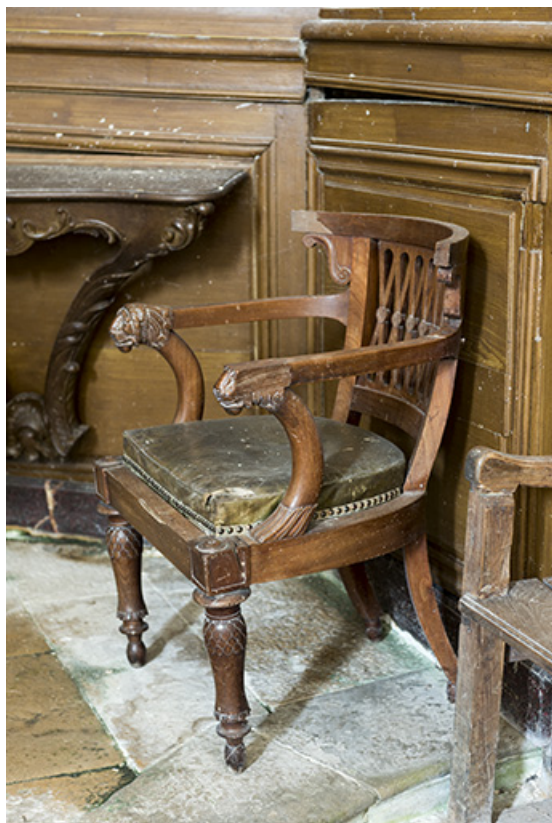
Fauteuil du général comte d'Orsay.