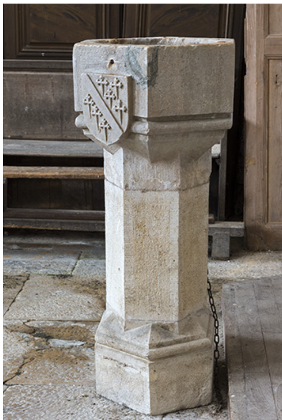
Vue générale du bénitier.