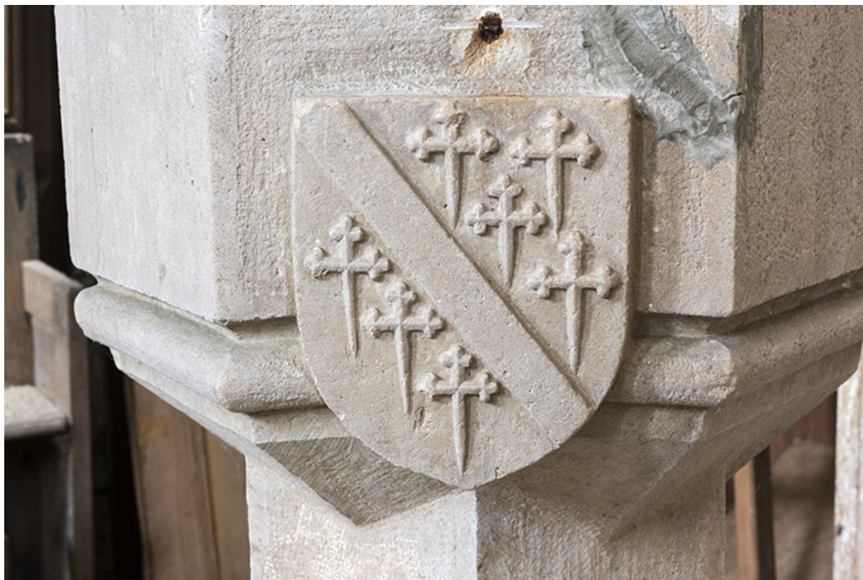
Détail du bénitier : les armoiries.