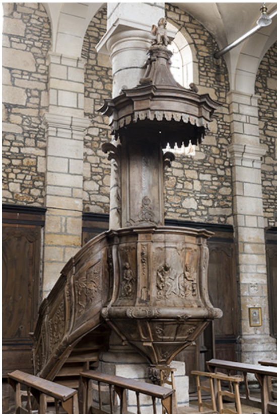
Vue générale de la chaire à prêcher. 70, Rupt-sur-Saône