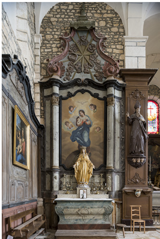
Vue générale de l'autel-retable latéral nord. 70, Rupt-sur-Saône