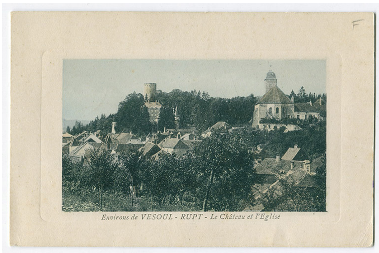
Environs de Vesoul - Rupt - Le Château et l'Eglise, début 20e siècle. 70, Rupt-sur-Saône