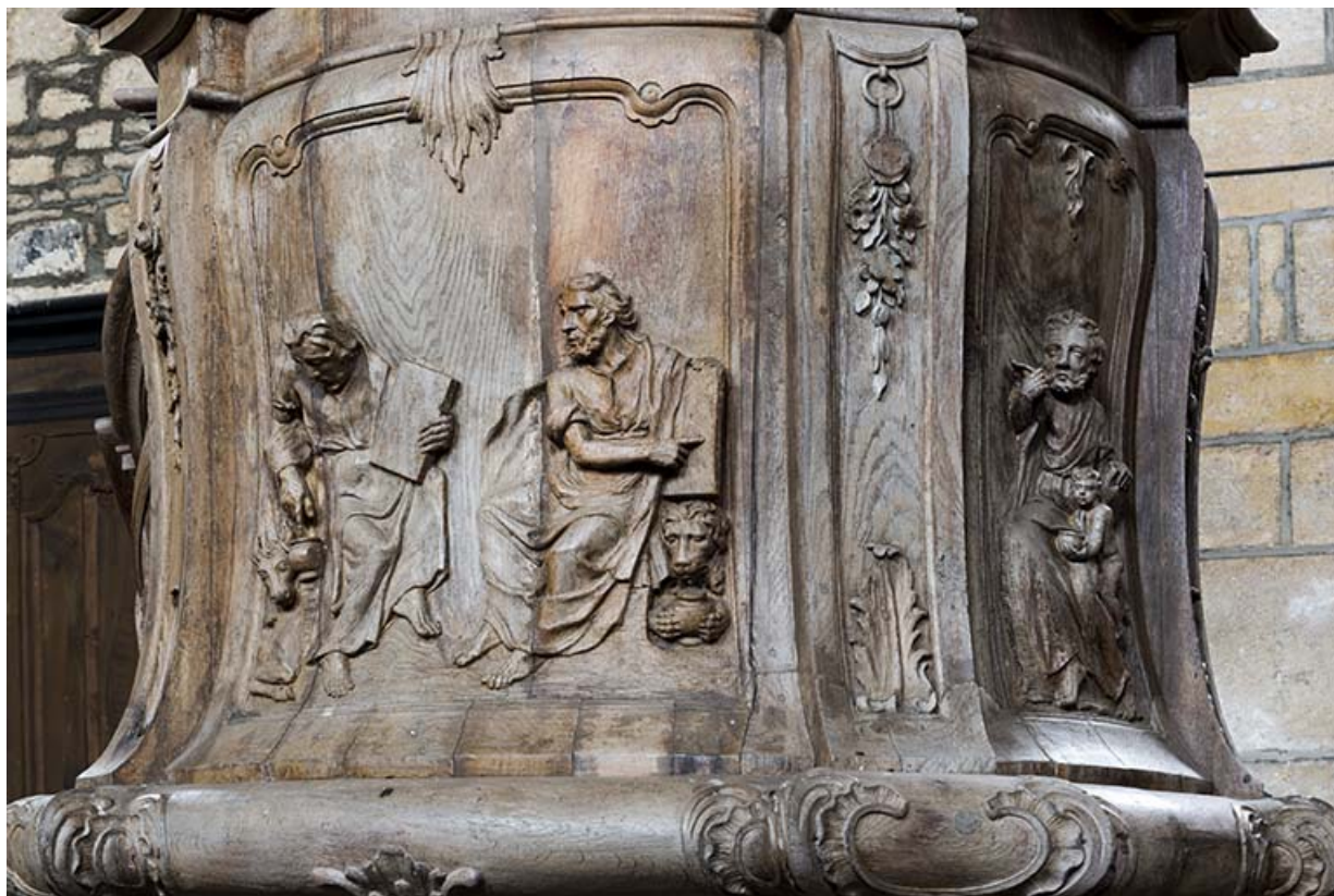
Détail de la chaire à prêcher : les panneaux de la cuve. 70, Rupt-sur-Saône