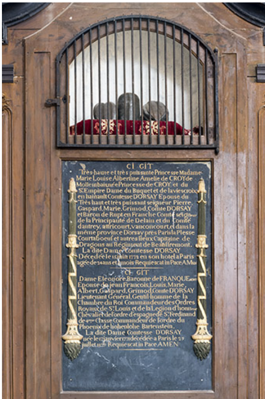
Vue générale de l'épithaphe de la princesse de Croy et de la baronne de Franquemont. 70, Rupt-sur-Saône