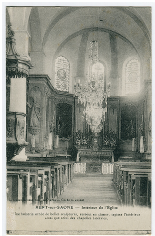
Rupt-sur-Saône - Intérieur de l'Eglise, 2e moitié 19e siècle. 70, Rupt-sur-Saône