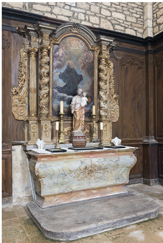
Vue générale de l'autel-retable dédié à saint François de Paule, provenant du couvent des minimes. 70, Rupt-sur-Saône