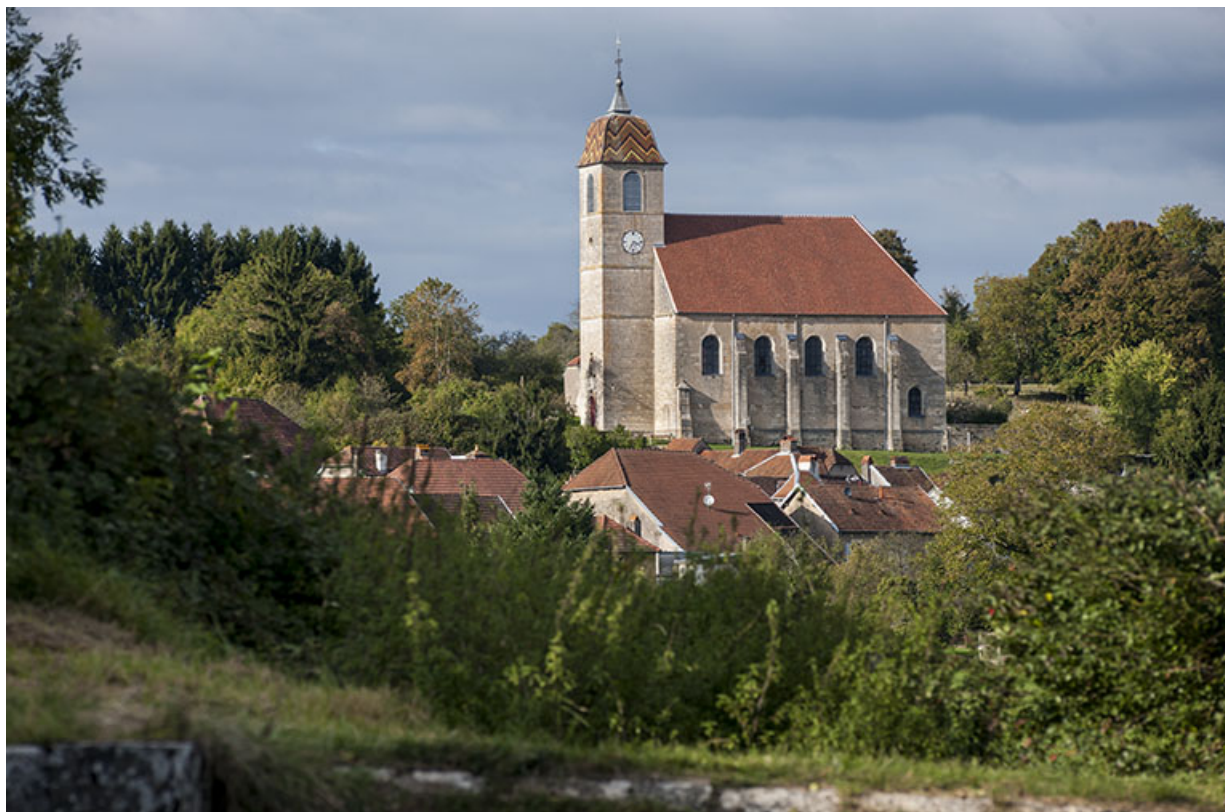
Vue générale depuis la Saône.