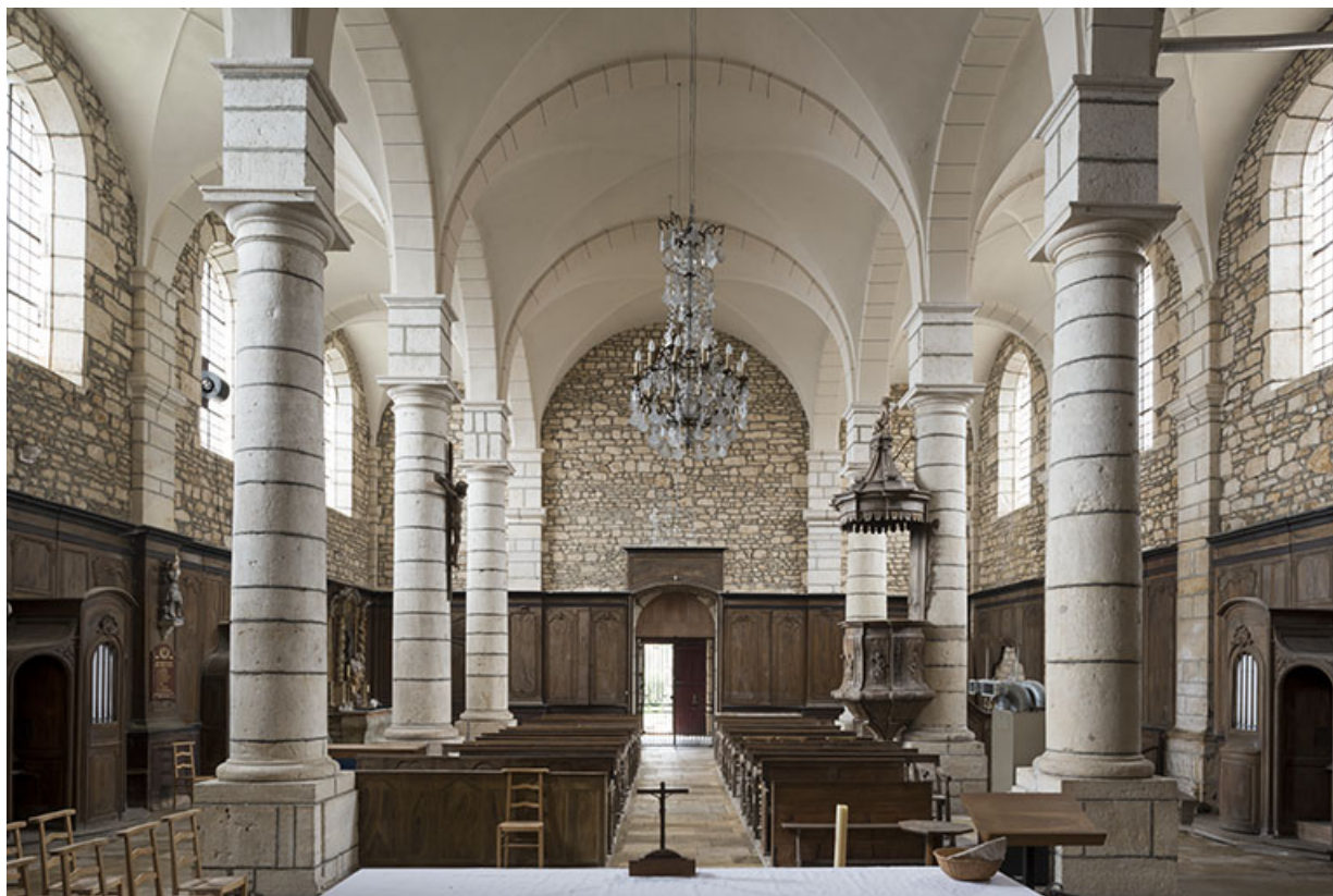
Inérieur : vue des vaisseaux depuis le choeur. 70, Rupt-sur-Saône