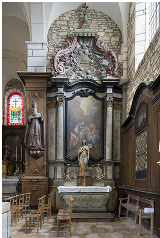
Vue générale de l'autel-retable latéral sud. 70, Rupt-sur-Saône