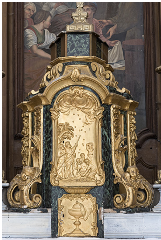
Vue générale du tabernacle.