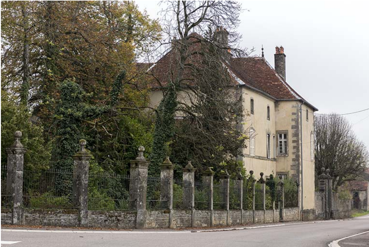
La façade sur rue et le parc vus du nord-ouest.