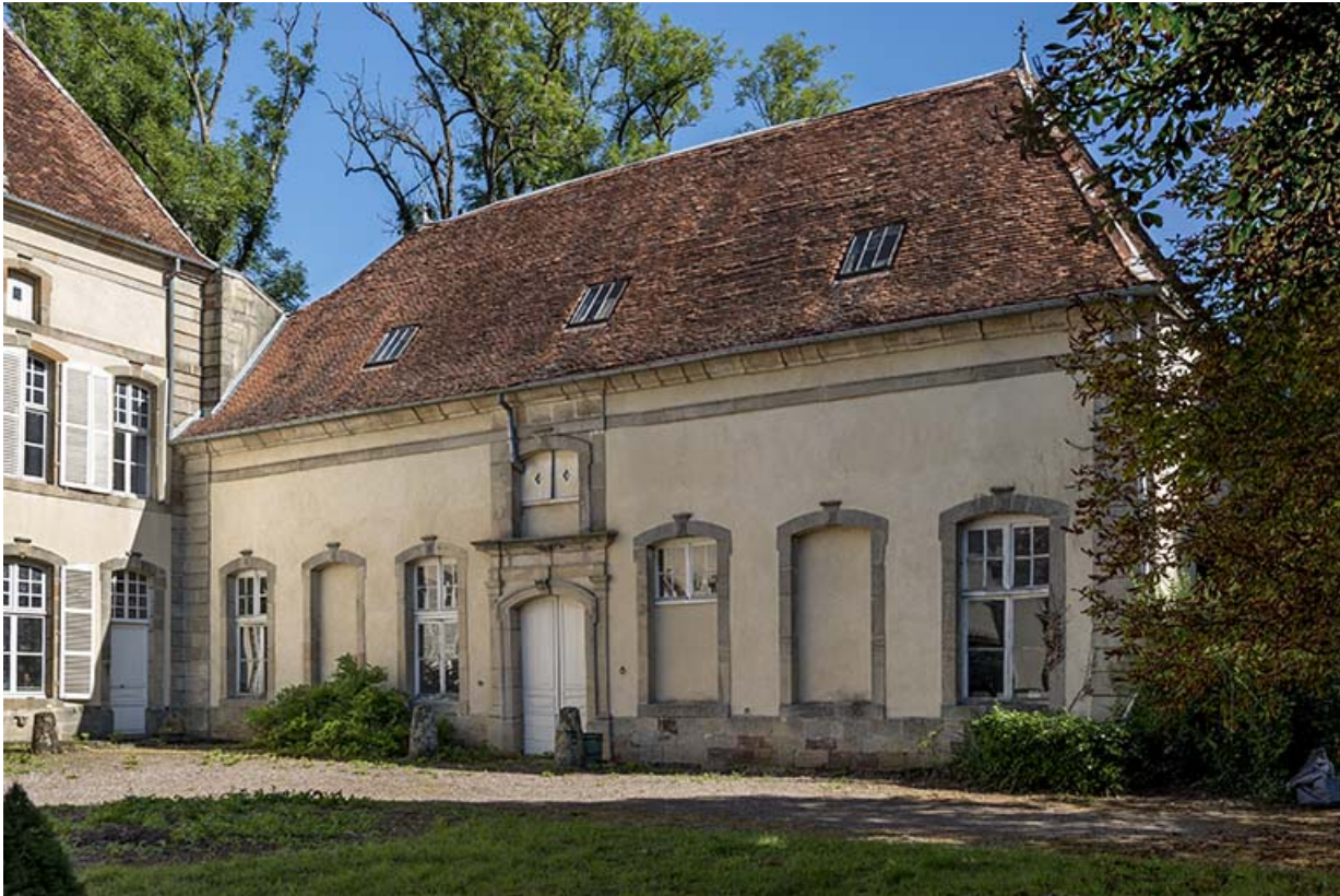
Dépendance : vue du sud de la façade antérieure.