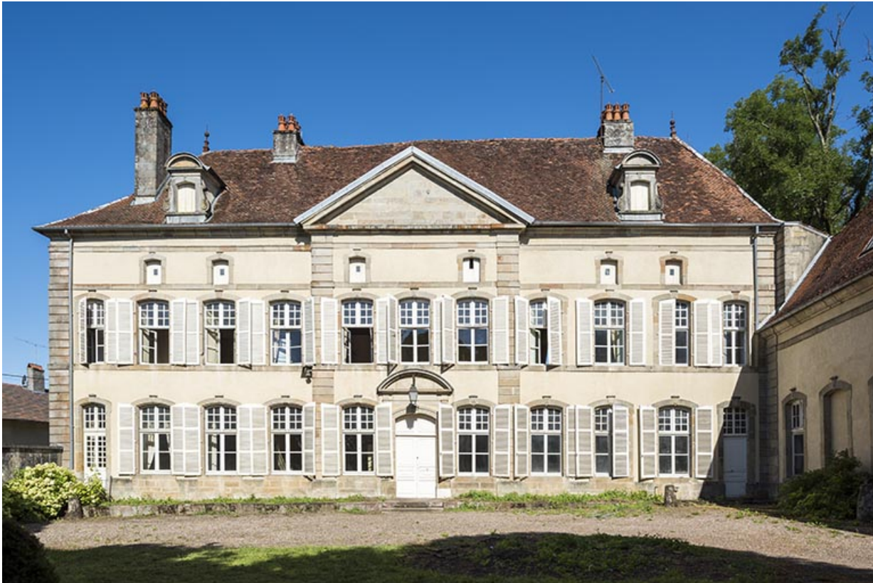
Château de Vougécourt.