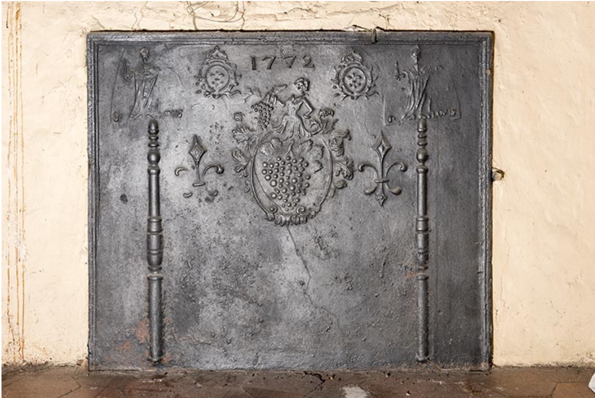
A l'étage : seconde pièce à gauche depuis l'escalier. (angle sud) Plaque de cheminée. (1772) 70, Vougécourt, 1 rue des Marronniers