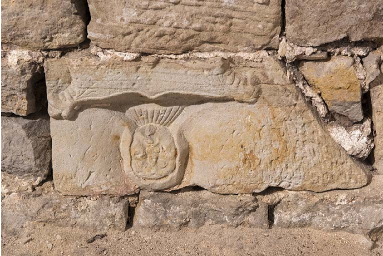
Element de bas-relief en remploi dans le sous-sol.