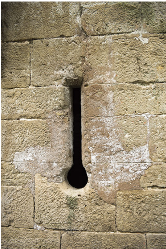
Tour ouest : vue extérieure de la canonnière. 70, Demangevelle