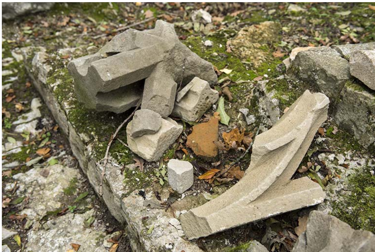
Fragments de voutes.