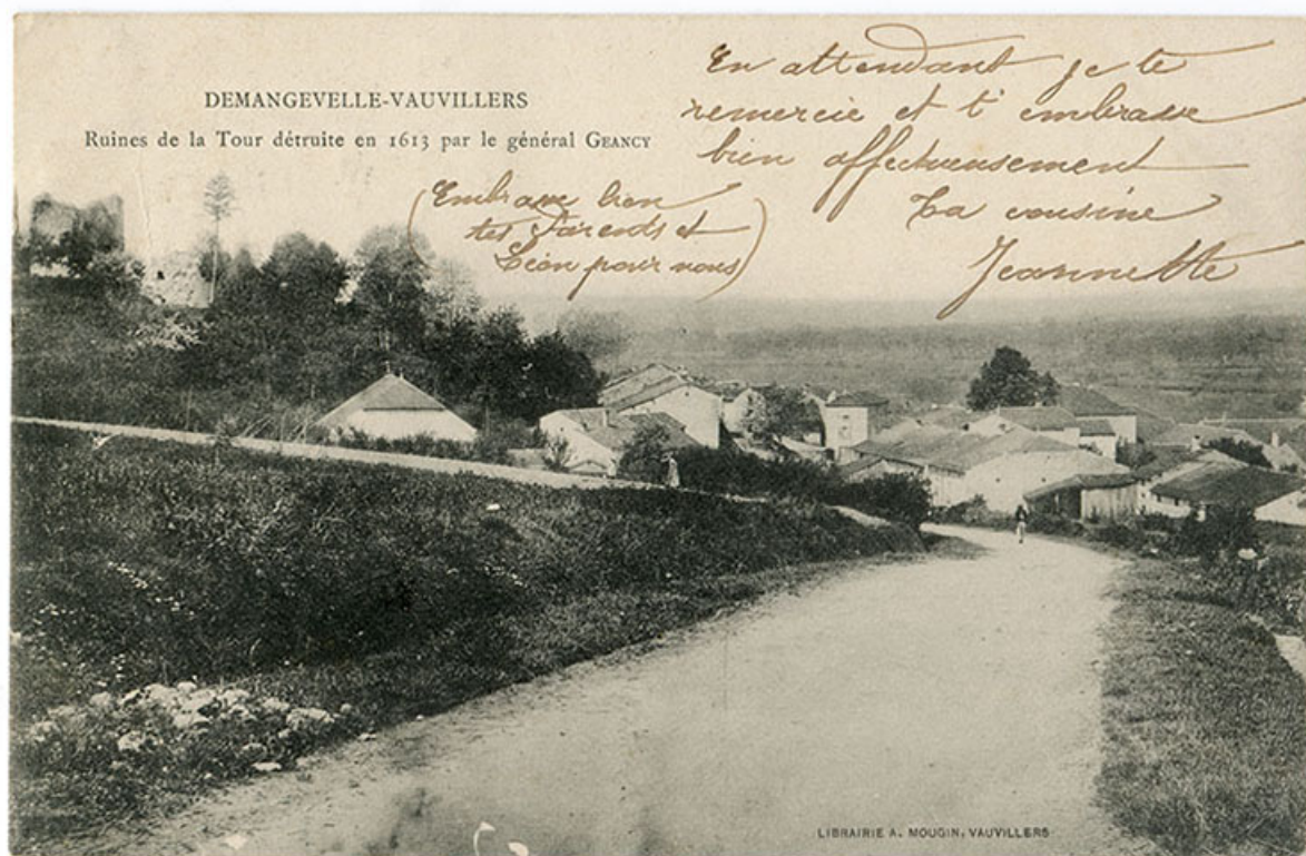
Demangevelle-Vauvillers. Ruines de la tour détruite en 1613 par le général Geancy." Carte postale. 70, Demangevelle