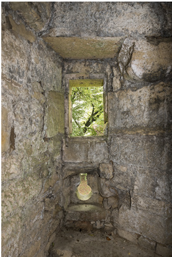
Dans la tour ouest : meurtrière, canonnière. 70, Demangevelle