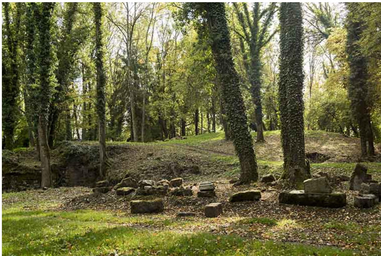
Vestiges lithiques en périphérie de la tour ouest.