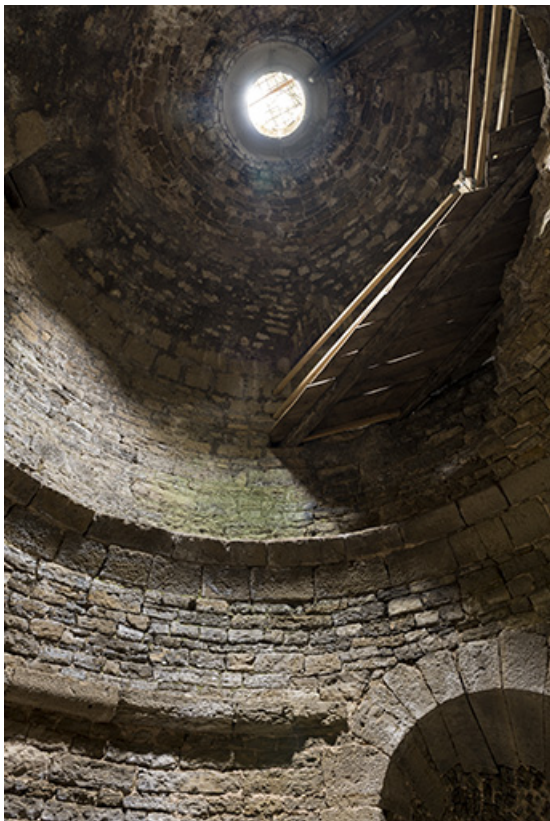
Dans la tour ouest. Vue de la partie sommitale depuis l'intérieur. 70, Demangevelle