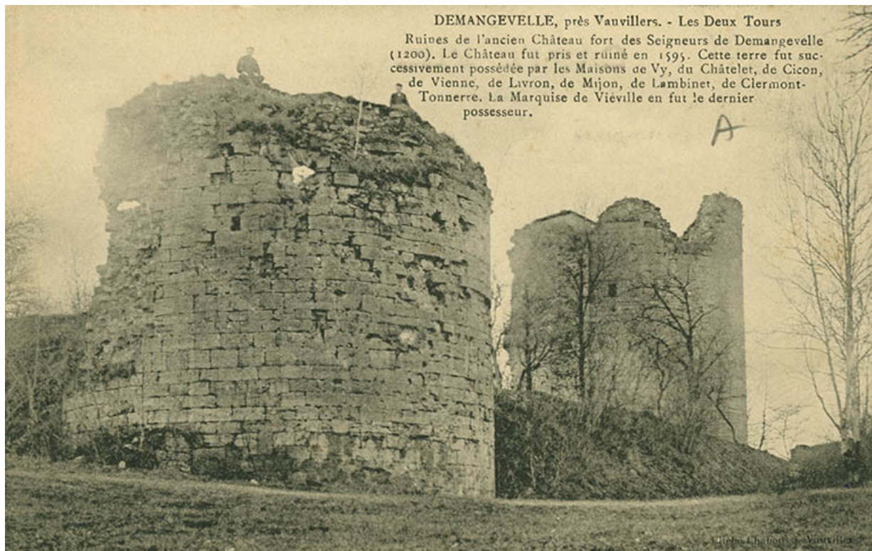
Demangevelle. Les deux tours. Carte postale.