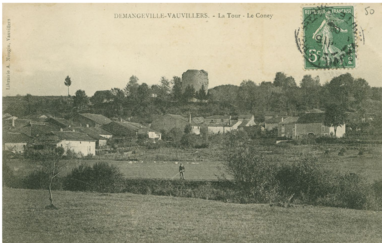
Demangevelle. La tour. Le Coney. Carte postale. 70, Demangevelle

Demangevelle. La tour. Le Coney. Postée le 16/6/1906. Librairie A. Mougin, Vauvillers.