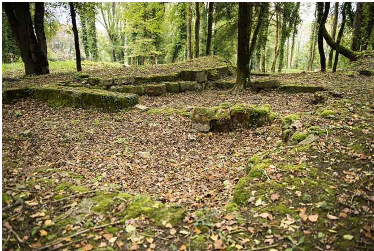
Vestiges. (ancienne chapelle ?)