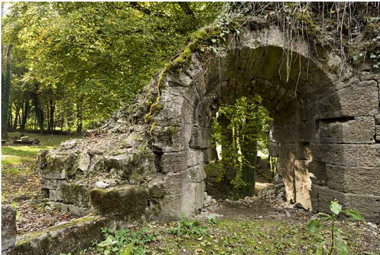
Tour est. Meurtrière orientée vers le sud ouest.