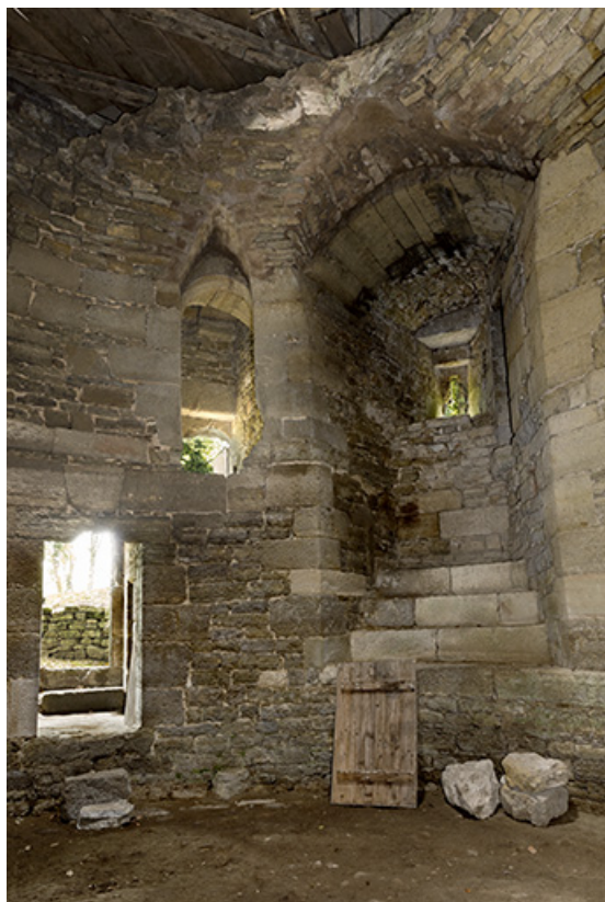
Dans la tour ouest : vue sur l'entrée et l'escalier. 70, Demangevelle