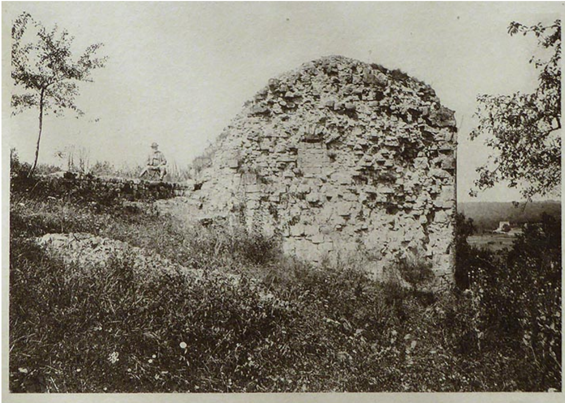
Photographie de Vedastus : les ruines de Demangevelle. Août 1890. 70, Demangevelle