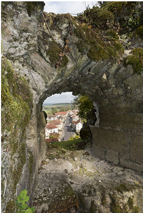
Vue sur le village depuis la tour est.