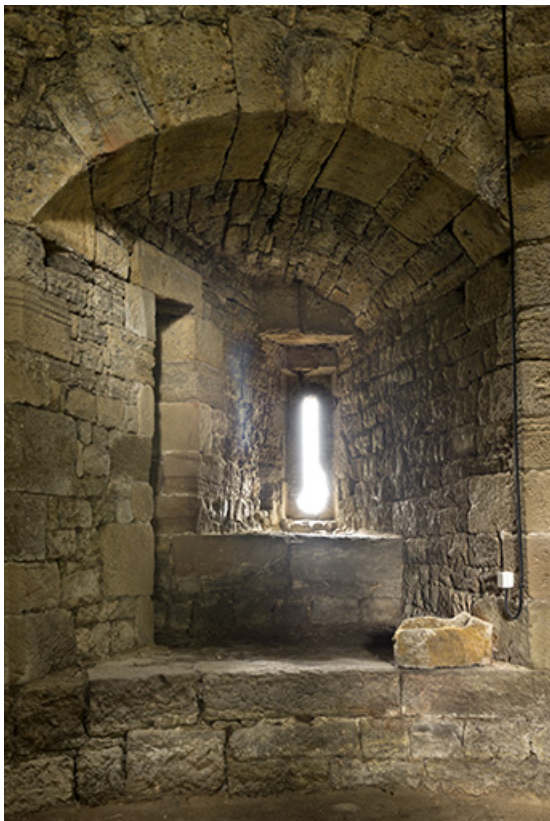
Dans la tour ouest : meurtrière, archère.