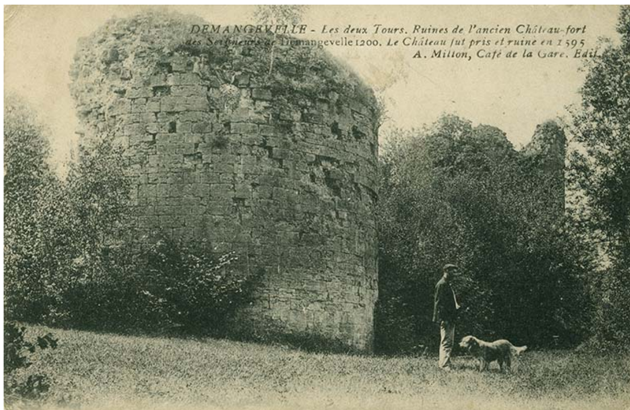
Demangevelle. Les deux tours. Carte postale. 70, Demangevelle

Demangevelle. Les deux tours. Carte postale. [s. n. , s. d. ] A. Milton, café de la Gare. Edit. Posté le 23/5/1916