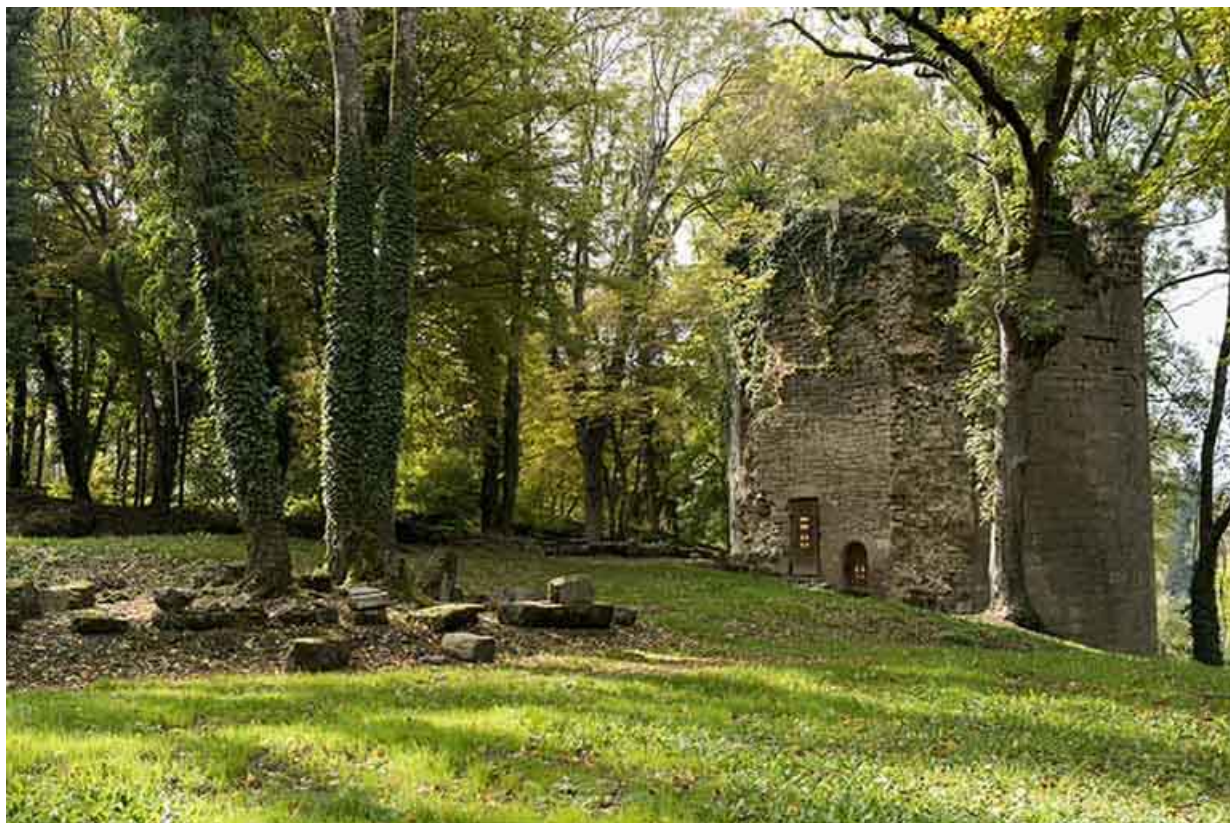
La tour ouest, vue de l'est.