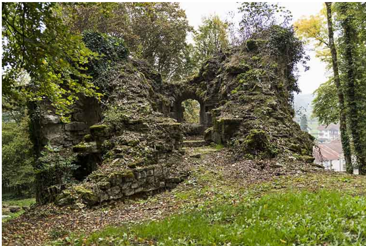
Vue sur la tour est.