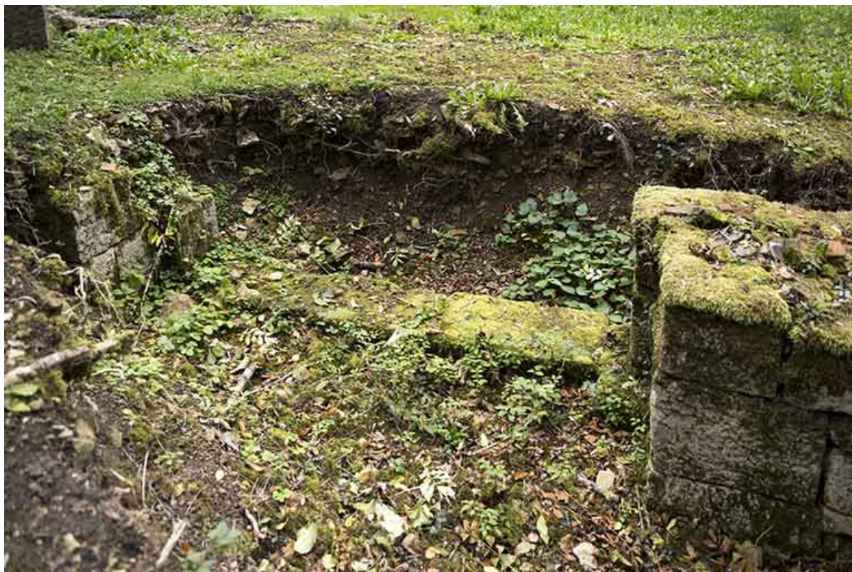
Détail de maçonnerie autour de la tour est.