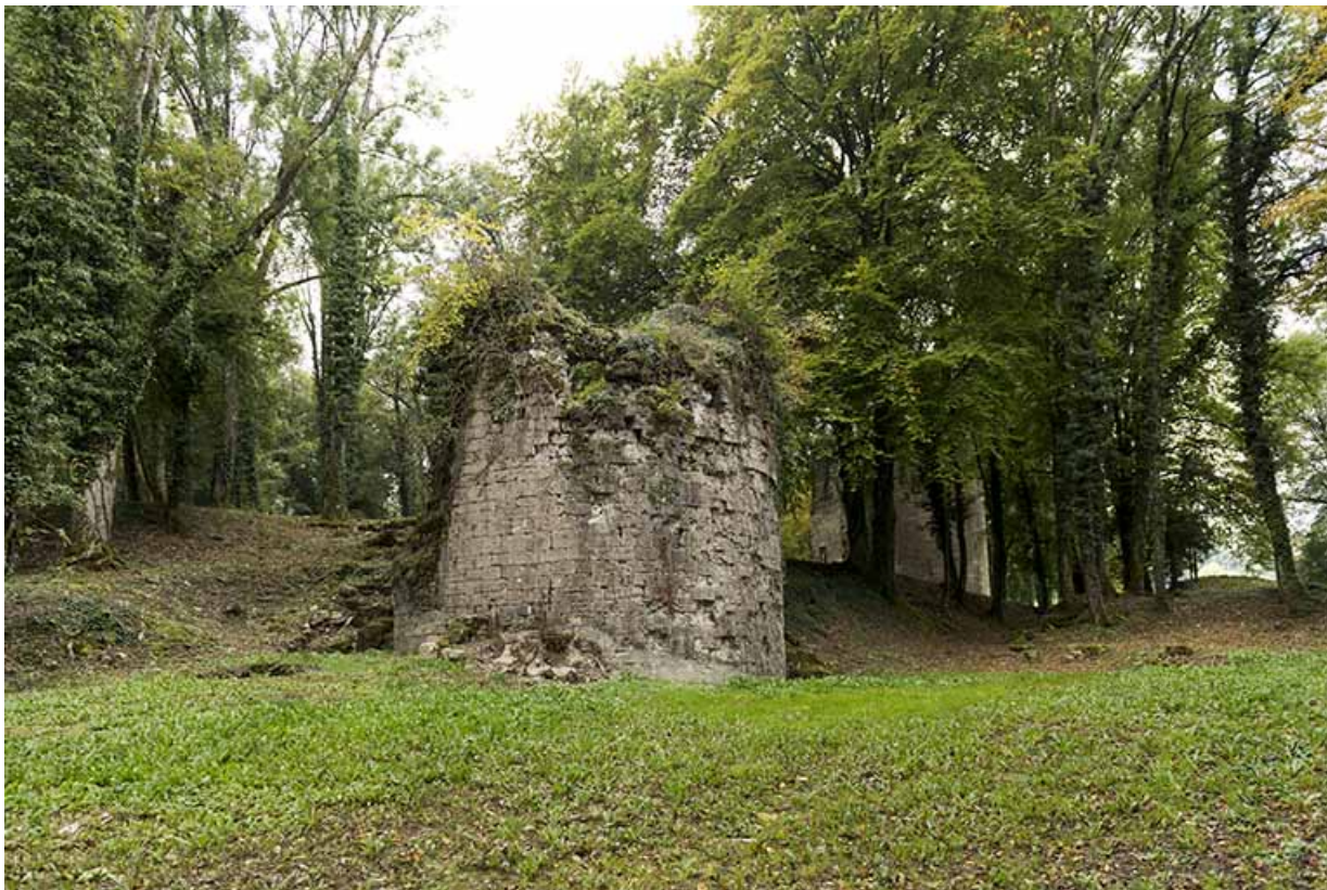
Depuis l'est, vue sur la tour est. La tour ouest est au second plan.