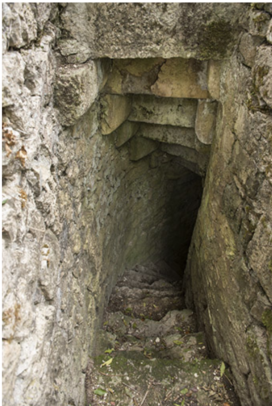
Dans la tour ouest. Vue de l'escalier depuis le haut. 70, Demangevelle