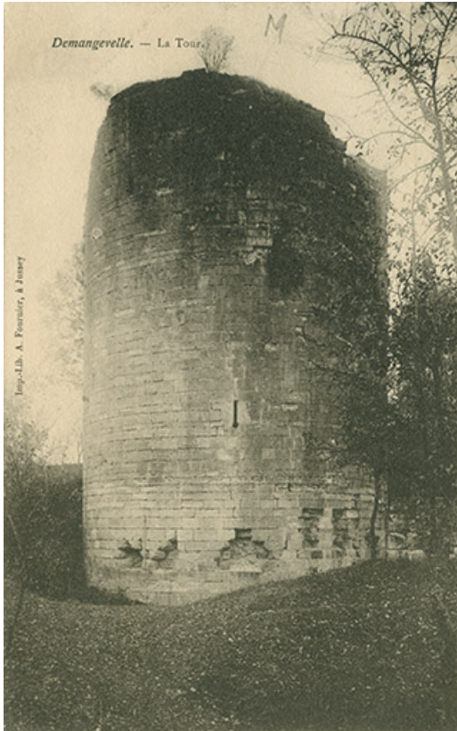
Demangevelle. La tour. Carte postale.