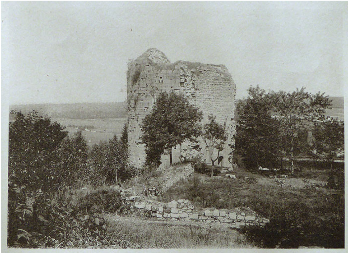
Photographie de Vedastus : les ruines de Demangevelle. Août 1890.