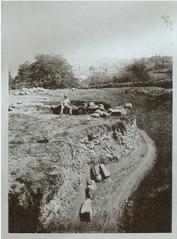
Photographie de Vedastus : les ruines de Demangevelle. Août 1890. 70, Demangevelle