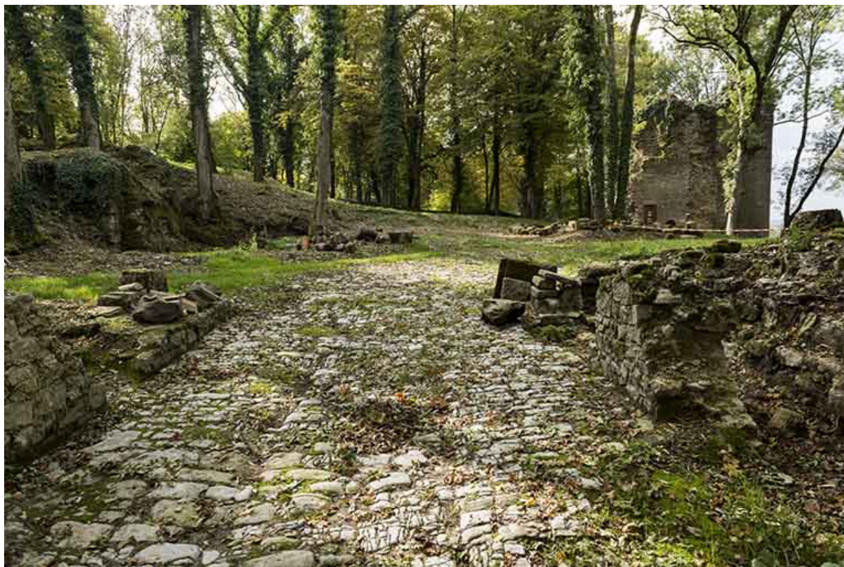
Chemin d'accès et vue sur la tour ouest.