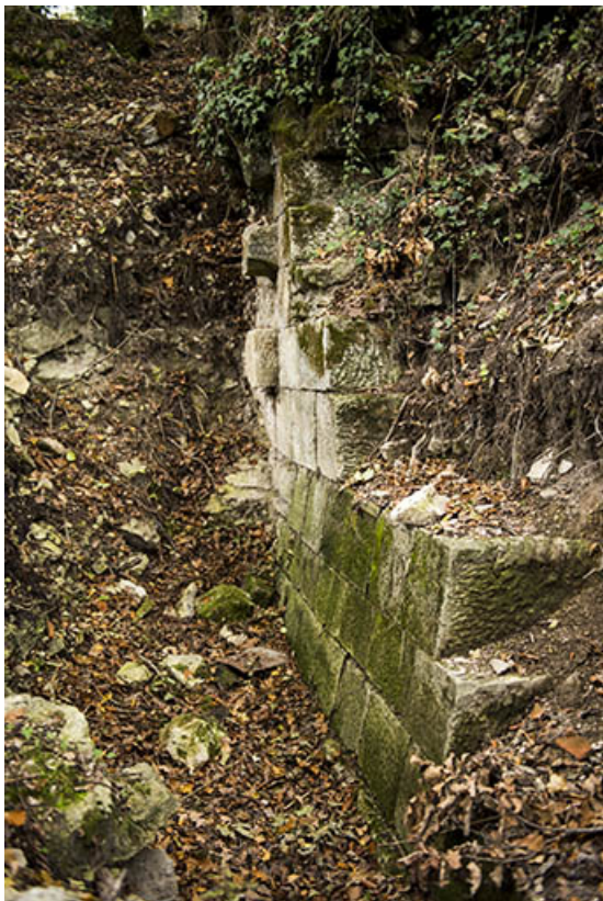
Vestiges. Détail de maçonnerie.