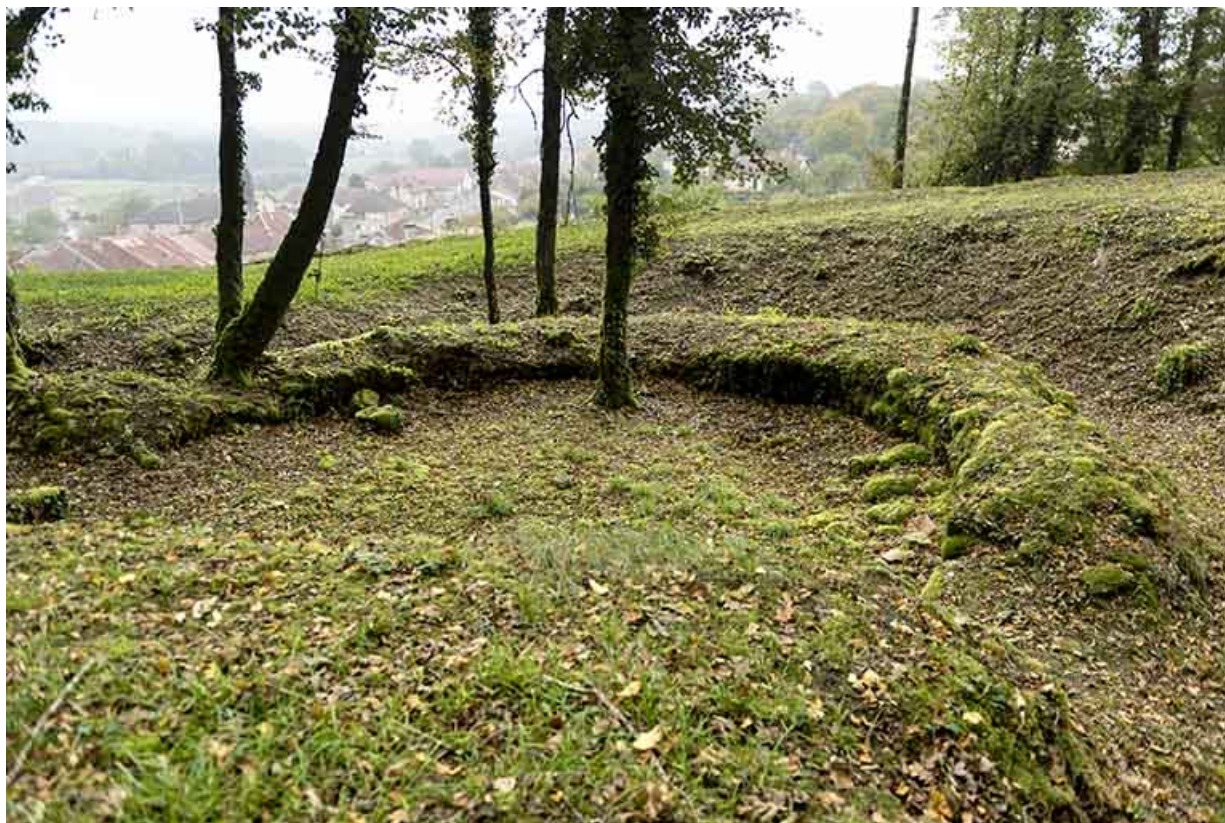
A l'est du promontoire : vestiges.