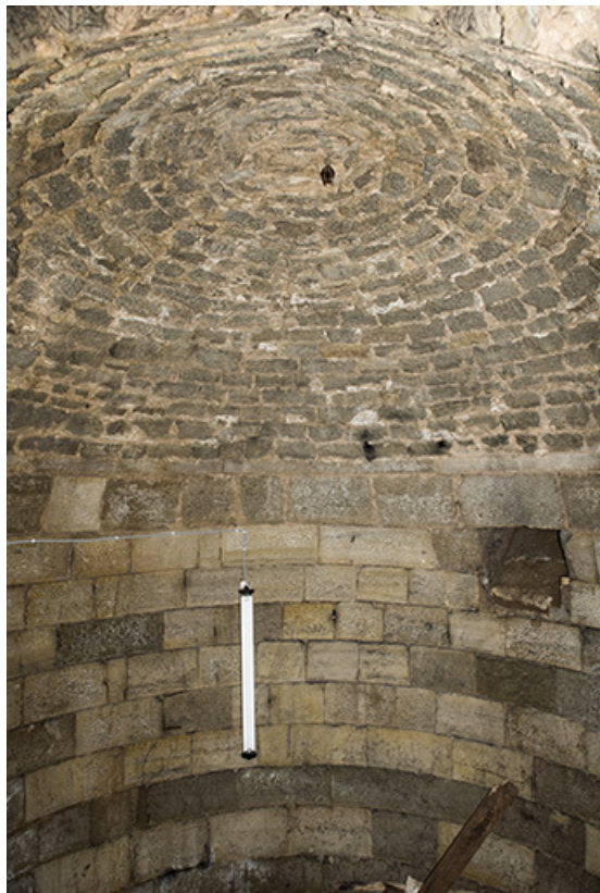
Dans la tour ouest. Niveau inférieur : citerne?