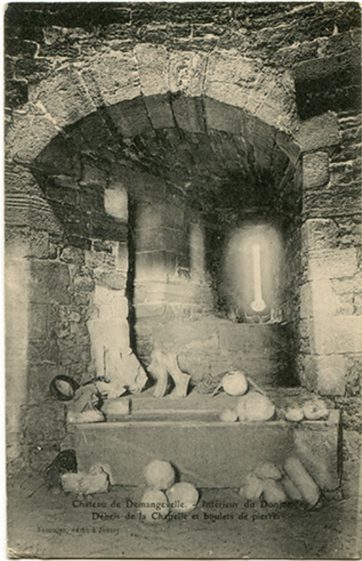
Château de Demangevelle. Intérieur du donjon. Débris de la chapelle et boulets de pierre. Carte postale. 70, Demangevelle

Château de Demangevelle. Intérieur du donjon. Débris de la chapelle et boulets de pierre. Carte postale. [s. n. , s. d. ] Fournier Edit. à Jussey.