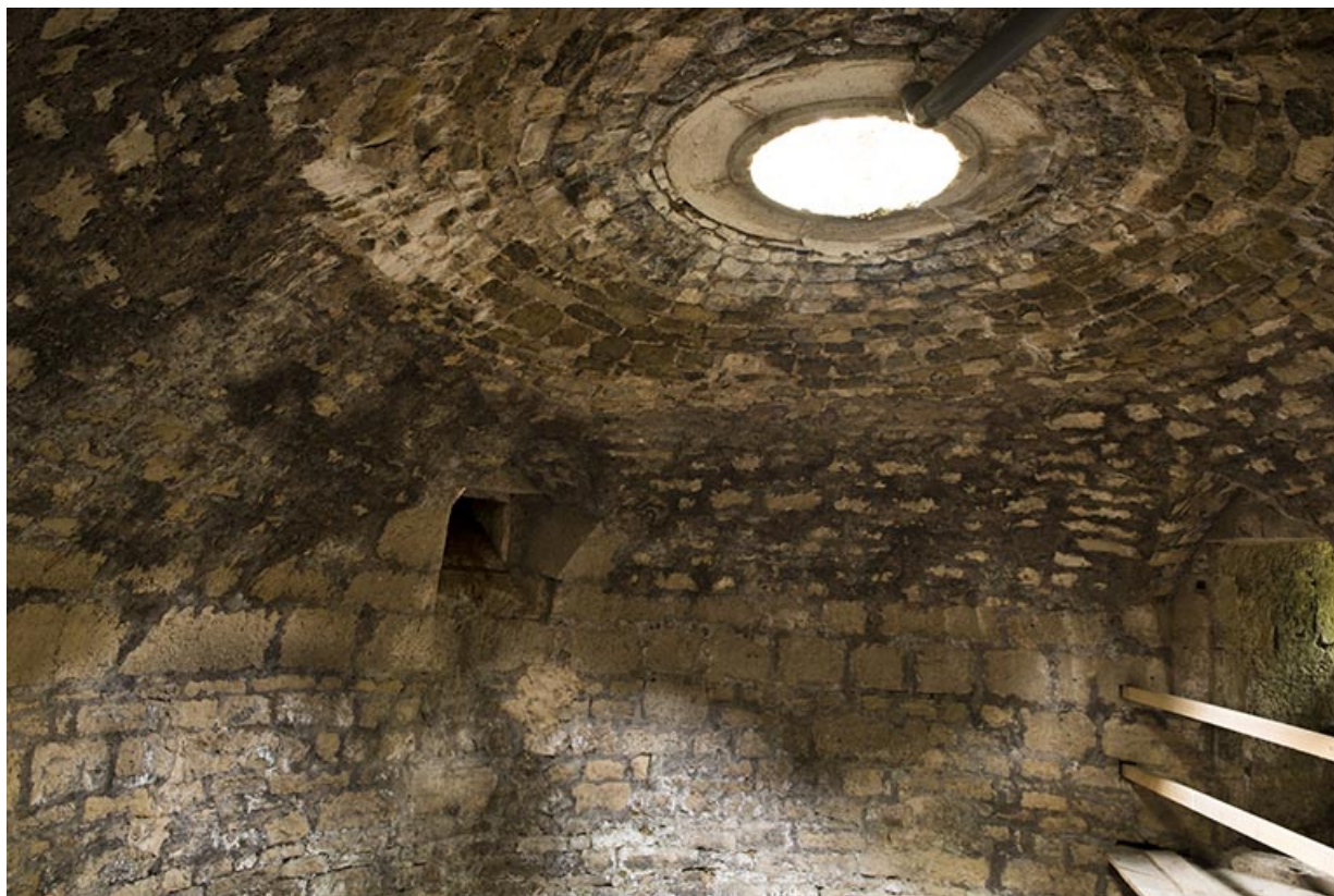
Dans la tour ouest. Vue rapprochée de la partie sommitale depuis l'intérieur. 70, Demangevelle