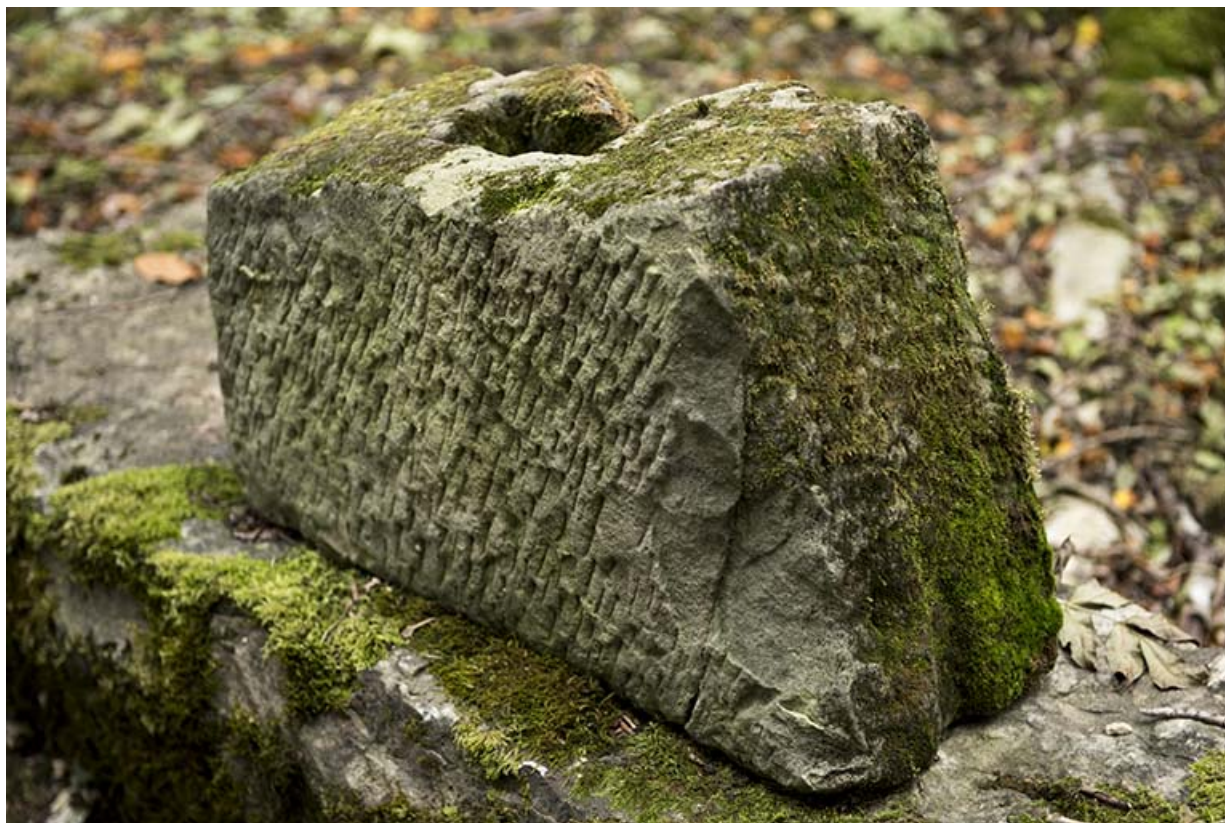
Vestiges lithiques en périphérie de la tour ouest. (élément de pont levis? ) 70, Demangevelle