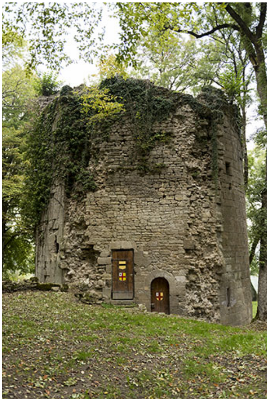
La tour ouest, vue rapprochée de l'est.