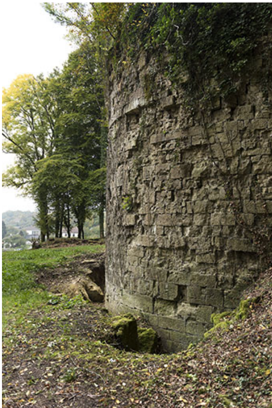
Autour de la tour est.