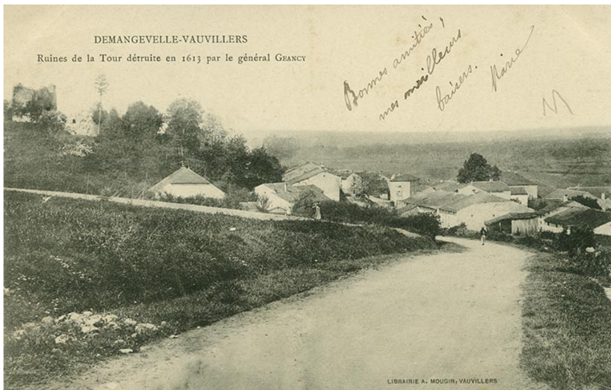
"Demangevelle- Vauvillers. Ruines de la tour détruite en 1613 par le général Geancy". Carte postale. 70, Demangevelle