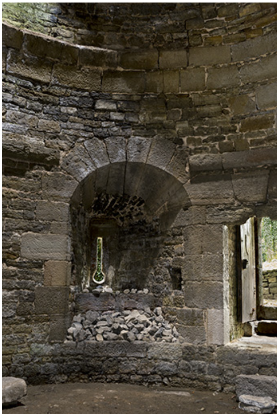
Dans la tour ouest : meurtrière, archère canonnière. 70, Demangevelle