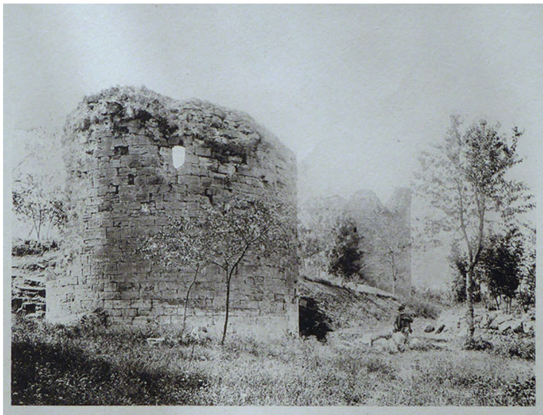
les ruines de Demangevelle. Août 1890.