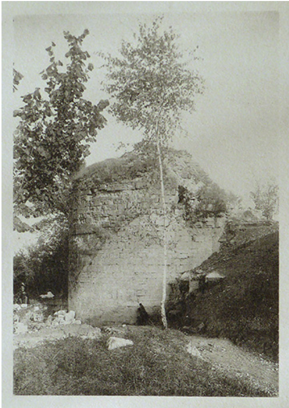
Photographie de Vedastus : les ruines de Demangevelle. Août 1890. 70, Demangevelle