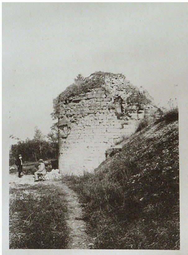
Photographie de Vedastus : les ruines de Demangevelle. Août 1890. 70, Demangevelle