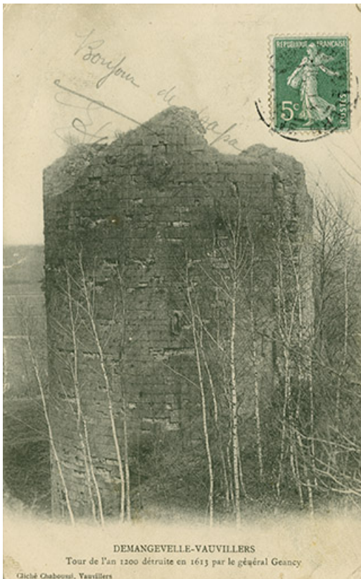
Demangevelle. Tour. Carte postale.