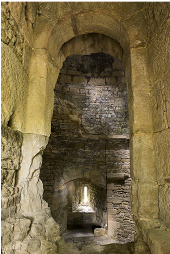
La tour ouest. Vue intérieure depuis l'entrée.