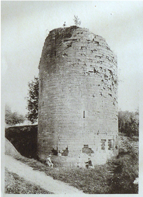
les ruines de Demangevelle. Août 1890. 70, Demangevelle