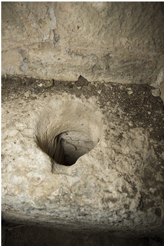
Dans la tour ouest. Détail de latrines.