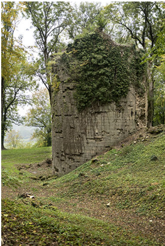
La tour ouest : vue rapprochée du sud.