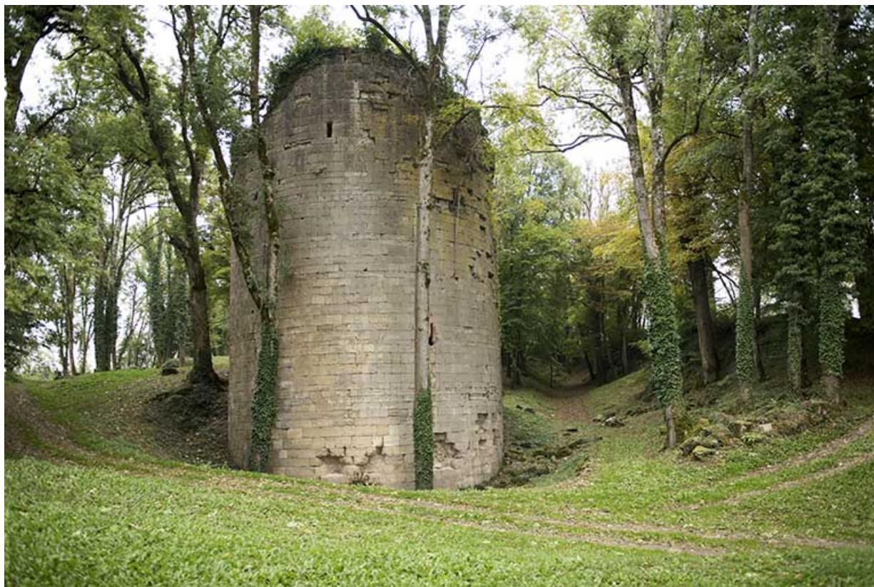
La tour ouest, vue de l'ouest.