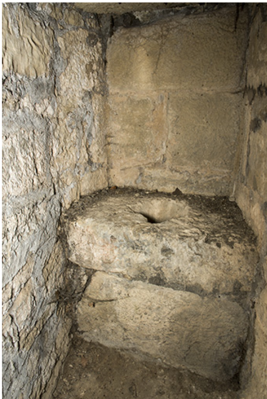
Dans la tour ouest. Latrines.