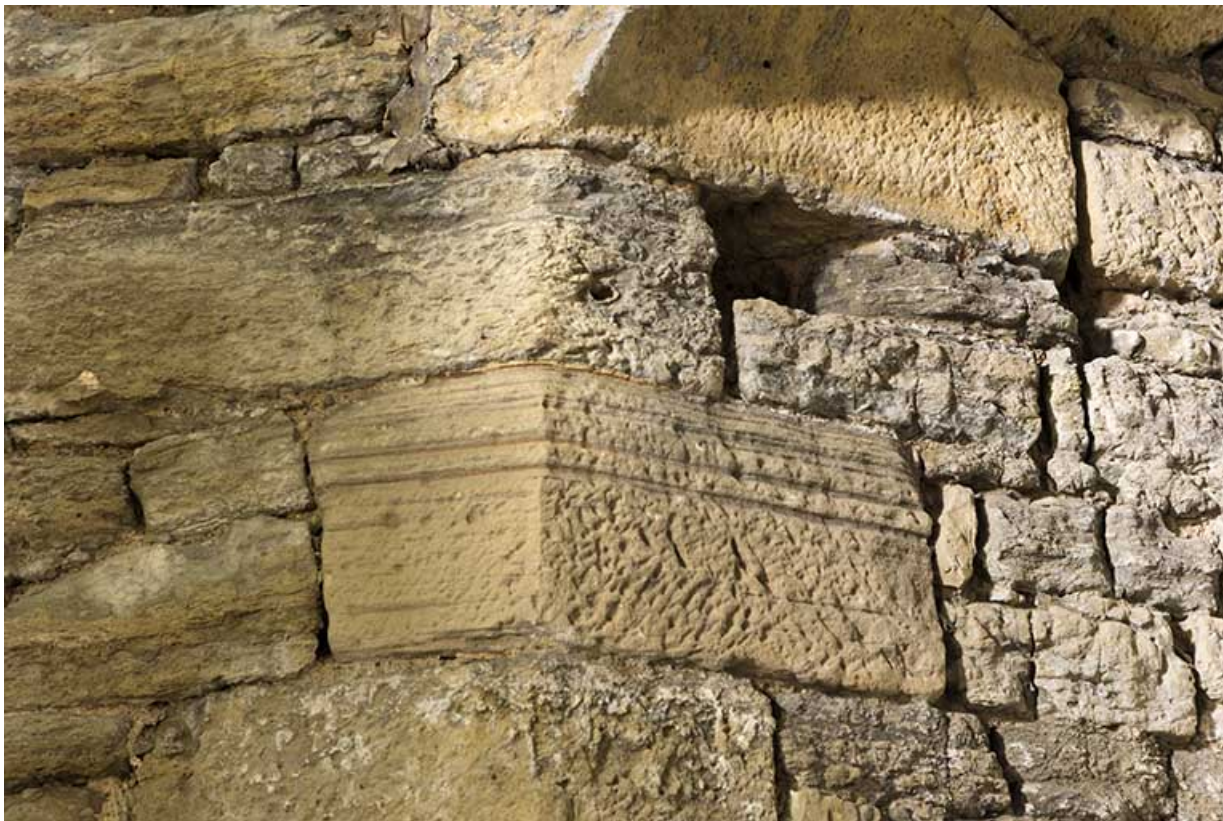
Détail de maçonnerie.