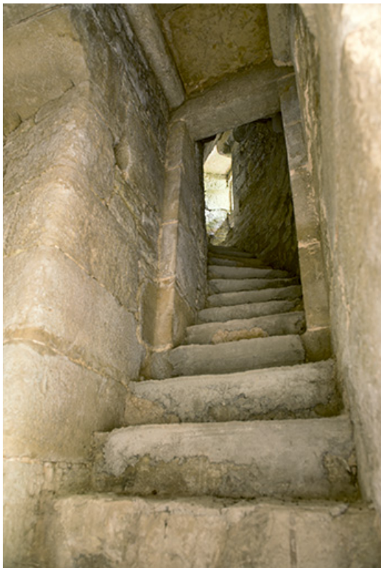
La tour ouest. Vue intérieure de l'escalier.