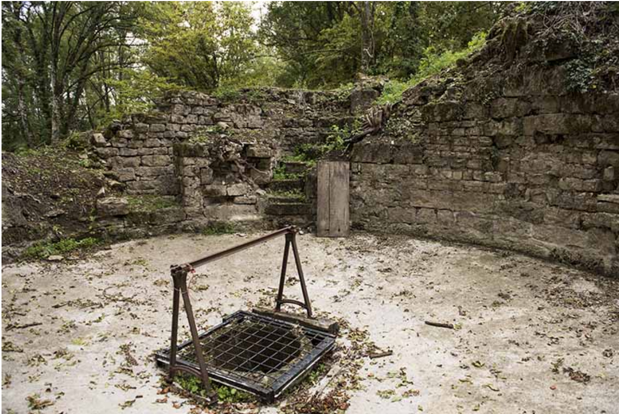
Dans la tour ouest. Vue de la partie sommitale depuis le haut. 70, Demangevelle