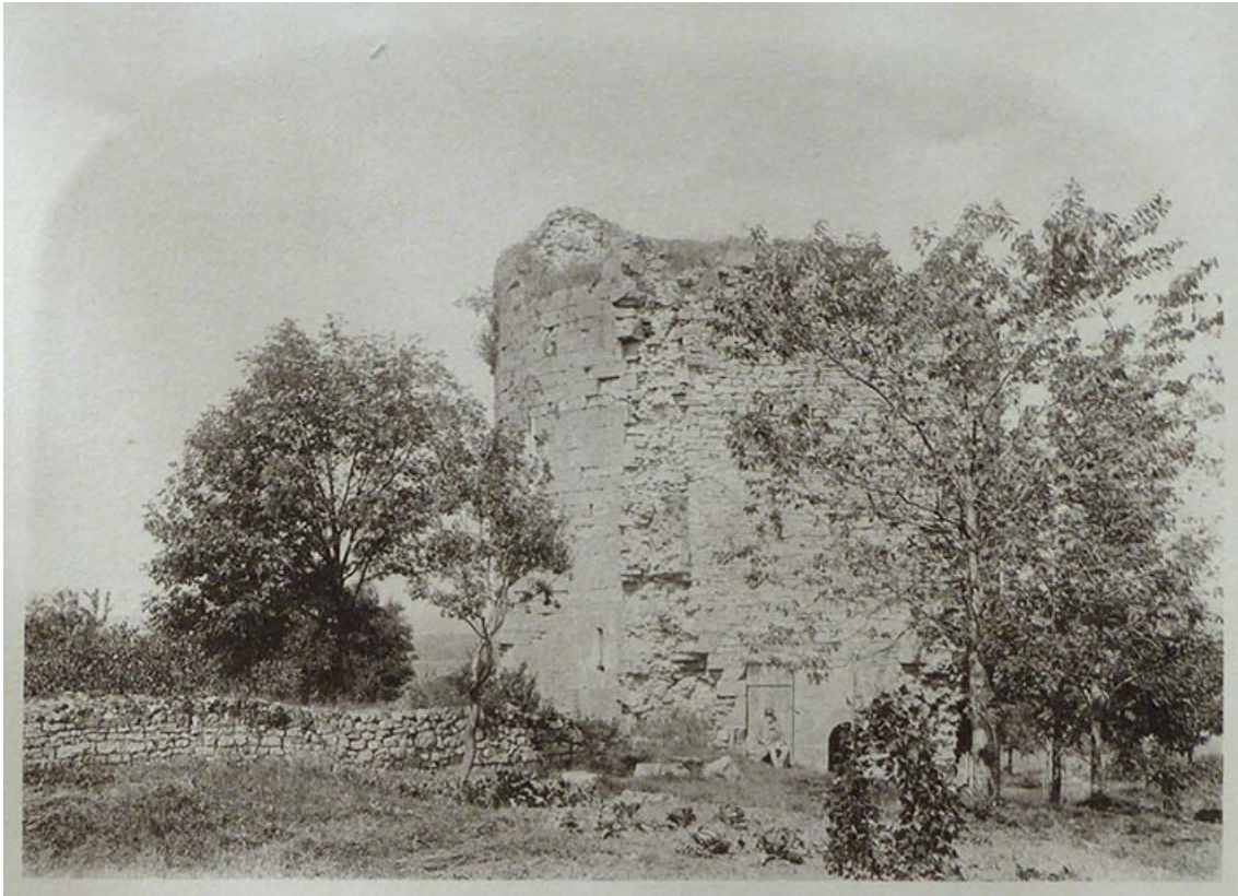
les ruines de Demangevelle. Août 1890.