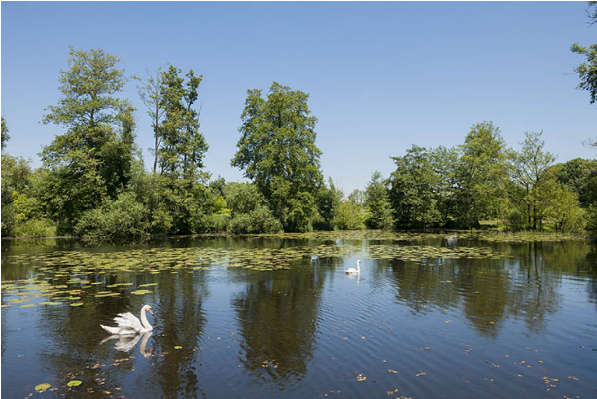
L'étang de Velotte. 70, Chaux-lès-Port