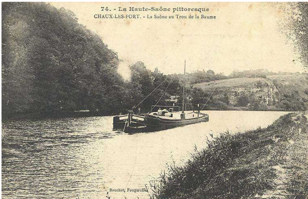
Chaux-lès-Ports - La Saône au Trou de la Baume, carte postale.