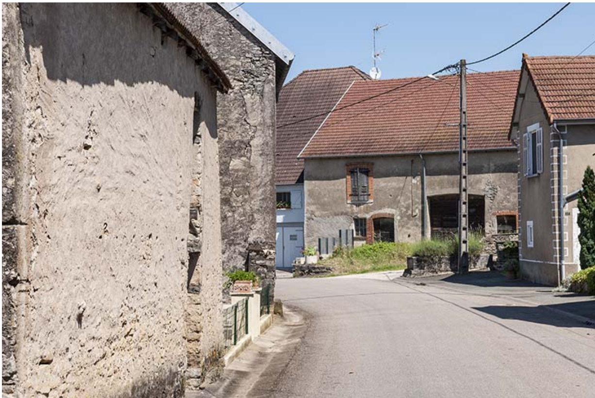
Rue Jean Emile Lotscher.