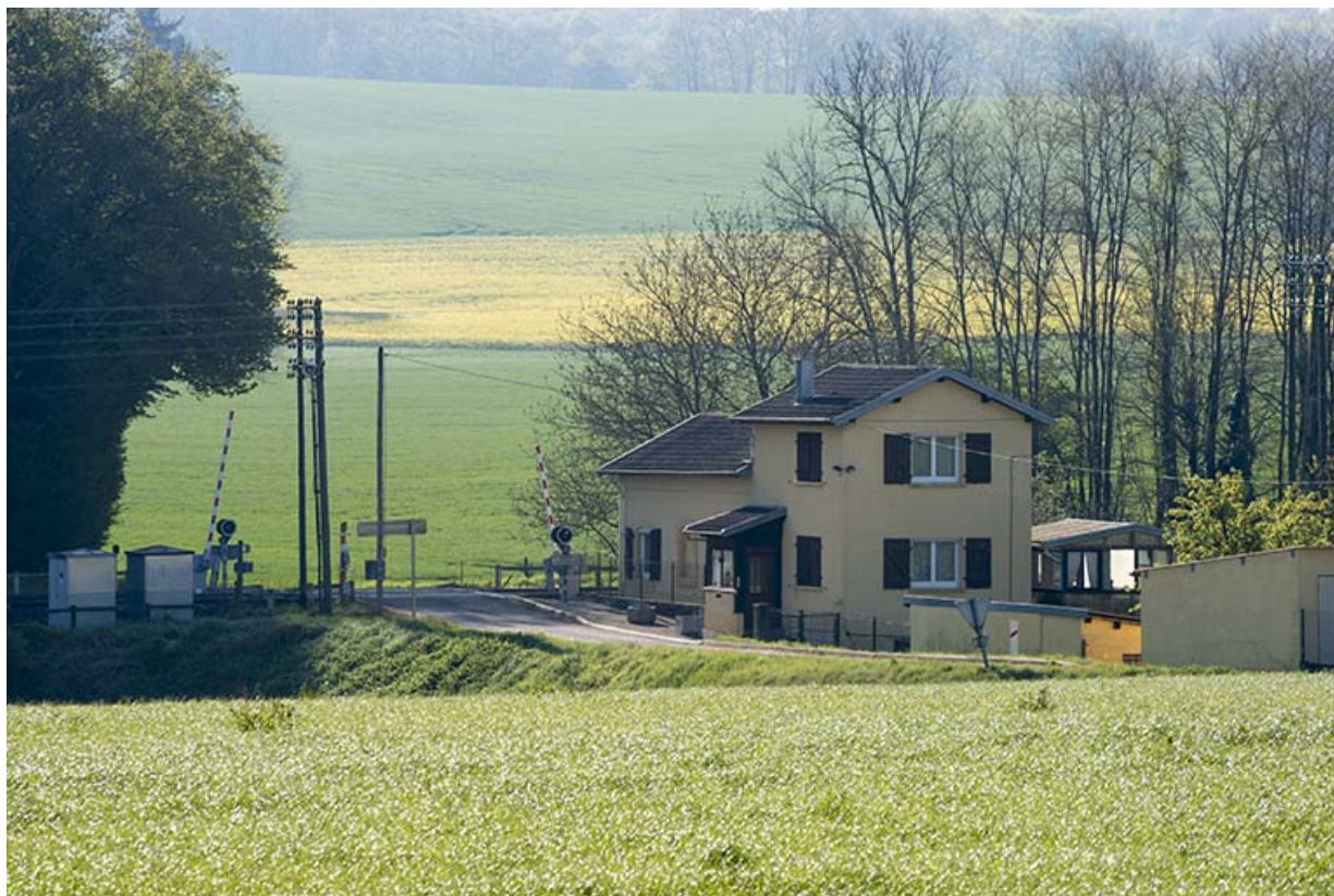
La maison du garde-barrière, vue générale.