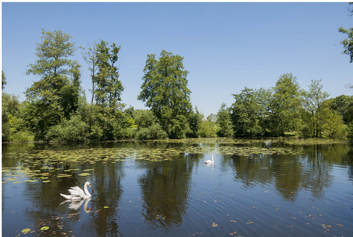
L'étang de Velotte.