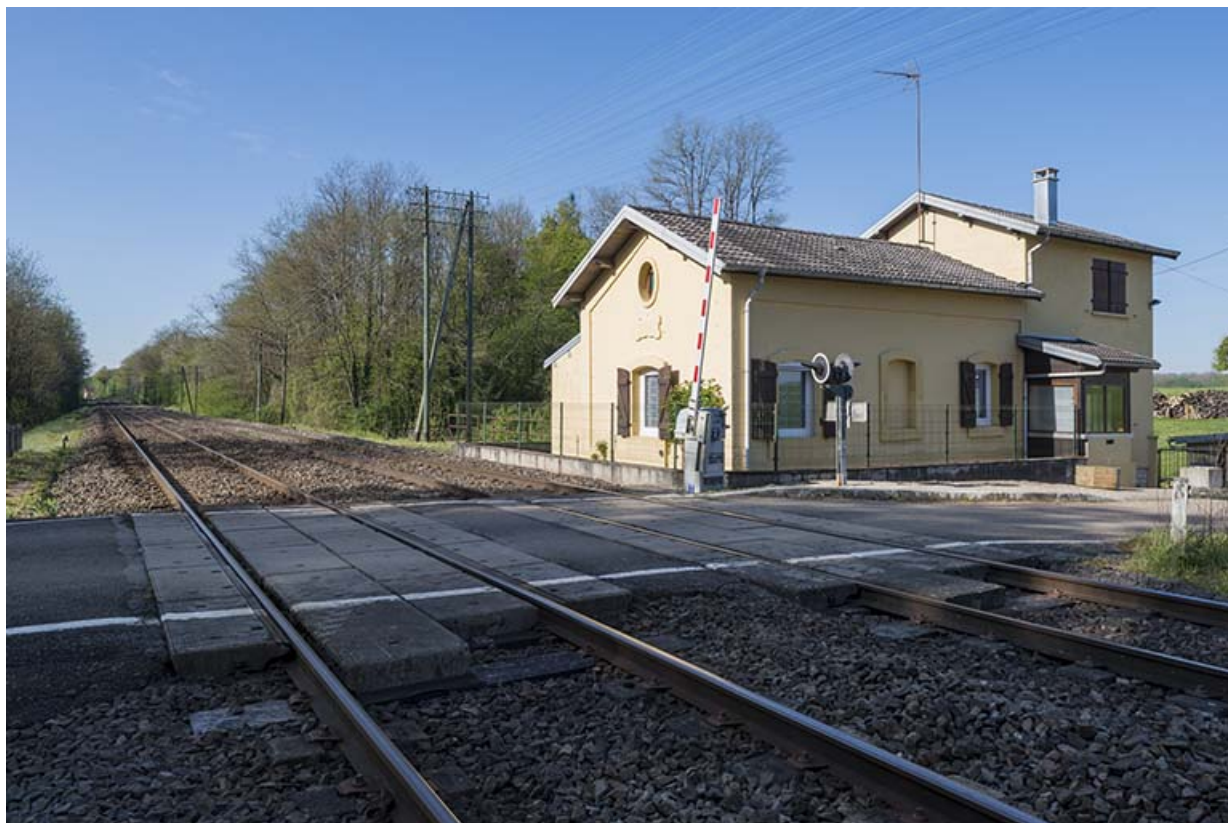
Vue depuis le Nord.