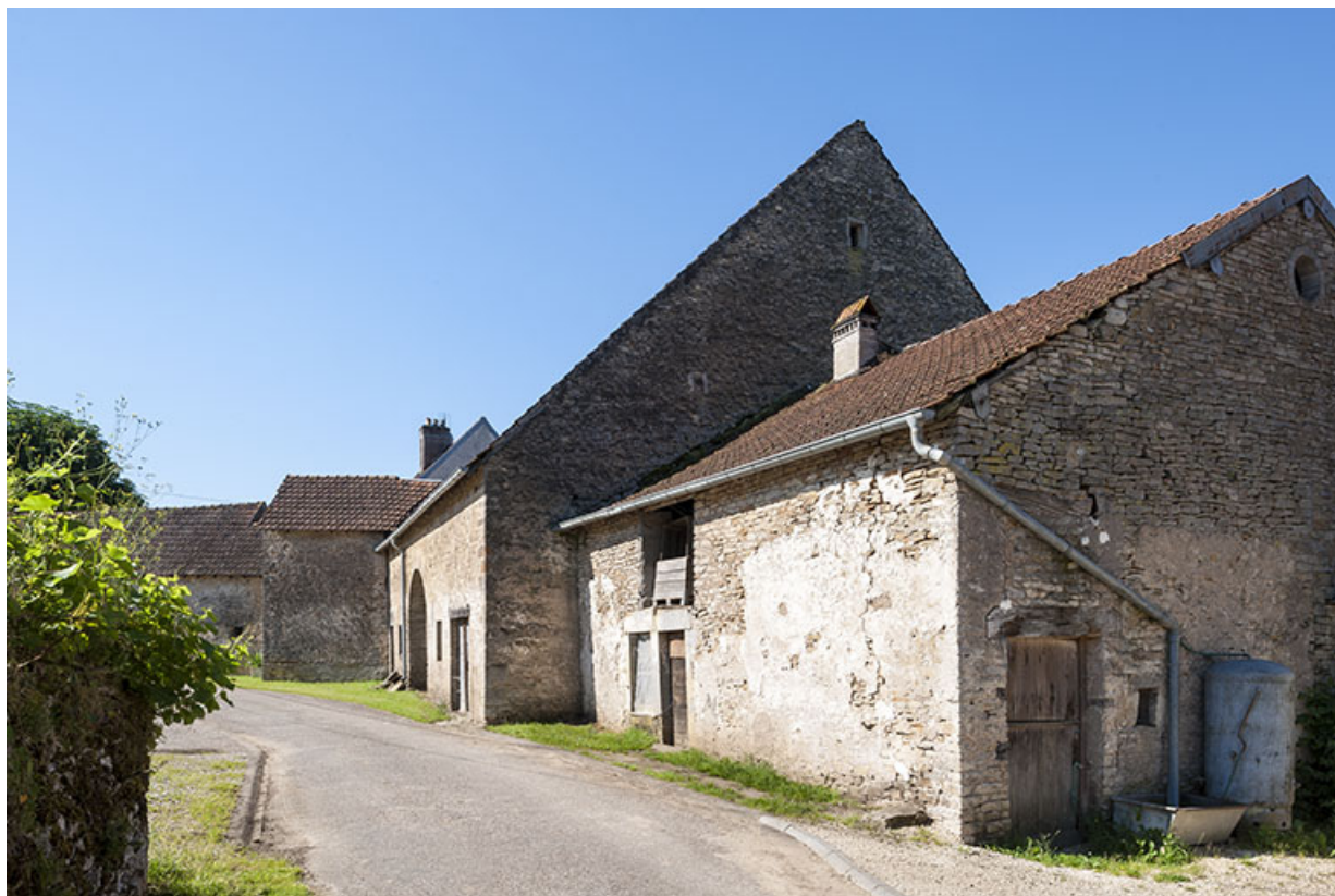
Chemin de la Saône.