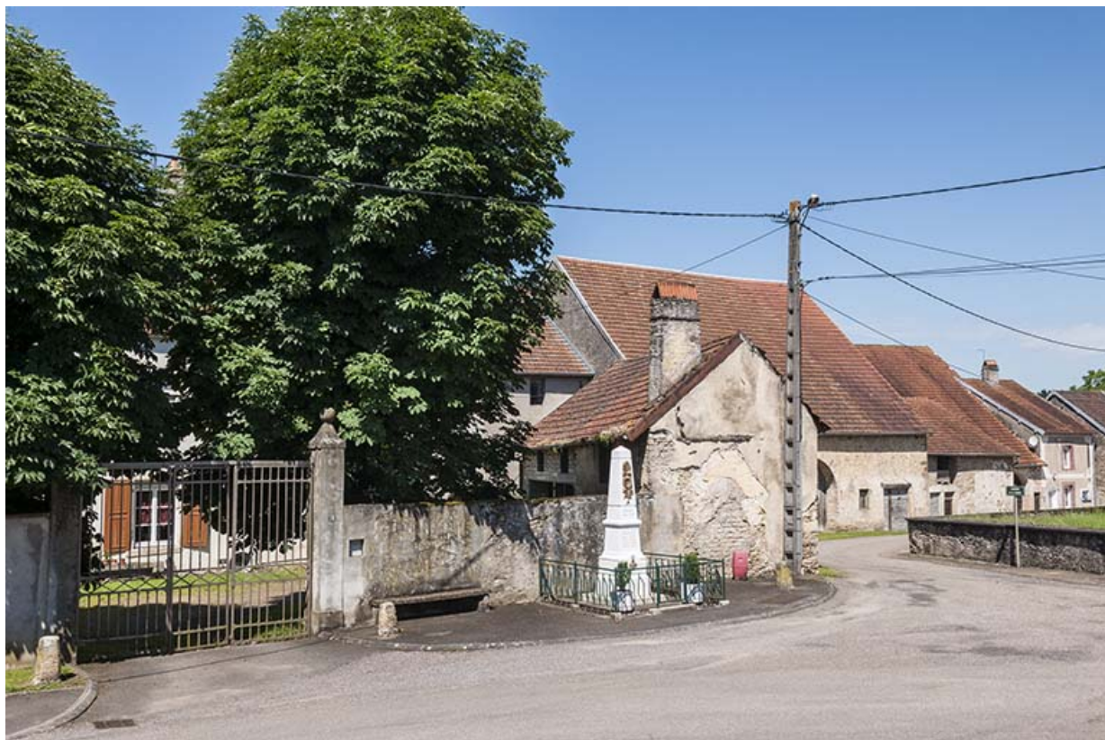
Centre du village.