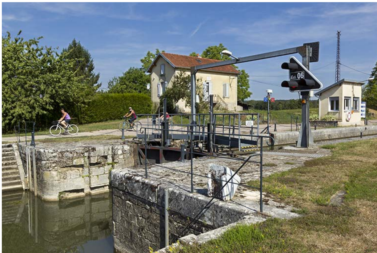
Depuis la rive gauche en aval (sud-est), vue du site d'écluse.