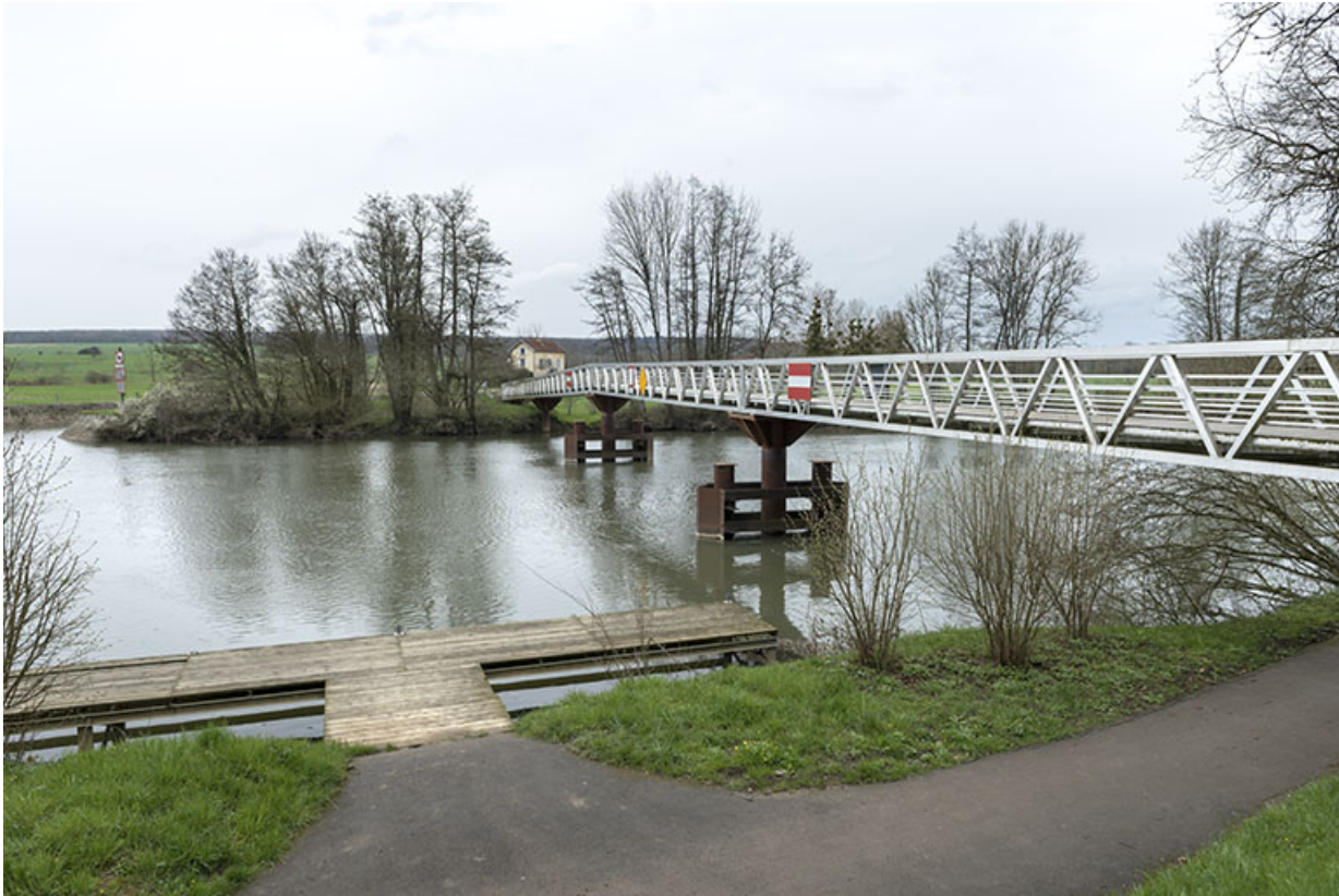
Passerelle enjambant la Saône.