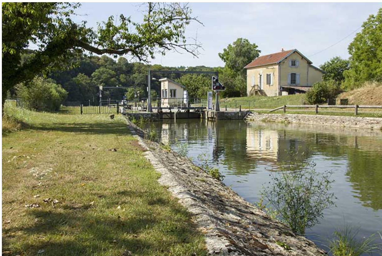
Depuis la rive gauche en amont, vue sur le site d'écluse.