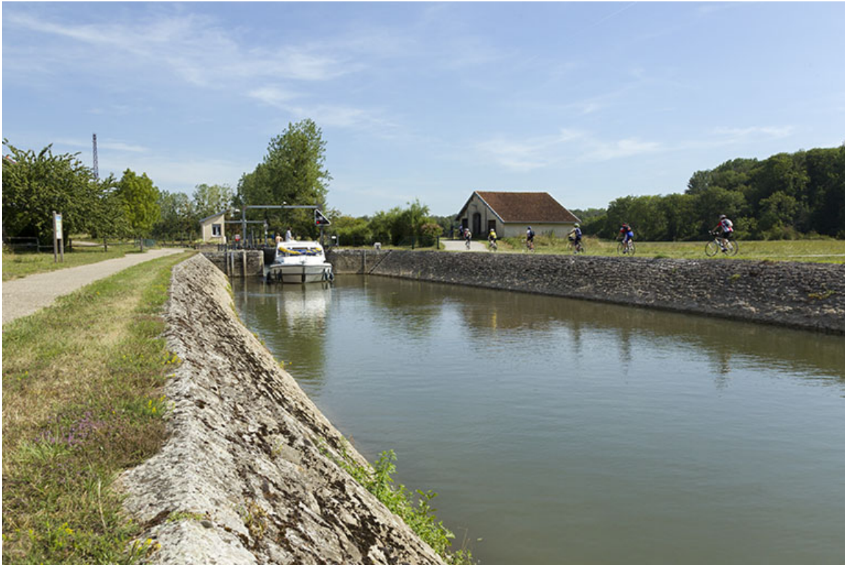
Depuis la rive droite en aval, vue sur le site d'écluse.