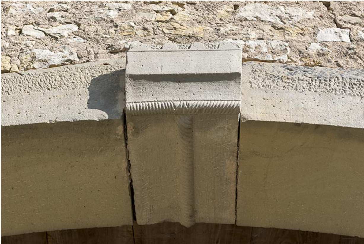
Alignement en bas du village, au nord de la fontaine. Élément de sculpture sur la clé de voute de la porte de grange. 70, Demangevelle