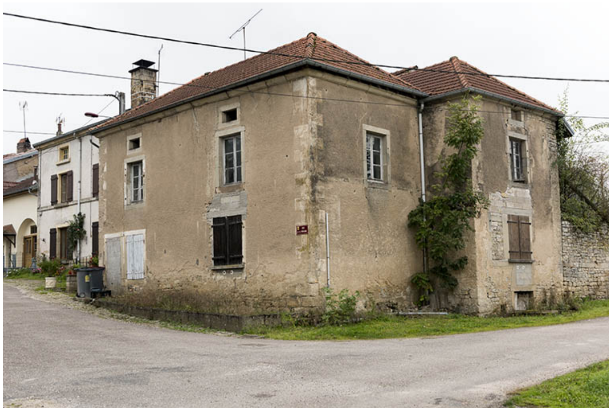
Maison à l'angle de la rue vieille et de la rue de la fontaine.