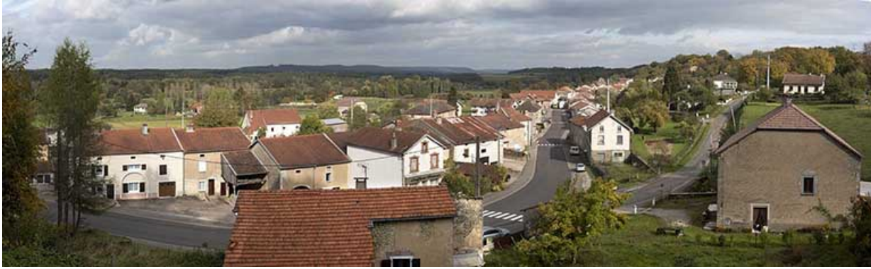
Vue d'ensemble du village depuis l'ouest.