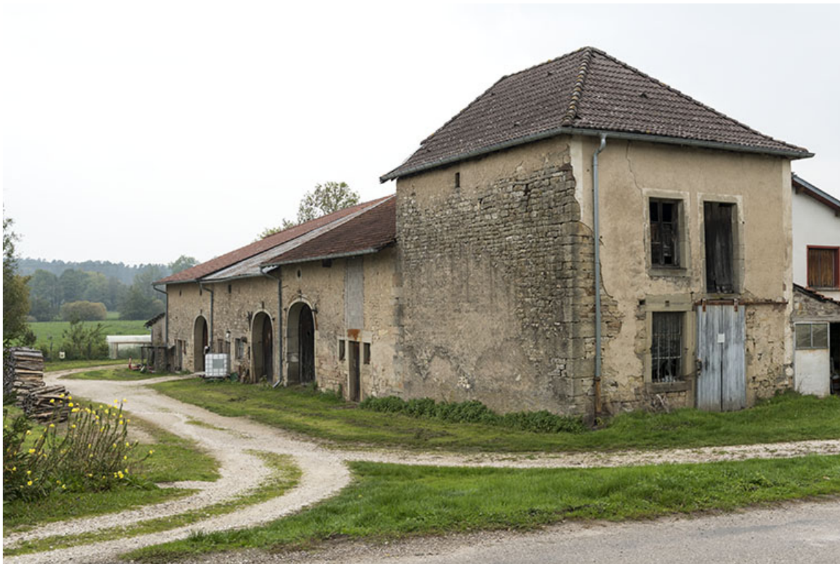
Alignement en bas du village, au nord de la fontaine.