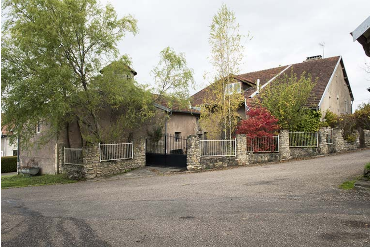
Maison avec tour d'escalier entre la rue de la poste et grande rue. Vue d'ensemble du sud-ouest. 70, Demangevelle