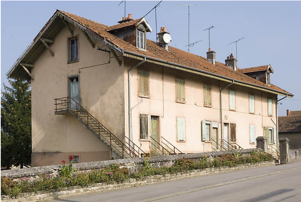
Maison ouvrière N au centre du village (24 Grande Rue).

70, Demangeville, 1 rue de la Gare, lieudit : Bois de la Fourmi