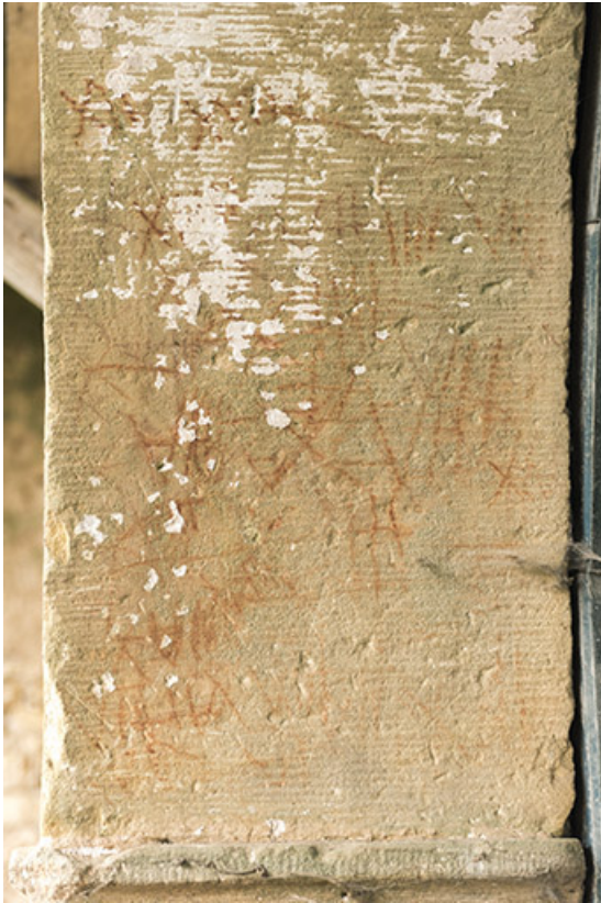
Détail d'une pierre de la porte de grange.