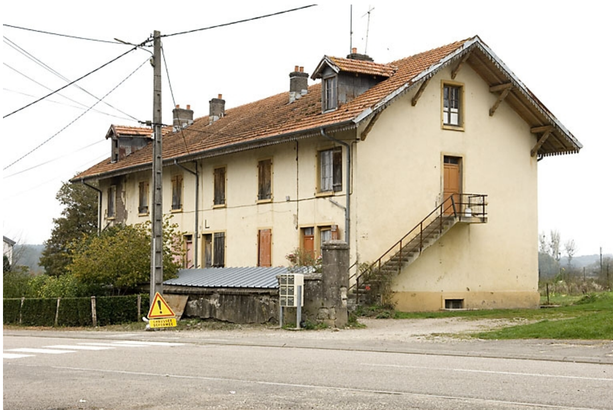
Maison ouvrière L au centre du village (4 rue du Coney).

70, Demangevelle, 1 rue de la Gare, lieudit : Bois de la Fourmi