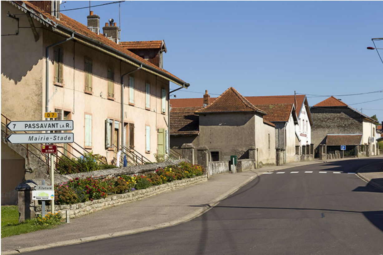
Vue rapprochée de la grande rue, au milieu du village, au carrefour avec la route de Passavant, en direction de Vauvillers. 70, Demangevelle