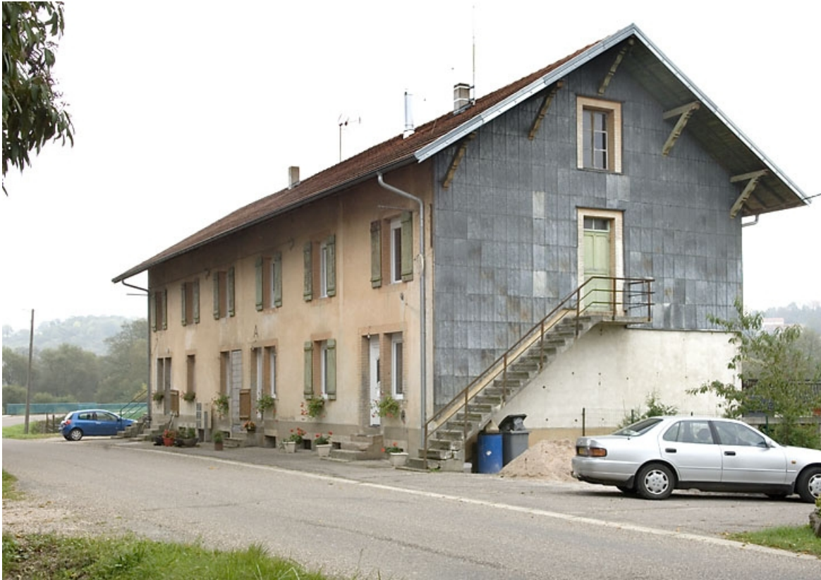
Maison ouvrière A de la cité ouvrière (rue du Coney).

70, Demangevelle, 1 rue de la Gare, lieudit : Bois de la Fourmi