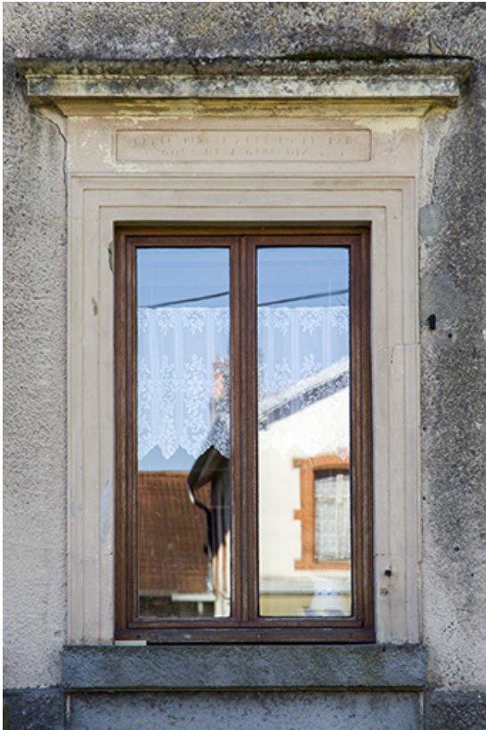
Détail de la baie de l'étage et de l'inscription 2, rue Saint isidore (cette pierre a été posée par Goux et Girardin (?) 1831 (?) 70, Demangevelle