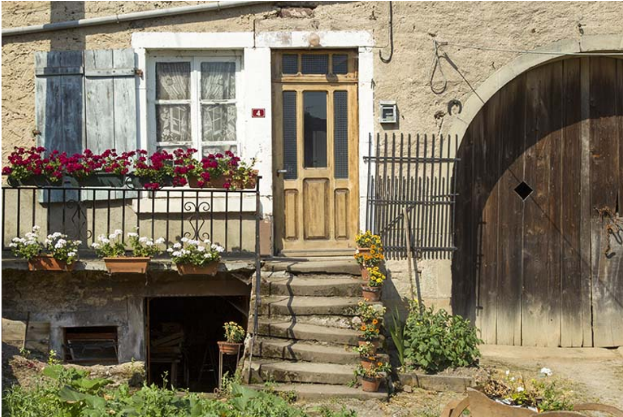
Vue de la façade antérieure de la ferme, 4 rue du Marchemont. 70, Demangevelle