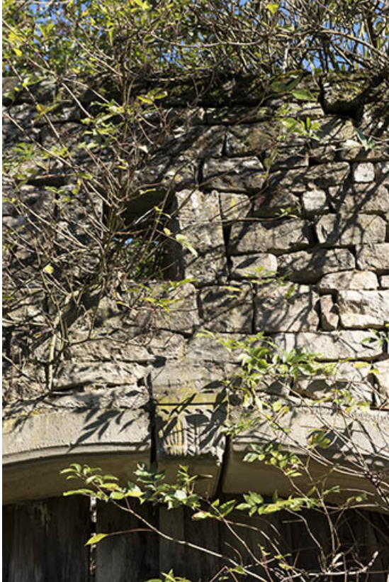
Date portée 1820 sur la porte de grange d'une maison ruinée, 4 rue de l'adjoint. 70, Demangevelle