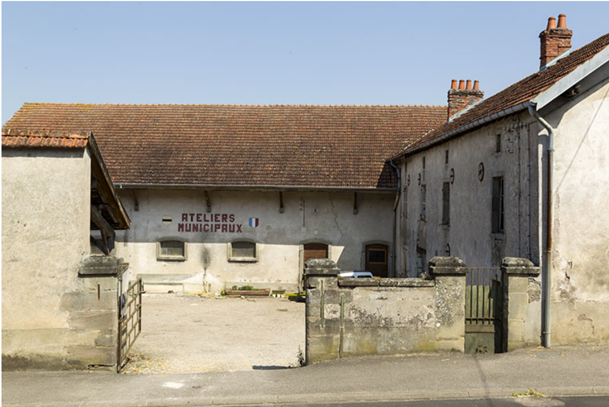
20 grande rue : les ateliers municipaux sont installés dans une ancienne ferme des filatures. 70, Demangevelle