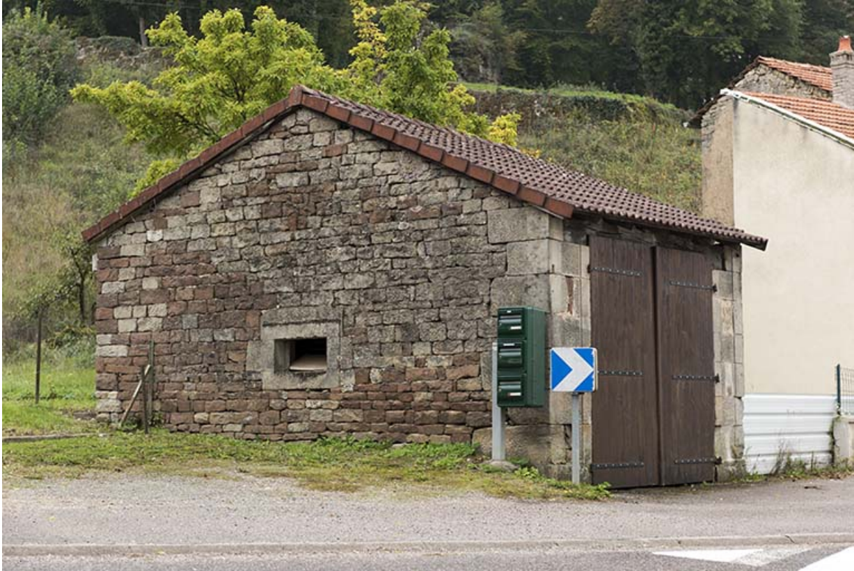
Edicule jouxtant la maison 2, rue St Isidore. 70, Demangevelle