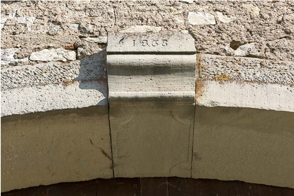
Alignement en bas du village, au nord de la fontaine. Détail de clé de voute de la porte de grange avec la date 1838. 70, Demangevelle