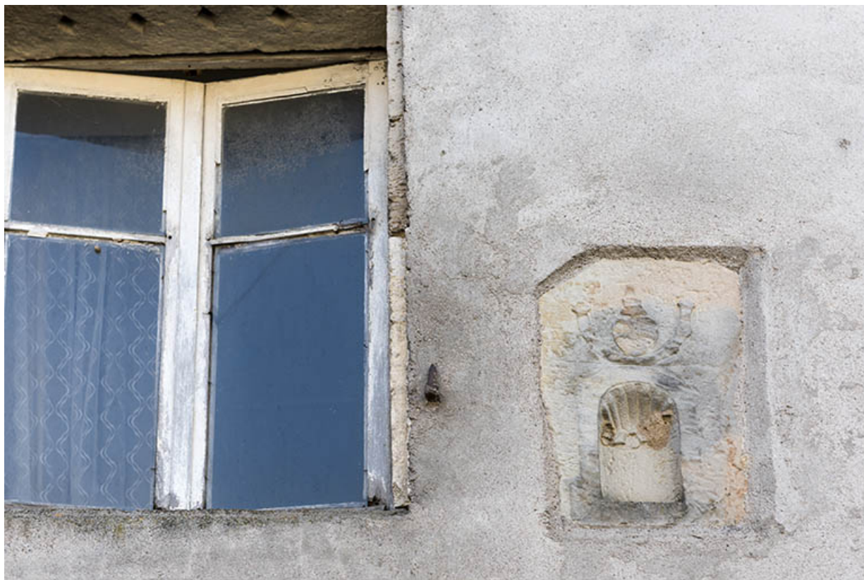
Détail de sculpture et linteau remployé, 3 rue de l'adjoint. 70, Demangevelle