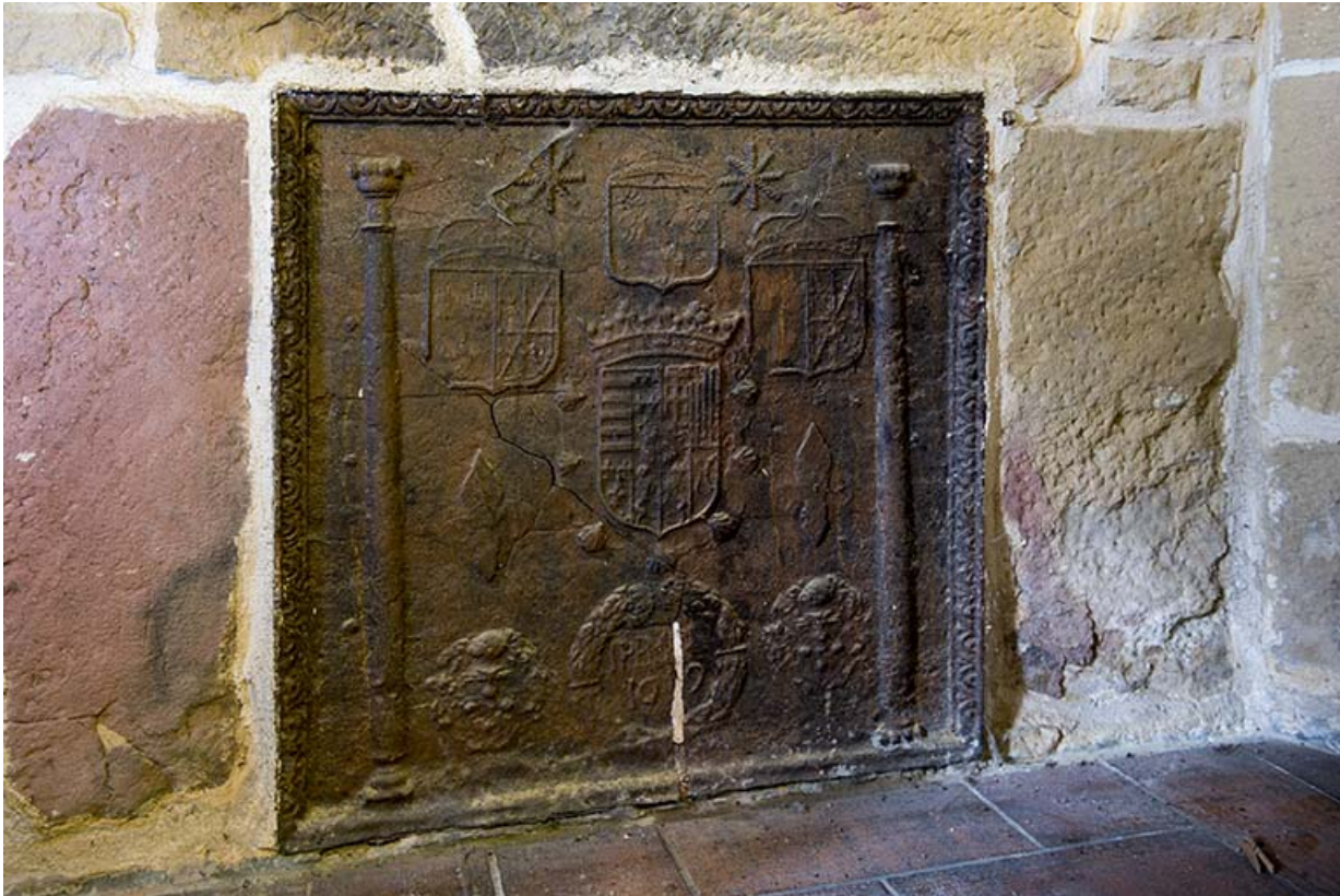
Plaque de cheminée dans la seconde ferme.

70, Aisey-et-Richecourt, 1 rue de l' Église