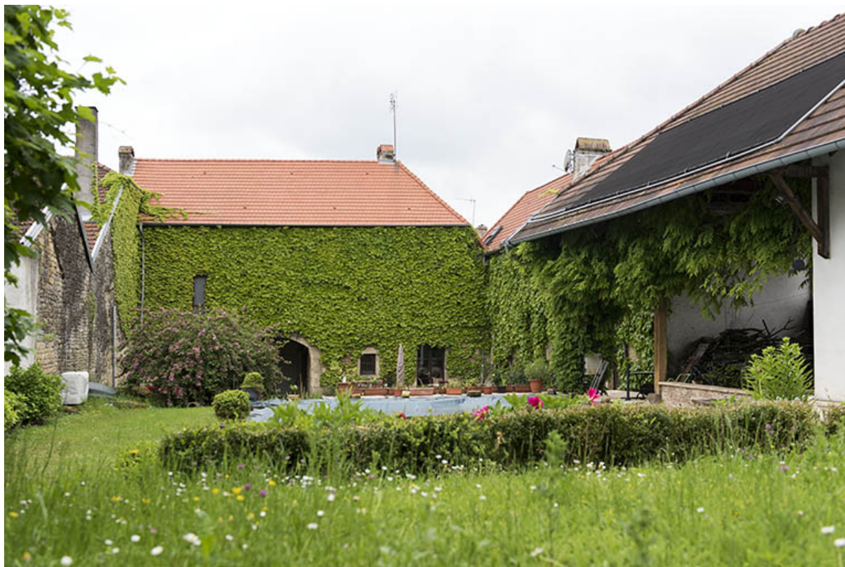
Vue générale de la cour intérieure.

70, Aisey-et-Richecourt, 1 rue de l' Église