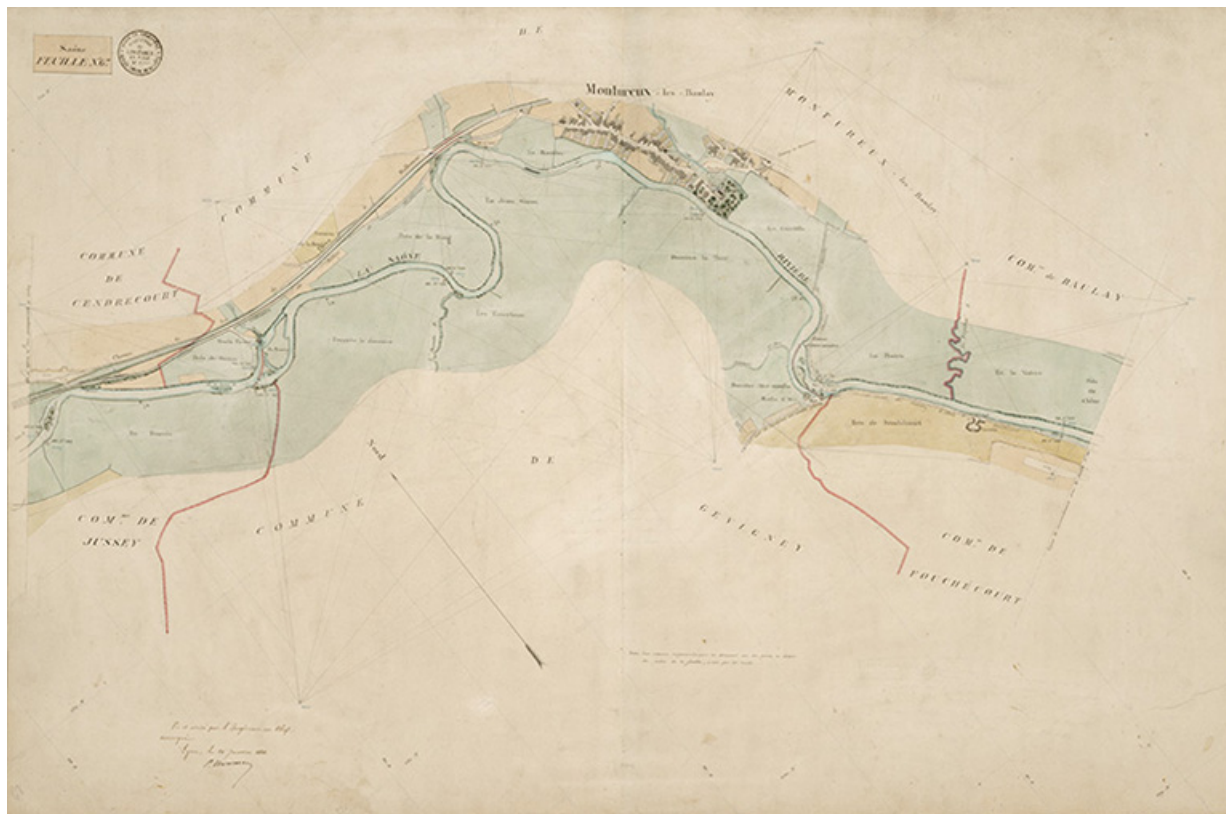
Saône - feuille n°67.