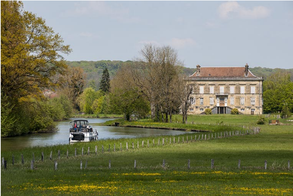
Le château, longé par la Saône.