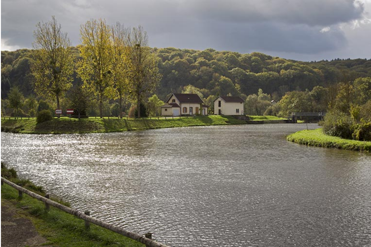
Entrée du canal de navigation et le site du barrage mobile.