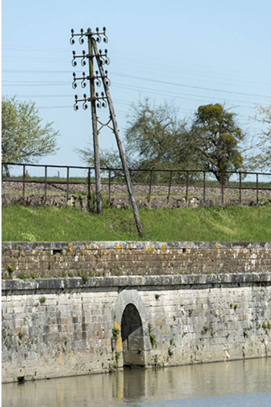
Détail de la digue.