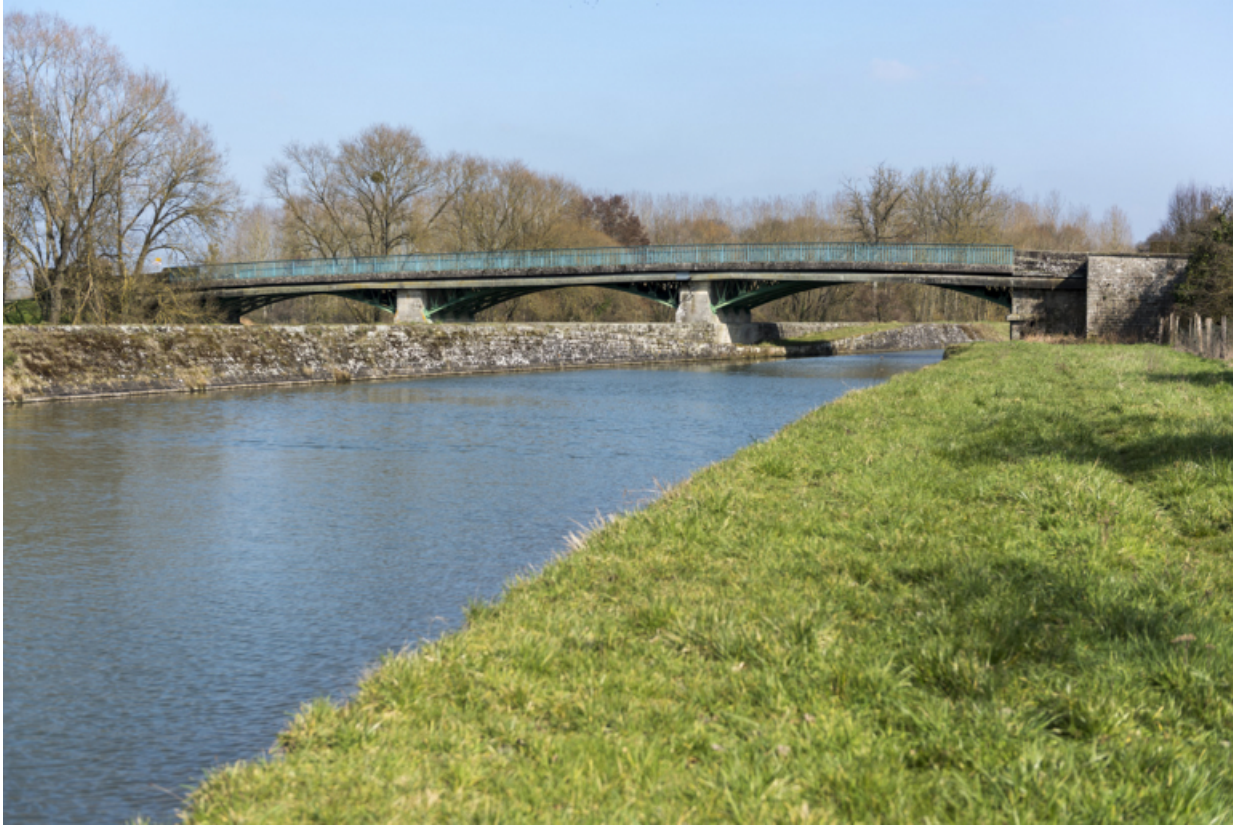
Vue depuis l'aval